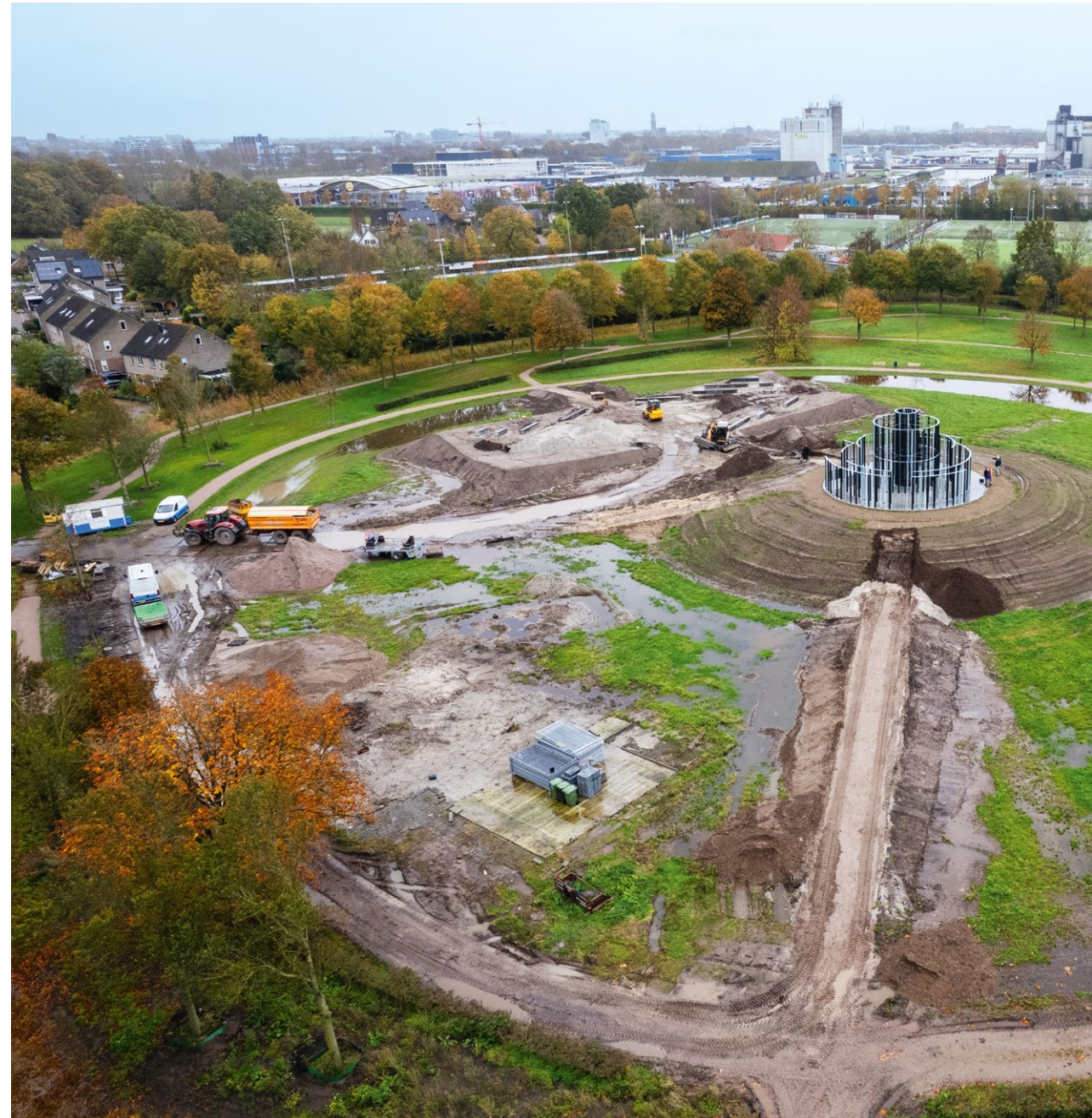
In Zwolle zijn de resten van het middeleeuwse kasteel Voorst als archeologisch rijksmonument beschermd. Op initiatief van wijkbewoners en in samenwerking met de gemeente en RCE is de geschiedenis zichtbaar gemaakt door een kunstwerk aan te brengen.

Een ander belangrijk onderdeel van onze werkzaamheden is het verstrekken van subsidies aan eigenaren van erfgoed. Deze subsidies zijn gericht op instandhouding, herbestemming en verduurzaming, en hebben tot doel om monumenten een duurzame toekomst te bieden. Op deze manier dragen we bij aan het behoud van ons waardevolle cultureel erfgoed en zorgen we ervoor dat het erfgoed ook voor toekomstige generaties bewaard blijft.