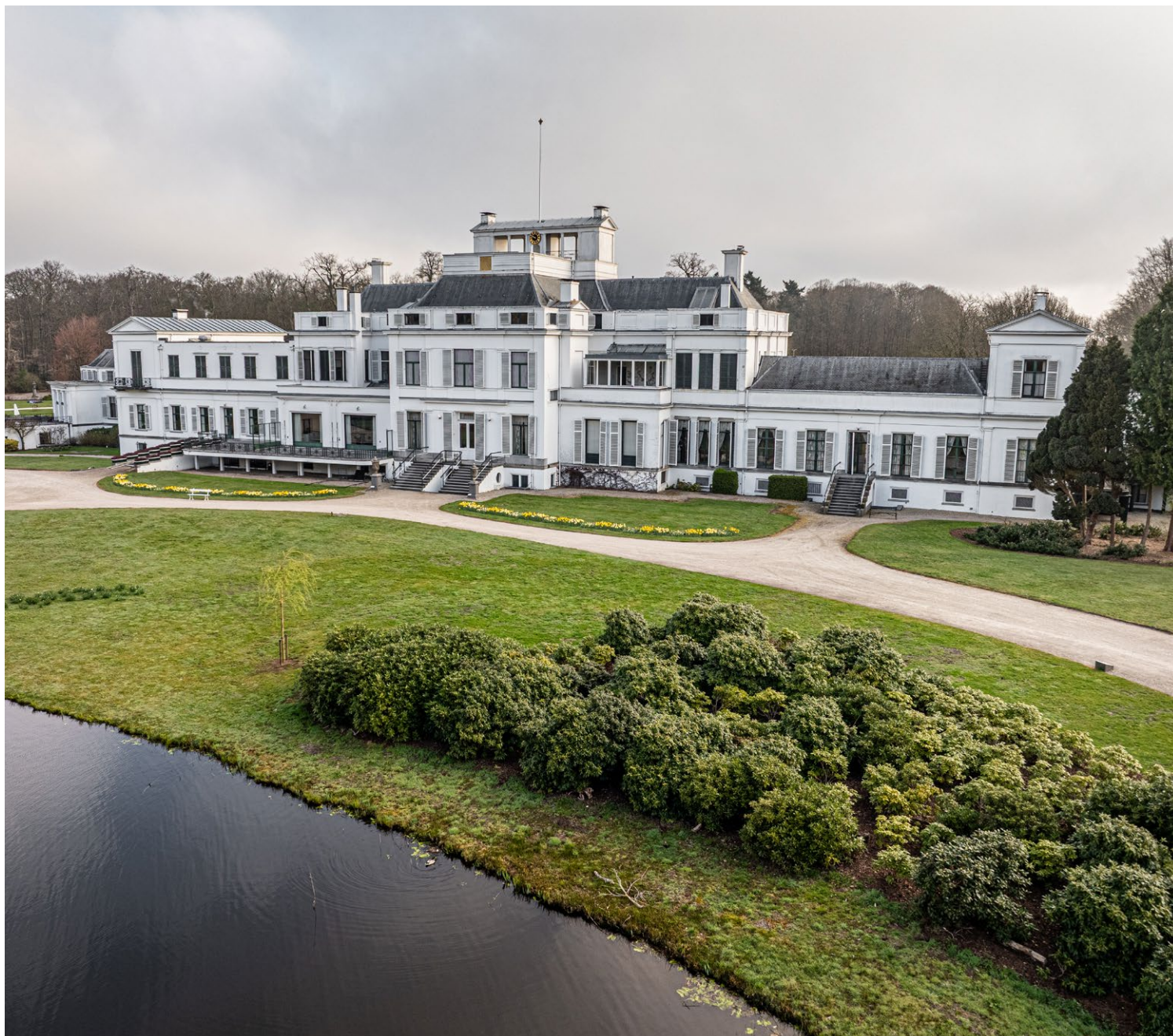
De eigenaar van Paleis Soestdijk zoekt een nieuwe bestemming voor het markante rijksmonument. Hierover worden gesprekken gevoerd met de RCE en de gemeente Baarn.

Door deze tekorten neemt de kwaliteit van de erfgoedzorg af. Kennis en professionaliteit binnen de sector staan onder druk, mede merkbaar doordat uit capaciteitsgebrek steeds vaker vrijwilligers >>