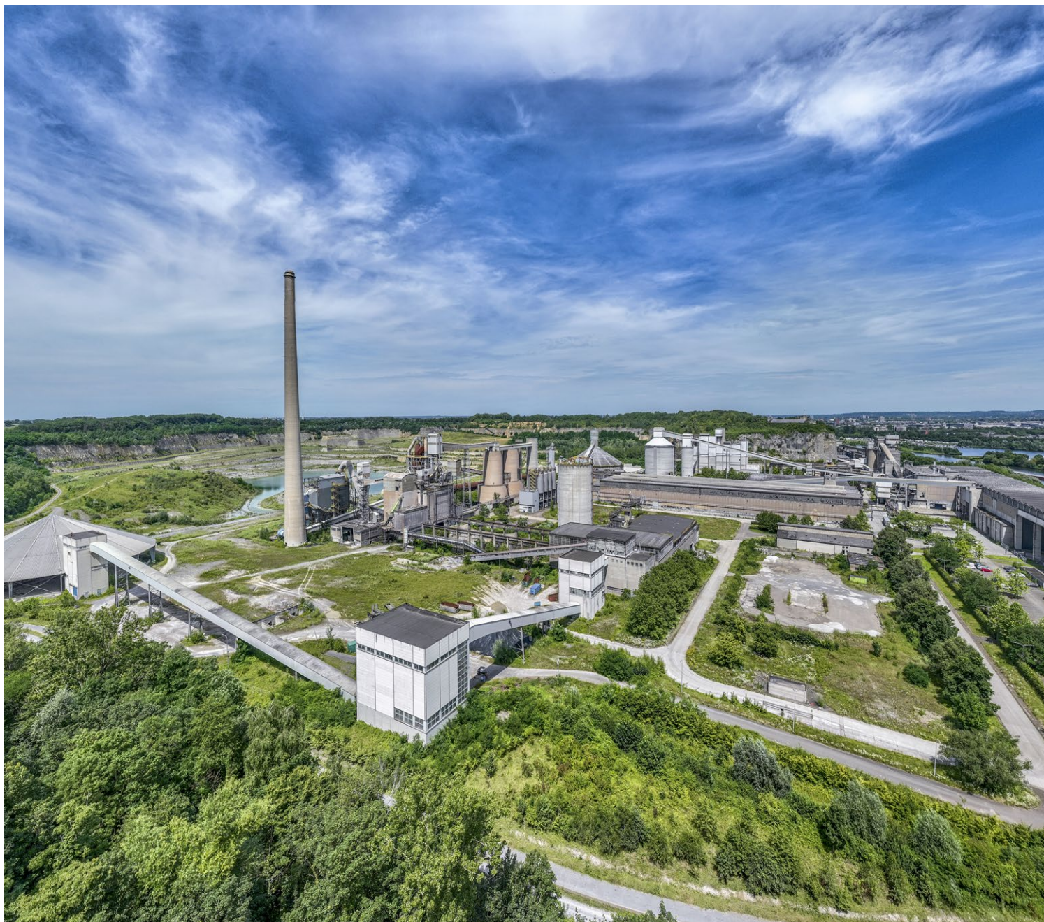
Op het terrein van de voormalige cementfabriek ENCI bevinden zich vijf rijksmonumenten. De mergelgroeve in Maastricht vormt samen met de bedrijfsgebouwen en installaties een landschap dat bijzonder is voor Nederland.