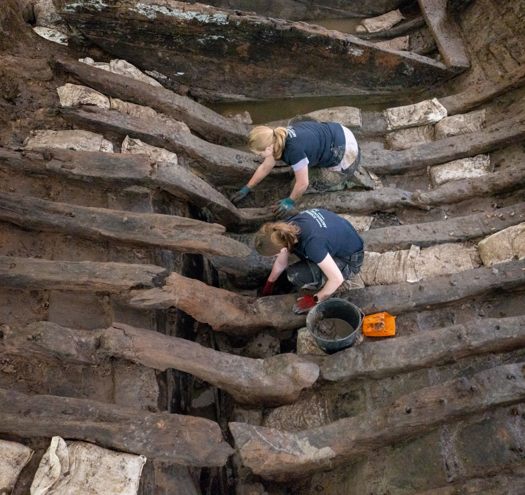
Foto cover: De veertiende-eeuwse Jacobuskerk te Zeerijp ligt midden in het aardbevingsgebied in Groningen. Met alle betrokken adviseurs worden de te nemen versterkingsmaatregelen ter plaatse doorgenomen. (Foto RCE, Jarno Pors)

Foto achter: Elk jaar organiseert de Rijksdienst voor het Cultureel Erfgoed in samenwerking met Batavialand de Veldschool Scheepsarcheologie Flevoland. Studenten van verschillende scholen en universiteiten doen onderzoek naar een scheepswrak. (Foto RCE, Jarno Pors)