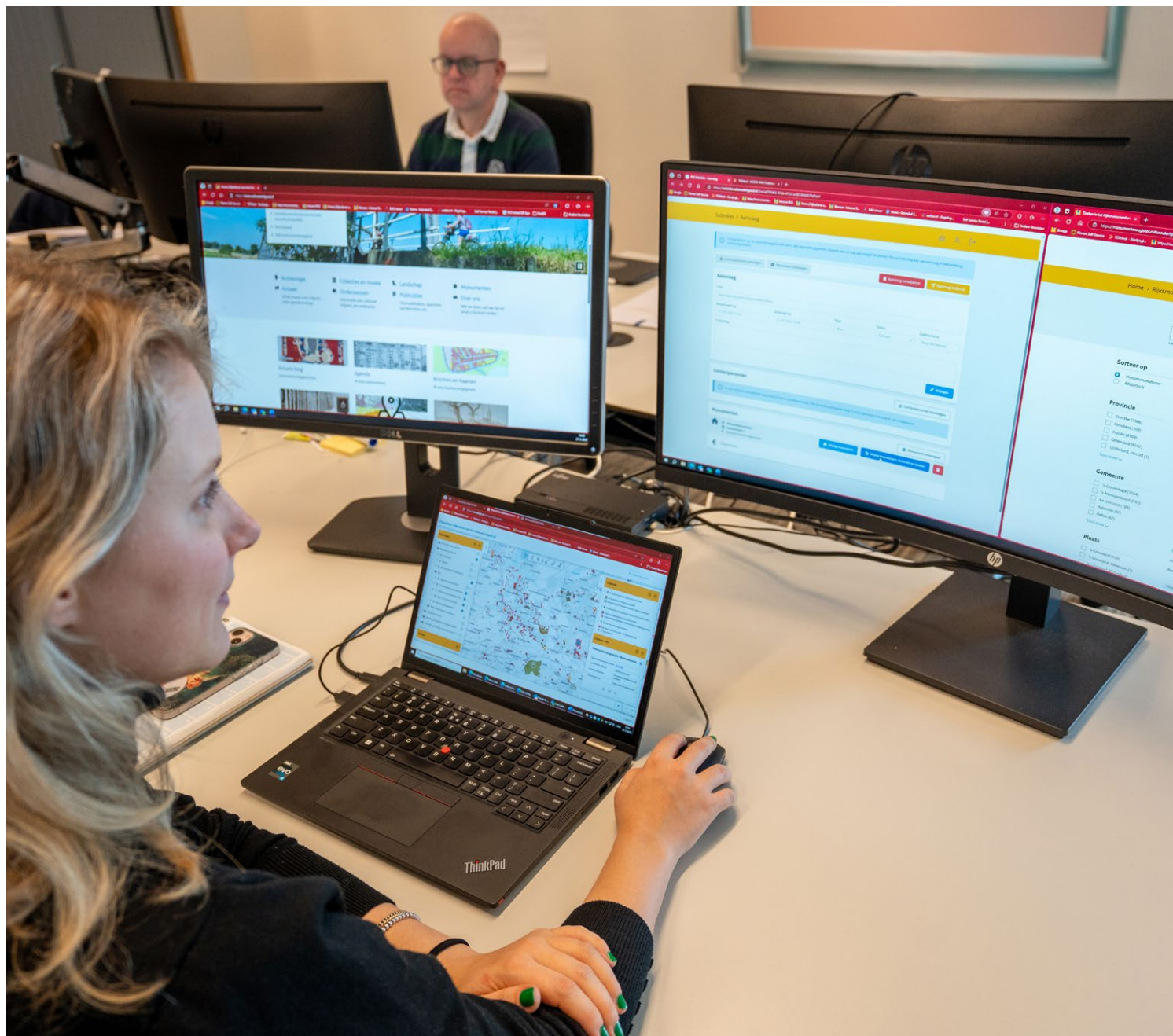
Een medewerker van de InfoDesk helpt een monumenteneigenaar bij het online aanvragen van subsidie. De RCE is op werkdagen per telefoon en mail bereikbaar voor iedereen met vragen over cultureel erfgoed.

De digitale vragen en eisen vanuit de samenleving nemen toe, maar erfgoedpartners en de RCE hebben niet genoeg capaciteit en middelen om aan deze vraag te voldoen en de noodzakelijke nodige ontwikkelstappen te zetten. De eisen rond vindbaarheid, toegankelijk- >>