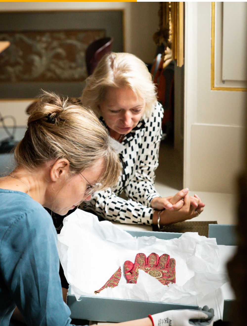
Onderzoekers van het Rijkserfgoedlaboratorium verrichten materiaal-technisch onderzoek, ook op locatie.