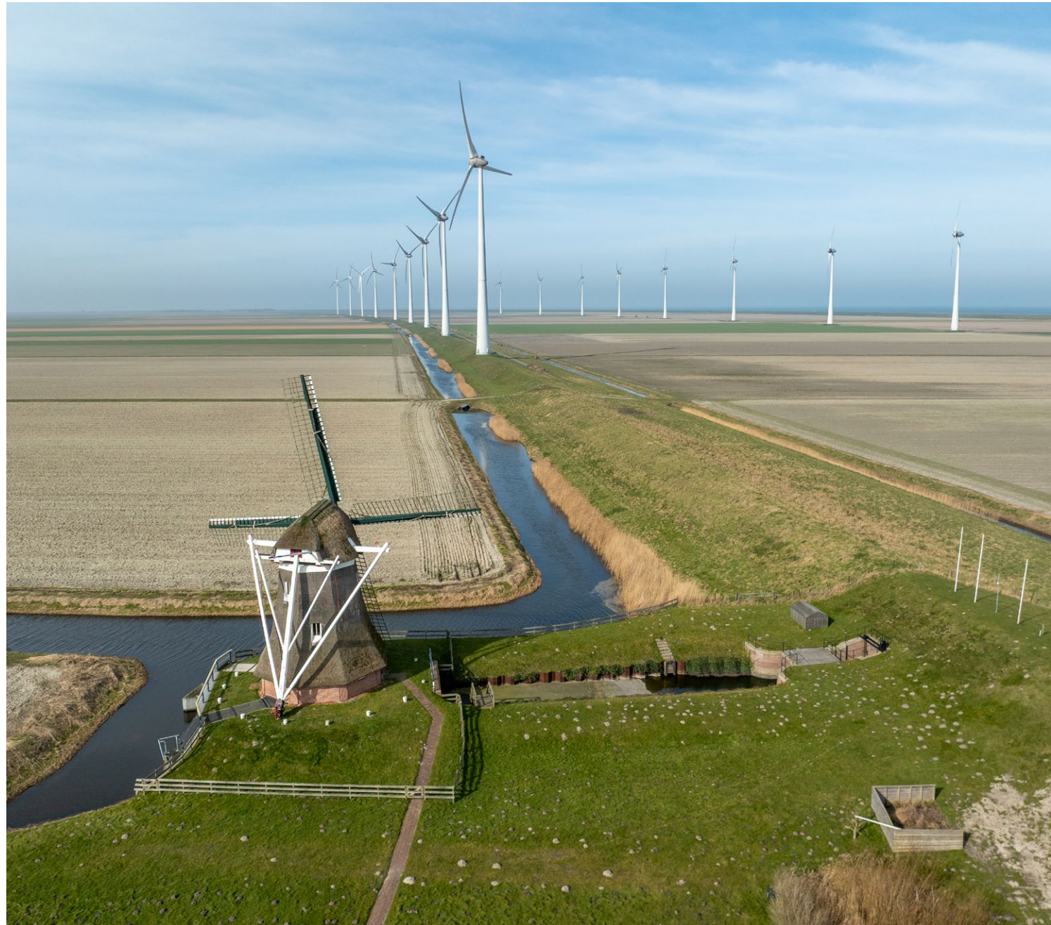
De molen de Goliath in de Eemspolder heeft geen functie meer en wordt tegenwoordig omringd door windturbines. Een groot contrast tussen historisch en hedendaags gebruik van windenergie.

Toch blijkt uit evaluaties dat erfgoed vaak niet goed wordt benut in ruimtelijke plannen. Het krijgt in de beginfase van visievorming nog aandacht, maar verdwijnt bij de uitvoering naar de achtergrond. Vaak komt erfgoed pas weer in beeld bij de vergunningverlening, wanneer de focus ligt op herstel in plaats >>