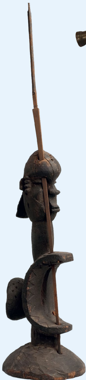
Igbo-beeld, Nigeria, datering onbekend | Hout, staal, 59,5 x 13 x 12 cm | Rijksdienst voor het Cultureel Erfgoed, Amersfoort, legaat Dolf Henkes