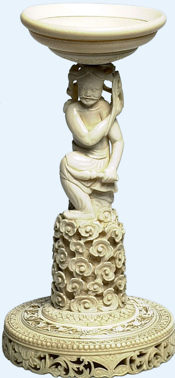
Drager van een puzzelbal, ca. 1850 | Ivoor, 21 x 11 cm | Objectnr. E1372 | Rijksdienst voor het Cultureel Erfgoed, Amersfoort, collectie Willem van Rede