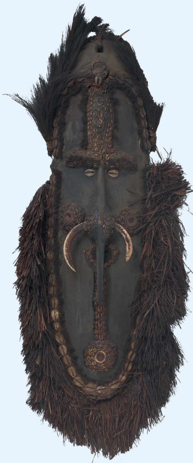
Langwerpig masker met schelpenrand-decoratie, vóór 1960 | Objectnr. AB15394 | Hout, casuarisveren, mensenhaar, sagobladvezels, schelpen, varkensslagtang, 85,5 x 32 x 8 cm | Rijksdienst voor het Cultureel Erfgoed, Amersfoort, legaat Dolf Henkes