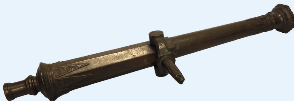
Lantaka, Indonesië, 18de eeuw | Objectnr. AB33 | Brons, lengte 76 cm | Rijksdienst voor het Cultureel Erfgoed, Amersfoort