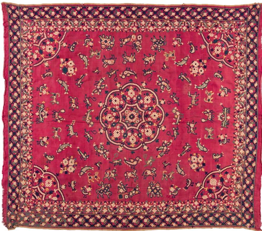
Geborduurd kledingstuk, India(?), ca. 1900 | Zijde, 70 x 80 cm | Objectnr. LMO2815 | Rijksdienst voor het Cultureel Erfgoed, Amersfoort

context. Voorwerpen met een koloniale context zijn niet in de gekoloniseerde wereld gemaakt, maar verwijzen ernaar. Bijvoorbeeld doordat het materiaal afkomstig is uit een kolonie of omdat een schilderij een koloniale machtsverhouding weerspiegelt. Denk aan een regent met een zwarte ‘bediende’ of een afbeelding van mensen in slavernij. Deze categorie valt buiten deze handreiking, waarin de focus is op objecten uit een koloniale context. (7)