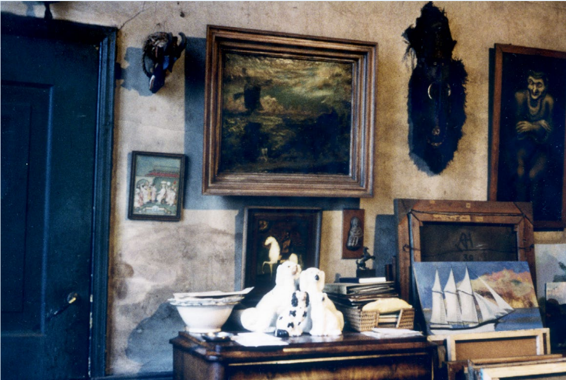
Het masker hangt aan de muur in het atelier van Dolf Henkes, Rotterdam. Foto, vóór 1960 | Fotograaf onbekend | Archief Dolf Henkes, Verhalenhuis Belvédère, Rotterdam