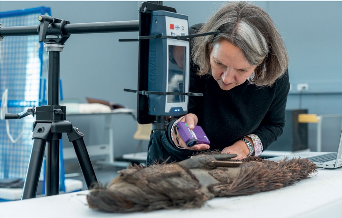
Een onderzoeker van het Rijkserfgoedlaboratorium kijkt met een UV-lampje naar de materialen van het masker, ook om een geschikte locatie te vinden voor metingen met Raman-spectroscopie (het apparaat aan de standaard). Met deze techniek is vastgesteld dat de kaurischelpen en de tanden echt zijn.