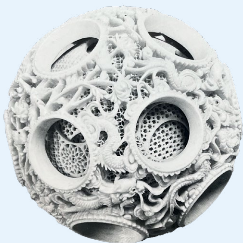
Puzzelbal, ca. 1850 | Ivoor, doorsnede 10 cm | Objectnr. E1389 | Rijksdienst voor het Cultureel Erfgoed, Amersfoort, collectie Willem van Rede | Verblijfplaats onbekend

In de collectieregistratie van de RCE stond dit ivoren voorwerp ingeschreven als een offerschaal uit Azië, afkomstig uit de collectie van kunstverzamelaar Willem van Rede. Nader onderzoek met behulp van Google Lens laat zien dat het waarschijnlijk de drager is van een 'puzzelbal', een kunstig uitgesneden ivoren bal die bestaat uit vele lagen. Een intrigerend object dat men graag verzamelde. Eeuwenlang werden deze puzzelballen en hun dragers gemaakt in Kanton, het huidige Guangzhou in China, en verspreid over de wereld. Ze zijn nog te vinden in de kunsthandel en in musea, bijvoorbeeld in het Lizzadro Museum of Lapidary Art in de Verenigde Staten. Er blijkt inderdaad een puzzelbal in de collectie van Van Rede geweest te zijn, er is nog een zwart-witfoto van bewaard gebleven. Door de informatie in de collectieregistratie zat de onderzoeker in de RCE-pilot echter op het spoor van offerschaal als functie en Indonesië als vermoedelijke herkomst. De nu veronderstelde functie, drager van een Chinese puzzelbal, en de vermoedelijke herkomst uit China is daardoor over het hoofd gezien. Voortschrijdend inzicht kan dus betekenen dat je de resultaten van je onderzoek moet herzien en dat aanvullend onderzoek nodig is.