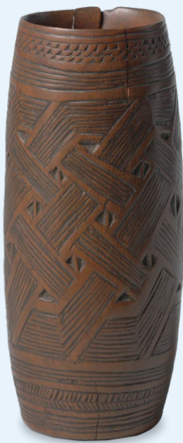
Kuba-beker, 1886-1892(?) | Palmhout, koper, 19,5 x 6,5 cm | Objectnr. W55 | Rijksdienst voor het Cultureel Erfgoed, Amersfoort, collectie Willem Witsen