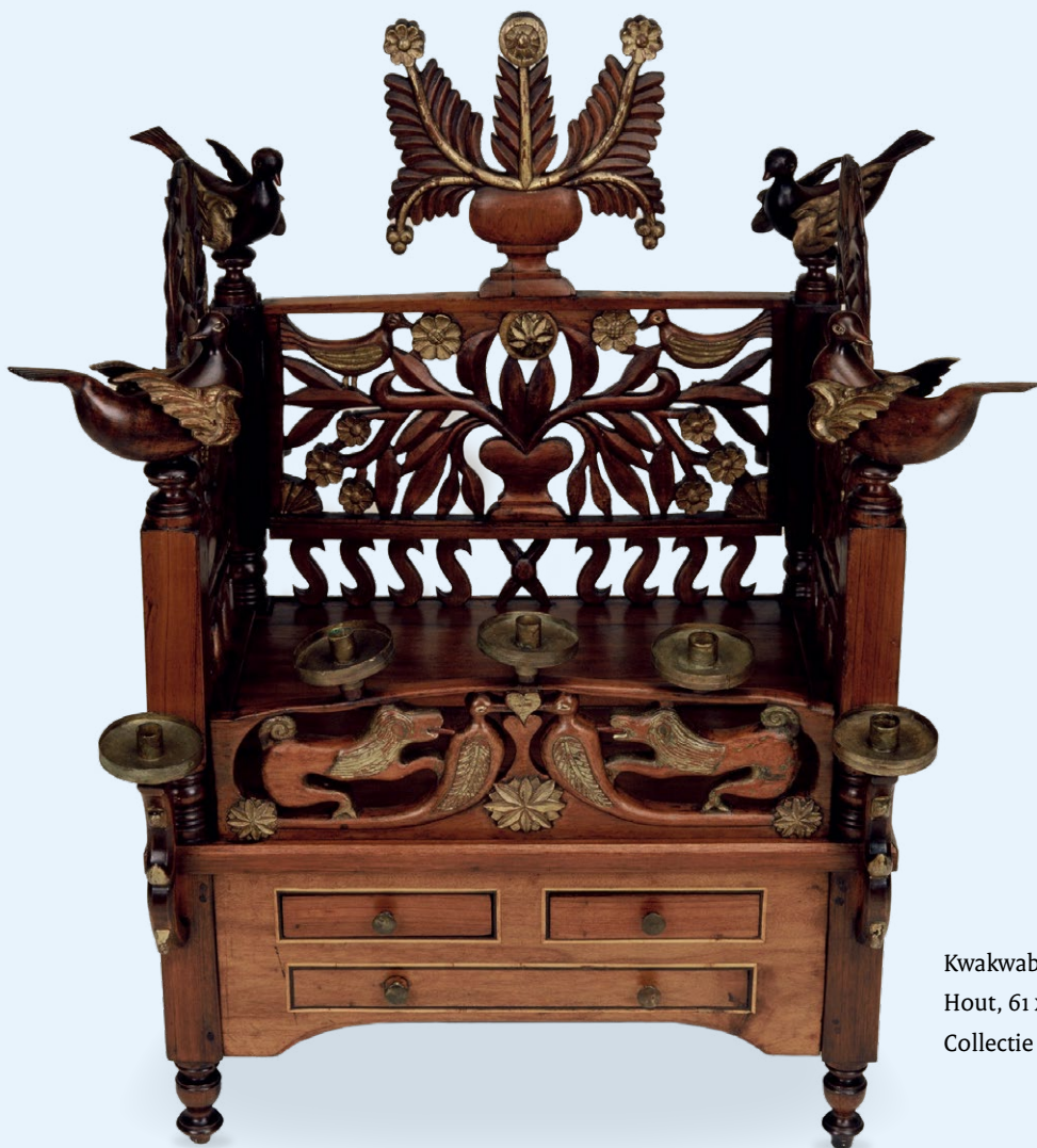
Kwakwabangi, ca. 1850(?) | Hout, 61 x 62,5 x 53 cm | Objectnr. 9656 | Collectie Museon-Omniversum, Den Haag