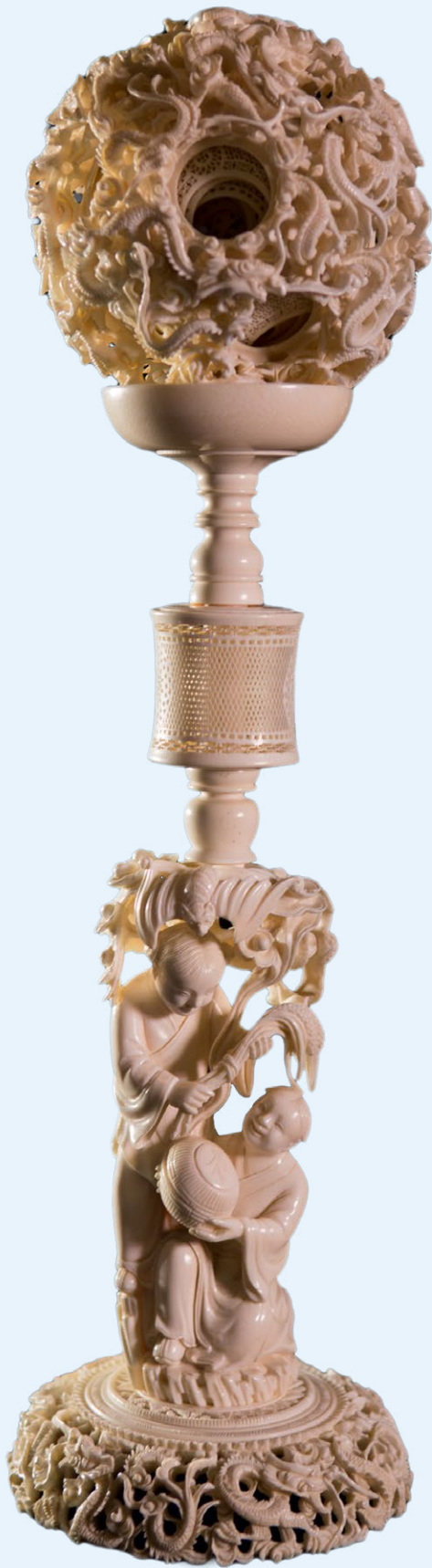
Puzzelbal op standaard, 19de eeuw | Ivoor, hoogte 50,8 cm, doorsnede puzzelbal 14 cm | Met dank aan Lizzadro Museum of Lapidary Art, Oak Brook, Illinois, USA