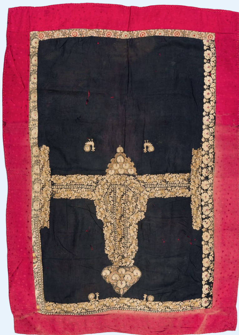
Geborduurd kleet, India(?), ca. 1900 | Zijde, 104 x 76 cm | Objectnr. LM02816 | Rijksdienst voor het Cultureel Erfgoed, Amersfoort; tegelijk aangekocht met de Indiase doek die op het omslag is afgebeeld.

Objecten uit de Pilot herkomstonderzoek koloniaal erfgoed die de RCE in 2021 uitvoerde.