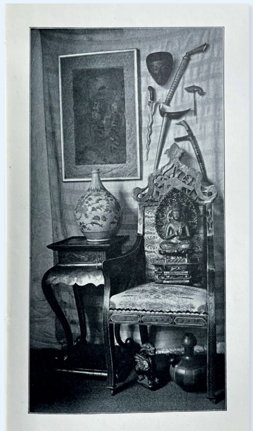
Collections Ph. Zilcken. Eaux-fortes modernes – gravures et dessins anciens et modernes. – Tableaux anciens et modernes. – Livres. – Antiquités. – Chaussures., Vente à La Haye, Haagsche Kunstkring, 13-15 mei 1902, p. 54 en afbeelding tegenover p. 20. Particuliere collectie