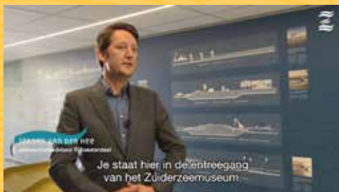
Dwars door de dijk