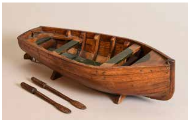
Model van een sloep, 1900 - 1950