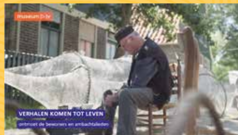
BankGiro Loterij - Buitenmuseum