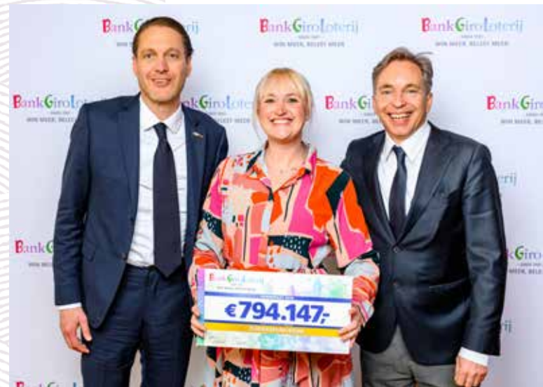
BANKGIRO LOTERIJ Ook dit jaar ontvangt het Zuiderzeemuseum een groot bedrag op het Goed Geld Gala van de BankGiro Loterij.