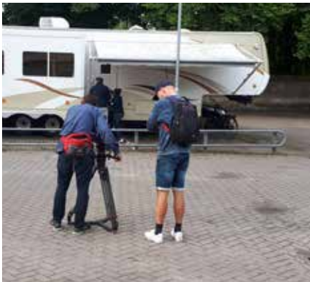
NPO2 Tv-programma Typisch Betuwe brengt een bezoek aan het Zuiderzeemuseum.