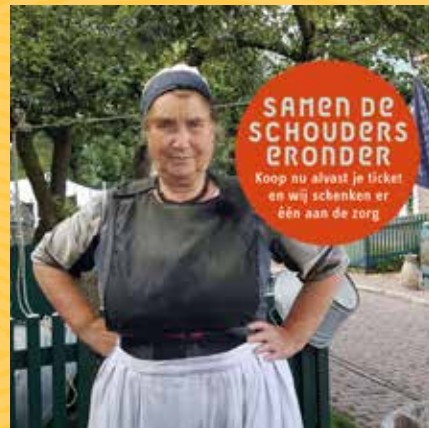
INSTAGRAM Samen de schouders eronder