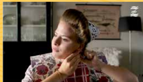
Zee vol verhalen