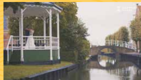
Trouwen in het Zuiderzeemuseum