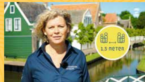
Veilig en verantwoord bezoek