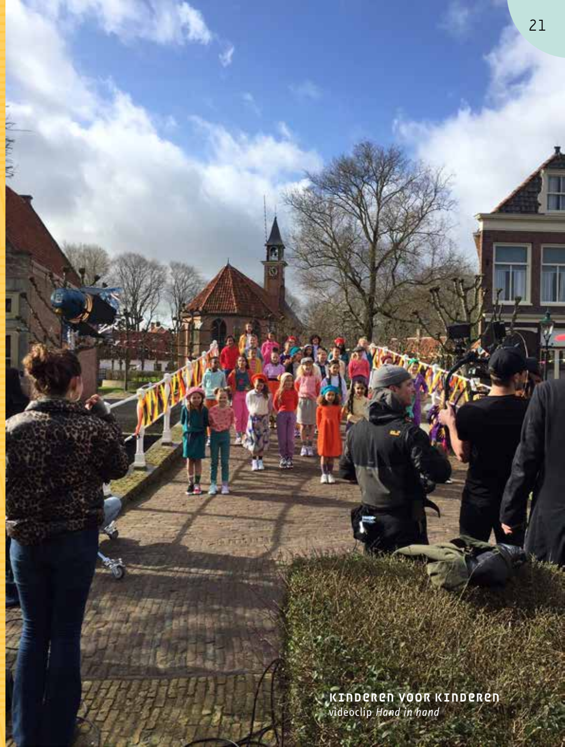
KINDEREN VOOR KINDEREN videoclip Hand in hand