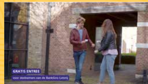
BankGiro Loterij - Binnenmuseum