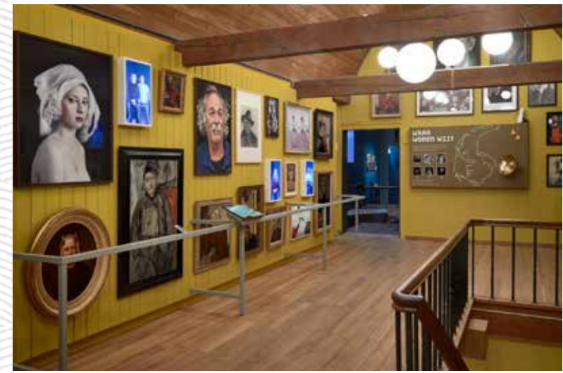
VSB FONDS Voor de nieuwe vaste tentoonstelling Zee vol verhalen ontvangt het museum een bijdrage van het VSB Fonds.