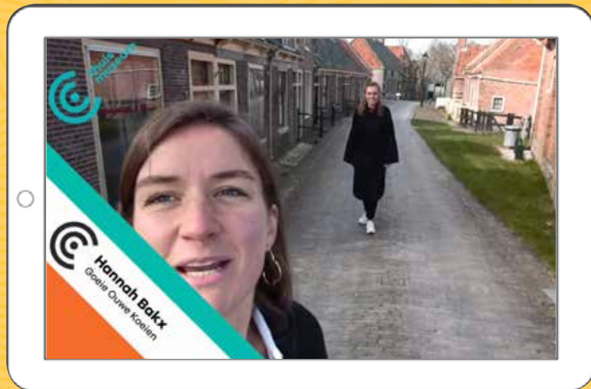
BLOG - YOUTUBE Thuismuseum