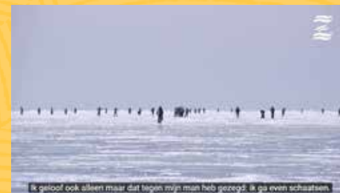
Warme herinneringen aan koude winters