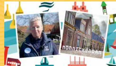
Buitenmuseum komt binnen