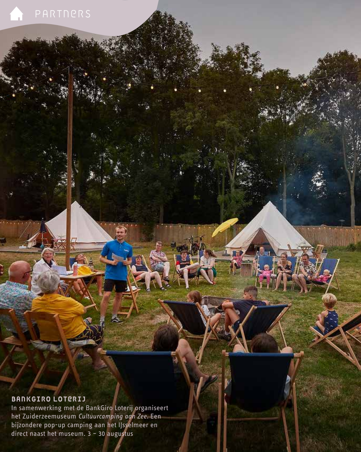
BANKGIRO LOTERIJ In samenwerking met de BankGiro Loterij organiseert het Zuiderzeemuseum Cultuurcamping aan Zee . Een bijzondere pop-up camping aan het IJsselmeer en direct naast het museum. 3 – 30 augustus