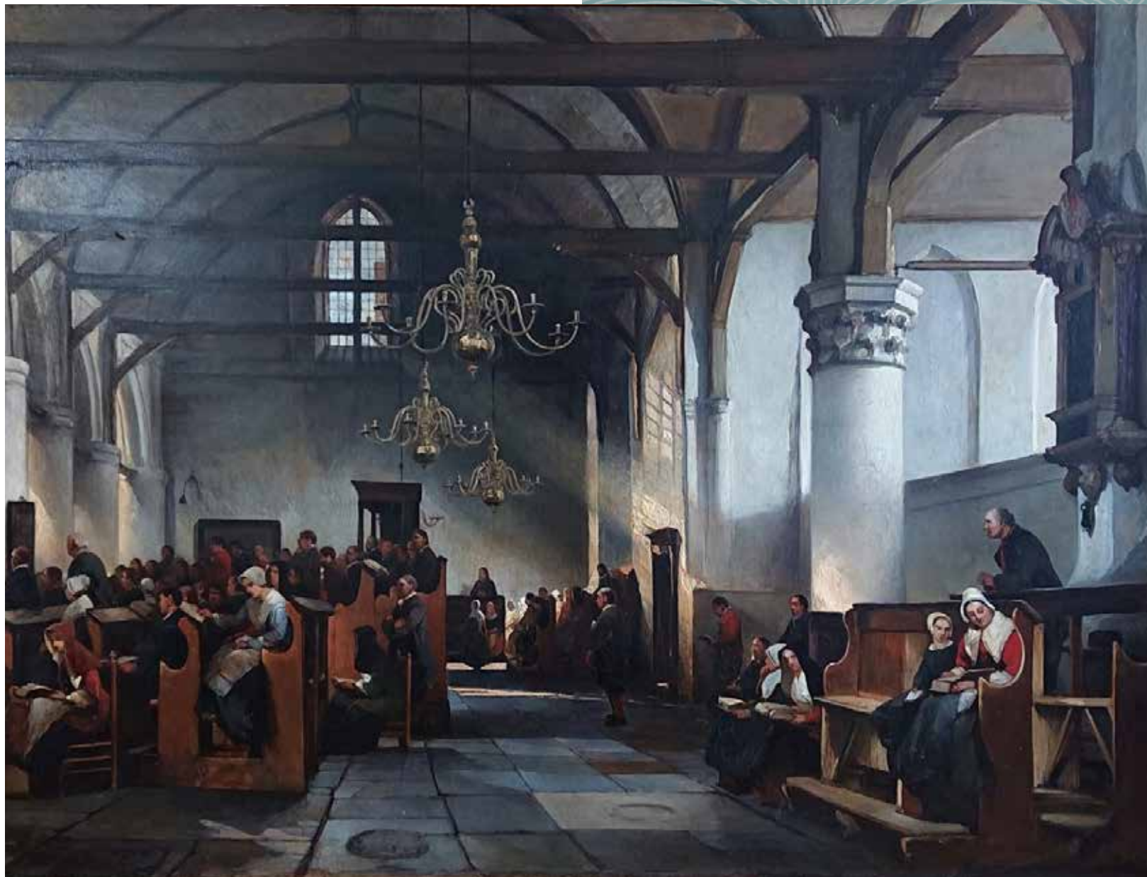
Antonie Waldorp, L'Eglise d'Enckhuysen / Interieur Zuiderkerk Enkhuizen, 1861

Dit schilderij toont een levendig beeld van een kerkgemeenschap en het samenzijn op een zondag. De leden van de kerkgemeenschap, vooral vissers en aanverwante beroepen, zijn gekleed in hun zondagse West-Friese kostuum. De vrouwen dragen een kaper, een speciale hoofbedekking.