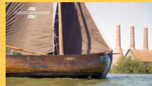
Zee vol verhalen