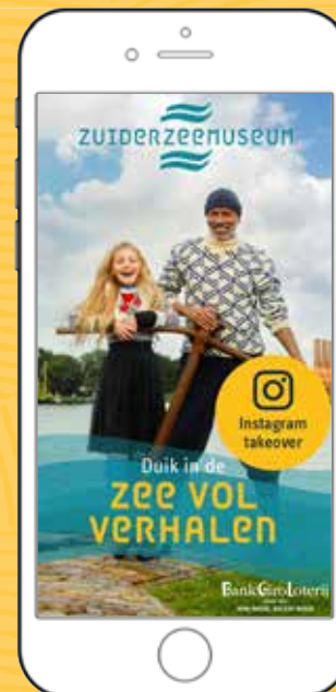
INSTAGRAM - TAKEOVER Zee vol verhalen