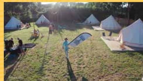
BankGiro Loterij - Cultuurcamping aan zee