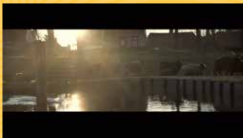
Zomaar een lentedag in het verlaten buitenmuseum