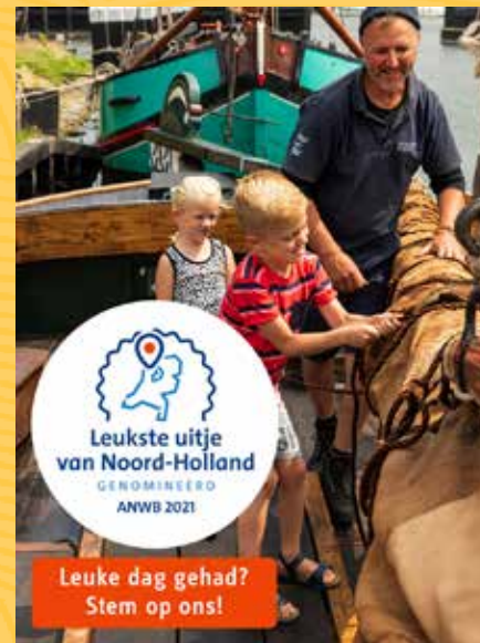
ONLINE ADVERTISING Leukste uitje