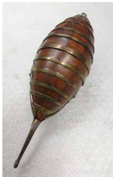
Schaalmodel van Enkhuizer zeeton, ca. 1849