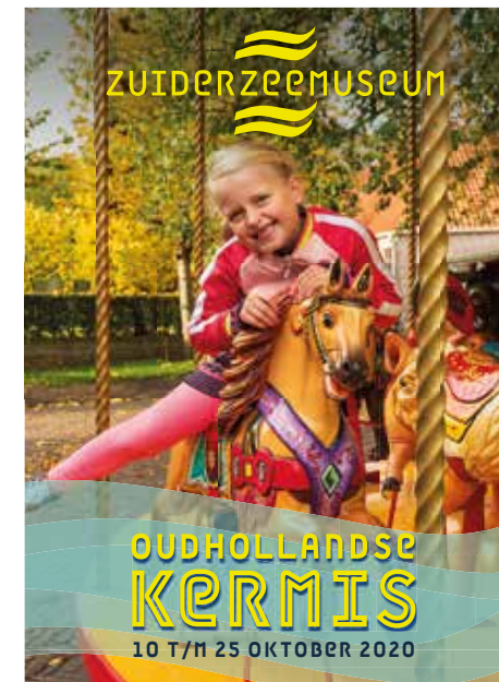
AO Oudhollandse Kermis