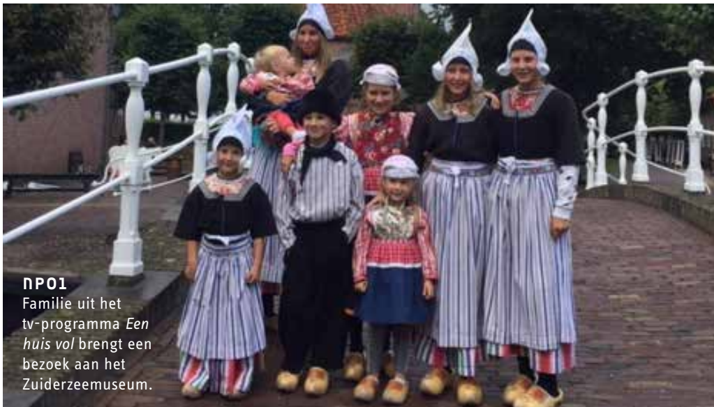
NPO1 Familie uit het tv-programma Een huis vol brengt een bezoek aan het Zuiderzeemuseum.