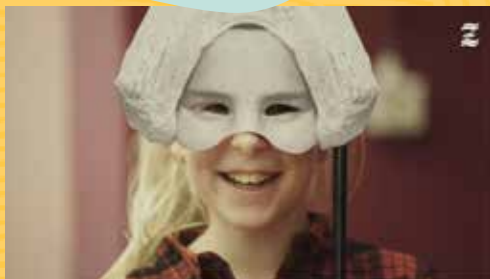
Zee vol verhalen