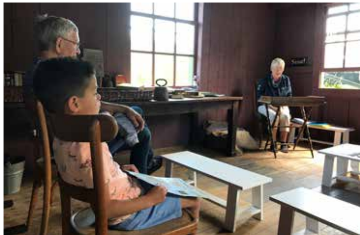
Huis vol verhalen. In 2020 staan de verhalen van vroeger die in en rond de Zuiderzee plaatsvonden centraal.