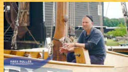
Het verhaal van...