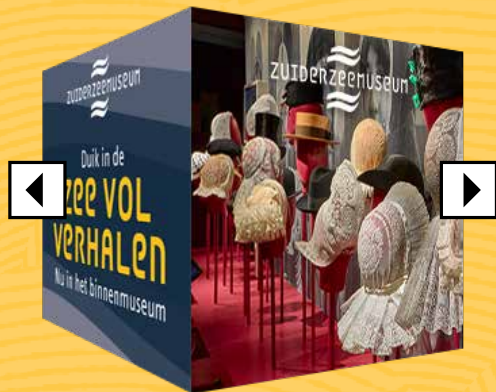
SWIPE CUBE Zee vol verhalen