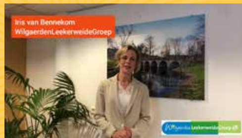
Steun het museum en de zorg