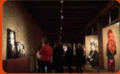
Winter in het binnemuseum