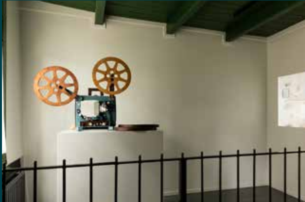
Studio Lernert&Sander - 16mm