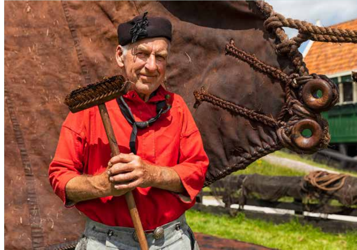
Taandagen 5 - 6 juli