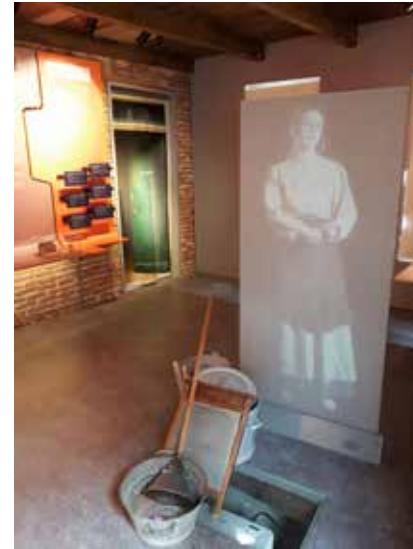
Presentatie: Leven op een kluitje