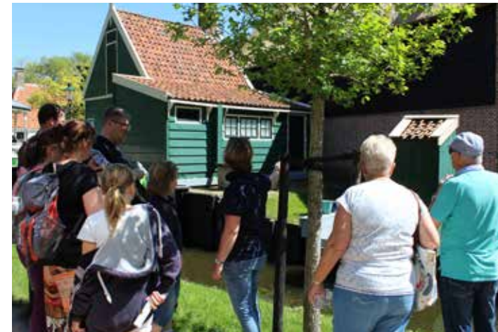
Week van ons water - Watterondleidingen 4 - 5 en 11 - 12 mei