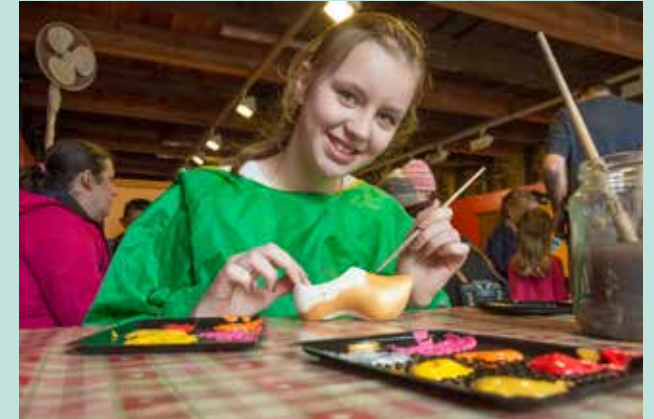
Dag van het kind 1 juni