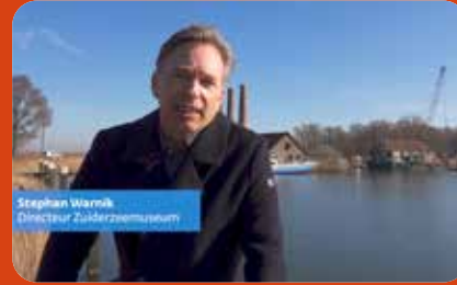
Subsidie Provincie Noord-Holland