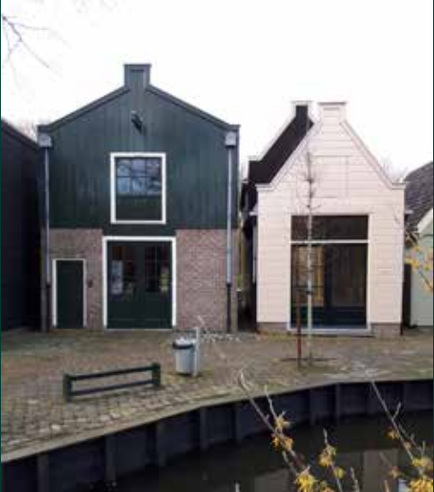
AM2 en AM3