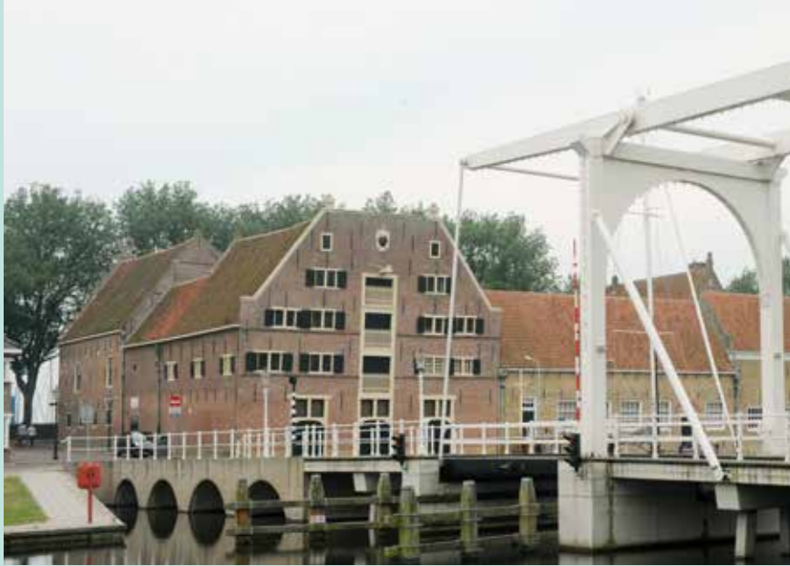
Open Monumentendag - rondleidingen Peperhuis en binnenmuseum 14 - 15 september

Maand van de geschiedenis Thema Hij/Zij met live uitzending OVT 1 -31 oktober