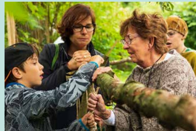
Kijkdagen bronsijdboerderij 17 - 18 augustus