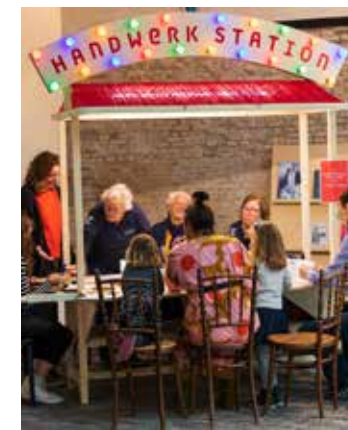
Handwerkstation november - december