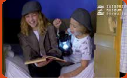
Dienders en deugnieten