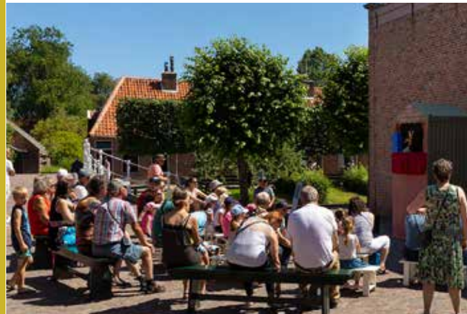
Kinderactiviteit Poppentheater Pittige tijden i.s.m. Poppenkast op de Dam