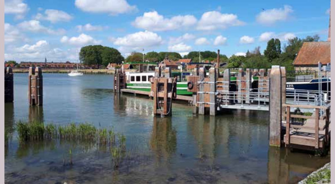
Provincie Noord-Holland: Verstevigen aanlegsteigers buitenmuseum en veerhaven