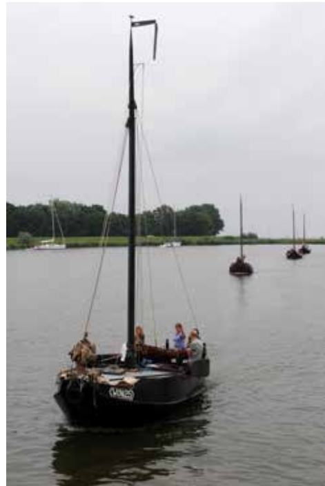
Spekbaktreffen 28 - 29 juni