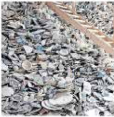
De kunstenaar van de 'Mooi samen' tentoonstelling.

Het is een klein detail, maar de plaats van het kunstwerk is van belang. Het is een klein detail, maar de plaats van het kunstwerk is van belang. Het is een klein detail, maar de plaats van het kunstwerk is van belang.