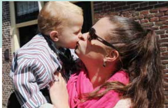
Moeders in het zonnetje 12 mei