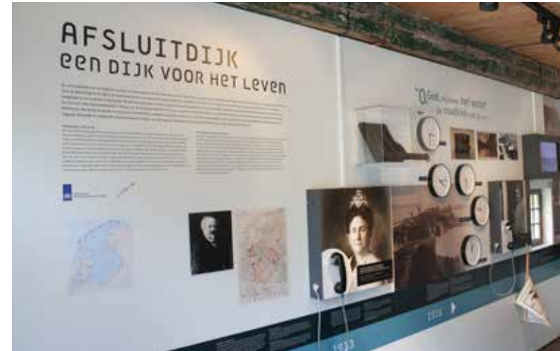
Dijk voor het leven vaste tentoonstelling