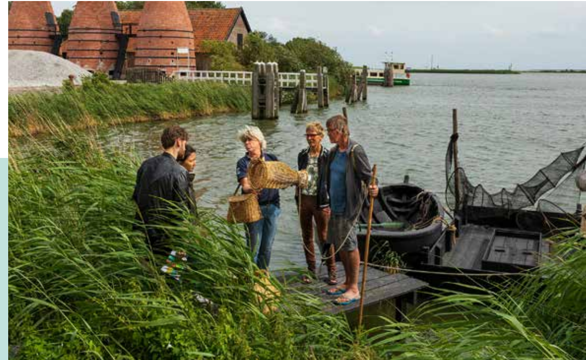
Maritiem festival 10 - 11 augustus