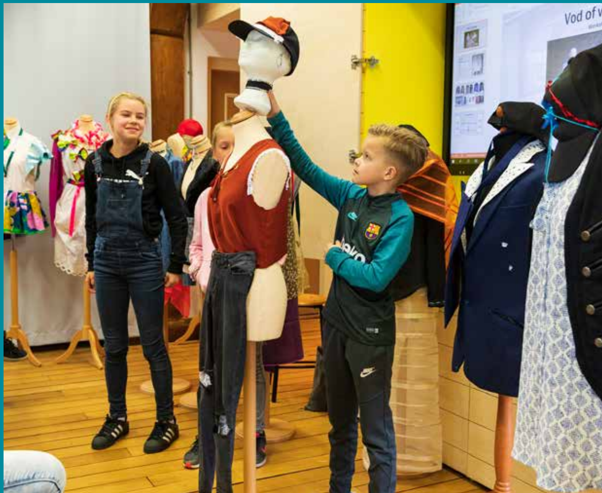
Nieuw educatief programma: Vod of vintage