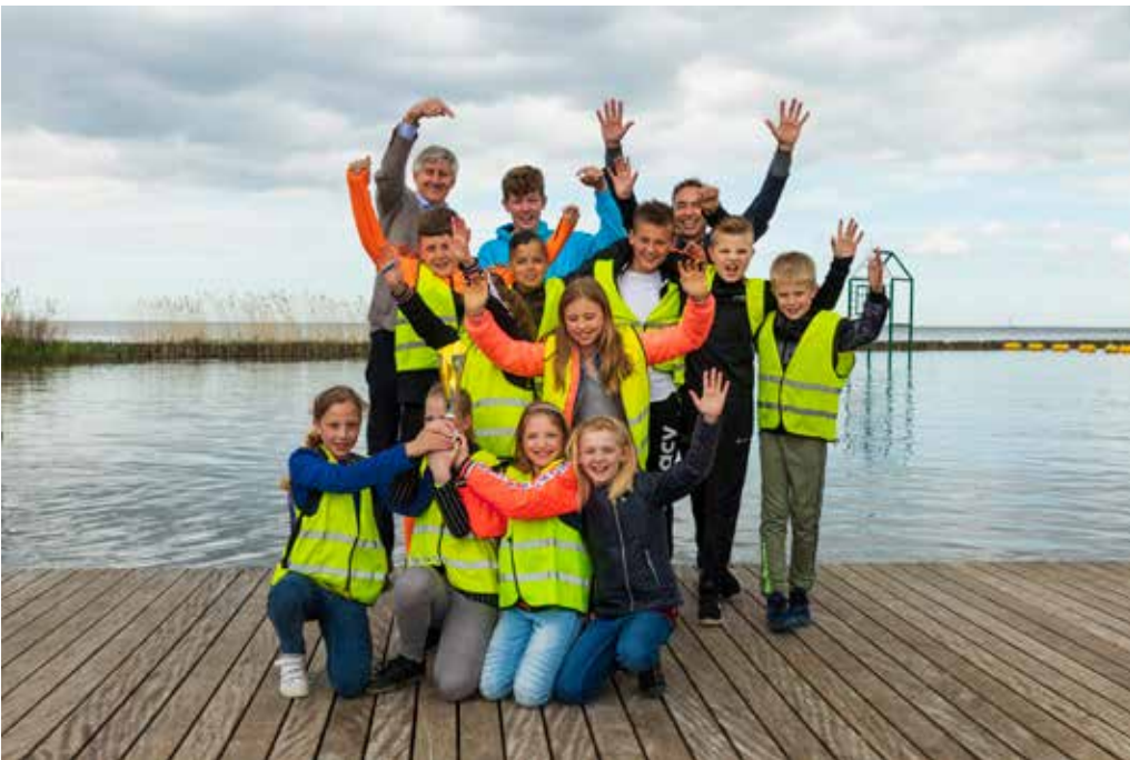
Hoogheemraadschap Hollands Noorderkwartier: Vernieuwde Expeditie Waterwerken