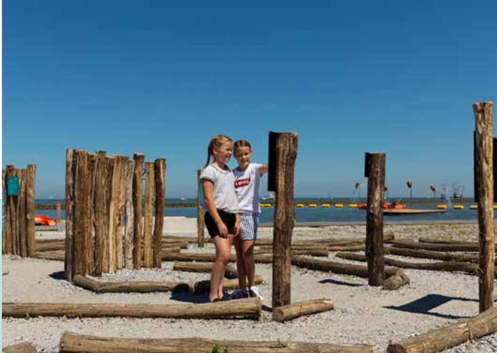
Expeditie Waterwerken 25 april - 23 september