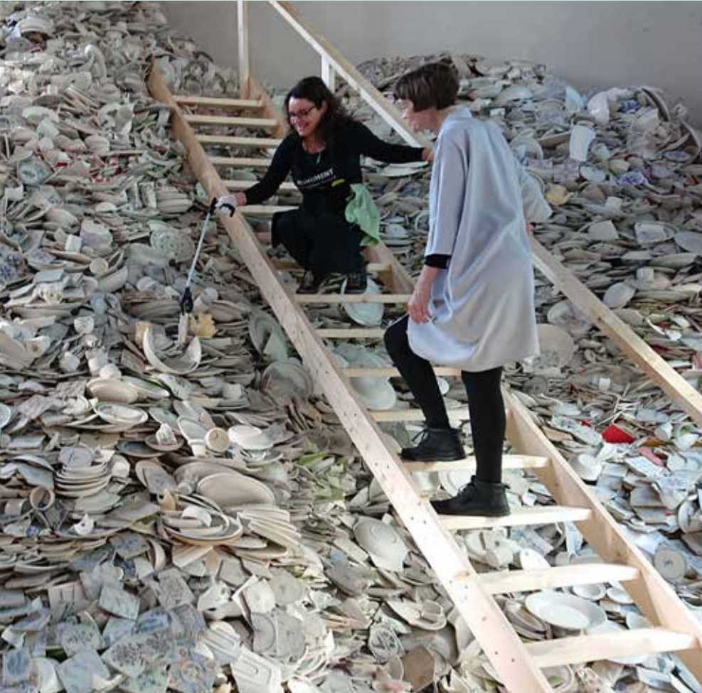
Nationale Museumweek Scherven brengen geluk: ontmanteling Monument van Clare Twomey 8 - 14 april