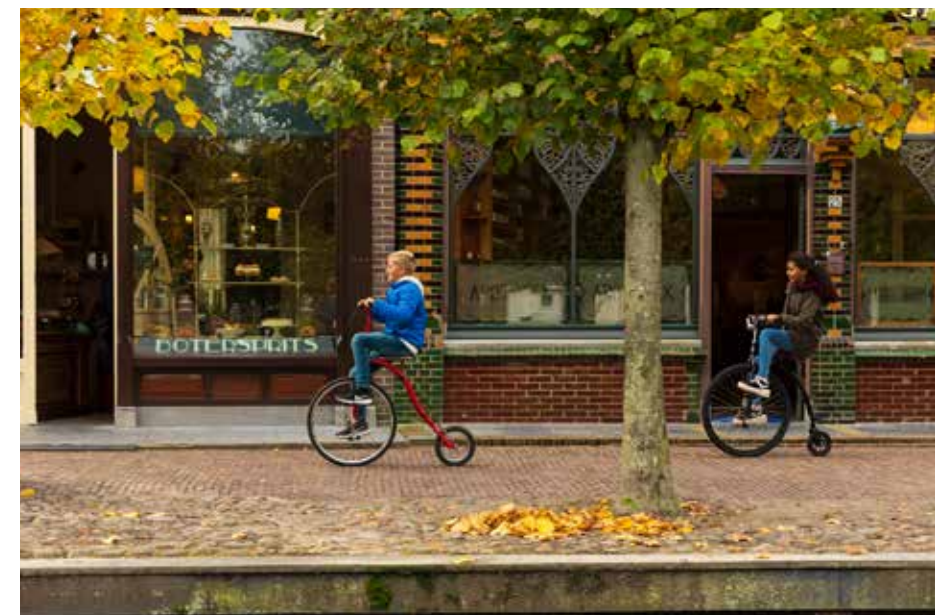
Nieuw educatief programma: Huisje boompje beestje 1900