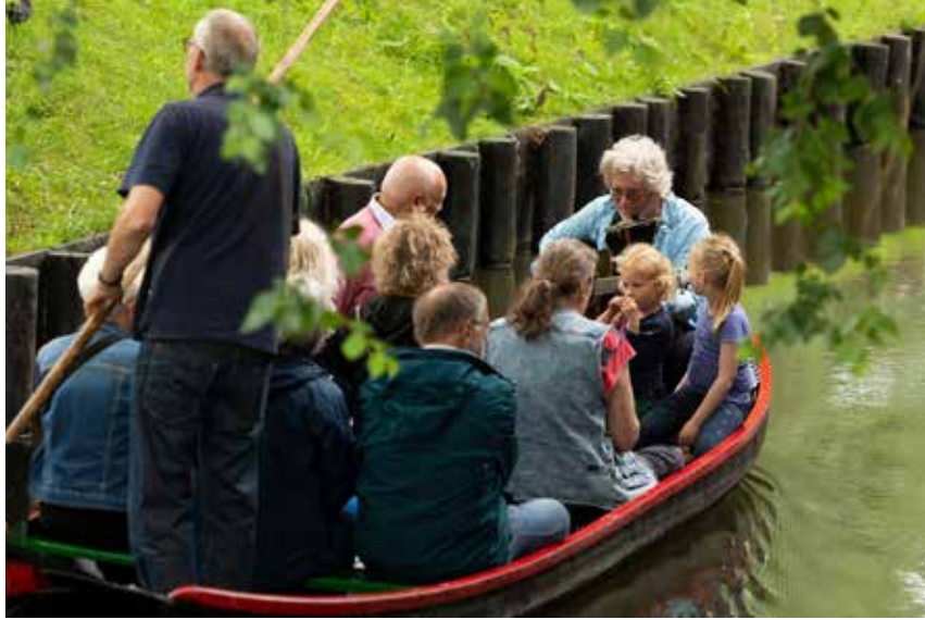
Gitaarfestival 16 juni