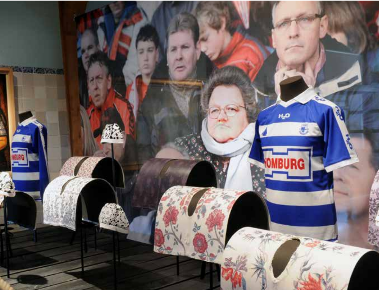
Reis rondom de Zuiderzee t/m 1 september 2019