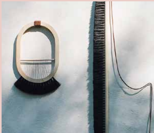
Deelname aan HOW & WOW Crafts Council