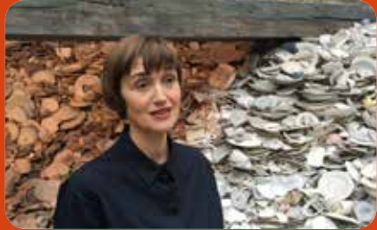
Scherven brengen geluk