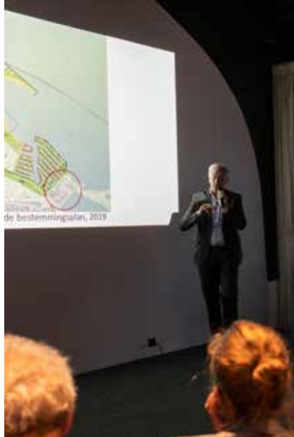
Bijeenkomst Recreatieoord Enkhuizerzand 9 mei