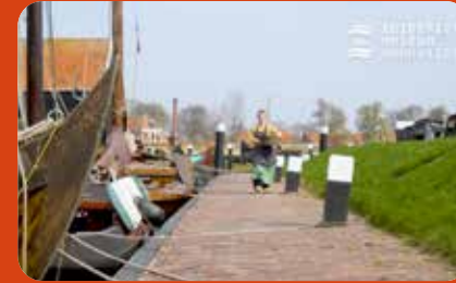
Leven van de wind