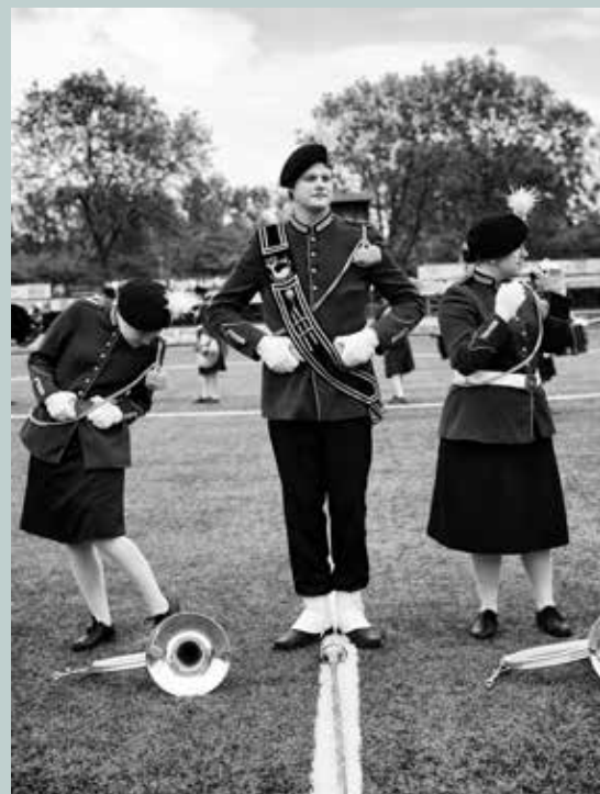
Sander Troelstra Showband Urk 2018