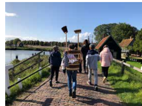
Kinderboekenweek programma: Karren maar 30 september - 11 oktober