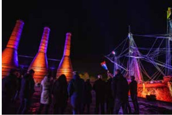
BankGiro Loterij: Zuiderzeelicht