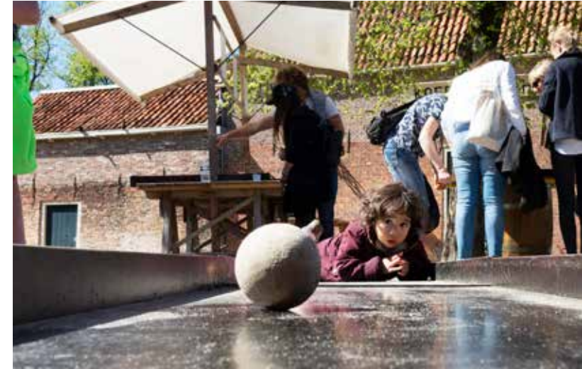
Kinderpret in de meivakantie 20 april - 5 mei