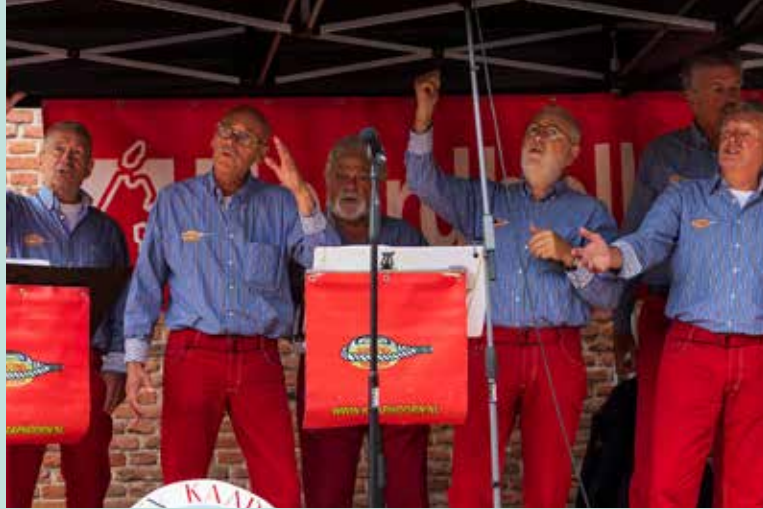
Shantyfestival 18 augustus