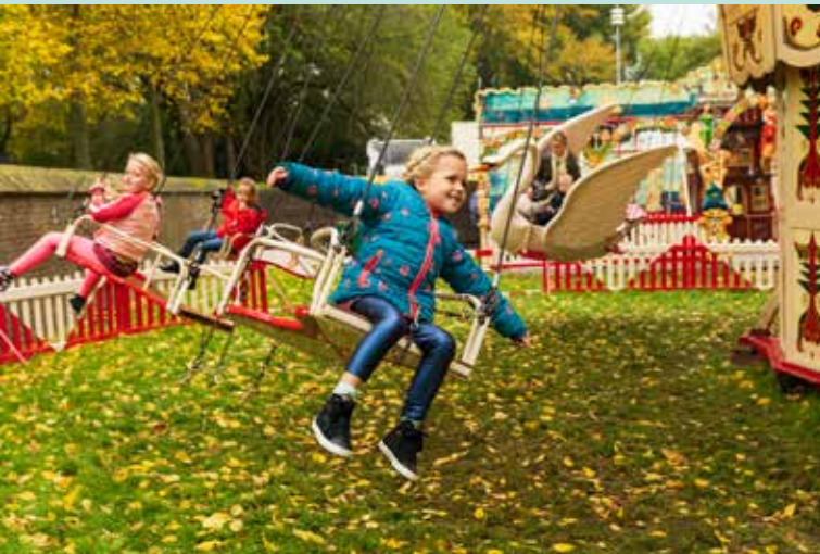
Oudhollandse kermis 19 - 27 oktober