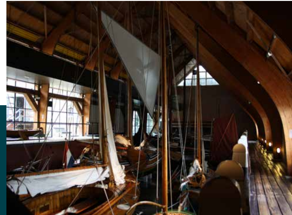
Schepenhal t/m 1 september 2019