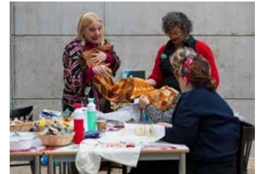
Masterclasses i.s.m. Crafts Council november - december