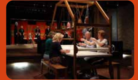
Kleren maken de vrouw