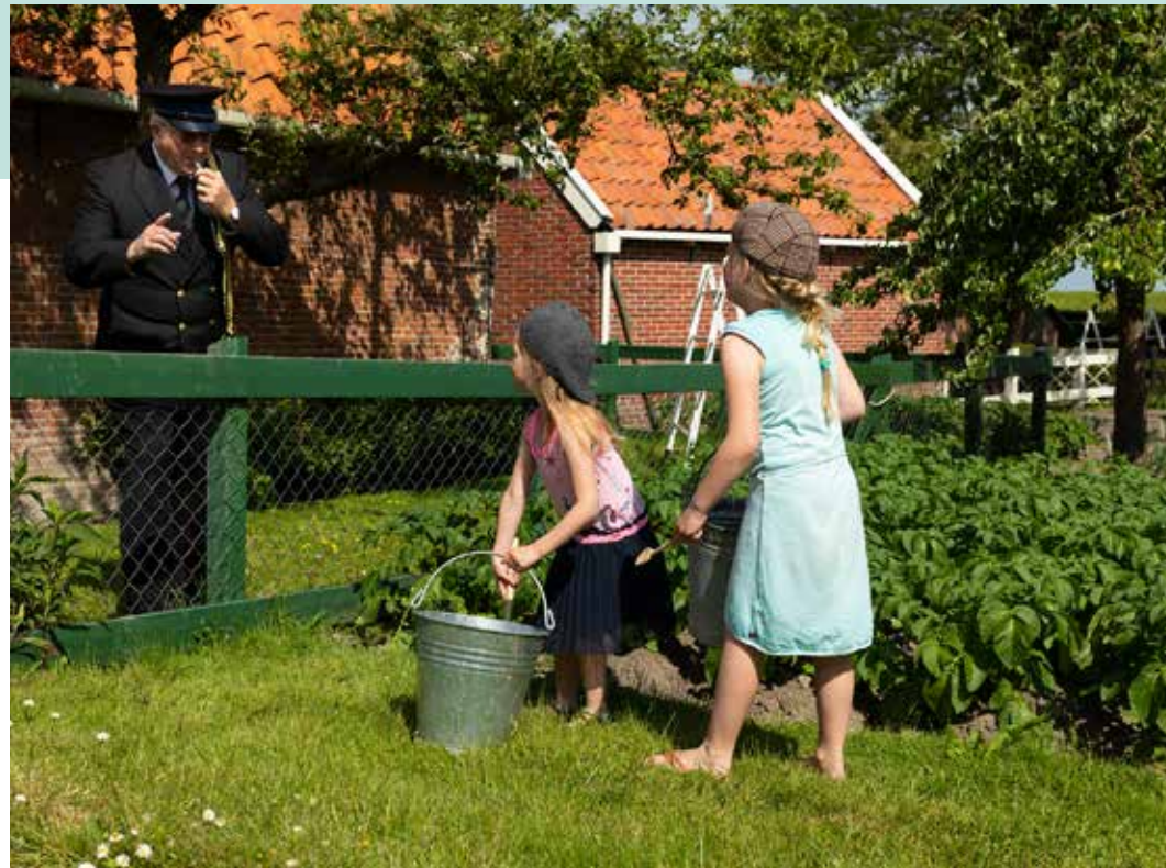
Dienders en deugnieten 30 mei - 2 juni en 8 - 10 juni