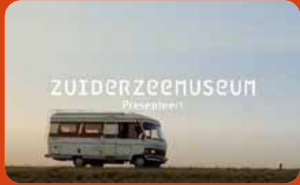
Mooi Samen - The making of