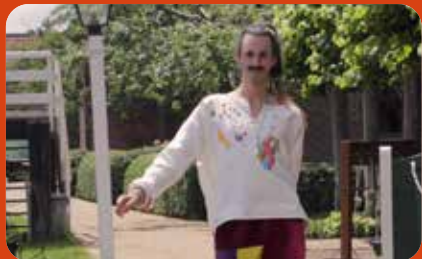
Kleren maken de vrouw DIY