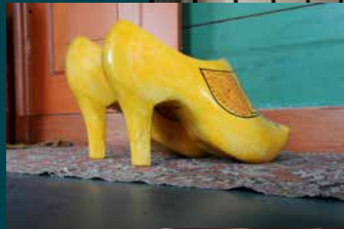
Viktor & Rolf - Klompen Anna Maria