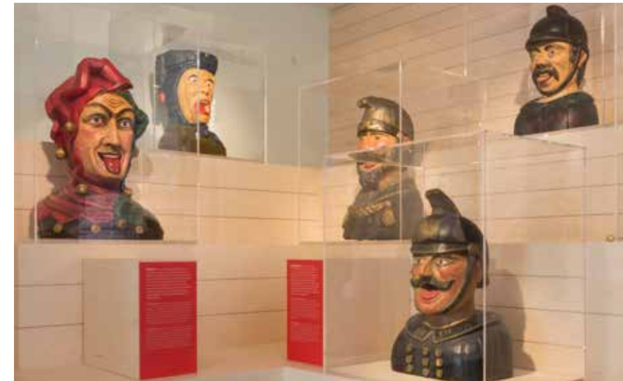
Zeg eens AAA vaste tentoonstelling