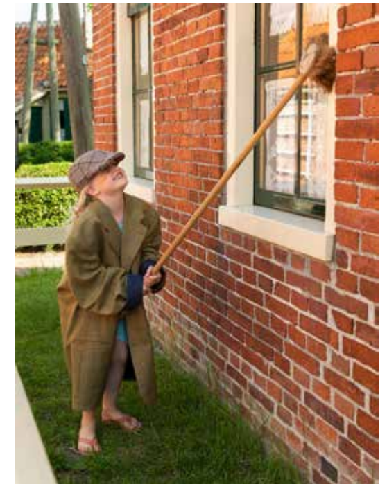
Kinderactiviteit Vuile handjes