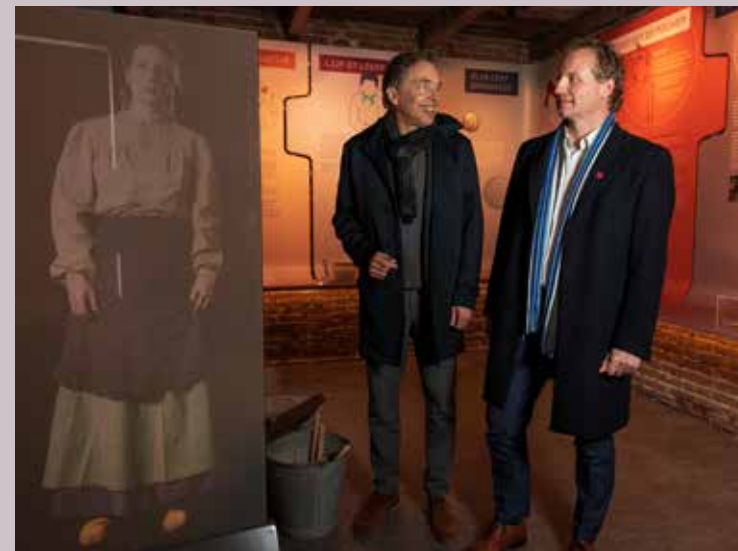
Leger des Heils: Leven op een kluitje