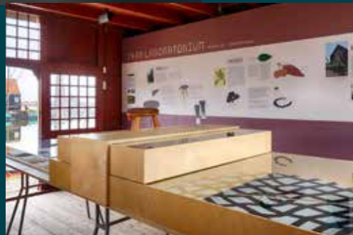
Merel Karhof Taanlaboratorium