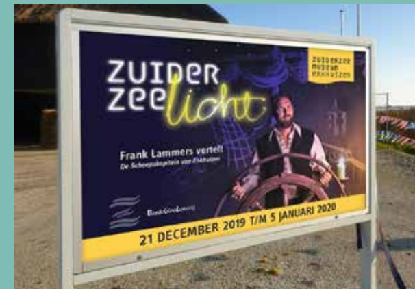
Outdoor reclame Zuiderzeelicht