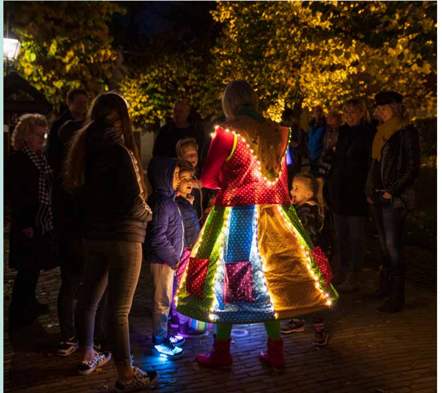
Avond in het buitenmuseum 26 oktober