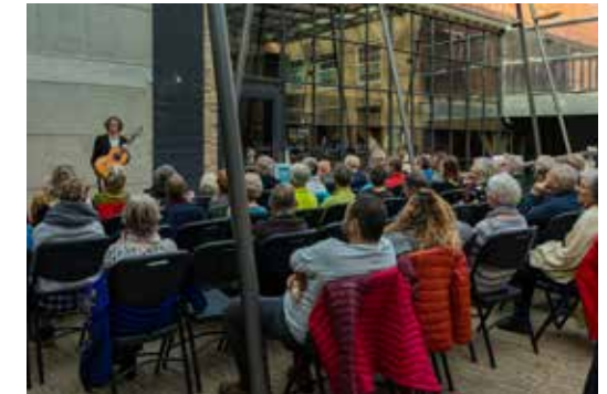
Miniconcerten november - december