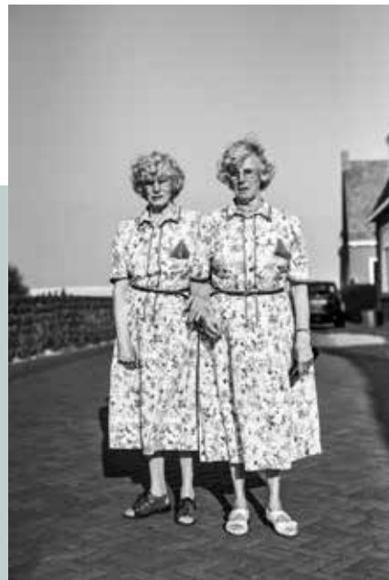
Sander Troelstra Portret van Hendrika en Jantina Poeze 2018