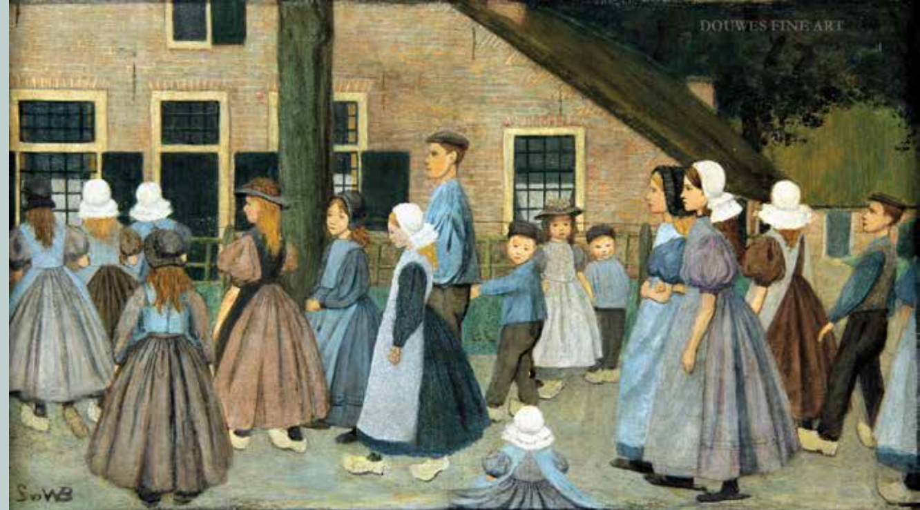
Sophie Christina van den Wall Bake Schoolkinderen te Huizen 1906