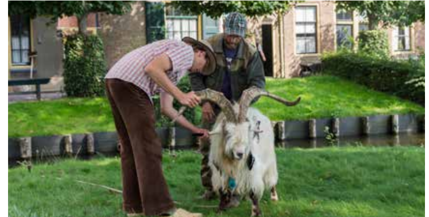
Landgeitenkeuring 25 augustus