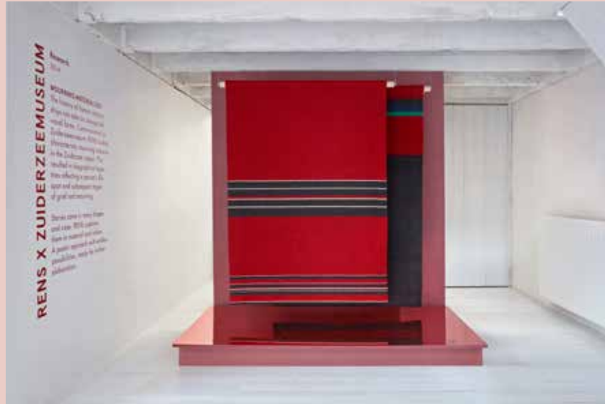
Dutch Design Week Deelname aan 10 jaar RENS X DDW 20 - 28 oktober