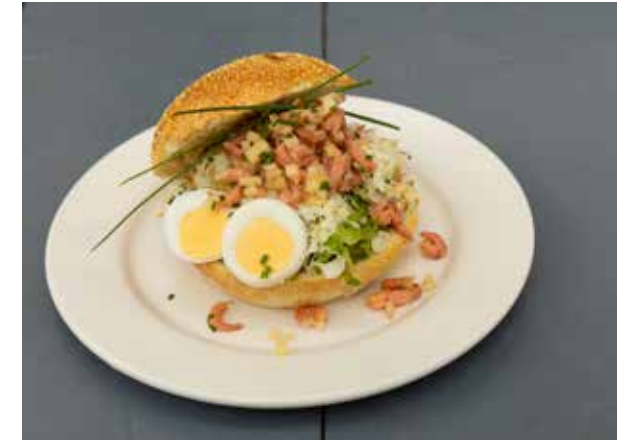
Broodje Grietjes noeste arbeid i.s.m. Estée Stroomer