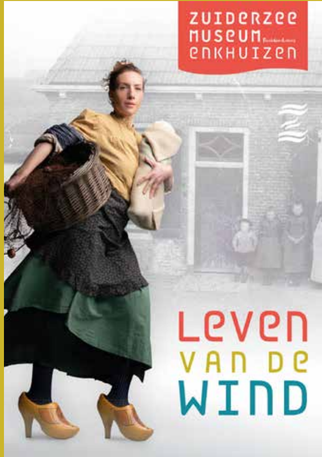
Campagnebeeld Leven van de wind