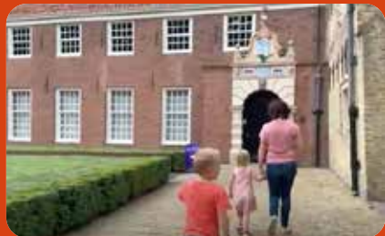
Familie Wanders vlog