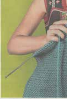
Alleerf naaldecoraties zijn in de expositie te zien.

Kleren maken de vrouw' laat kleding zien die niet alleen met veel zorg met de hand werd gemaakt, maar ook eendelige gepre-