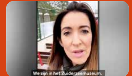
Spaanse influencers beoordelen NL