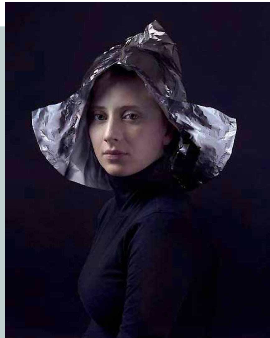
Hendrik Kerstens Aluminum 2012 Flatland Gallery