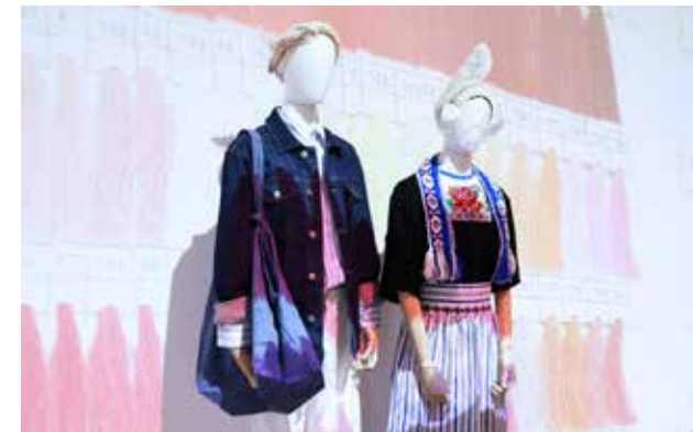
Fashion for Good Kleren maken de vrouw