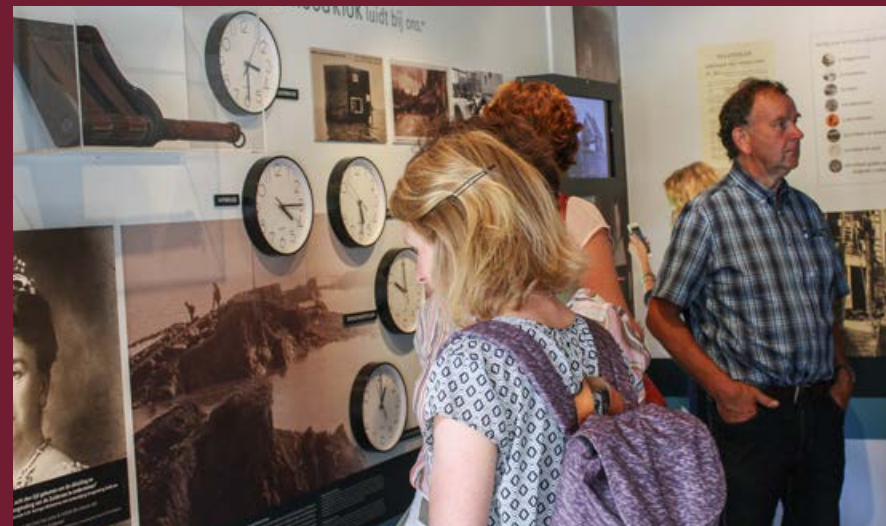
Rijkswaterstaat - Dijk voor het leven