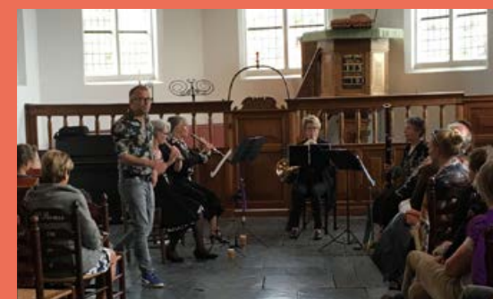
Zuiderzee klassiek 14 mei