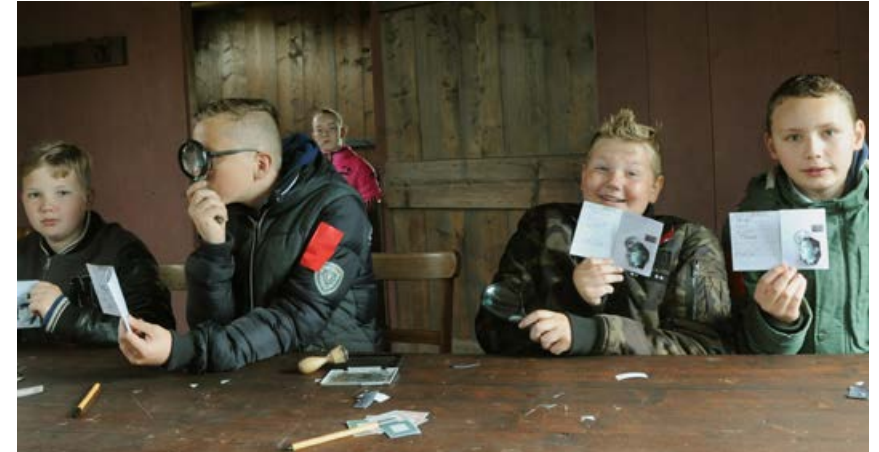
Van bonkaart tot persoonsbewijs april - mei 2017