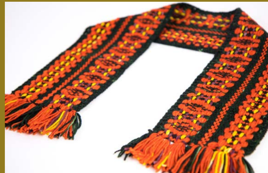
Walter Van Beirendock Folk-Scarf - Comb. I Khaki - Volendams dasje 2017