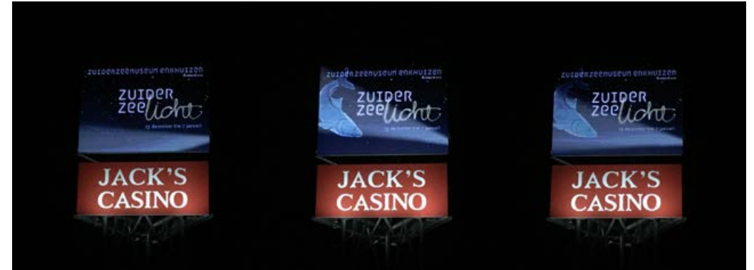
Zuiderzeelicht animatie, reclamemast aan de A10