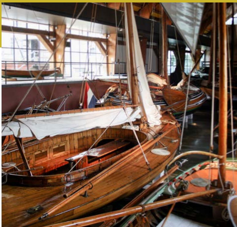
Schepenhal Vaste tentoonstelling