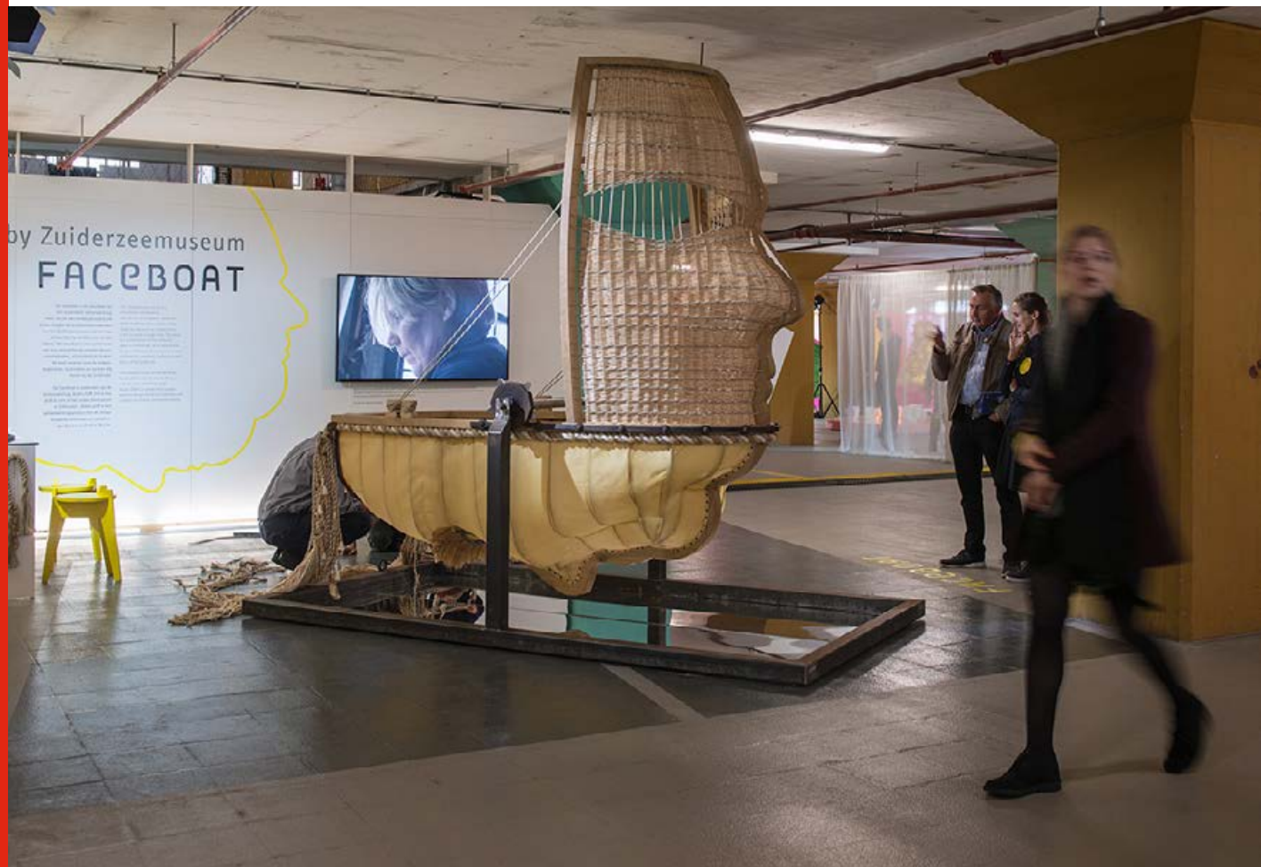
Dutch Design Week, Eindhoven 21 - 29 oktober 2017