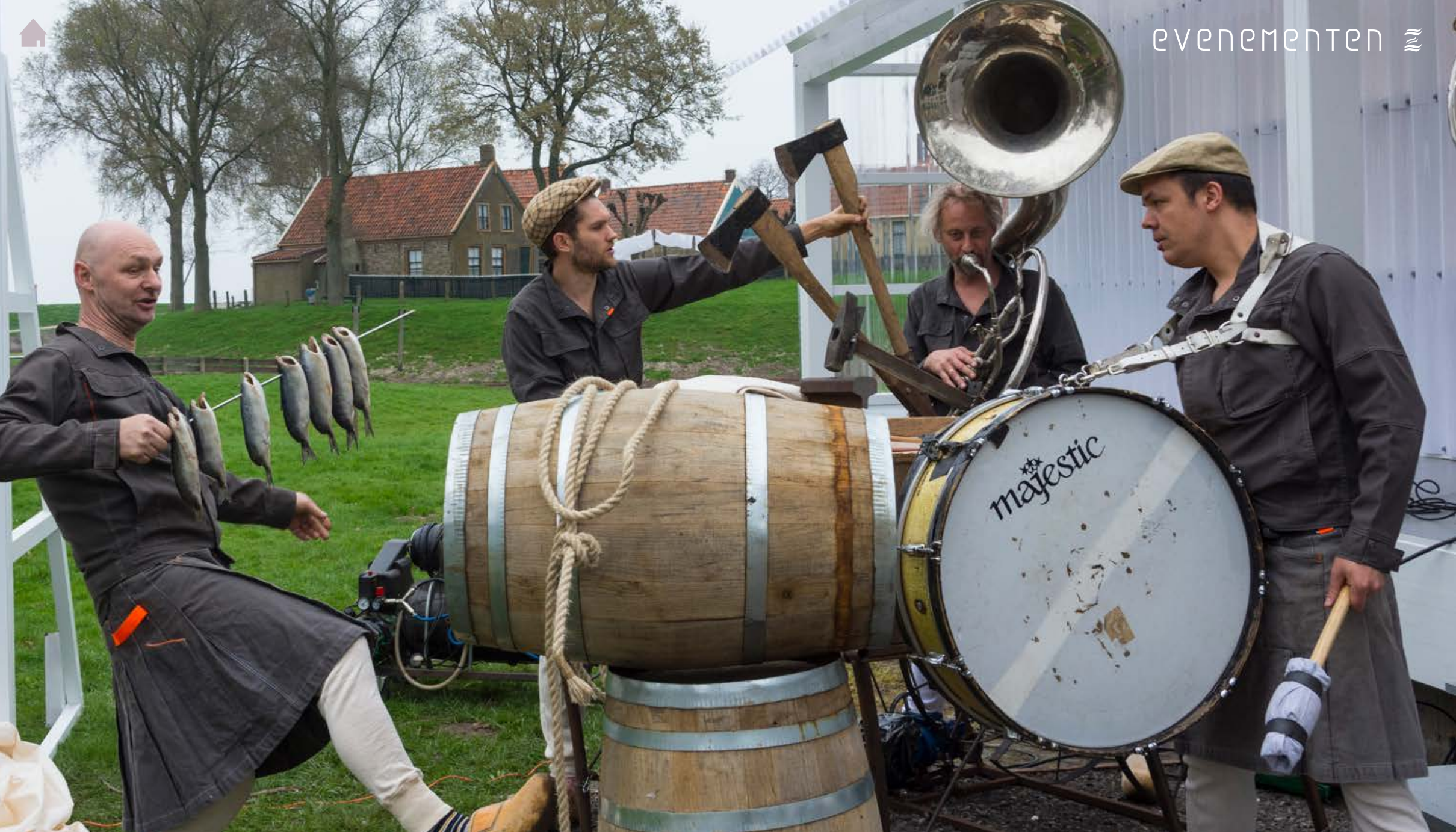
Opening buitenmuseum/ start themajaar Handgemaakt 1 april