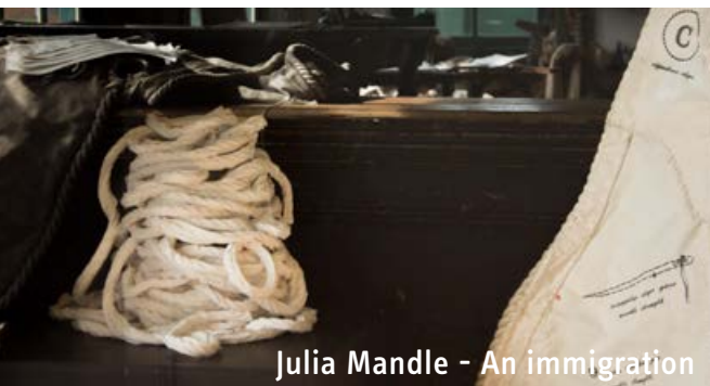
Julia Mandle - An immigration