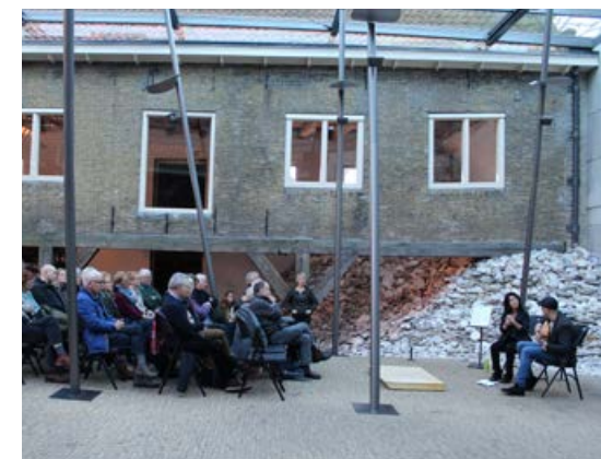
Miniconcerten In de winter