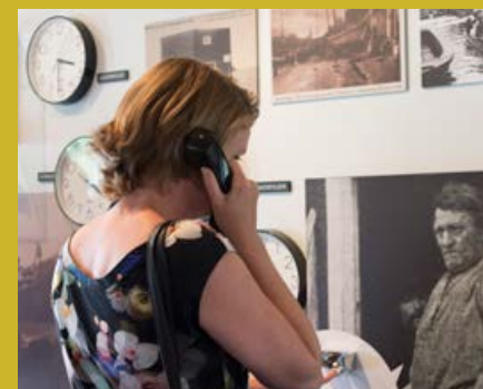
Dijk voor het leven vanaf 1 april 2017