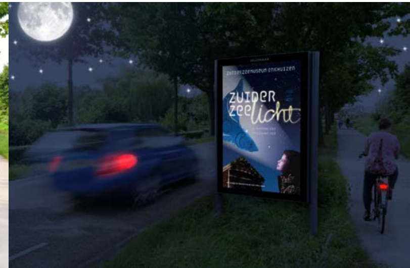
Day/Night Abri Zuiderzeelicht