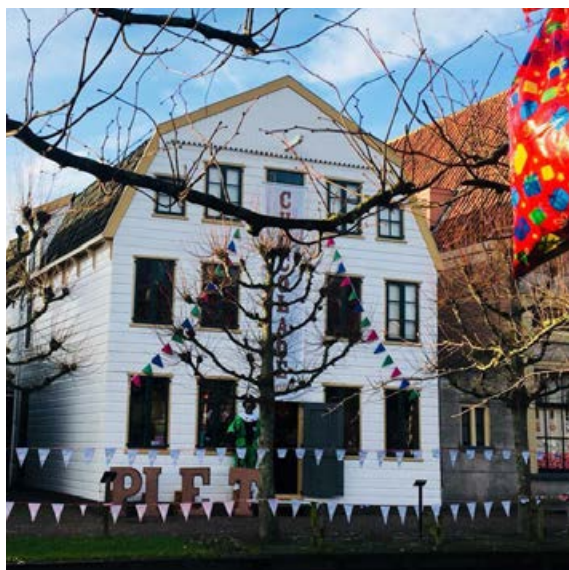
Verkade - Pietendorp