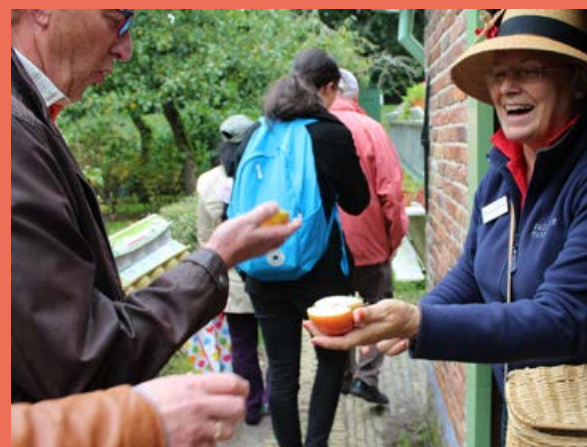
Oogstweekenden 16 - 17 september 23 - 24 september 30 september - 1 oktober