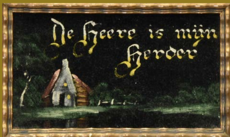
Spreuk in lijst - "De Heere is mijn Herder" circa 1910-1930