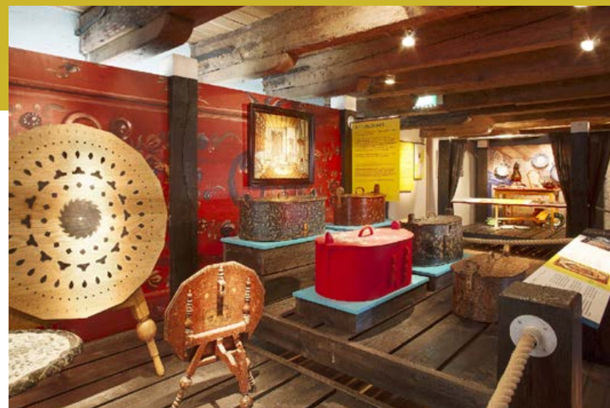
Reis rondom de Zuiderzee Vaste tentoonstelling