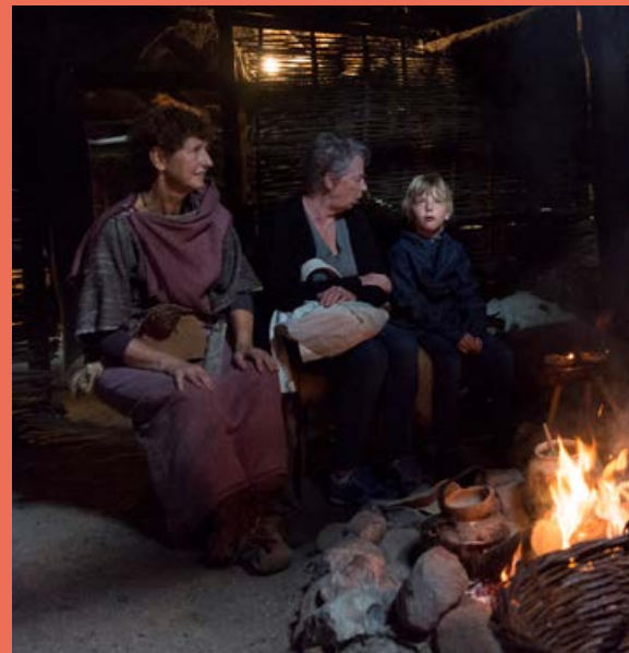
Kijkdagen bronsijdboerderij 19 - 20 augustus