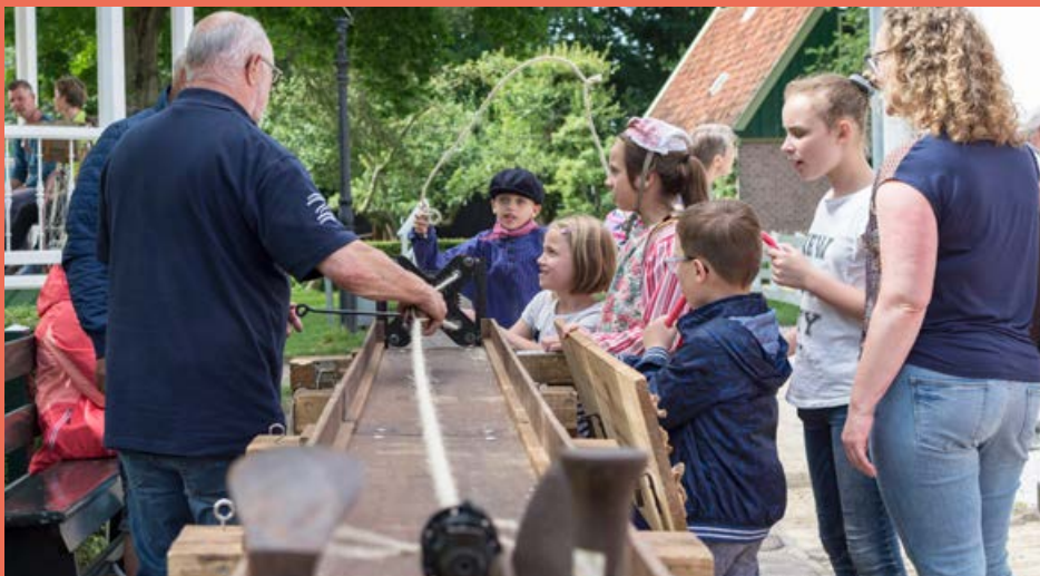
Touwslaanweekend 10 - 11 juni