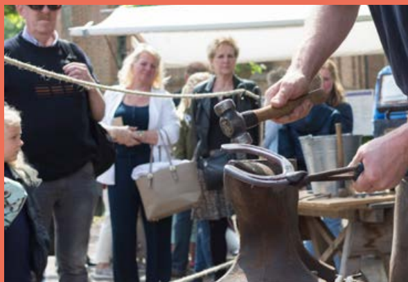
Smeedweekend 20 - 21 mei