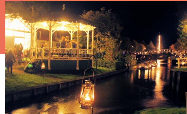
Avondopenstelling 28 oktober