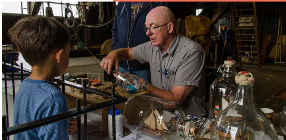
Flessenscheepjesweekend i.s.m. Flessenscheepjesmuseum Enkhuizen 4 - 6 augustus