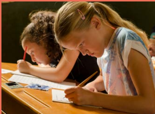
Linkshandigendag 13 augustus