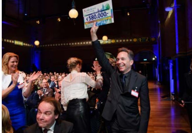
BankGiro Loterij Goed Geld Gala 2017