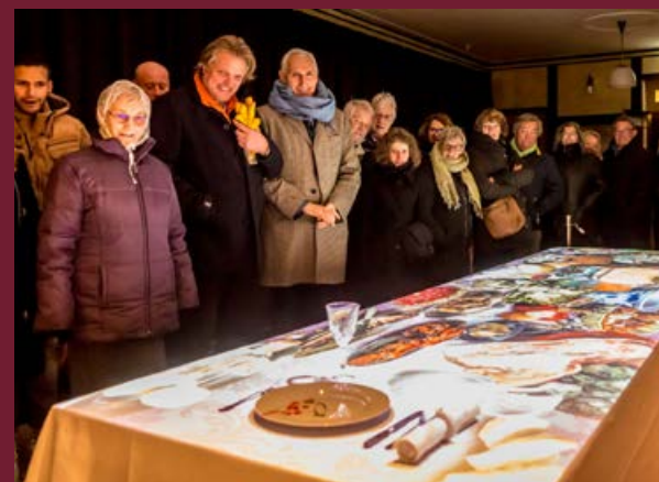
Zuiderzeelicht Bankgiro Loterij VIP avond