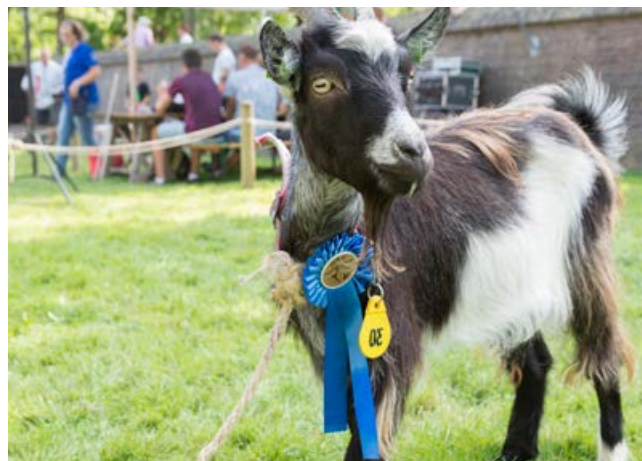
Landgeitenkeuring 27 augustus