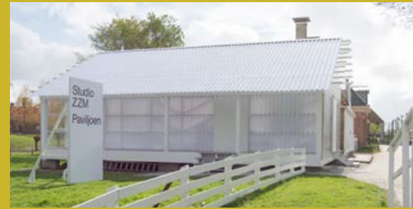
Studio ZYM - Doe-het-zelf paviljoen 1 april - 29 oktober 2017