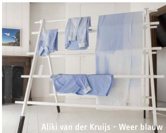
Aliki van der Kruijs - Weer blauw