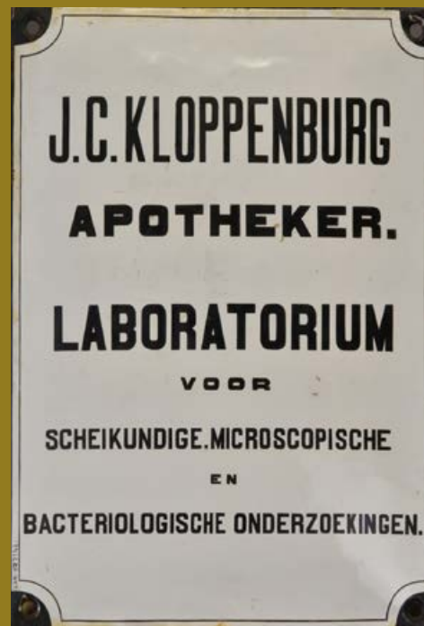
Reclamebord "J.C. Kloppenburg Apotheker" circa 1901-1930