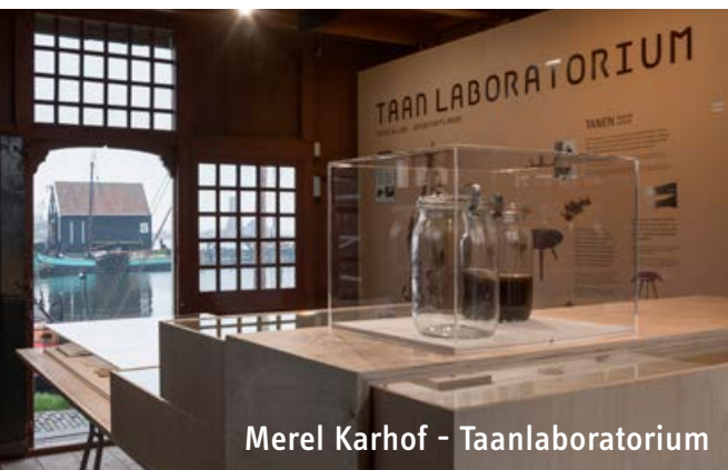
Merel Karhof - Taanlaboratorium