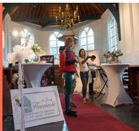
Open avond trouwen 31 augustus