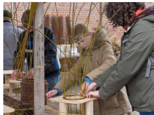
Mandenvlechtweekend 22 - 23 april