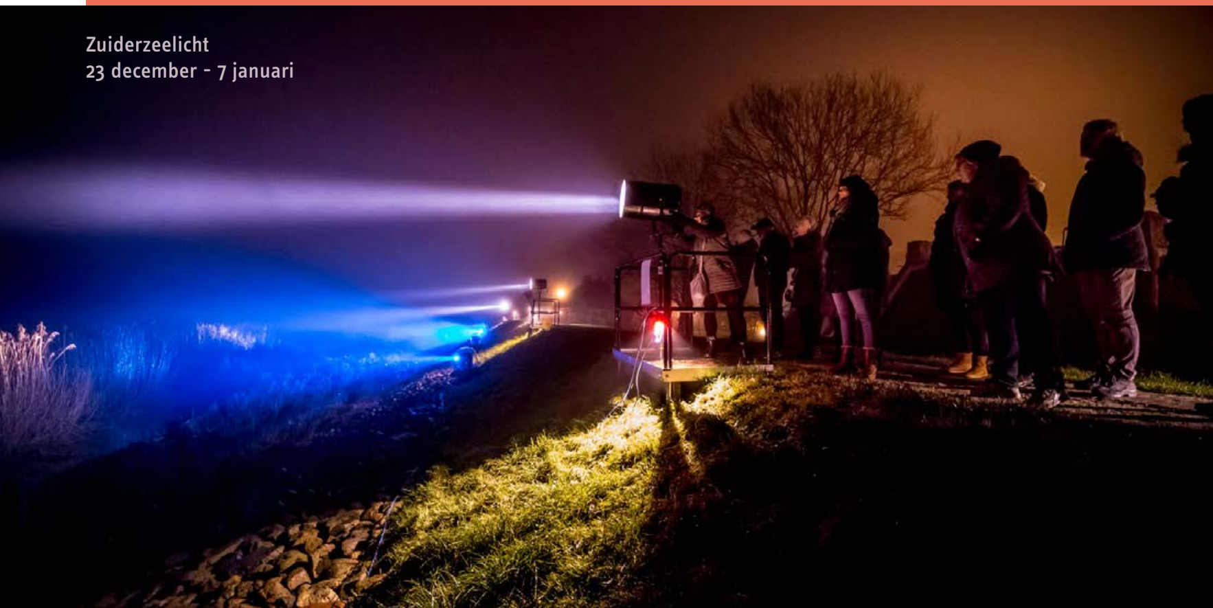
Zuiderzeelicht 23 december - 7 januari