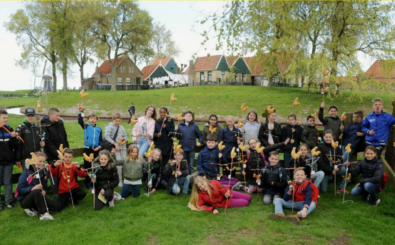
Paasfeest! 15 -17 april 2017