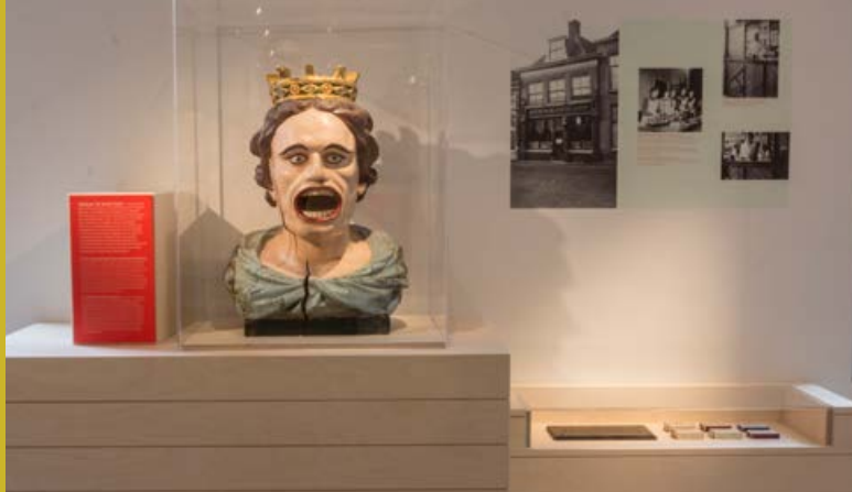
Zeg eens AAA vanaf 1 april 2017