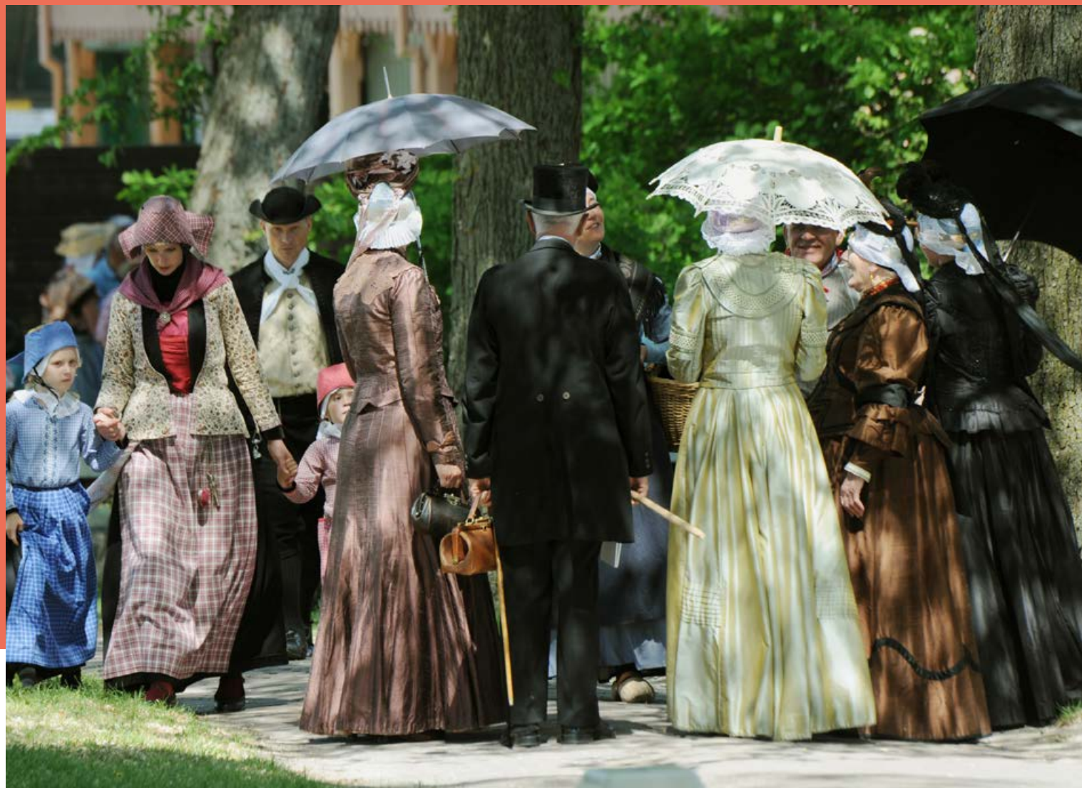
Klederdrachtfestival 27 - 28 mei