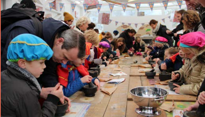
Pietendorp 25 - 26 november 3 december