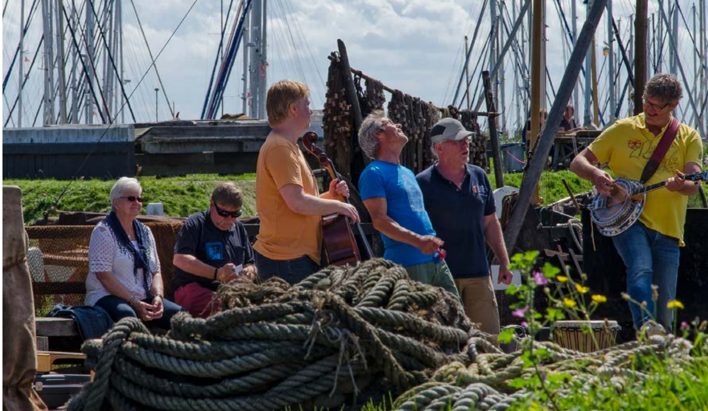
Maritiem festival 12 - 13 augustus