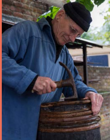
Kuipweekend 7 - 8 oktober