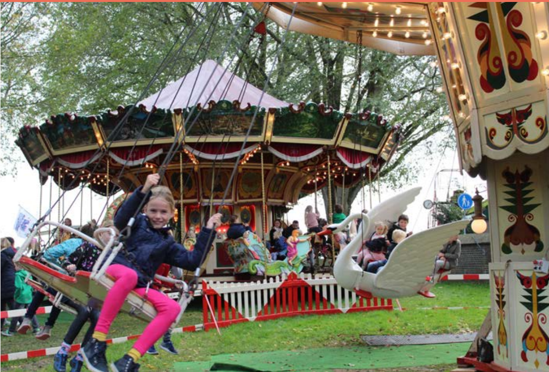
Oudhollandse kermis 21 - 29 oktober