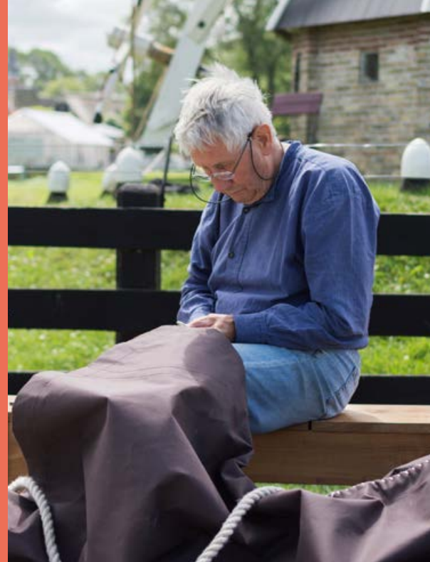
Zeilmaakweekend 1 - 2 juli