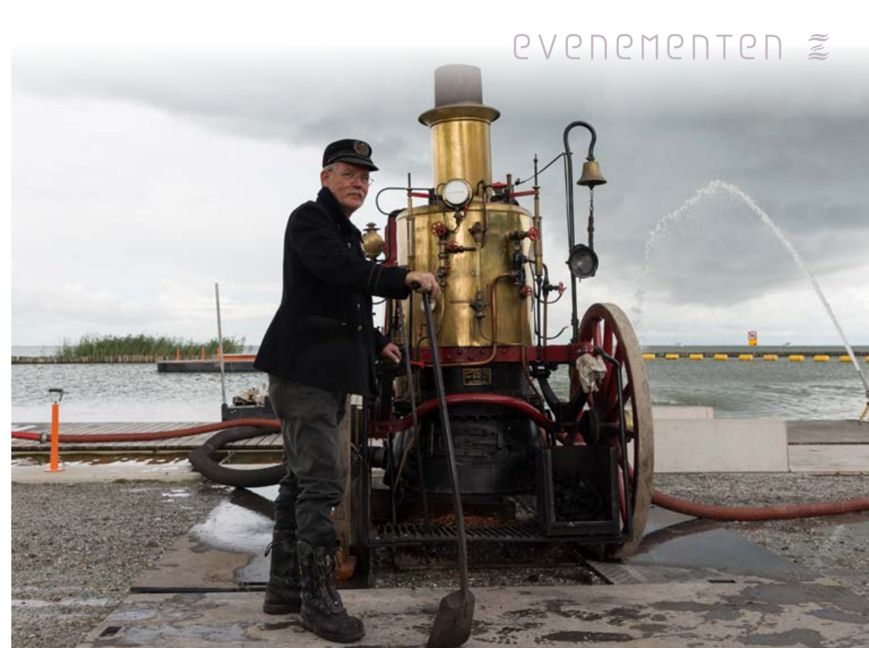
Stoomweekend 16 - 17 september