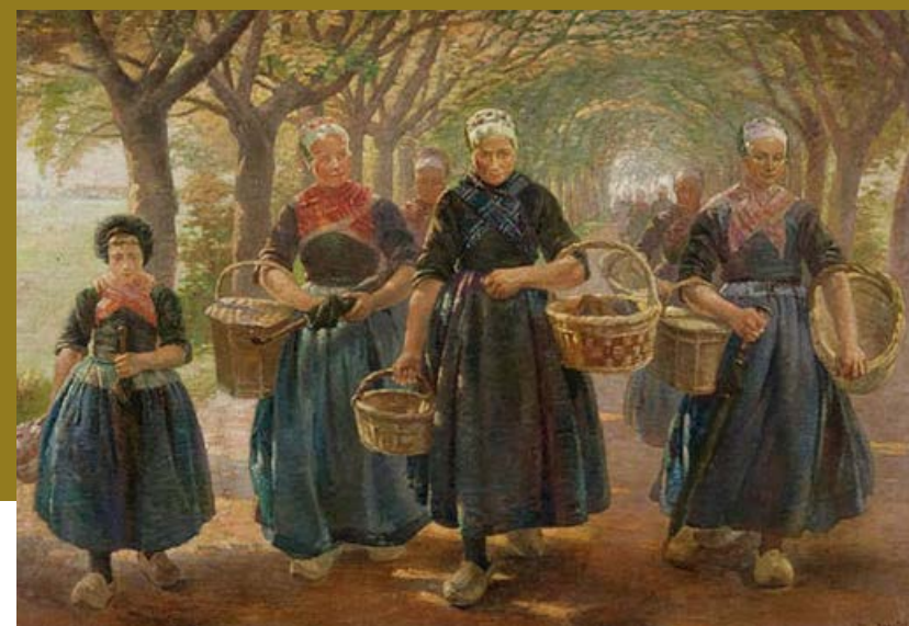
Emile Charlet Terugkeer van de markt 1885