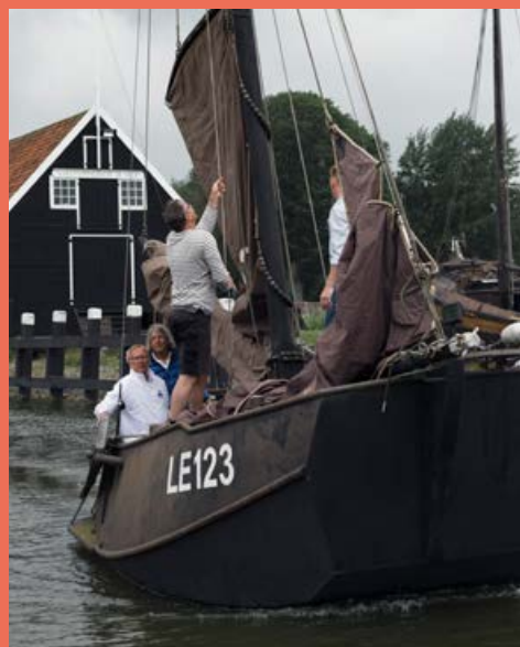
Spekbakentreffen 24 juni