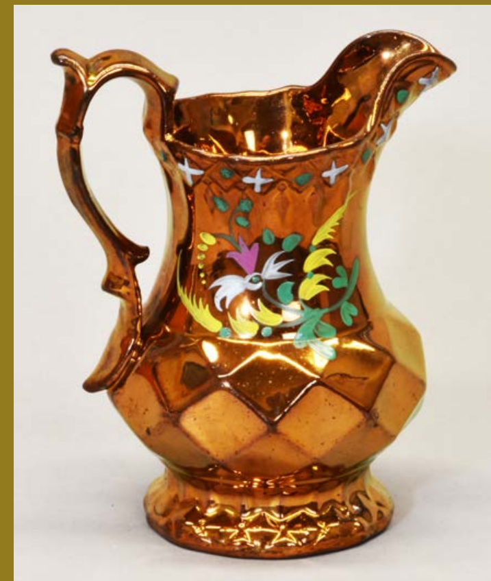
Goudsteen melkkan met beschildering circa 1880-1900