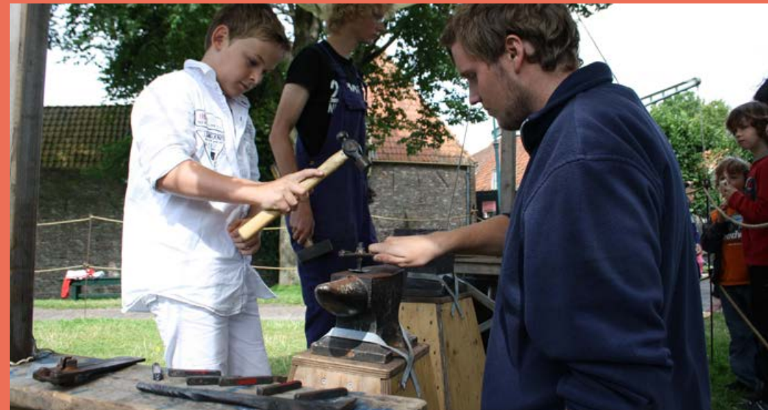
Smeedlab 22 april - 7 mei