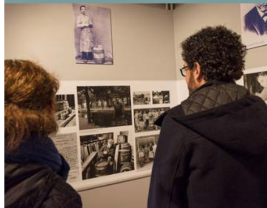
Gezicht achter het ambacht 1 april - 29 oktober 2017