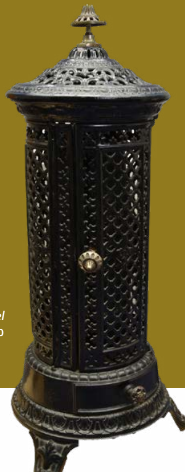
Salamander hekjeskachel circa 1900-1930