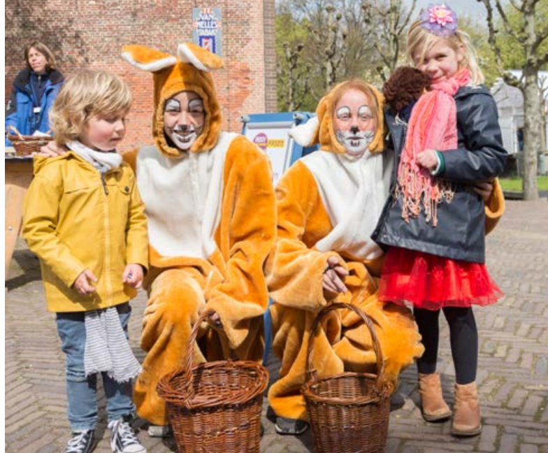
Paasfeest! 15 t/m 17 april