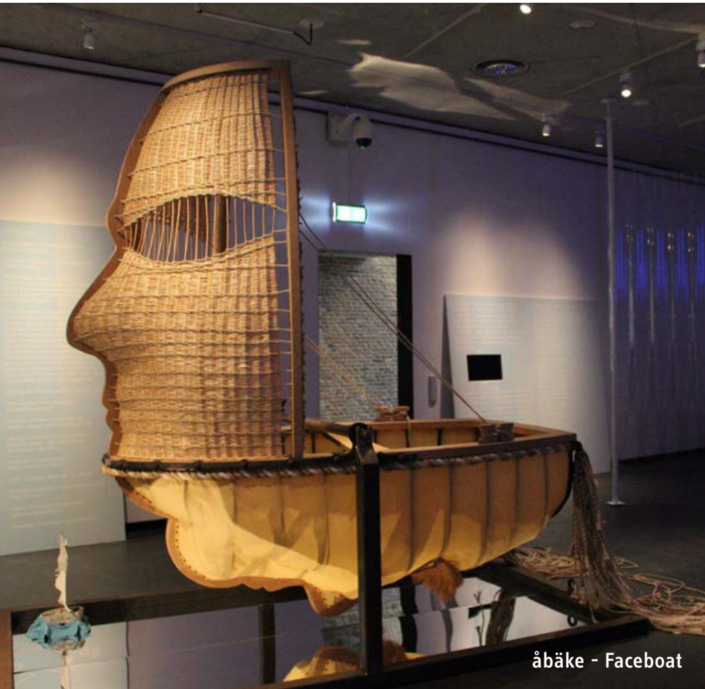
åbäke - Faceboat