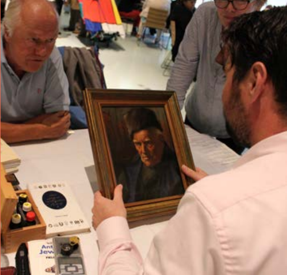
Taxatiedag 1 oktober