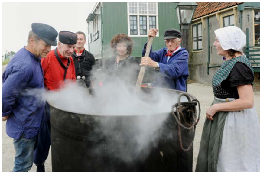
Taandagen 30 juni - 1 juli