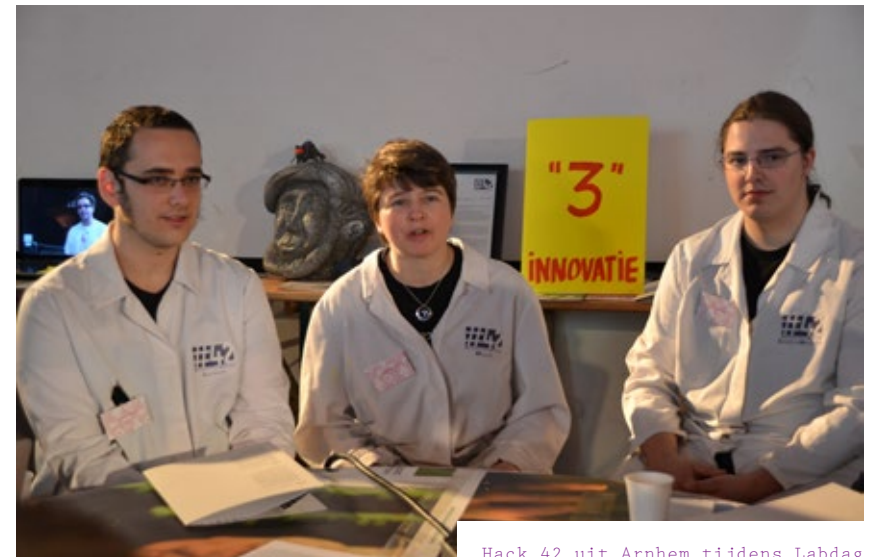
Hack 42 uit Arnhem tijdens Labdag