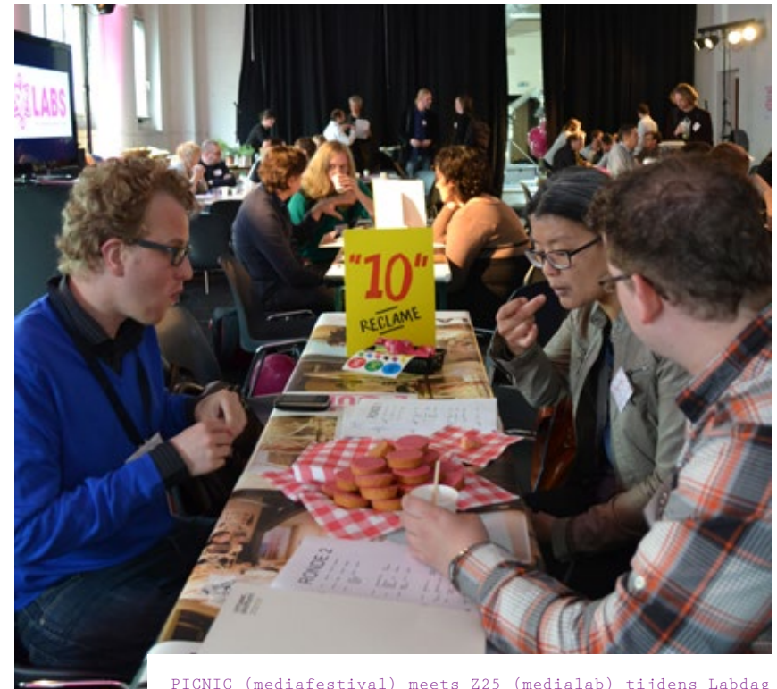
PICNIC (mediafestival) meets Z25 (medialab) tijdens Labdag

Tijdens kunst- en technologiefestival DEAF werd de Lab Dag georganiseerd: een kennisdag voor medialabs en mediafestivals. Het doel van de dag was kennismaking en het opzetten van informatie-uitwisseling tussen de organisaties en professionals. Het Fonds voor de Creatieve Industrie was ook te gast om een toelichting te geven op relevant beleid voor medialabs. Op de dag werd ook de publicatie Nederland Labland gelanceerd, met een overzicht van medialabs in Nederland.