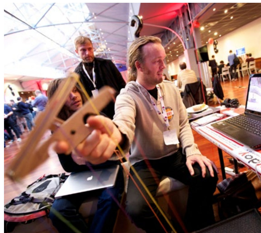
▲ How Do You Do in Gent