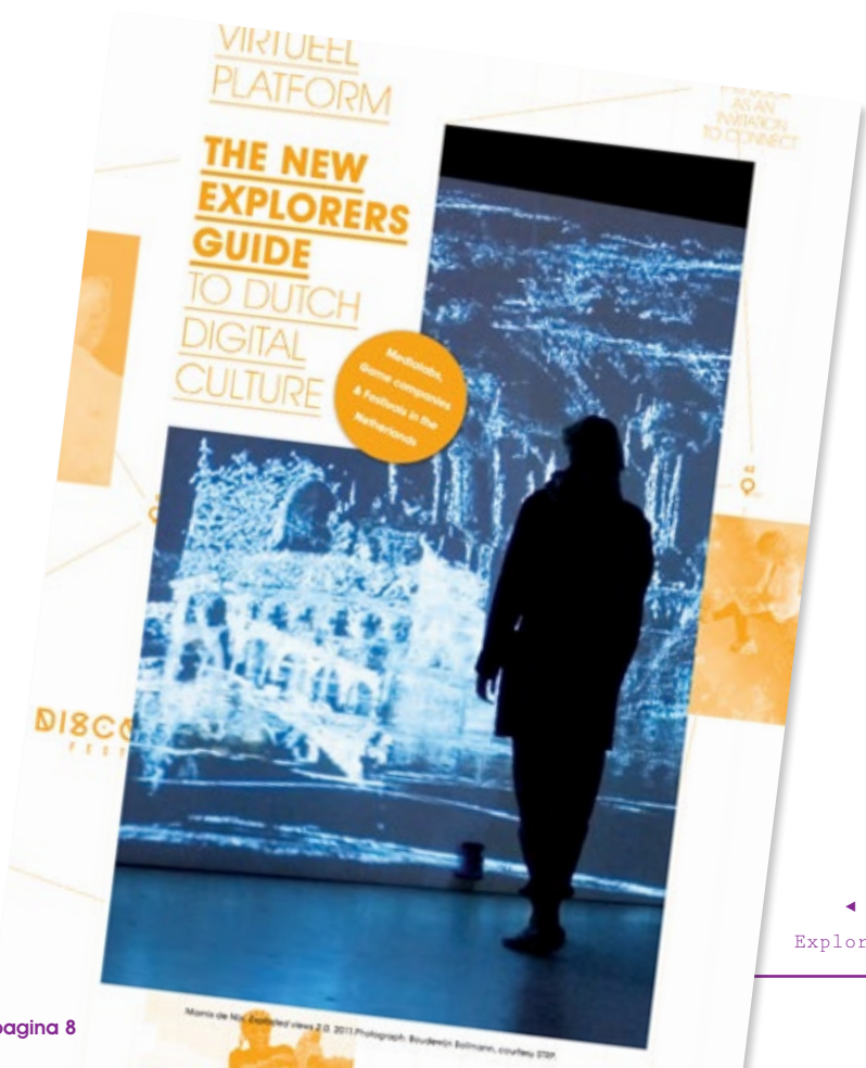
◀ ▲ The New Explorers Guide

How Do You Do 2012 was gericht op een internationale groep makers uit de digitale creatieve- en culturele sector. Nederland en België leverden voor