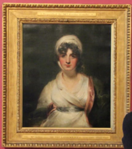
By Thomas Lawrence (1769-1830) Miss Siddons as Mrs. Butler in The Grange , ca. 1798-1799, oil on canvas The Wallace, London (acquired by the Wallace Collection, 1902)

Daarnaast legt RMT verbindingen tussen heden en verleden om daarmee te laten zien dat kunst het product is van een tijd en opvatting én om te laten zien dat die opvattingen door de tijd en culturen heen veranderen, en soms juist niet... Dit laatste wordt duidelijk gemaakt in Rewind - De verbeelding van het verleden van Gerard de Laresse tot Brad Pitt . In de tentoonstelling wordt getoond dat schilders van historiestukken uit de 17de en 18de eeuw gebruik maken van dezelfde beeldmiddelen als hedendaagse filmmakers. Beiden hadden hetzelfde doel, namelijk het verhaal zo overtuigend mogelijk weergeven en daarvoor gebruikten ze dezelfde tijdloze middelen.