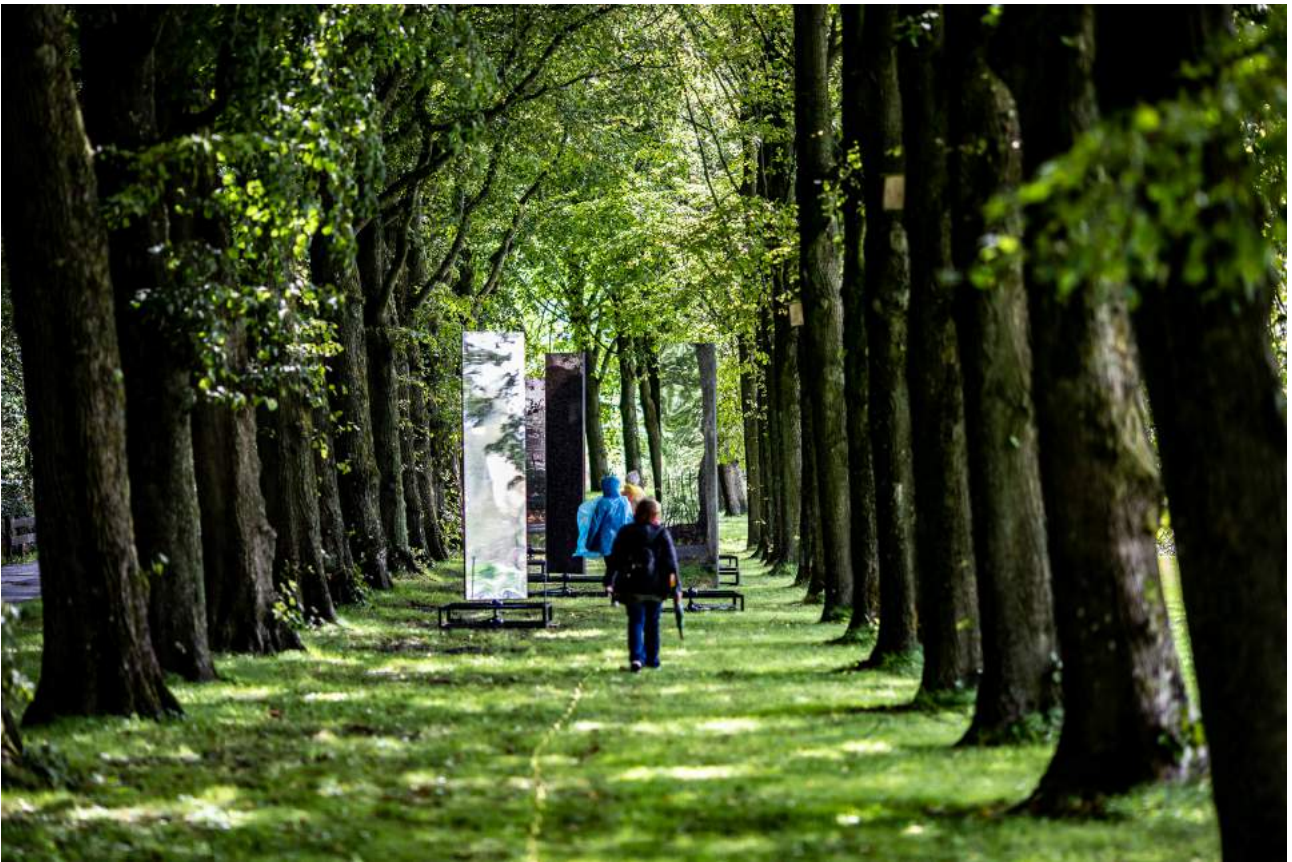
It gelok fan Fryslân