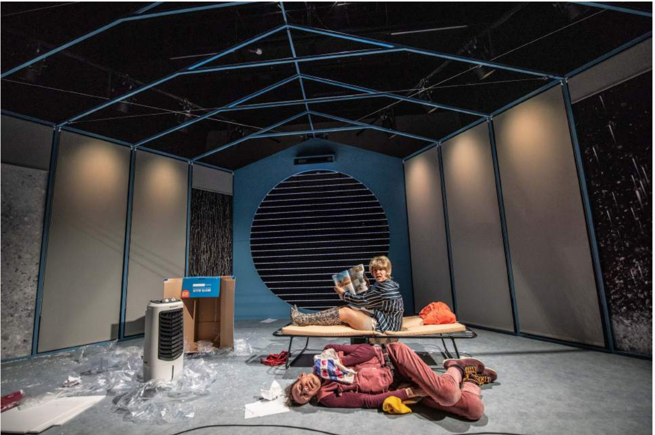
Dit wie it waar wer boven en onder: Eva Meijering en Theun Plantinga