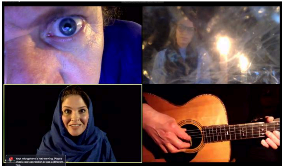
Screenshot 1000&1 nacht