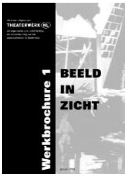
De voorkant van werkbrochure 1 Beeld in Zicht.

De discipline Dans maakt niet langer deel uit van de werkgroep. Overleg met het Landelijk Centrum voor Amateurdans blijft bestaan, maar het gaat zelf onderzoeken in hoeverre de vormgeving binnen de opleidingsactiviteiten kan worden opgenomen.