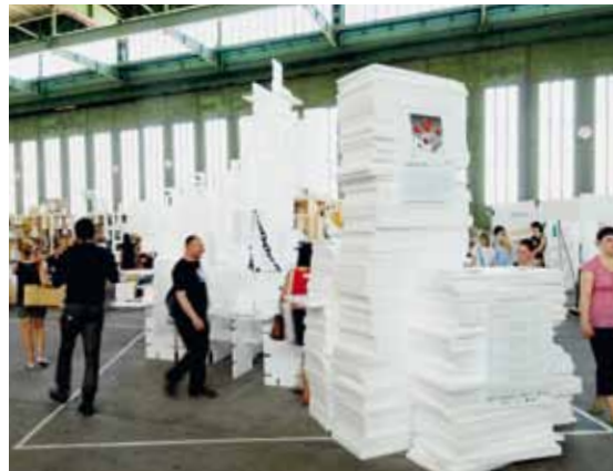
(Un)limited Dutch Design. Featuring Amsterdam ontwierp de (Un)limited Design Expo voor DMY. De expositie zelf is ook een voorbeeld van open design.

DE VOLKSKRANT Over het MakerLab van DMY: 'Een versmelting van nieuwe technologieën en een do it yourself-mentaliteit [...] in het hart van het festival.'