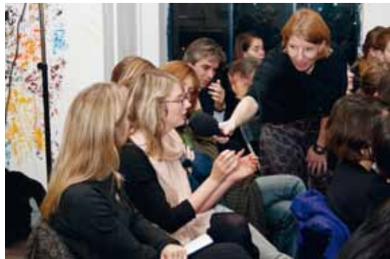
Morf Academy.