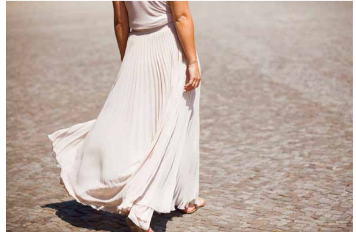
Masters of Amateurism.