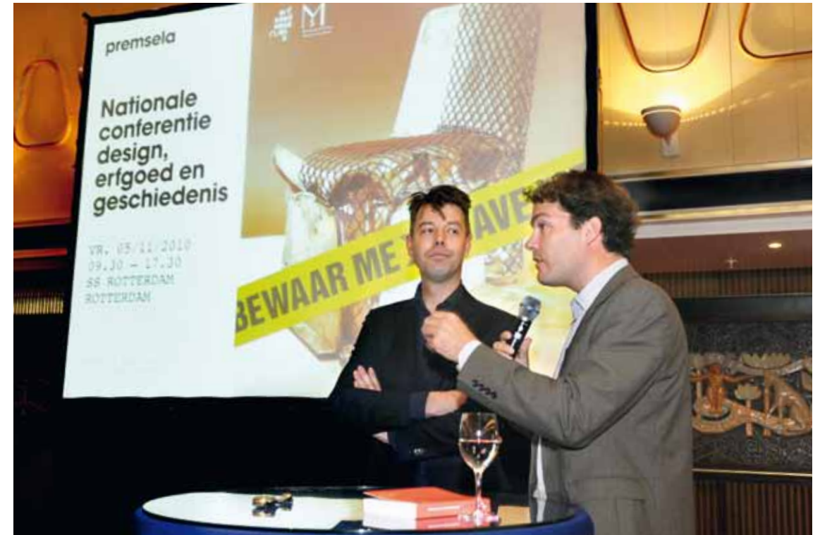
Bewaar me/Save me.

Het interview met Gijs Bakker is te downloaden op iTunes