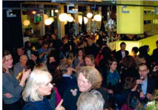
Nieuwjaarsymposium Designdenken in Bright Cities aan de Amsterdamse Zuidas.

niet alleen wordt meegenomen, bewaard, geruimd en in de boekenkast gezet, de artikelen worden door ruim tweederde van de doelgroep van A tot Z gelezen. Hoewel het blad in de eerste plaats gemaakt wordt voor studenten, is er ook een grote groep docenten en ontwerpers die Morf leest en hoog waardeert.