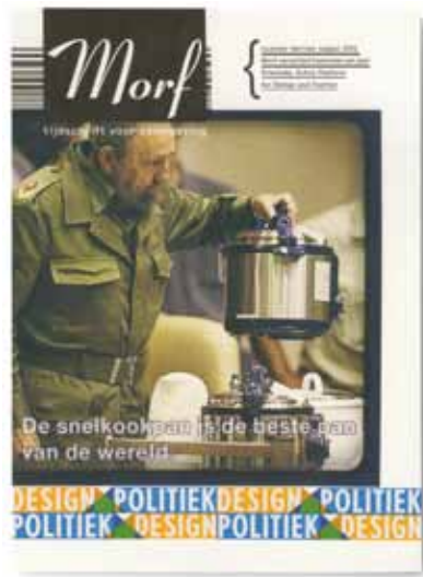
Morf 13. Ontwerp: Thijs Verbeek