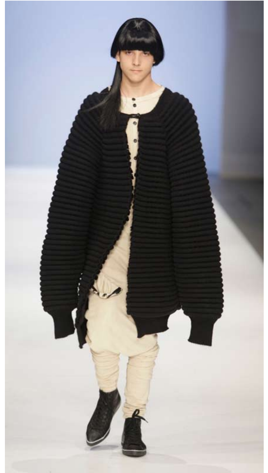
Foto pag. 20: Lyndon Douglas, met dank aan Barbican Art Gallery, Londen.

Beeld: uit de collectie Spuk & Grusel van Anneloes van Osselaer. Foto: Peter Stigter.