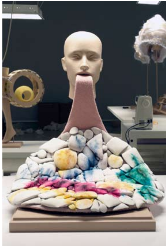
No Reference.

● De Belgische couturier Christophe Coppens ontving in 2007 de H+F Fashion Award, een geldprijs om een speciaal project te realiseren. Hij besloot zichzelf