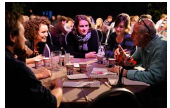
Young at Heart. Karel Martens was één van de 21 senior ontwerpers in Eindhoven. In de gesprekken met studenten en starters stond de ontwerp-praktijk centraal.