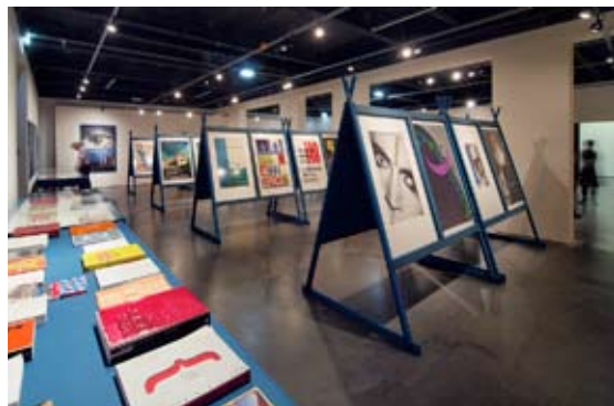
Golden Age: Highlights of Dutch Graphic Design (1890-1990). Opstelling in Breda's Museum.