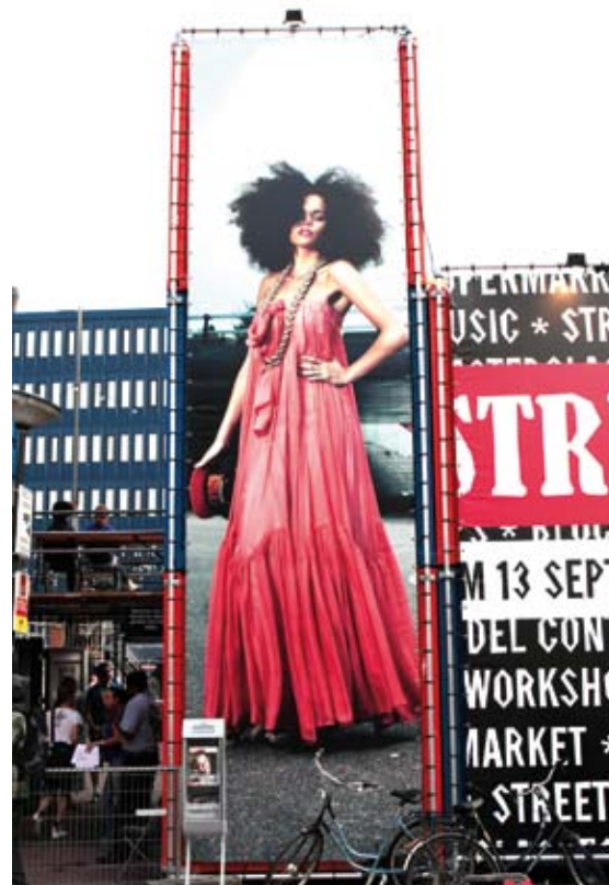
Streetlab Zuidoost. Campagnebeeld Streetlab Zuidoost 10/13 september 2008. Campagne concept: Hendsum & Young.

● In de eerste week van FreeDesign organiseerde Streetlab een vierdaags evenement in Amsterdam Zuidoost. Bij de Amsterdamse Poort werd een tijdelijke 'neighbourhood' neergezet. Jonge ontwerpers en 'performers' uit binnen- en buitenland gaven 'acte de présence' in de Supermarket , tijdens fashionshows, foto-exposities, workshops en muziekoptredens. Ook realiseerden jonge makers in één week een eerste Streetlab Made in... collectie. → Streetlab.nl