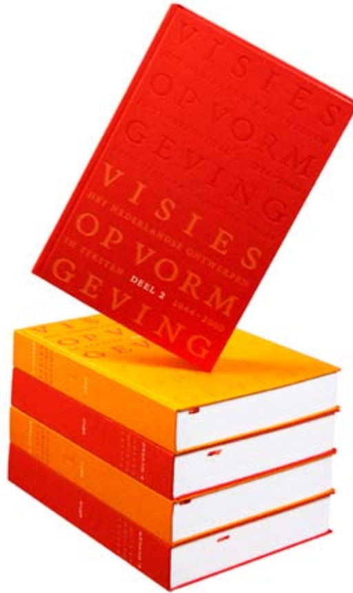
Eerste en tweede deel Visies op vormgeving.