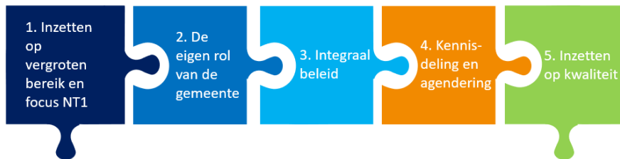
Figuur 2. Actielijnen.

In de regio zijn de taken voor de uitvoering van de geletterdheidsaanpak als volgt verdeeld. De gemeente Leeuwarden heeft als centrumgemeente vanuit het WEB-budget de volgende (wettelijke) taken: