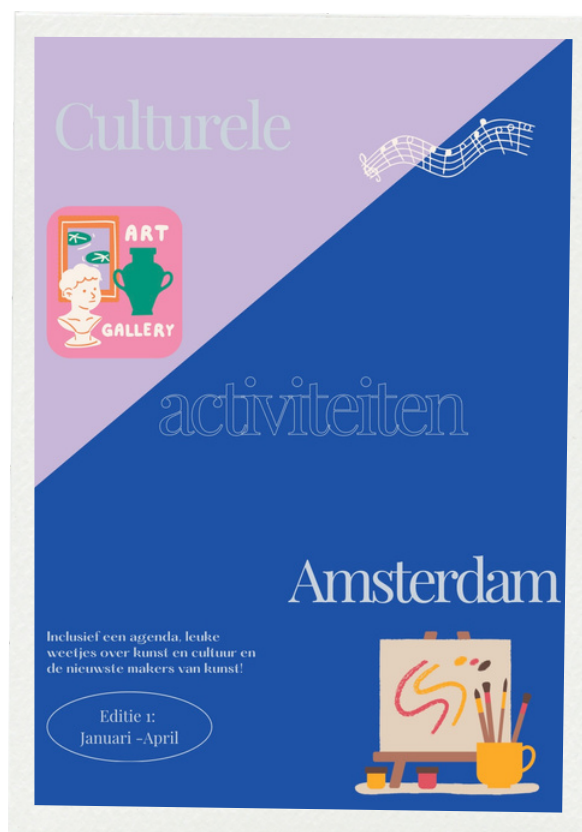
Voorbeeld van een cultuurmagazine