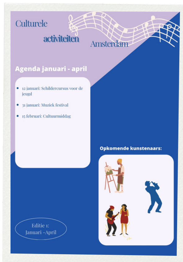
Voorbeeld poster voor in een bushokje of aanplakbord

De gemeente Amsterdam kan door middel van het opstellen van een cultuurmagazine bijdragen aan het zichtbaar maken van het aanbod van de kunst- en cultuurinstellingen. Uit de bevindingen blijkt dat bij de groep die bewust is van het aanbod veel van deze kennis ophaalt uit buurtmagazines zoals 'IJopener'. Een belangrijke bevinding uit de verkenning bij de buurtbewoners, die niet bekend zijn met het aanbod, is dat een buurtmagazine zoals 'IJopener' hen zal helpen met het kennismaken met het aanbod (zie Bijlage B). Uit de bevinding blijkt dat bewoners positief zijn over een mogelijk magazine met een agenda van de culturele activiteiten van de kunst- en cultuurinstellingen in Oost. Hierdoor krijgen zij te weten welke activiteiten waar plaatsvinden, denk aan concerten of tentoonstellingen. 'Amsterdam Magazine' is een bestaand cultuurmagazine dat online te vinden is (Amsterdam Magazine, z.d.). Uit de bevindingen blijkt echter dat deze online versie de bewoners niet bereikt. De actie die de gemeente hiervoor kan ondernemen is een papieren magazine introduceren die op lokale punten in de stad te krijgen is. Daarnaast kan de gemeente kiezen voor een duurzamere optie. Voor deze versie kan er een grote 'cultuur poster' op plekken worden gehangen zoals bushokjes of op een aanplakbord.