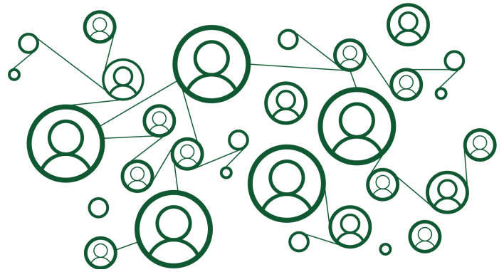
Figuur 1. Dwarsverbanden.