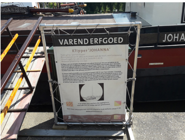
Varend erfgoed, Klipper Johanna.