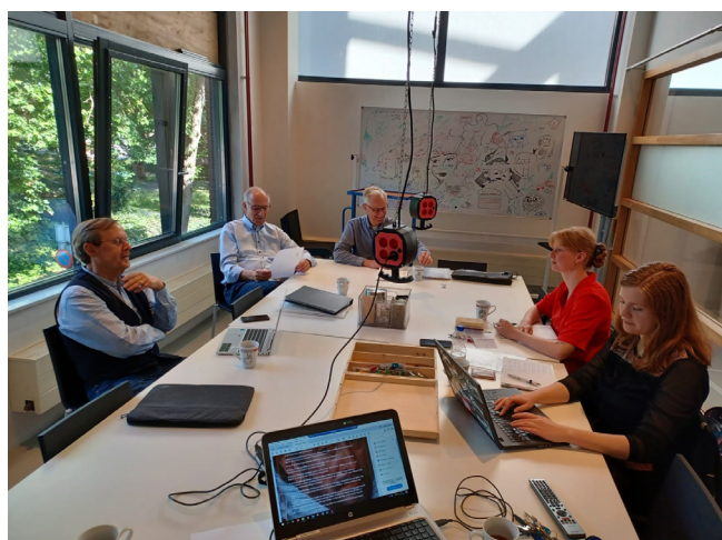
Studenten nemen een interview af bij Streekarchief Midden-Holland.

Van mei tot en met juli 2022 hebben we verkennend onderzoek gedaan naar erfgoedgemeenschappen in de gemeente Gouda, een middelgrote en voor het onderzoeksteam goed bereikbare stad. Voor de verkenning gebruikten we een op de etnografie geïnspireerde aanpak: kwalitatief onderzoek gebaseerd op veldwerk, met name observaties en semigestructureerde interviews. Een team van zes studenten/pas afgestudeerden verrichtte dit onderzoek in verschillende wijken van Gouda. Vertrekpunt waren buurthuizen en de informatie van sleutelfiguren. De via hen geïdentificeerde erfgoedgemeenschappen zijn bevroegd over het erfgoed waar ze zorg voor dragen, de samenstelling van en contacten buiten de groep en de mate waarin ze naar buiten treden.