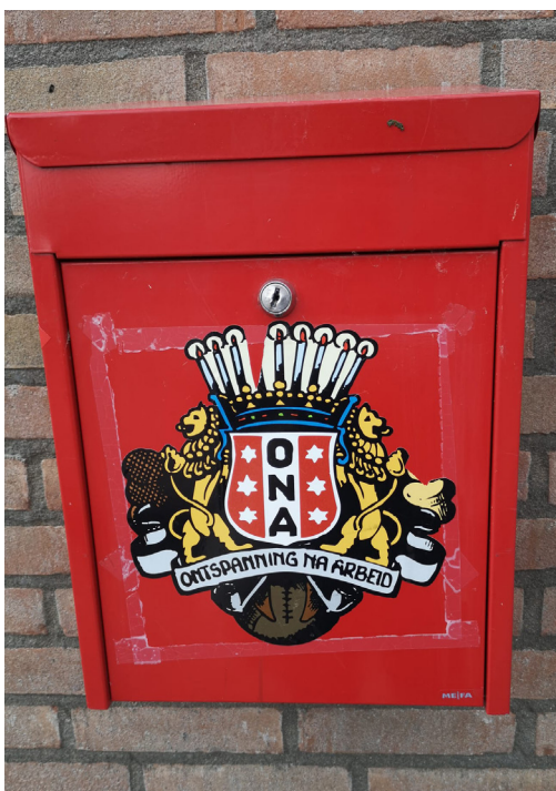
Voetbalvereniging ONA bestaat 100 jaar en heeft een aantal vrijwilligers dat al decennia lang actief is bij de club.