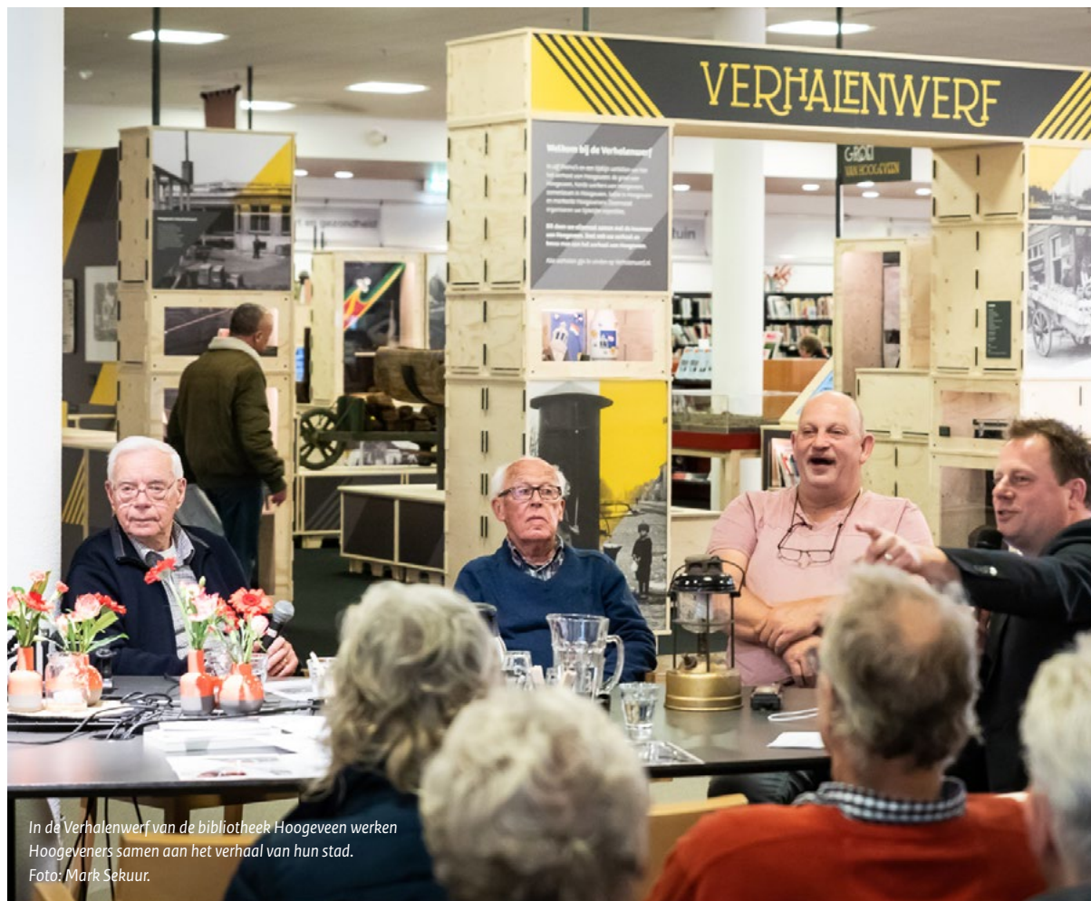
In de Verhalenwerf van de bibliotheek Hoogeveen werken Hoogeveeners samen aan het verhaal van hun stad.

Niet alleen worden verschillende werkvormen door de respondenten genoemd (zie bijlage 1.D), ook laat het onderzoek zien dat het voeren van gesprekken (met diverse doelen) een uitdaging blijft.