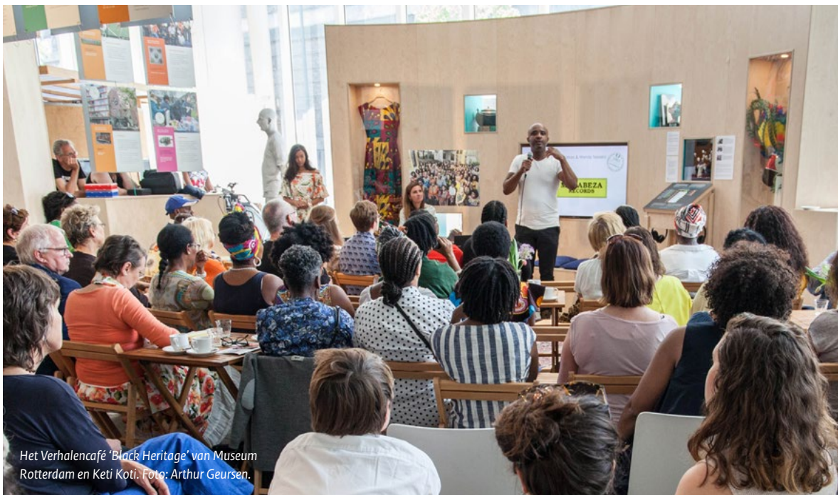
Het Verhalencafé 'Black Heritage' van Museum Rotterdam en Keti Koti.

Samenwerking en netwerkvorming gaat om het verbinden van mensen en organisaties of het aansluiten bij bestaande samenwerkingen of netwerken. Er zijn veel werkwijzen en werkvormen gebruikt door de respondenten om mensen bij elkaar te zetten, in gesprek te brengen en aan het werk te laten gaan. (Zie bijlage 1.D. voor de werkvormen die genoemd zijn door de respondenten.) Soms worden formele afspraken gemaakt zoals in een convenant. Zo sprak een respondent over een overeenkomst tussen overheidsinstellingen en erfgoedverenigingen om een bepaald traject te beginnen en onderhouden. Steeds vaker wordt bij erfgoedinstellingen een specifieke