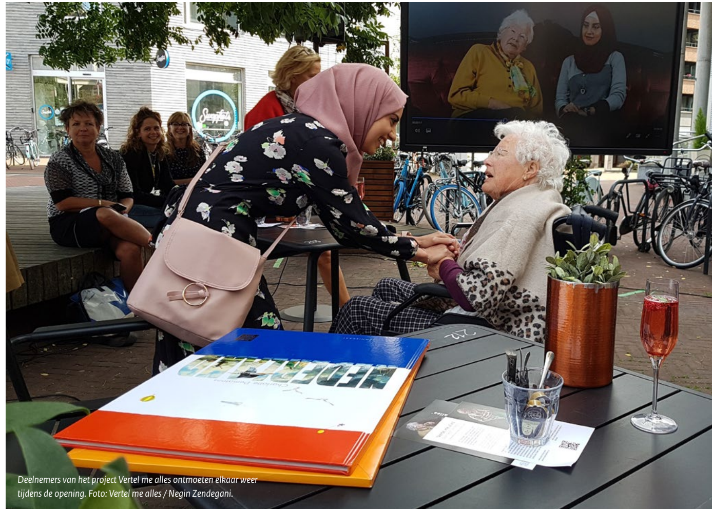
Deelnemers van het project Vertel me alles ontmoeten elkaar weer tijdens de opening.

Het onderzoek laat zien dat werken in de geest van Faro ook om een andere positionering van de sector, organisatie en professional vraagt. Professionals en organisaties moeten open, zichtbaar en aanspreekbaar zijn. Hoe word je door anderen gezien? Hoe kijk je zelf naar anderen? Een respondent zegt bijvoorbeeld: 'Ik denk dat dat heel slim van de gemeente is om dat op die manier te positioneren in zo'n dorpskern.' (R34) Respondenten zijn – bewust en onbewust – aan het denken over de verhoudingen tussen erfgoed en andere domeinen en tussen erfgoed en de samenleving.