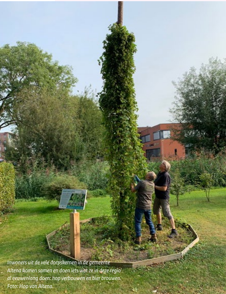
Inwoners uit de vele dorpskernen in de gemeente Altena komen samen en doen iets wat ze in deze regio al eeuwenlang doen: hop verbouwen en bier brouwen.

Voor de duidelijkheid: onder een strategie wordt hier een (langetermijn)plan bedoeld waarmee doelstellingen kunnen worden gerealiseerd. Een strategie kan daarbij een of meer werkwijzen omvatten, terwijl een werkwijze een toegepaste methode, aanpak of projectvorm is. Uit de data-analyse van de interviews komen vooral werkwijzen naar voren die door stichtingen, erfgoedinstellingen en overheden zijn ingezet om burgers bij erfgoedkwesties te betrekken en om erfgoed te gebruiken voor maatschappelijke doelen.