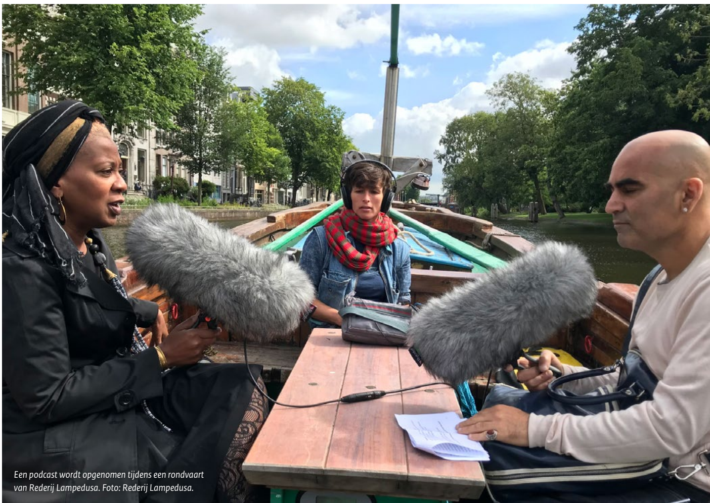
Een podcast wordt opgenomen tijdens een rondvaart van Rederij Lampedusa.

Onder de respondenten wordt OF/BY/FOR ALL niet alleen als een methodiek beschreven, maar ook als een tool, een gedachtegoed en een 'fundamentele organisatorische verandering in de hele organisatie'. In elk geval gaat het erom, zeggen de respondenten, dat in een organisatie gekozen moet worden voor een participatieve aanpak en werkwijze. Het vraagt om een breed gedragen visie op participatie en een bijpassende strategie.