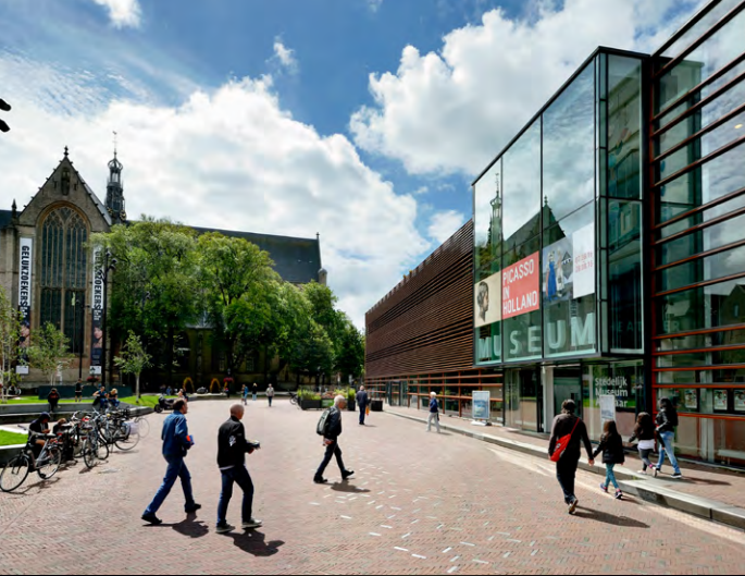
LES BELLES HOLLANDAISES