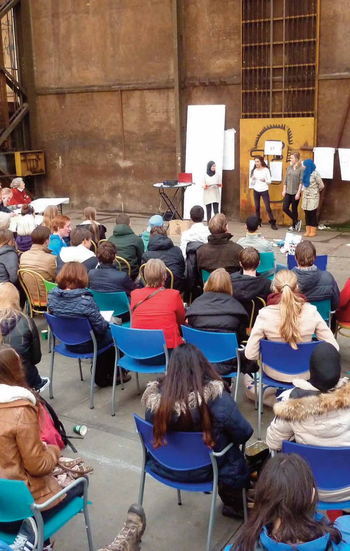
Leerlingen van UniC (havo-vwo) - 8 november 2013, Werkspoor-kathedraal

Al in het vroege voorjaar van 2012 opperde één van de conservatoren om voor een geplande activiteit de sleutels te bemachtigen van een reusachtige leegstaande fabriekshal in het hart van het gebied. De hal bleek eigendom van de heer Krooijmans die zijn zaken liet behartigen door een vriendelijke dame op een kantoor in Hilversum, boven een showroom met dure auto's. De hal kon worden gekocht of gehuurd maar dat wilde al enkele jaren niet vlotten.