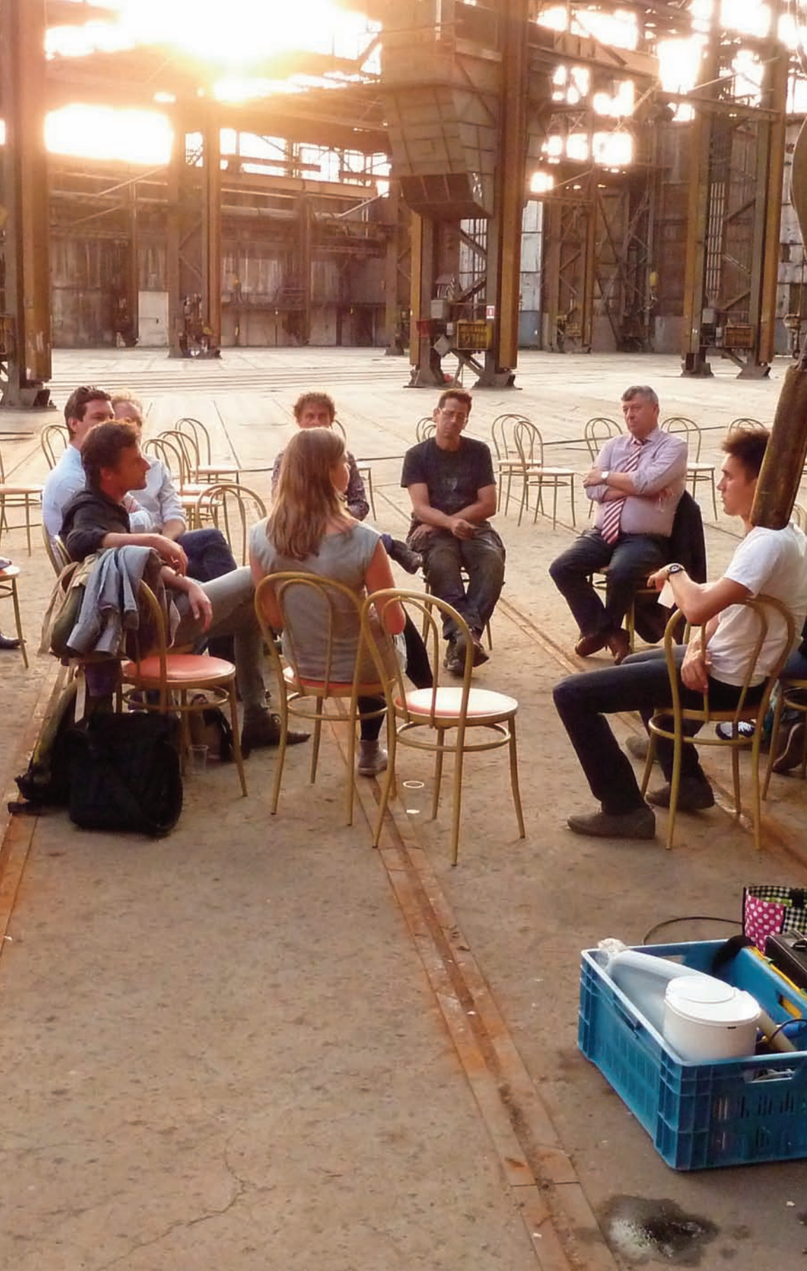
Cartesiustafel - 3 september 2012, Werkspoorkathedraal