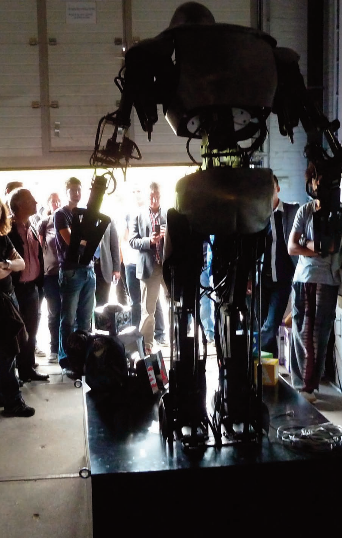
RobotMatch - 11 september 2012, CAB-gebouw