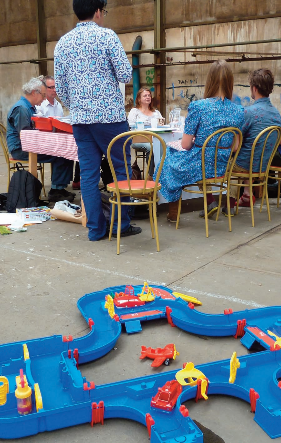
De Kracht Van Doen - 2 juni 2014, Werkspoorkathedraal