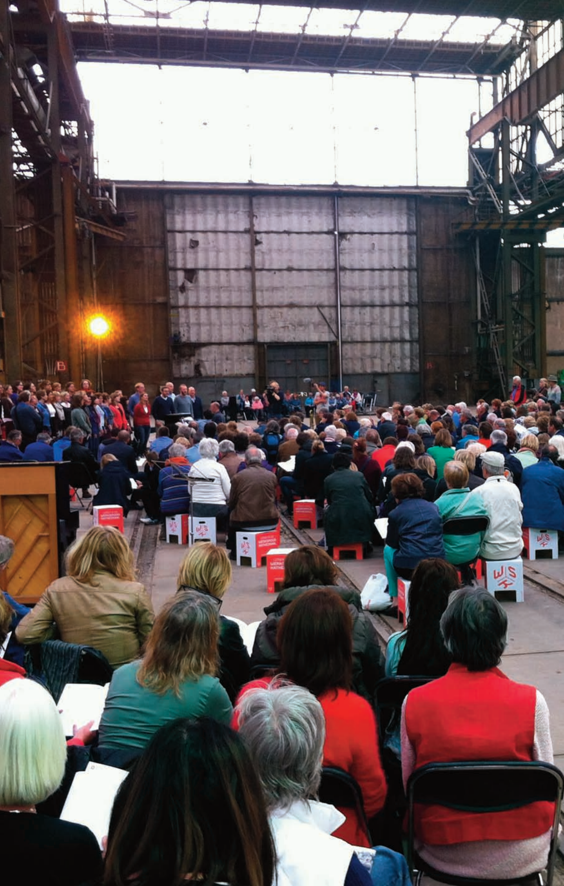
Werkspoor Koren Opera - 20 juni 2015, Werkspoorkathedraal