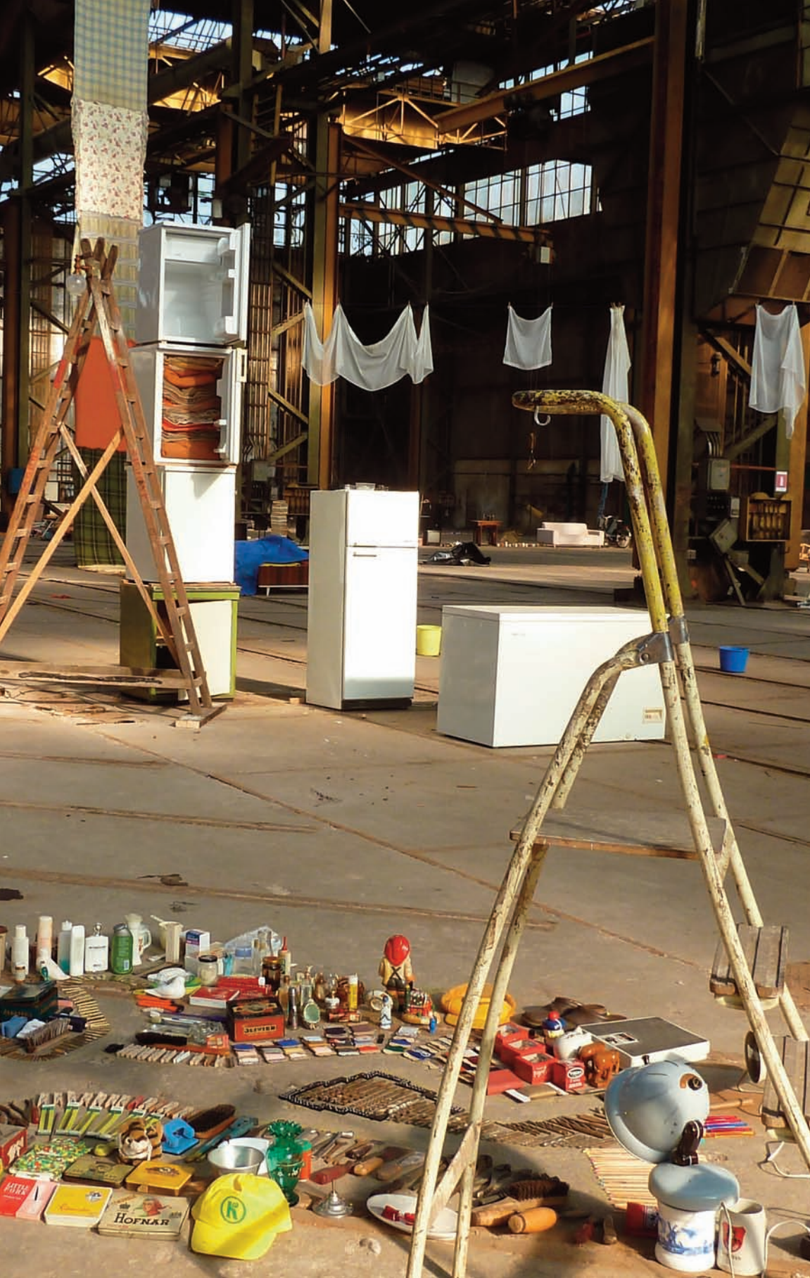
Hangend Huis, een spoor van herinneringen. Een theatrale installatie van LAB 0.41 - 29 maart t/m 1 april 2013, Werkspoorkathedraal