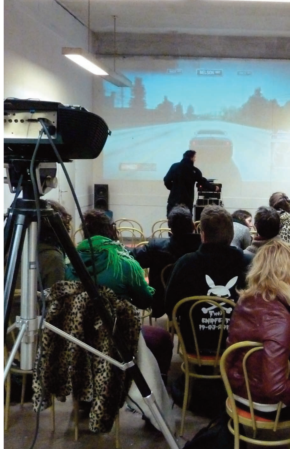
Spontane filmavond - 11 januari 2013; kantine van de Werkspoorathedraal

We kunnen moed putten uit acties van jongeren die wereldwijd verzet tonen en de politiek mede verantwoordelijk achten voor de huidige klimaatontwrichting. Van groot belang daarbij is dat we gezamenlijk optimaal de kennis en ervaringen gebruiken die zijn opgedaan met de realisatie van initiatieven in de stad. Om die reden volgt hierna uitleg