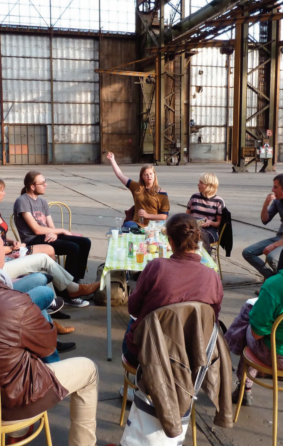
Cartesiustafel - 1 september 2014, Werkspoorkathedraal

Conservatoren van het Cartesius Museum, actief op wisselende momenten