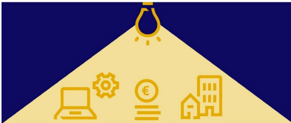
Figuur 6: Alle rijksbezittingen verdienen het te worden belicht