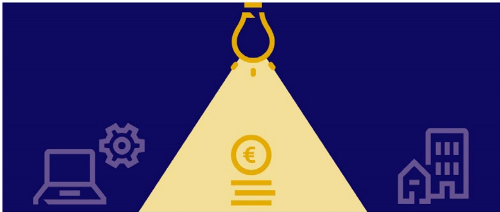
Figuur 1: Huidige jaarverslagen ministeries belichten alleen financiële bezittingen