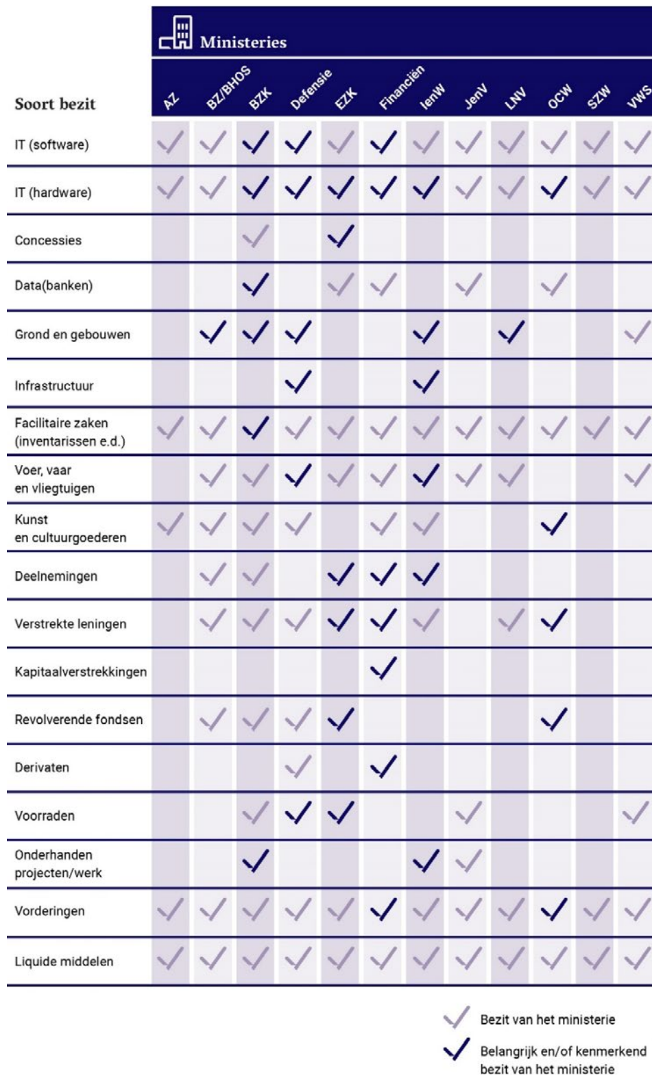
Figuur 2: Overzicht soorten bezittingen per ministerie