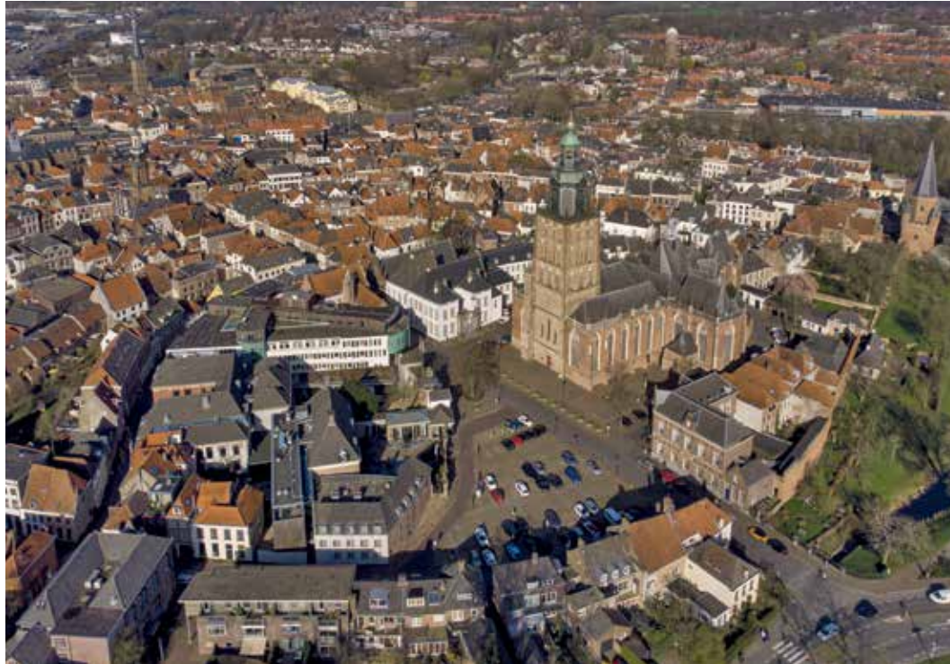
Nieuwstadskerk