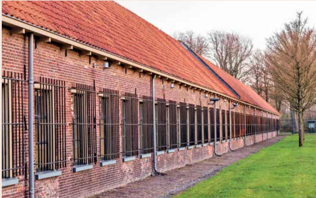
Veenhuizen Gevangenis museumgebouw

Noordenveld heeft met Veenhuizen Unesco Werelderfgoed binnen de grenzen. Veenhuizen is 1 van de 4 Koloniën van Weldadigheid, die in 1818-1825 ontstonden als integrale oplossing voor armoedebestrijding