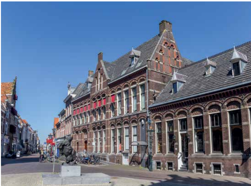
Binnenstad van Kampen

Voor de besteding van het prijzengeld werd een aantal projecten uitgekozen door een jury van 'Kamper Koppen'. Die projecten hadden niet alleen betrekking op de historische binnenstad. Zo is er voor Brunnepe een cultuurhistorische route ontwikkeld en zijn er twee trommels uit de negentiende eeuw hersteld. Deze trommels zijn gebruikt door muzikanten van een (militair) korps. In Kampen zijn altijd veel militairen geweest; de Van Heutszkazerne is hier een bewijs van. In dit complex zijn nu het Stadsarchief, bibliotheek en het archeologische en museale depot van de gemeente Kampen ondergebracht.