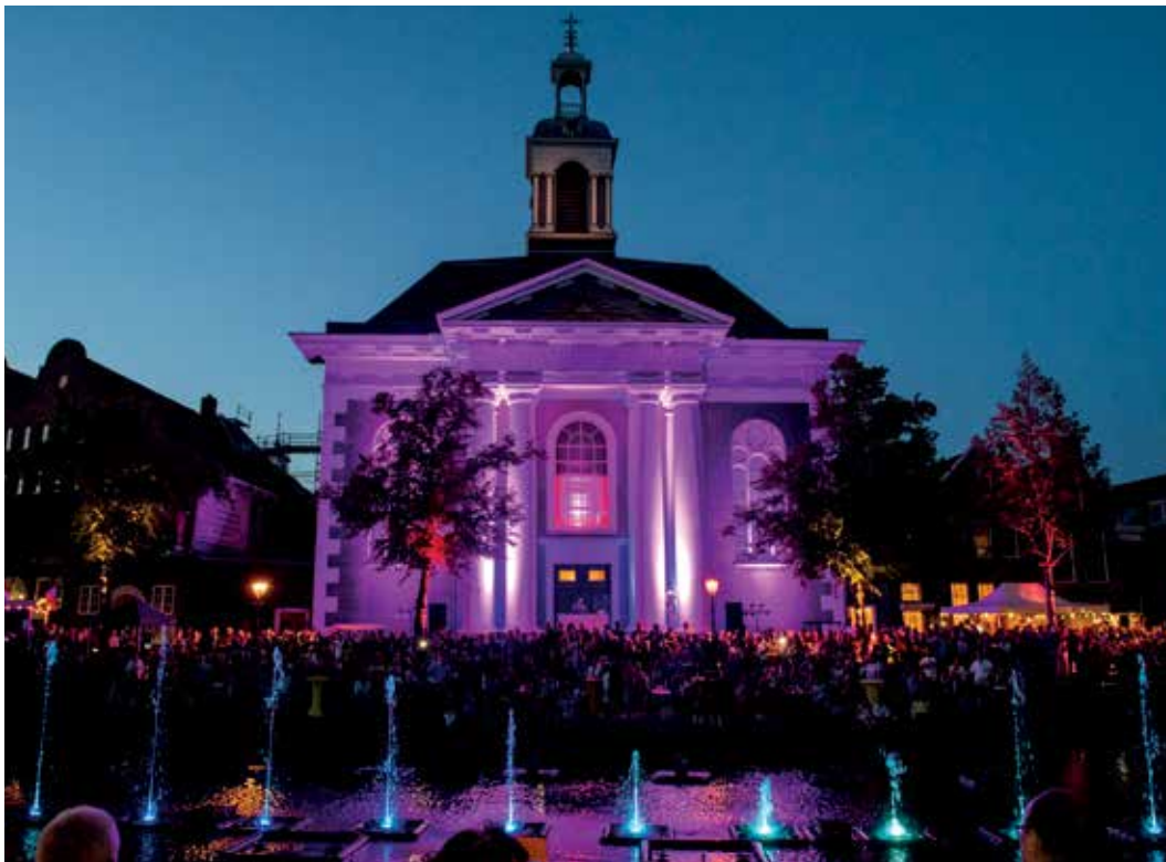
2017: de oplevering van de herinrichting van de Lange Haven werd groots gevierd

In die jaren werden bijzondere monumenten gerestaureerd en kregen ze nieuwe bestemmingen, de Lange Haven kreeg een authentieke inrichting met meer ruimte voor evenementen én aanlegplaatsen, herontwikkelingsprojecten zijn gestart. De verbindende lijn is en blijft de historische stad en het typerende jenevererfgoed. De bibliotheek, de museummolen, het Stedelijk Museum Schiedam en het Jenevermuseum zijn geclusterd in het museumkwartier.