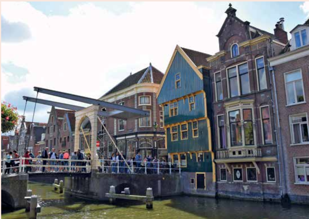
Kuipersbrug in Alkmaar

De stad is ontstaan op een strandwal, waarover een lange landweg naar het zuiden van Holland liep. Het was van origine een agrarische nederzetting, die gecentreerd was rond de in de 10e eeuw