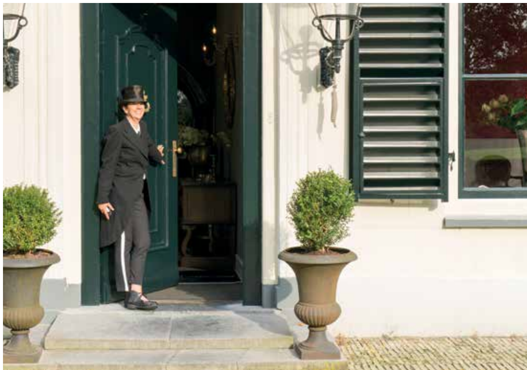
Havezathe Westrup in Dwingeloo

Deze erkenning bracht een enorm momentum teweeg waar het erf-