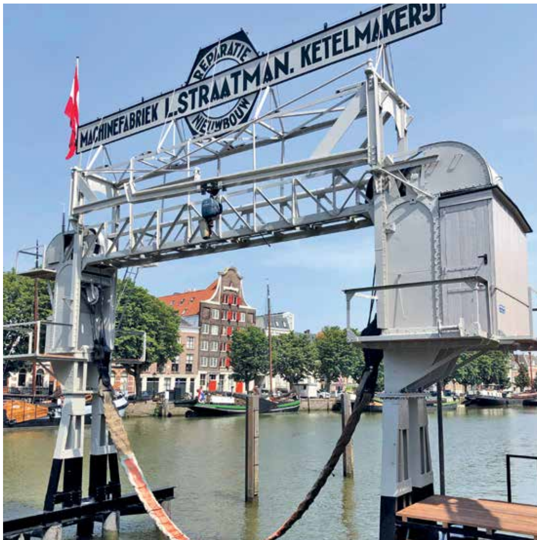
De restauratie van het schroevendok trok grote belangstelling

Er is grote betrokkenheid van de Dordtenaren. Zij zijn trots op hun geschiedenis en hun monumenten. Monumenteneigenaren onderhouden hun monumenten goed en zetten zich in samenwerking met de gemeente actief in voor de verduurzaming van hun monumenten. Er is ook aandacht voor jonge monumenten. Aan de actie Kies je monument, waarbij bewoners zelf mochten stemmen over nieuwe gemeentelijke monumenten, deden 1200 Dordtenaren mee. Tekenend is