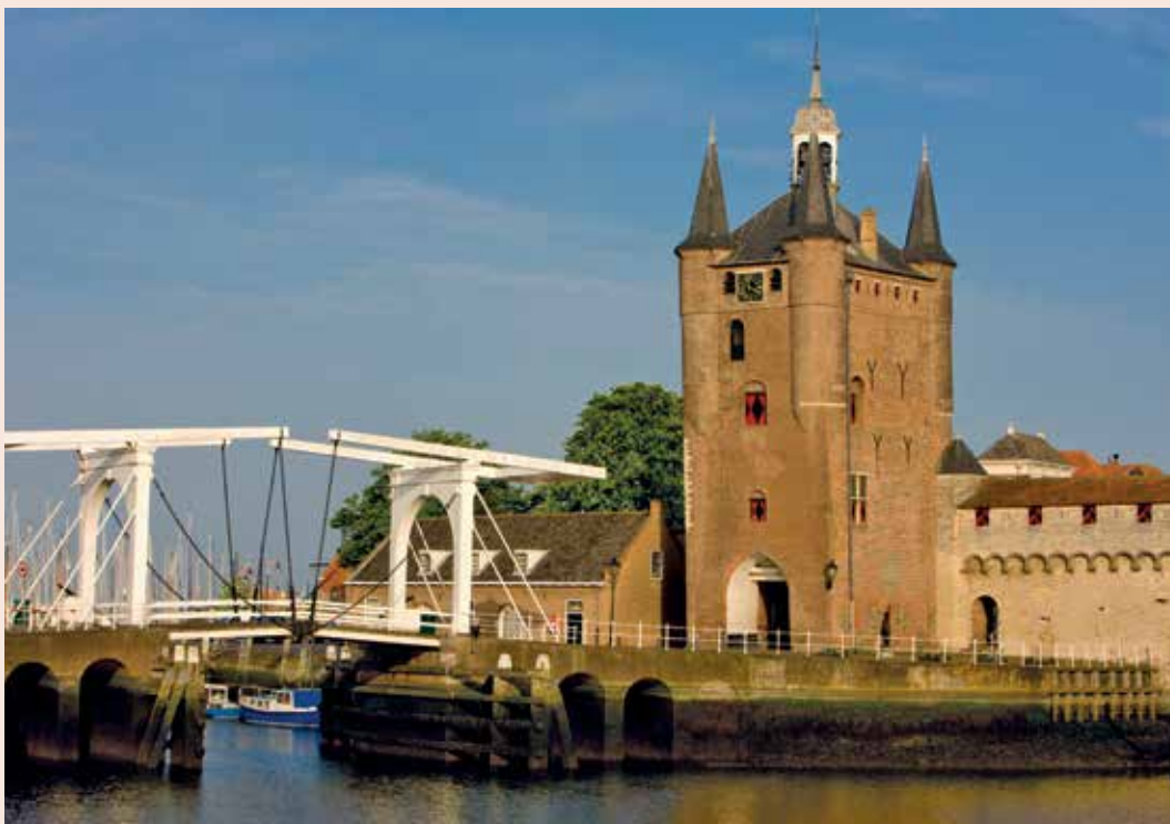
Houten klapbrug in Zierikzee

Schouwen-Duiveland omvat vele kernen, waarvan Zierikzee en Brouwershaven in het verleden stadsrechten hebben verkregen. Het eiland wordt omringd door de Noordzee, Nationaal Park Oosterschelde en de Grevelingen. Op dit moment zijn er in de gemeente 810 rijksmonumenten en 384 gemeentelijke monumenten, met een grote diversiteit: middeleeuwse woonhuizen, pakhuisen, kerken, boerderijen, molens, buitenplaatsen, landhuizen en kastelen. Met de Oosterscheldekering aan de ene kant, de Zeelandbrug en het Watersnoodmuseum aan de andere