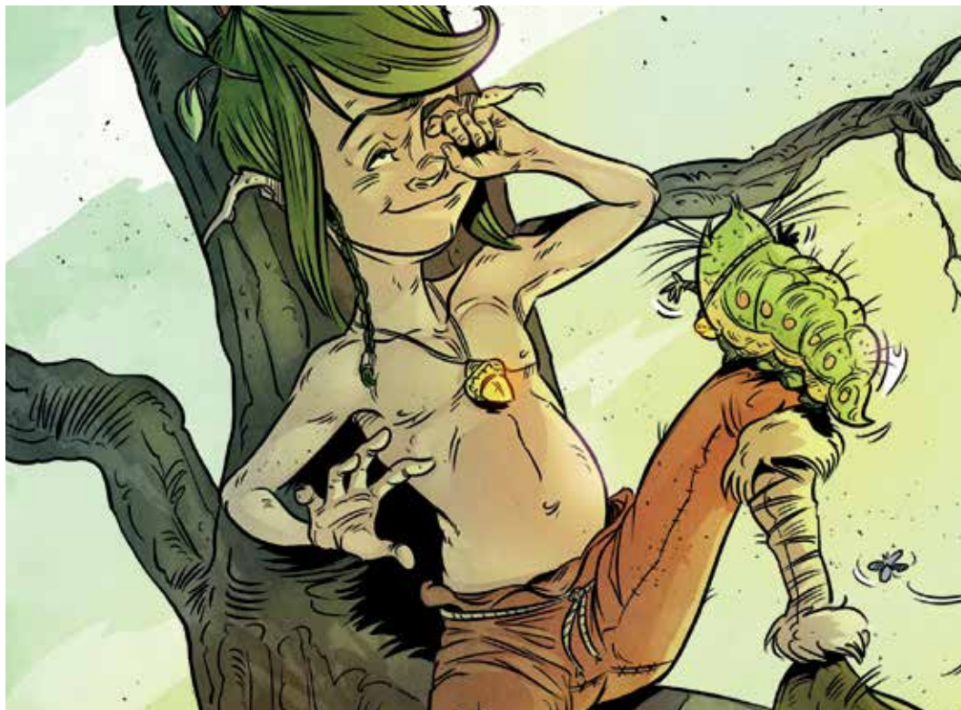
Stripfiguur Meander uit 'Meander duikt in de geschiedenis van Rheden'

De oorkonde hangt op een niet te missen plaats tussen de ingangen van raadzaal en collegekamer en in de raadzaal hangen op verzoek van de raad inmiddels prachtige foto's van Rhedens erfgoed. Met het prijzengeld zijn we enthousiast aan de slag gegaan met het stripboek "Meander duikt in de geschiedenis van Rheden", dat nu in de winkel ligt.