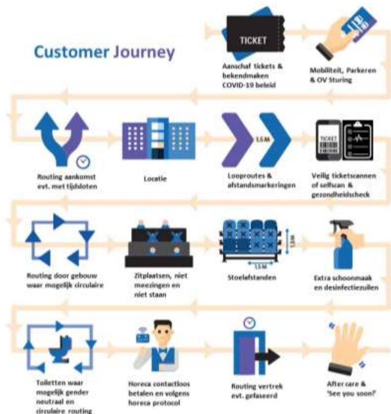
Figuur – Voorbeeld van een 'customer journey' bij een evenement met 1,5 meter, en overige, maatregelen van kracht, maar nog zonder Testen voor Toegang. Er zal later ook een Testen voor Toegang variant worden toegevoegd aangezien routing door gebouw, zitplaatsen, stoel afstanden e.d. niet van toepassing voor events met groene zone.

De maatregelen voor bezoekers worden beschreven aan de hand van de zogenaamde 'customer journey', waarbij afstand, bescherming, hygiëne en handhaving in acht zijn genomen. Deze kenmerken komen terug in het gehele proces.