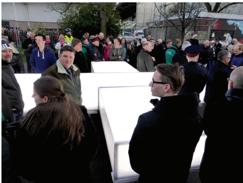
Afbeelding 22 Dragers van het lichtgevend kruis van The Passion vlak voor het moment van vertrek op Witte Donderdag (Leeuwarden, 13 april 2017)

erfgoed verschijnt. Ideeën over de oorzaak van deze dreiging verschuiven van ontkerkelijking naar de aanwezigheid van Nederlandse moslims. Dit laat zien dat, zoals eerder betoogd, weliswaar elk voorwerp of handeling tot erfgoed gemaakt kan worden, maar dat de analyse dit maken in een bredere maatschappelijke of politieke context dient te plaatsen.