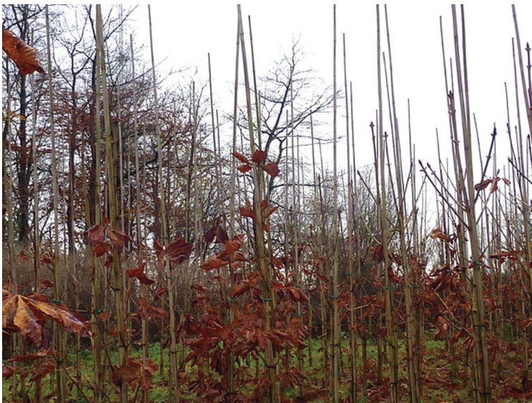
Afbeelding 18 Het Anne Frankbomenbosje in het Amsterdamse Bos in 2012