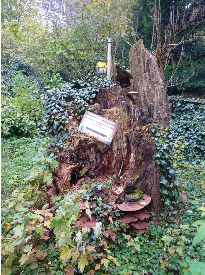
Afbeelding 15 De stromk van de Anne Frankboom met platte tonderzwam (16 november 2012)

genetisch identiek exemplaar (in de context van de Holocaust geen neutrale motivatie), de oorspronkelijke boom moeten vervangen. Verder werden er driehonderd kastanjes opgekweekt: één boom voor elk van de 263 Anne Frankscholen in Europa. Besloten werd om de Anne Frankboom in november 2007 te kappen, en aansluitend de geënte boom ceremonieel te planten. Het kappen ging echter niet door vanwege de vele verontwaardigde en geëmotioneerde reacties die dit besluit opriep, in Nederland en wereldwijd. De strijd om de boom ontwikkelde zich tot een high density event , met een eigen gepopulariseerde cultuur – met de boom als middelpunt – in kinderboeken, strips, cartoons, computerspelletjes, schilderijen,