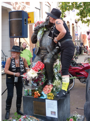
Afbeelding na/b Een gipsen BVO-tje en veel bier bij de Hazesherdenking van 23 september 2009

Deze casus toont aan hoe de herdenkingsrituelen rond Hazes teruggrijpen op allerlei elementen die kenmerkend zijn voor herdenkingsrituelen in het algemeen: een vast tijdstip, een vaste plek gemarkeerd door een standbeeld of monument, bloemen en stiltes. Ook zulke elementen zijn echter niet vaststaand of tijdloos. Zoals Rob van Ginkel in zijn studie naar de herdenkingscultuur rondom de Tweede Wereldoorlog heeft laten zien is het model voor de dodenherdenking, waaronder de inmiddels vanzelfsprekende twee minuten stilte, op vrij willekeurige wijze tot stand gekomen en door een eenling bedacht (2011: 177-186). Tegelijkertijd onderscheiden de Hazesrituelen zich door het incorporeren van een aantal, tot dan toe niet met herdenkingsritueel verbonden elementen, waardoor er nieuwe combinaties, en daarmee zelfs nieuwe vormen van ritueel konden ontstaan, zoals het afscheid in de Arena.