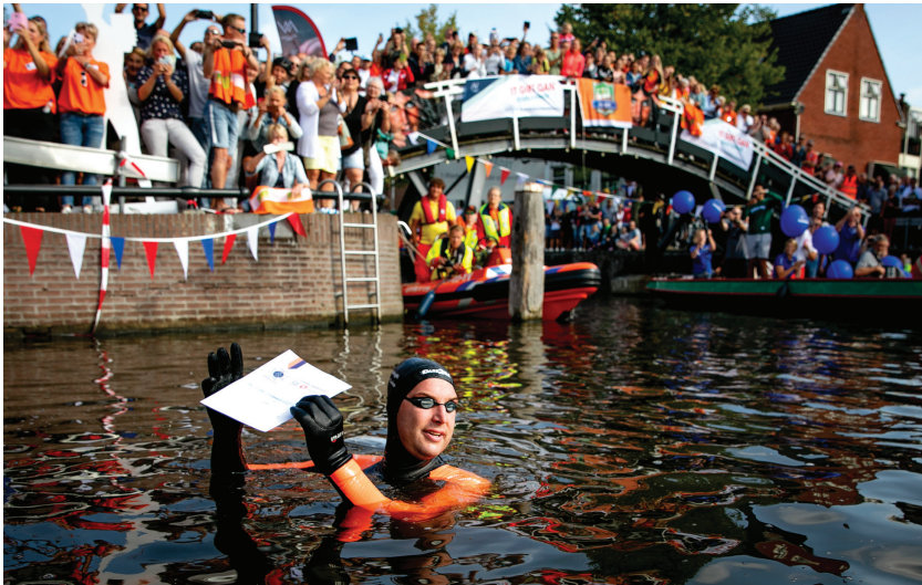
Afbeelding 6 Maarten van der Weijden met stempelkaart bij Sneek (20 augustus 2018)