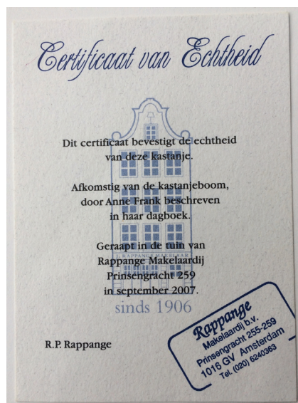
Afbeelding 16a/b Relatiegeschenk Makelaar Rappange met certificaat van echtheid uit 2007