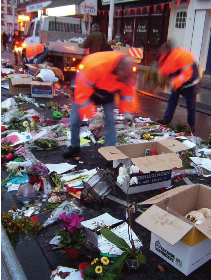
Afbeelding 19 Medewerkers van de Stadsreiniging Amsterdam sorteren materiaal van het tijdelijk monument voor Theo van Gogh (10 november 2004)

en behoud worden te kostbaar. Dit zorgt ervoor dat belangrijke spelers in het maken van deze recente vormen van erfgoed – archieven, musea en onderzoeksinstituten, zoals het Meertens Instituut – niet alleen verplicht zijn om hun selecties te motiveren, maar ook dat zij de verantwoording hebben om zich op gepaste wijze te ontdoen van dat deel van het materiaal waarvoor de keuze op ‘niet bewaren’ is gevallen.