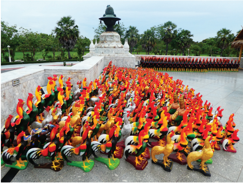
Afbeelding 12 Hanenleger voor de Siamese koning Naresuan (1555-1605) bij een van zijn standbeelden in de Thaise stad Ayutthaya