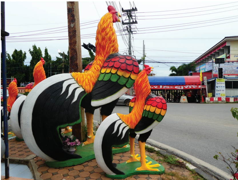
Afbeelding 13 Reuzenhanen (meer dan twee meter hoog) wachtend op een koper bij een winkel in religieuze voorwerpen in Ayutthaya