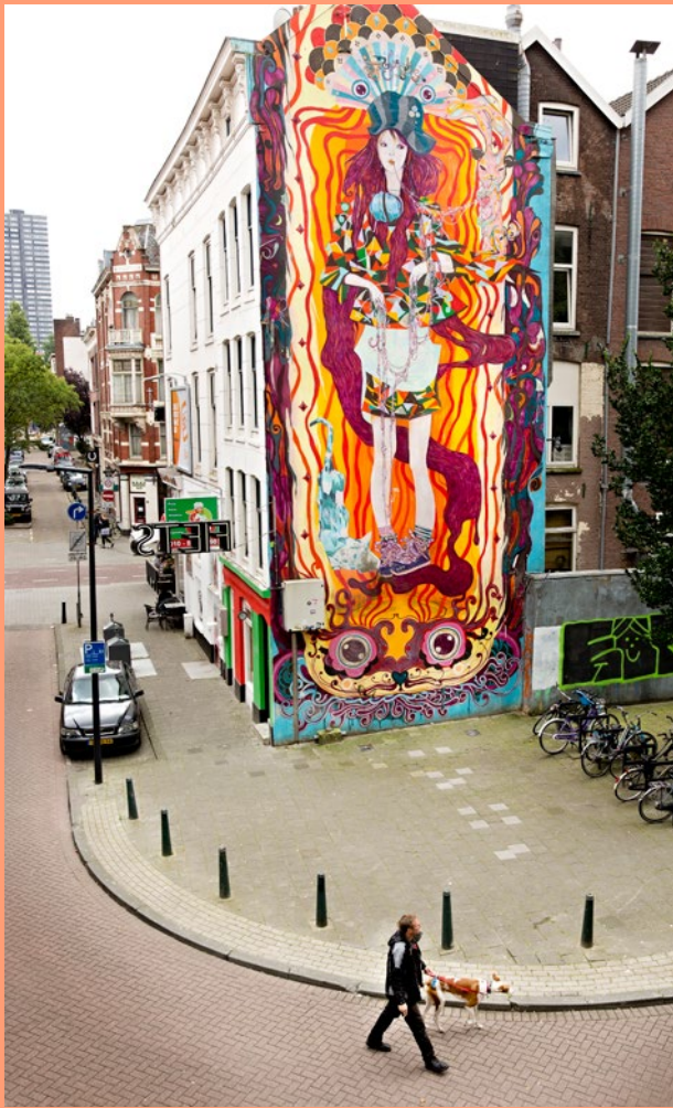
Straatkunst van Ramon Martin aan de Kromme Elleboog in het Witte de Withkwartier