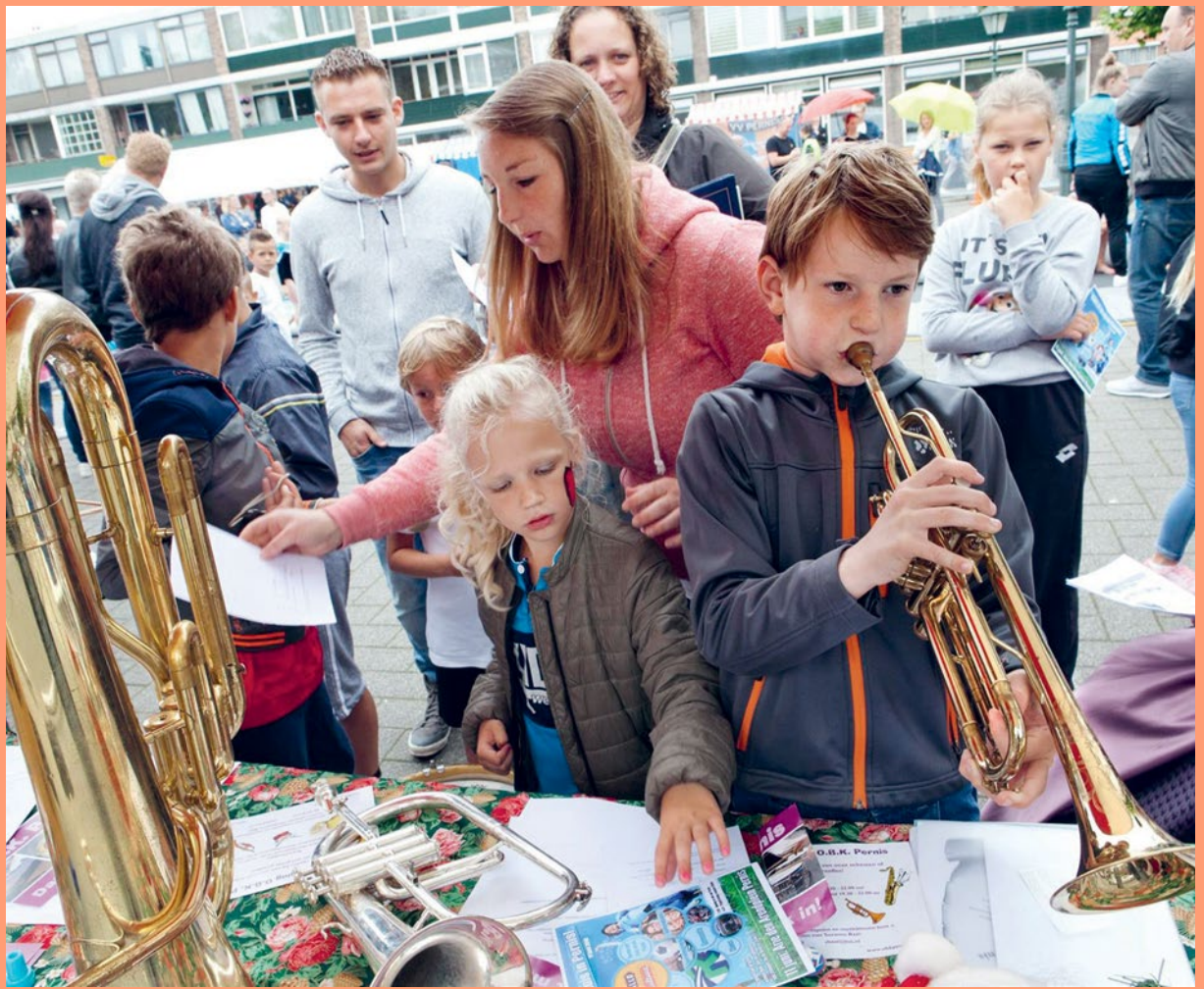
Verenigingsdag Pernis, 2016