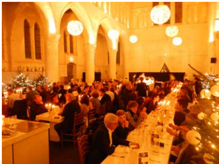
Kerk, Krimp en Kans