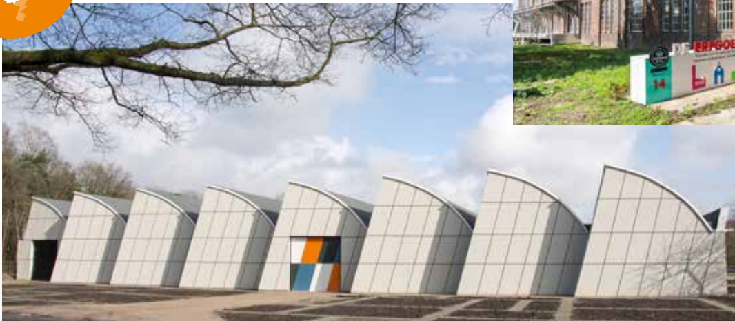
◀ Voormalige Weverij De Ploeg in Bergeijk, één van de Complexen in de Erfgoedfabriek