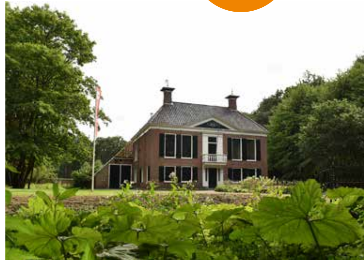
▲ Coendersborg, Nuis ►

De restauratie en herbestemming zijn mogelijk gemaakt met investeringen vanuit Het Groninger Landschap, de gemeente en de provincie. In boerderij Kym heeft Museum 't Rieuw (landbouwmuseum) een nieuw onderkomen gevonden. Er is een nieuwe kapschuur geplaatst en de muziekkoepeel is vervangen door een ruimere multifunctionele. De borg is gerestaureerd en bevat een nieuw bezoekerscentrum en fraai appartement. Al met al is een gezonde, duurzame exploitatie van het geheel mogelijk geworden. Daarbij hebben de restauraties gediend als leerwerkplaats voor het opleiden van jonge restauratievaklieden. ●