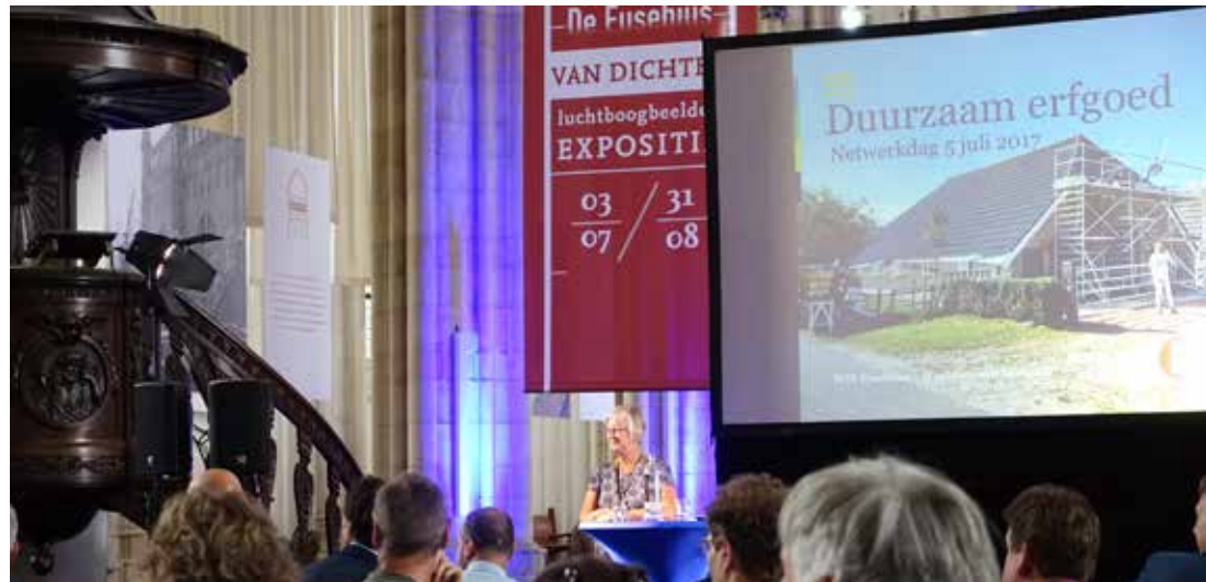
Netwerkdag Duurzaam erfgoed, Arnhem