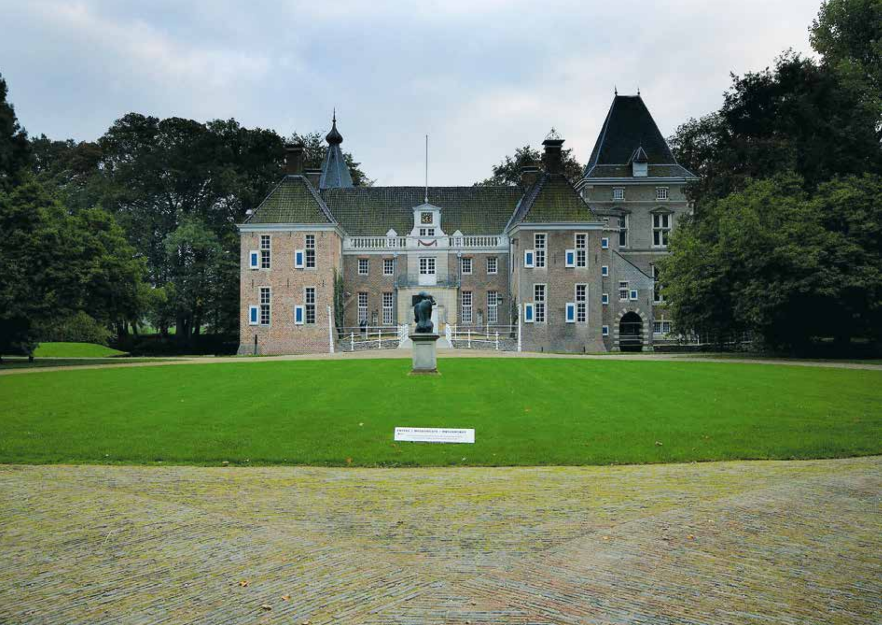
WITTE ZAKENKLOOSTER / WITTEKLOOSTER Witte Zakenklooster / Witte Klooster Witte Zakenklooster / Witte Klooster