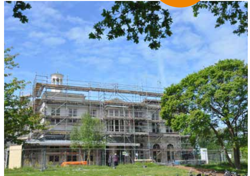
▲ Landgoed Ockenburgh ►

In 2017 heeft de provincie Zuid-Holland een subsidie van € 150.000 beschikbaar gesteld voor de historische buitenplaats Ockenburg, gelegen binnen de Erfgoedlijn Landgoederenzone. Tientallen jaren werden verschillende pogingen gedaan voor een haalbare herontwikkeling, zonder succes. Een aantal omwonenden en betrokken deskundigen is het wel gelukt om nieuw leven te blazen in dit fraaie buiten bij Kijkduin, met steun van de gemeente Den Haag en de nodige fondsen. Met de bijdrage van de provincie worden de stucplafonds en de imposante trappartij gerestaureerd. De Stichting tot Behoud van Buitenplaats Ockenburgh won in 2017 de provinciale Stimuleringsprijs herbestemming rijksmonument, een bedrag van € 20.000,-. Het is een mooi voorbeeld van een initiatief voor revitalisatie van onderop, met een groot effect op de aantrekkingskracht en schoonheid van de omgeving. ●