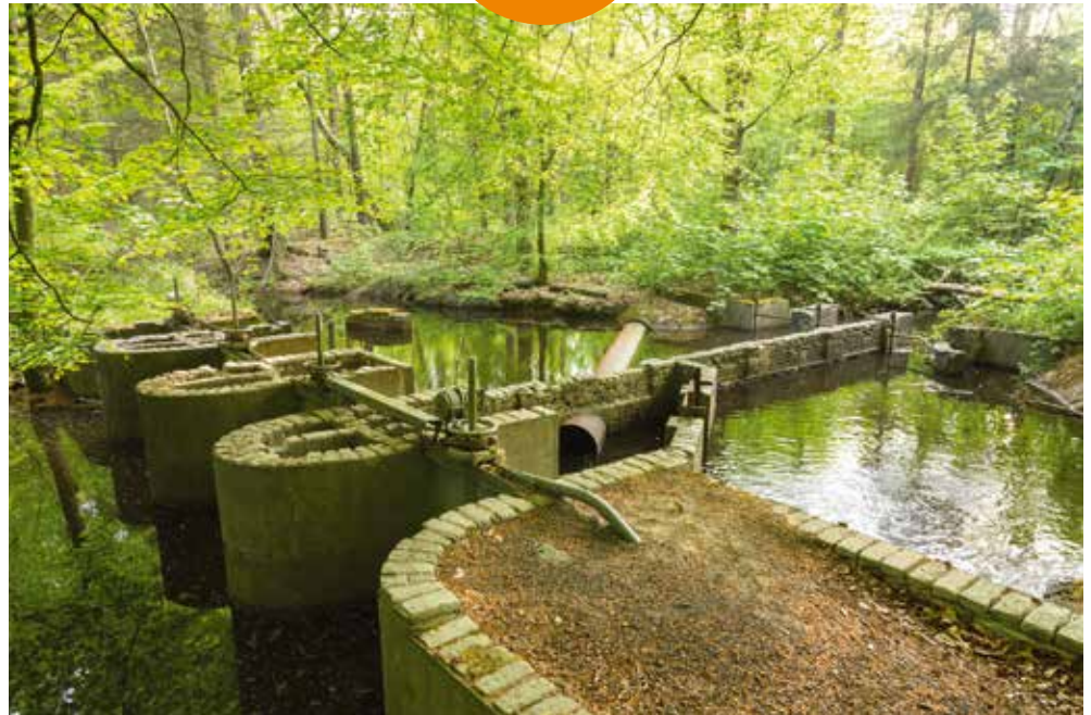
Waterloopbos, stuwen Rotterdam

Deze twee ambities komen samen in de ontwikkelagenda van het Waterloopbos, waarbij de provincie één van de partners is die samen met Natuurmonumenten eraan werkt om deze te verwezenlijken. Onderdeel van het plan is de duurzame restauratie van een aantal modellen en daarnaast het trekken van meer aandacht en publiek naar het bijzondere bos, onder andere door het plaatsen van een groot kunstwerk in de voormalige Deltagoot, het gebied nieuw leven in te blazen en het verhaal door te geven. ●