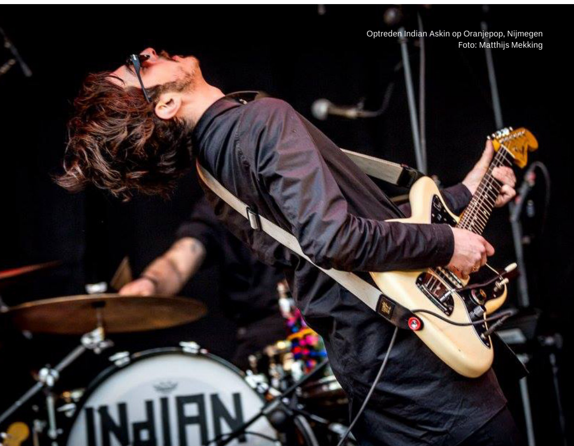
Optreden Indian Askin op Oranjepop, Nijmegen

De zakelijke tak van de popmuzieksector is groot en divers. Binnen de sector zijn mensen werkzaam als onder meer artiestenmanagers, boekers, game-ontwerpers, websitebouwers, vormgevers, personeel in horeca, beveiliging, transport, licht- en techniekbedrijven, platenmaatschappijen en creatieve bedrijven die onder andere artwork en videoclip produceren, maar ook werk dat volgt uit de muzikale activiteiten, zoals bijvoorbeeld administratie, boekhouding, onderhoud en schoonmaak. Alleen al in Den Haag was in 2016 de totale economische impact van popmuziekactiviteiten in de hofstad goed voor bijna 51 miljoen euro. Hiermee zijn tussen de 760 en 830 fte's gemoeid, goed voor tussen 1130 en 1280 arbeidsplaatsen.