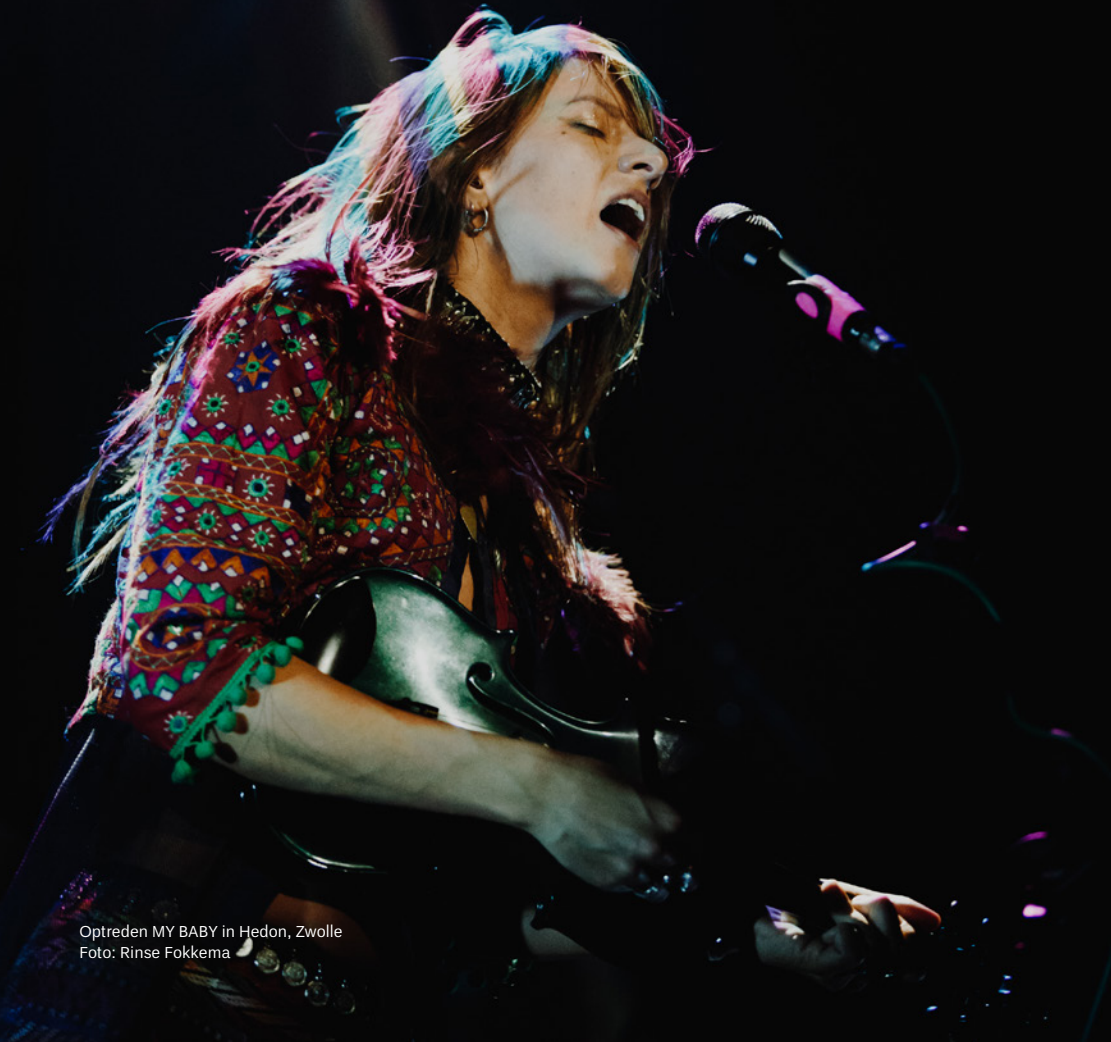
Optreden MY BABY in Hedon, Zwolle