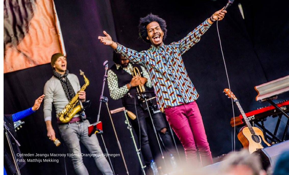
Optreden Jeangu Macrooy tijdens Oranjepop, Nijmegen

Een goed kunstklimaat met oog voor vernieuwing en talentontwikkeling, onder andere op het gebied van popmuziek, draagt bij aan een dynamisch imago van een gemeente en kan daardoor vooral jonge mensen en creatievelingen langer aan een gemeente binden of juist trekken. Is er ook een hogeschool of universiteit aanwezig, dan wordt de stad ook aantrekkelijker voor studenten. Voor bewoners biedt cultuur