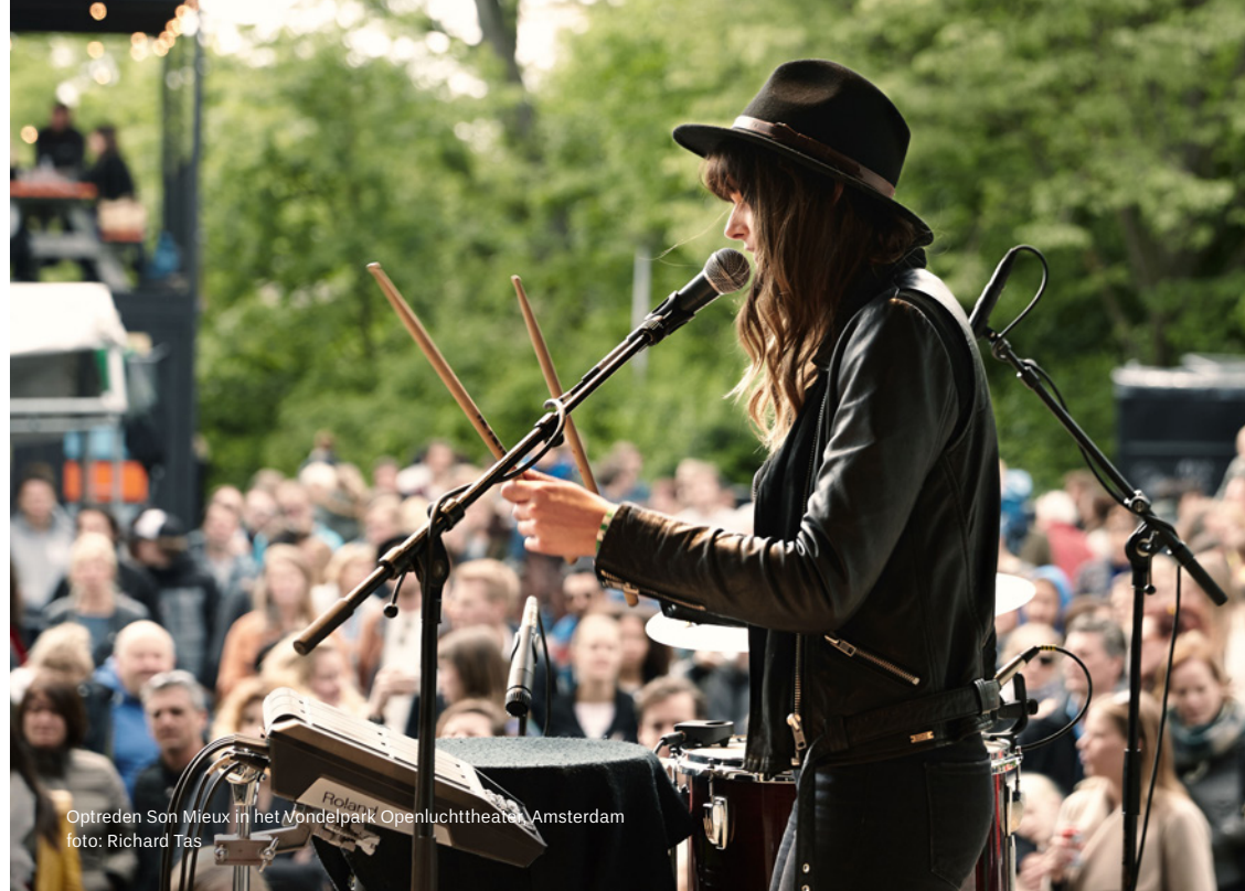
Optreden Son Mieux in het Mondelpark Openluchttheater, Amsterdam