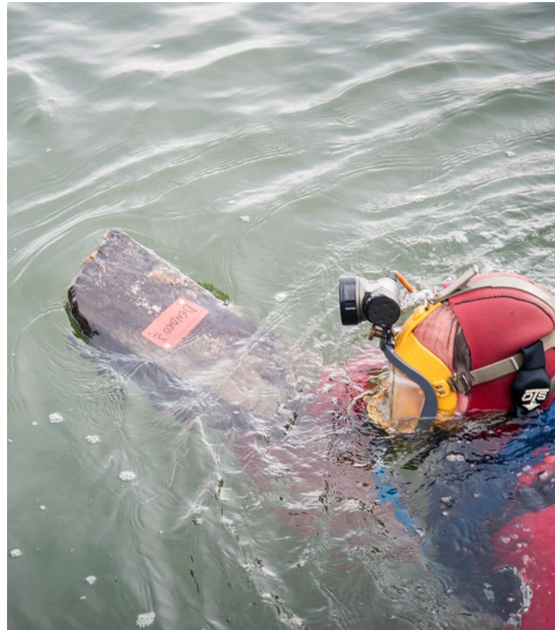
Een archeoloog aan het werk in de Waddenzee.

In de Erfgoedwet is de formulering van de belangrijkste begrippen aangepast. Ook het verwijderen of verplaatsen van cultureel erfgoed dat zich op de waterbodem bevindt, is met ingang van de Erfgoedwet een opgraving, waarvoor een certificaat verplicht is. Aanscherping van de formulering is nodig, omdat verwijdering van cultureel erfgoed onder water immers kan gebeuren zonder merkbare verstoring van de bodem. Het is daarnaast moeilijk om vast te stellen of een voorwerp dat op de bodem wordt gevonden bij een wrak hoort. De definities zijn in afstemming met het Openbaar Ministerie zo aangepast dat duidelijk is dat het verstoren, verplaatsen of verwijderen van een object dat op de bodem