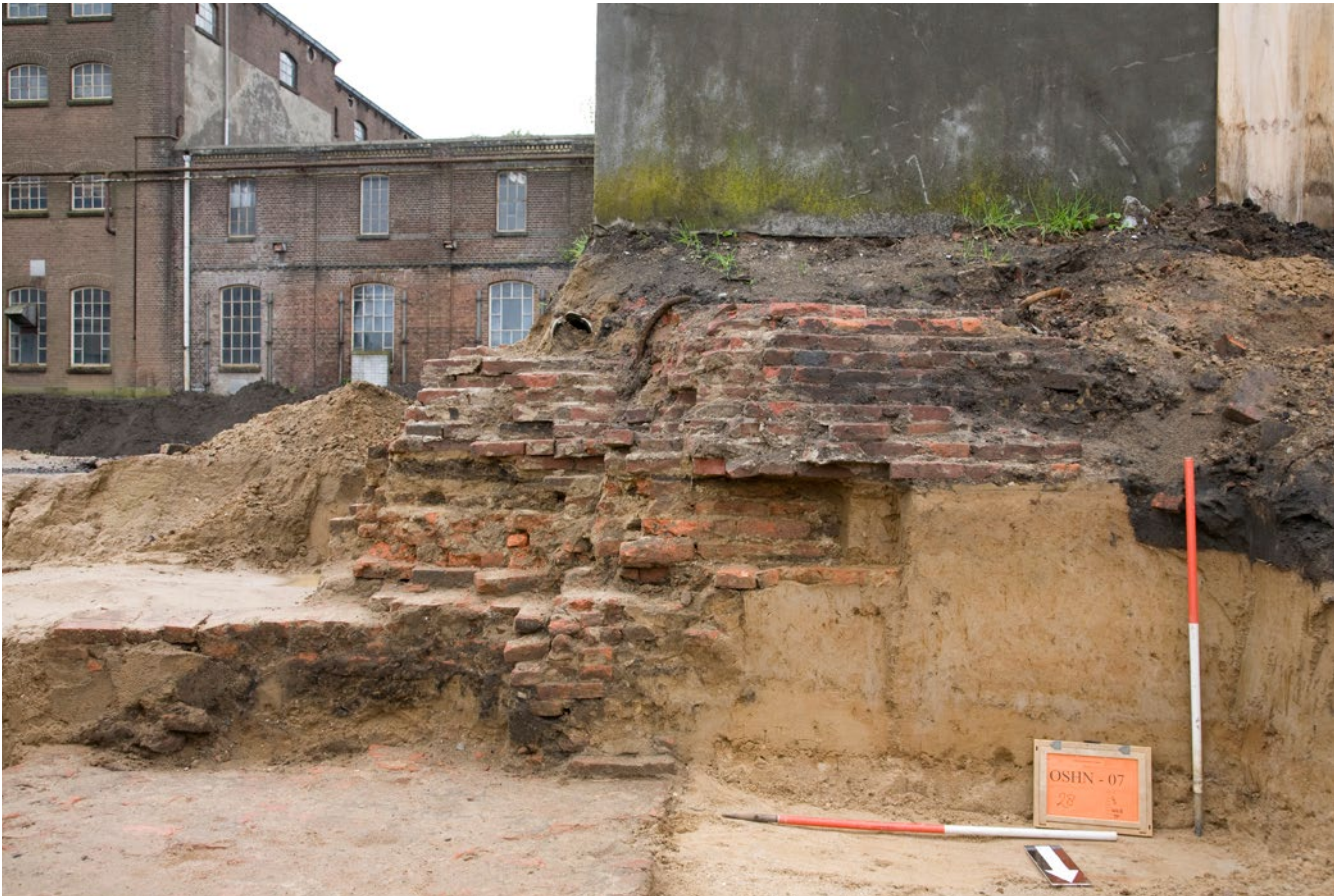
Een op archeologische wijze vrijgelegde fundering