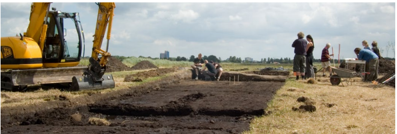
Een archeologische opgraving

opgenomen voor de omgang met dit culturele erfgoed. Denk daarbij aan het verlenen van een omgevingsvergunning om een archeologisch rijksmonument te mogen verstoren. Nadere informatie over de Omgevingswet : www.omgevingswetportaal.nl .