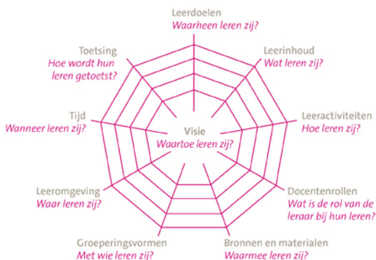
Figuur 4.1: Curriculaire spinnenweb van Van de Akker (2009).

Het model bestaat uit een kern en negen draden die samen een spinnenweb vormen. De kern en de draden verwijzen naar tien onderdelen van het curriculum die elk een vraag over het leren door leerlingen betreffen. In het spinnenweb fungeert het onderdeel 'visie' als centrale, verbindende schakel; de overige onderdelen (leerplanaspecten) zijn verbonden met die visie. Idealiter zijn ze ook met elkaar verbonden, zodat er sprake is van consistentie en samenhang. De metafoer van het spinnenweb onderstreept het kwetsbare karakter van een curriculum. Spinnenwebben zijn weliswaar enigszins flexibel maar dreigen toch te scheuren als er te hard en eenzijdig aan bepaalde draden getrokken wordt zonder dat de andere draden meebewegen ( http://www.slo.nl/voortgezet/onderbouw/leergebieden/kenc/kwaliteitscan/spin/ ). Er is gekozen voor dit model omdat het aansluit bij de resultaten van het D21-onderzoek waarin naar voren komt dat de onderwijsvisie een centraal component van het onderwijs is en de onderwijspraktijk hier idealiter uit voortkomt.