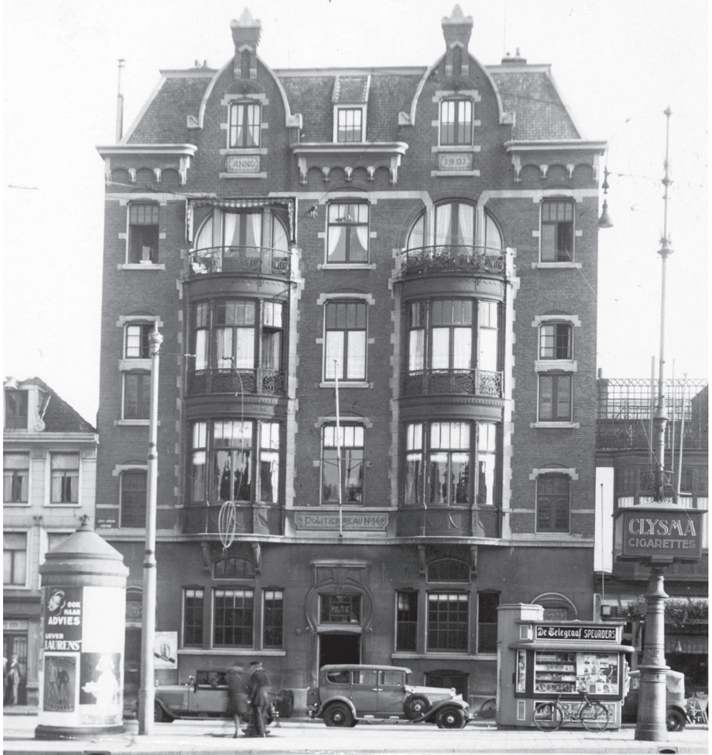
Politiebureau No. 14, Leidseplein, foto: Stadsarchief Amsterdam