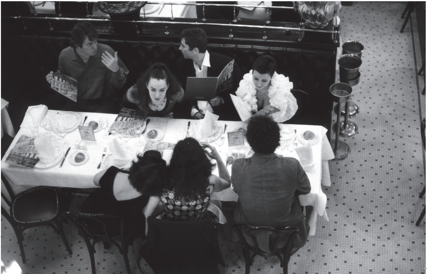
Restaurant La Coupole, Parijs