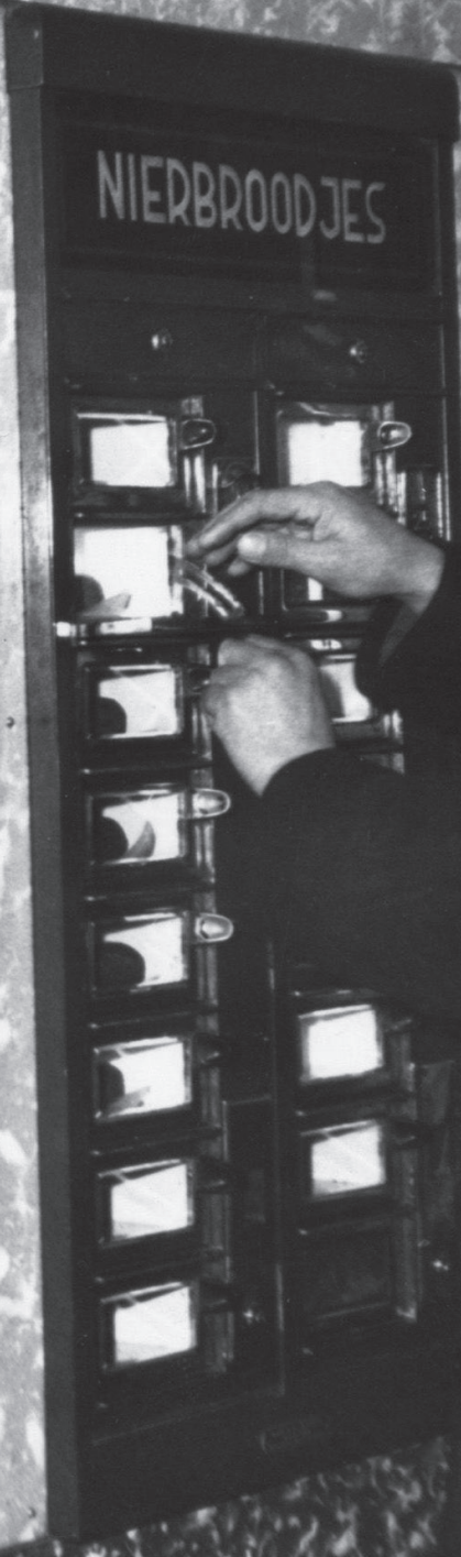
Automatiek 1957