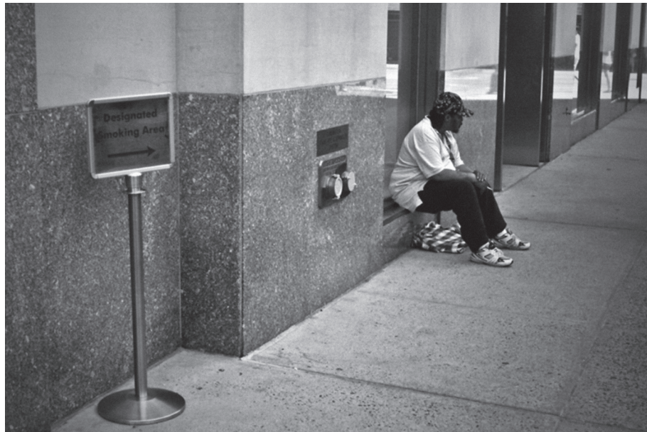
Rookplek New York

Dit artikel gaat over het ontstaan van rookzones in de stad. Zoals rook zelf kringelt dit essay langs diverse onderwerpen, tijdsmomenten en steden, te beginnen in New York bij de verbeelding en de beleving van roken.