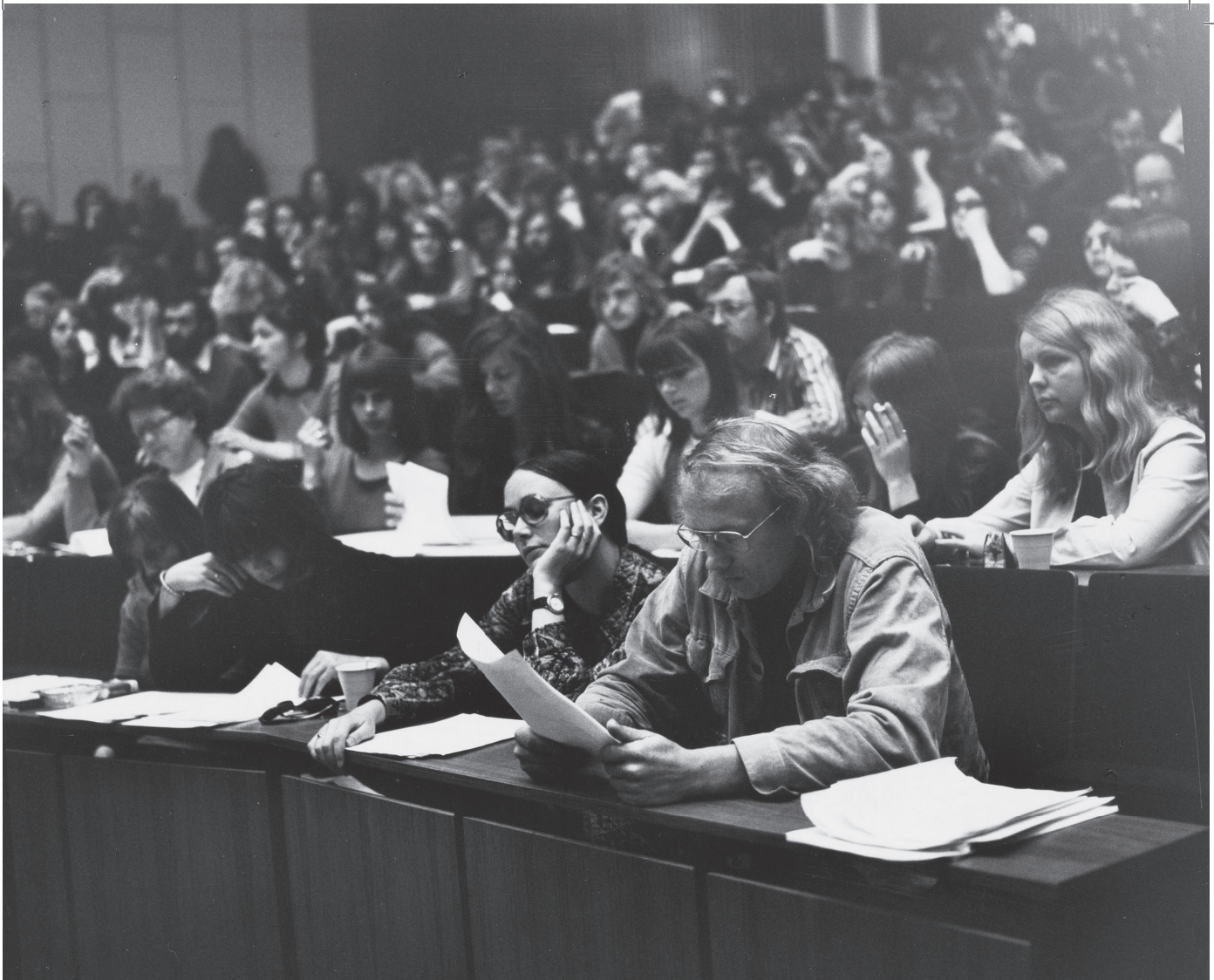
Collegezaal Roeterseiland Universiteit van Amsterdam

Het ambivalente karakter van het Internet stelt intellectuelen voor een dilemma, net als zoveel technologische verschijnselen eerder hebben gedaan (Woolgar, 2002; De Vries, 1999). Enerzijds vereist de idealisering – en demonisering – van het Internet als een extra-institutioneel domein een sceptische reactie. Het is de taak van kritische denkers en onderzoekers om de fantasie van het Internet als zone van overschrijding en ‘exodus’ te ontzenuwen, en te laten zien dat dit medium net als alle andere niet ontsnapt aan pogingen tot maatschappelijke inkapseling en ‘domesticatie’. Anderzijds is het sociale en culturele denken en het onderzoek zelf gegrepen door de metafoor van het Internet als domein van grensoverschrijding: nergens anders dan op het