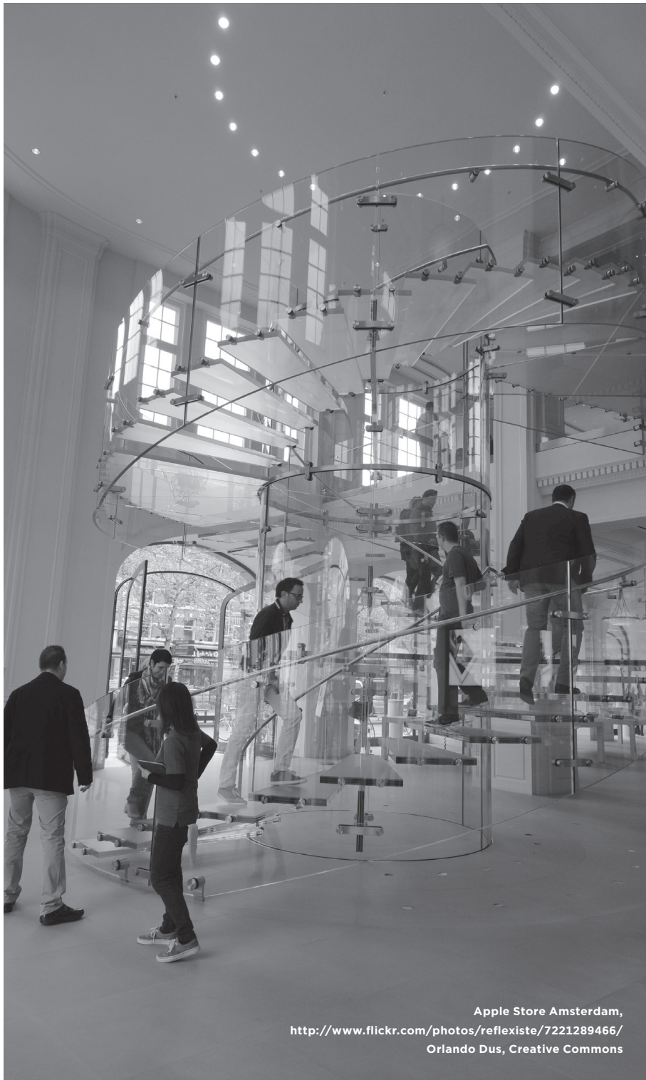
Apple Store Amsterdam