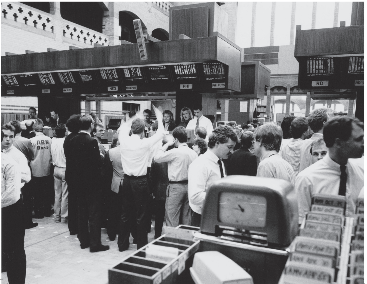
Optiebeurs 1987

Door deze aktes na elkaar op te voeren, laten we zien dat de precieze aard van en relaties tussen kennis, macht en markt door de tijd heen steeds verandert.