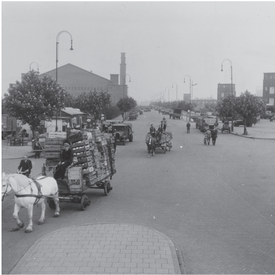
Centrale Markthallen, Jan van Galenstraat, foto: Stadsarchief Amsterdam

vertical farming (landbouw op etages) aanmoedigen. Zulke initiatieven bestaan in Chicago al langer en vinden op kleinere schaal ook in Nederland plaats zoals de plannen voor 'slaflats' in lege kantoorruimtes in Leiden. Dat architecten zich met voedsel bezighouden is dus eigenlijk niet meer dan logisch. Ook mag het geen verbazing wekken dat stedenbouwkundigen en ruimtelijke planners aandacht hebben voor voedsel en 'de stad'. Minder duidelijk is of met de hernieuwde aandacht voor voedsel en de stad, ook een vers beeld ontstaat over de verhouding tussen stad, land en voedsel en de verschillende functies van het landelijke en het stedelijke gebied.