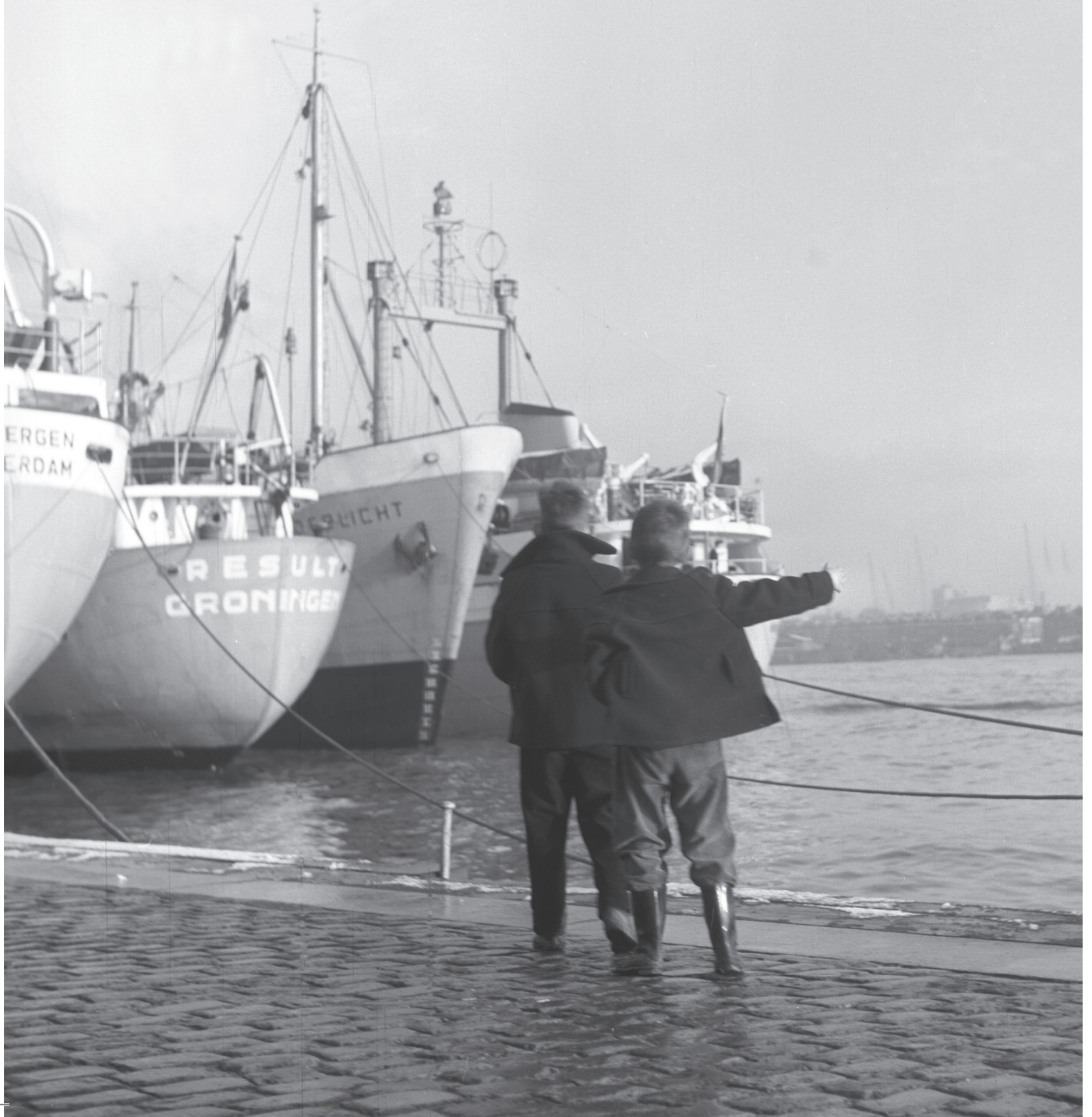
Jongens in de Rotterdamse haven, januari 1958.