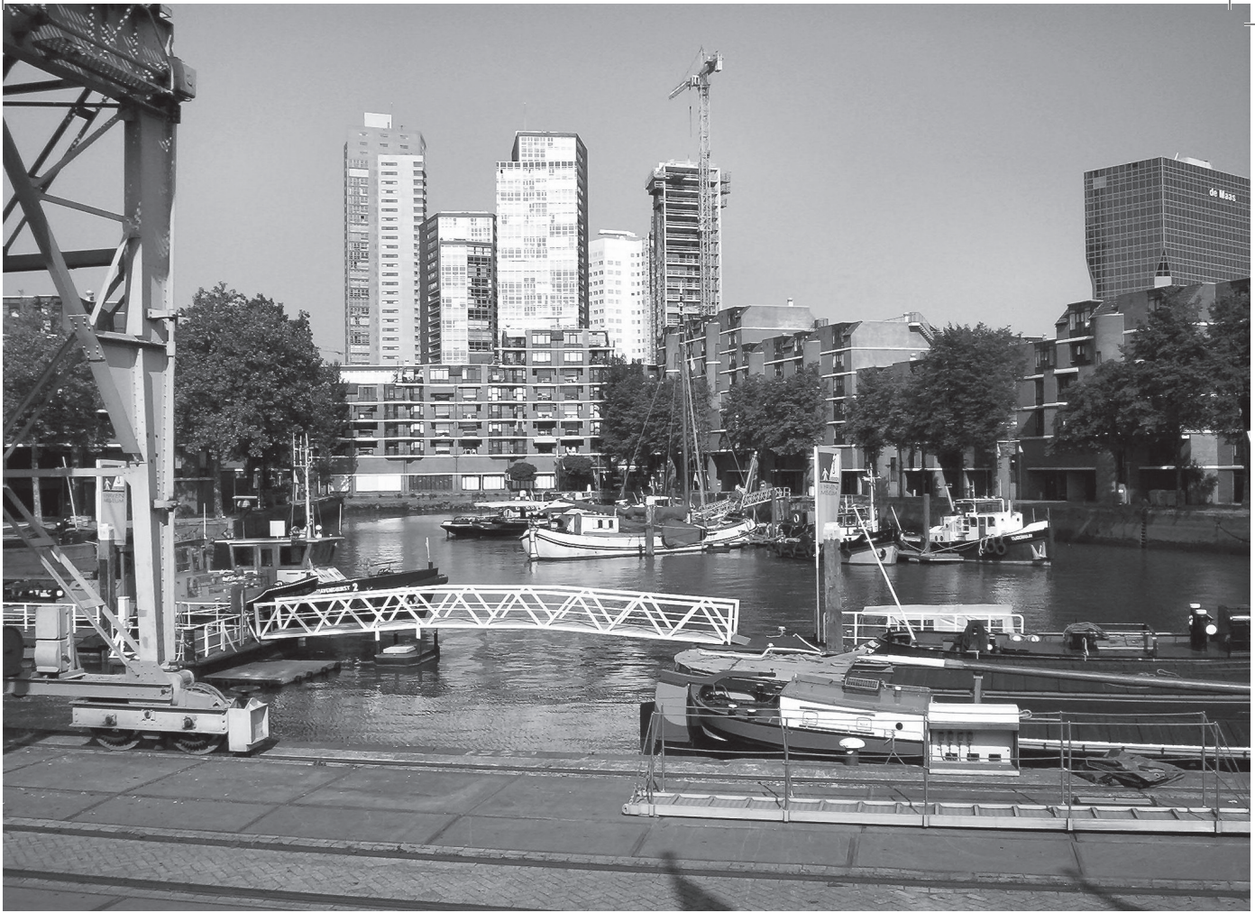
Binnenhaven Rotterdam