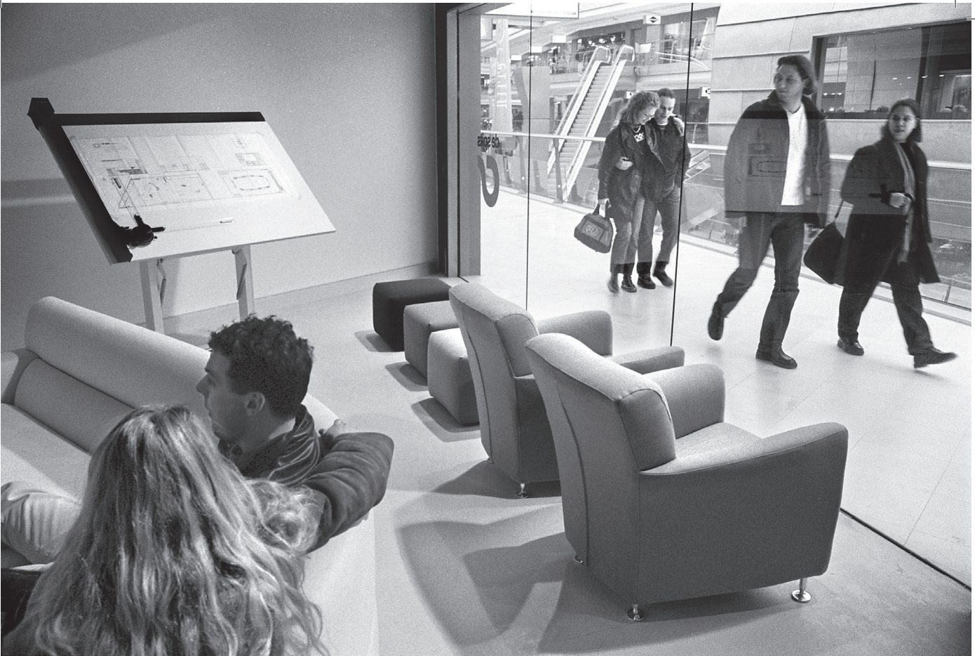
Villa Arena, Amsterdam, foto: Marcel van den Bergh (Hollandse Hoogte)

van het grand café bij de roltrappen een cappuccino drinken. Met de tassen lopen we naar de auto, die we vervolgens nog even verderop neerzetten, bij een grote blinde doos, omdat we nog een kastje voor in de slaapkamer willen. Nadat we zijn geslaagd, besluiten we nog wat te eten. Niet in het gezellige wokrestaurant boven de megasportwinkel, maar hier in het woonwarenhuis, want dat is gemakkelijker. Ruim voor sluitingstijd, het loopt nog maar tegen achten, sturen we de oprit op.