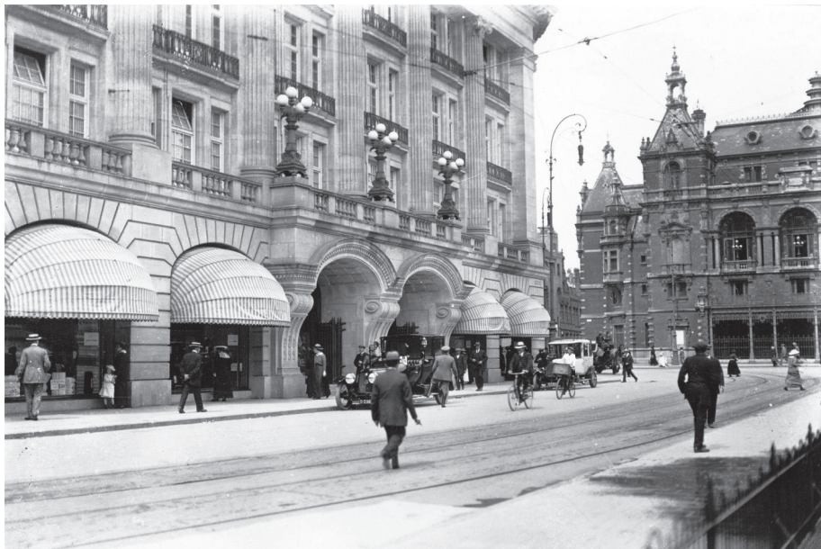
Maison Hirsch & Cie

De opening van de Apple Store aan het Leidseplein in Amsterdam is een volgend stadium in de grote ontwikkelingen rond winkelen die de afgelopen decennia het uiterlijk, maar vooral ook het gebruik van de stad transformeerde. Aan de ene kant worden die veranderingen veroorzaakt door nieuwe