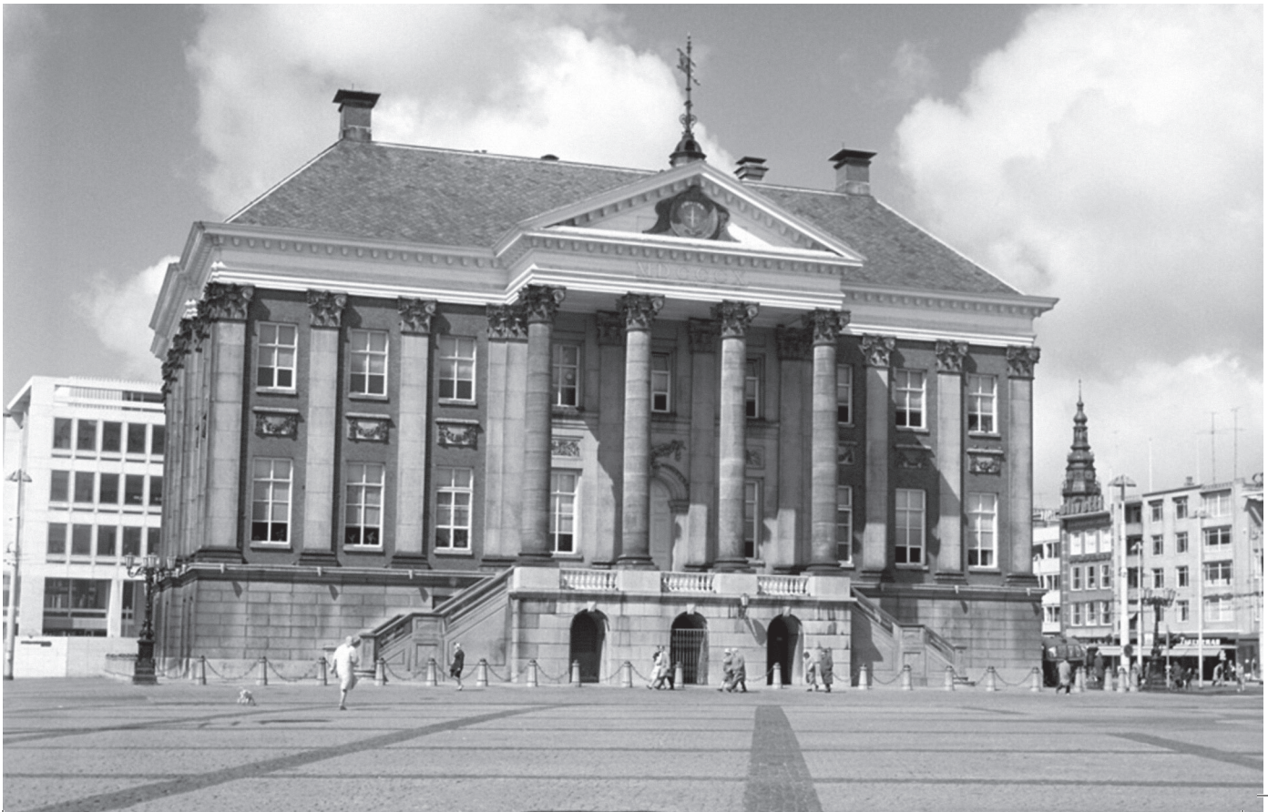
Stadhuis Groningen

Maar op wiens agenda staat die kabelbaan eigenlijk? Wie bepaalt en beheert die agenda – de politiek, kiezers, gekozenen, de gemeenteraad, college van b&w, de ambtelijke dienst Ruimtelijke Ordening en Economische Zaken? Of is dat te traditioneel gedacht – binnen de kaders immers van de inmiddels toch lang en breed achterhaalde modernistische samenleving met haar keurige institutionele taakverdeling? Dat was ooit een kernleerstuk van de sociologie: de modern-industriële samenleving zou zich kenmerken door een proces van differentiatie. Elke maatschappelijke taak vereist zijn eigen institutie. Die taken dienen strikt gescheiden te blijven, dus ook de instituties. En daarom spreken we van de scheiding tussen kerk en staat, tussen recht en politiek, privaat en publiek, of, om wat langer stil bij te staan, de scheiding tussen wetenschap en politiek.