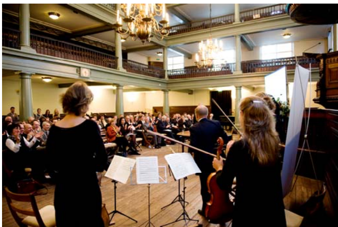
Jenufa Kwartet neemt applaus in ontvangst