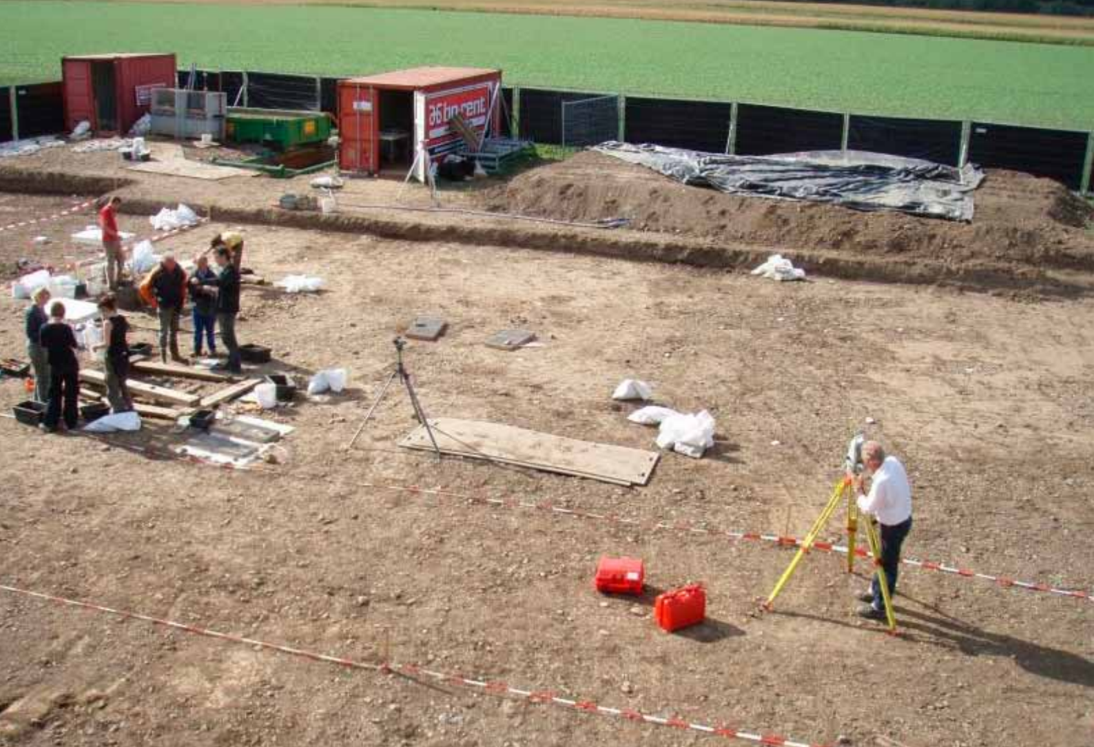
Archeologisch onderzoek op het beschermde terrein in Borgharen. Onder de grond bevinden zich restanten van een Romeins villacomplex, sporen van Romeinse ambachtelijke activiteiten, een vroeg-middeleeuws inhumatie-grafveld en bewoningssporen uit de IJzertijd.