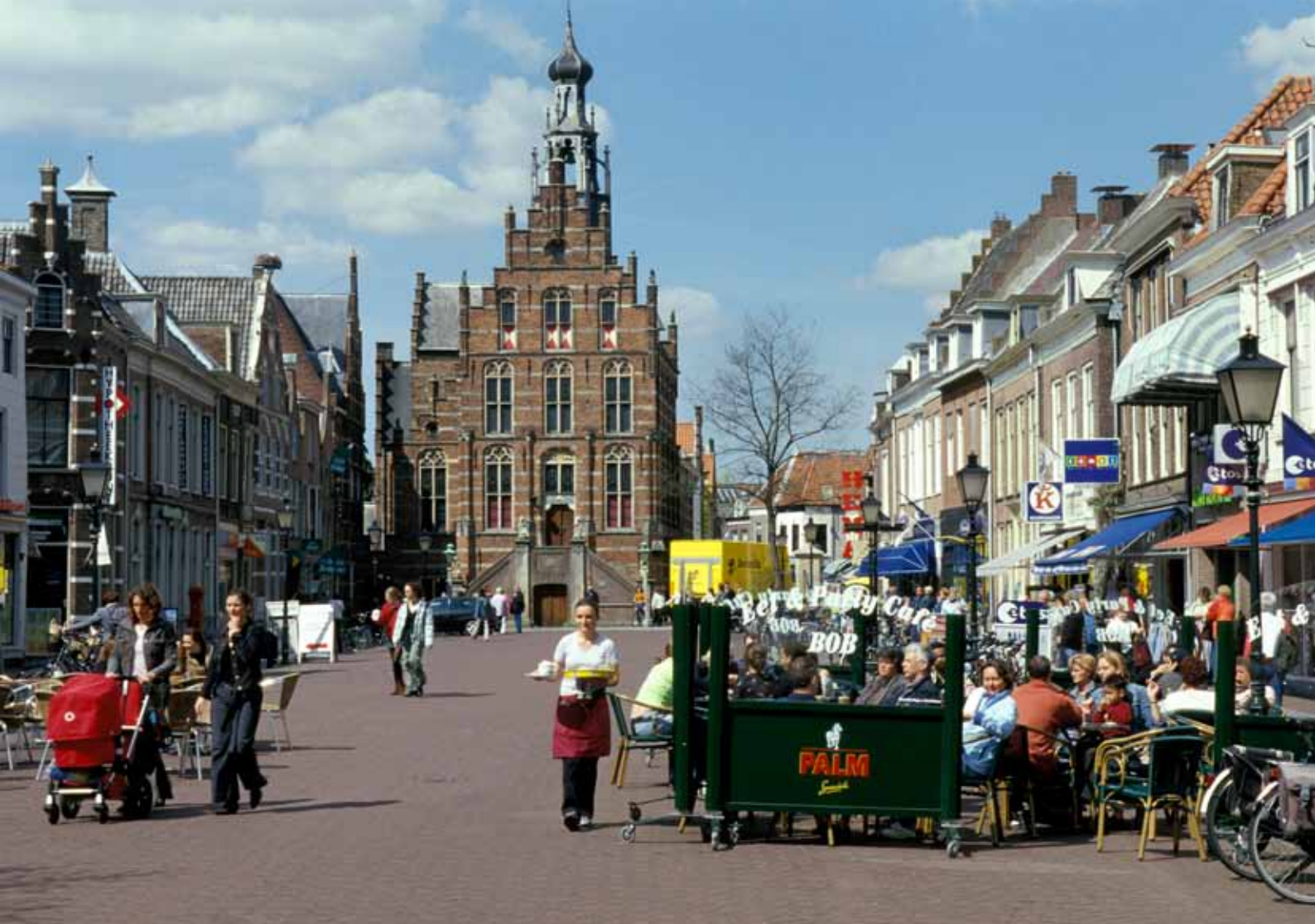
De oude stad als onderdeel van het beschermde gezicht in Culemborg met de Markt als belangrijke stedelijke ruimte.

Momenteel wordt bekeken hoe stedenbouwkundige waarden in deze ontwikkelingsopgaven geborgd kunnen worden en welke partijen daarin een rol spelen.