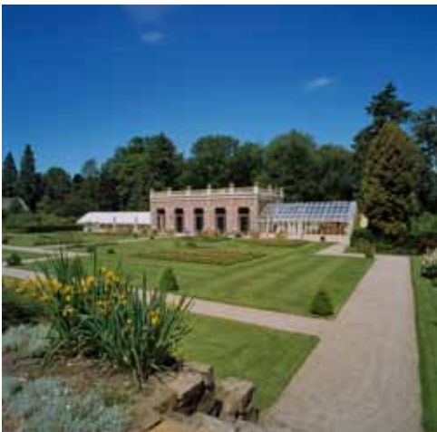
De historische buitenplaats Warnsborn in Arnhem gelegen op de Veluwezoom.