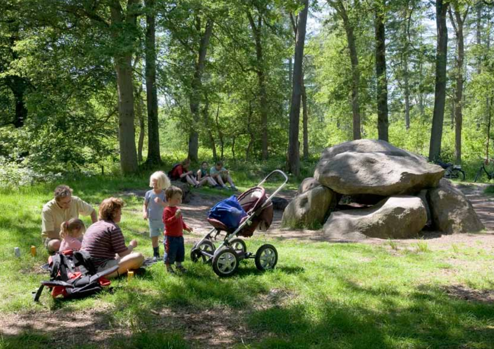
Het Strubben Kniphorstbosch is vanwege de aanwezige zichtbare waarde aangewezen als archeologisch rijksmonument. Hunebedden, grafheuvels, maar ook sporen van eeuwenoude veldwegen op de heide en in het bos.

Omgevingsvergunning en de Milieu Effect Rapportage. Deze verantwoordelijkheid verplicht gemeenten een eigen archeologiebeleid op te stellen met een inventarisatie naar bekende en verwachte archeologische waarden. Het archeologisch onderzoeksrapport met waardering wordt over het algemeen uitbesteed aan een gecertificeerd commercieel archeologisch bedrijf. Deze bedrijven hanteren vrijwel allemaal de KNA.