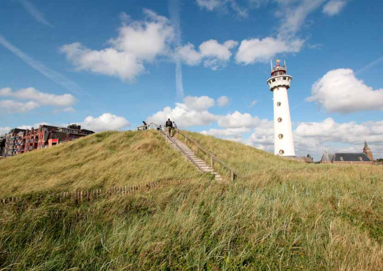
Egmond aan Zee maakt onderdeel uit van het Noordhollands Duinreservaat met hoge ruige duinen van zo'n dertig meter hoogte.

projecten – een specifieke focus op bijvoorbeeld relatief gave historische landschappen of op 'ongerepte' natuurgebieden. Naast deze verschillende vormen van waarderingsystematiek, gericht op het selecteren van 'toppers', zijn er het afgelopen decennium ook nieuwe methoden voor het karakteriseren en waarderen van landschappen ontwikkeld. Een exponent daarvan is de 'landschapsbiografie', waarvoor de historische context en het historische verhaal achter afzonderlijke relictten de basis vormen. Behalve gangbaar historisch-landschappelijk onderzoek is hier in ook plaats voor bijvoorbeeld historische ecologie en naamkunde en voor participatie van burgers en (amateur) historici.