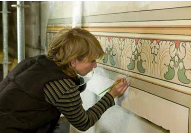
De restaurator herstelt de oorspronkelijke schilderingen in het Rijksmuseum in Amsterdam naar ontwerp van architect P.H. Cuypers.

periode 1940-1965. Deze inventarisatie kenmerkt zich door meer literatuuronderzoek en minder veldonderzoek. Zo zijn er dertig categoriale studies naar verschillende categorieën gebouwen verricht, en is een wederopbouwdatabank ingericht die onder meer gevuld is met informatie uit vaktijdschriften uit die periode. Op basis van deze onderzoeksresultaten is een preselectie en een waardestelling gemaakt waarvoor gebruik is gemaakt van de MSP-criteria, zij het dat deze op onderdelen zijn verrijkt.