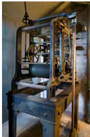
Uurwerk in uurwerkkast in de kerktoeren van de Nederlands Hervormde kerk in Meerkerk.