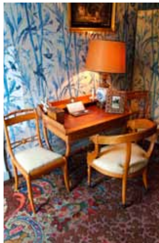
Eén van de veertien historische interieurs in Kasteel Duivengoede uit de 17de-19de eeuw opengesteld voor het publiek.