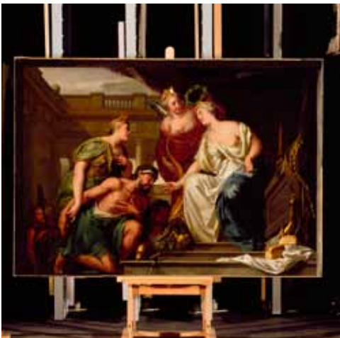
Allegorie op de liefdadigheid afgebeeld op een schoorsteenstuk in het Historisch Museum Rotterdam.