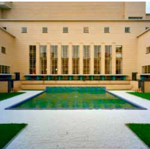
Het raadhuis in Hilversum, in 1927 ontworpen door de internationaal bekende Nederlandse architect W.M. Dudok.