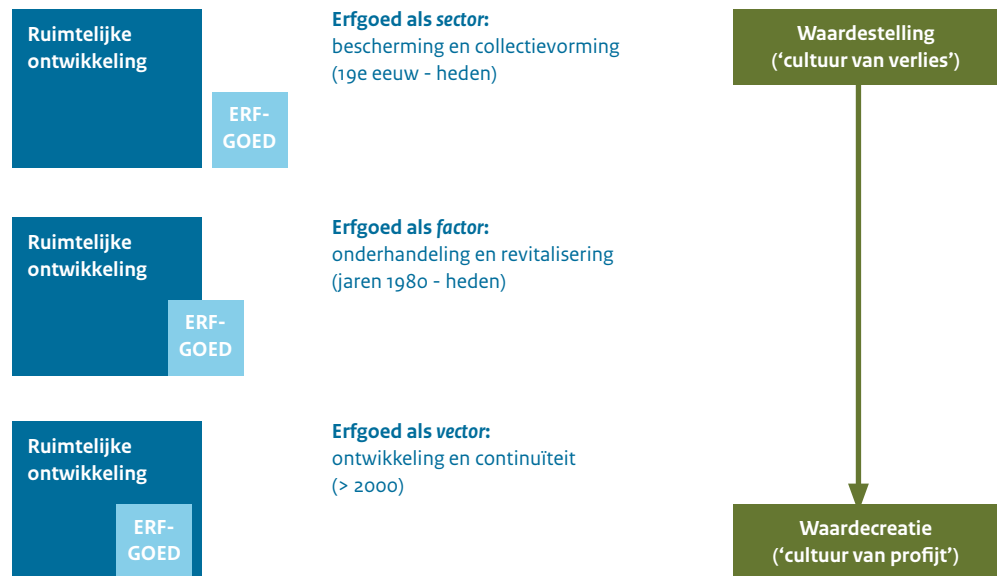
Figuur 1 Interactie ruimtelijke ordening en erfgoedzorg (ontwerp: Eric Luiten, aangevuld door de auteurs)