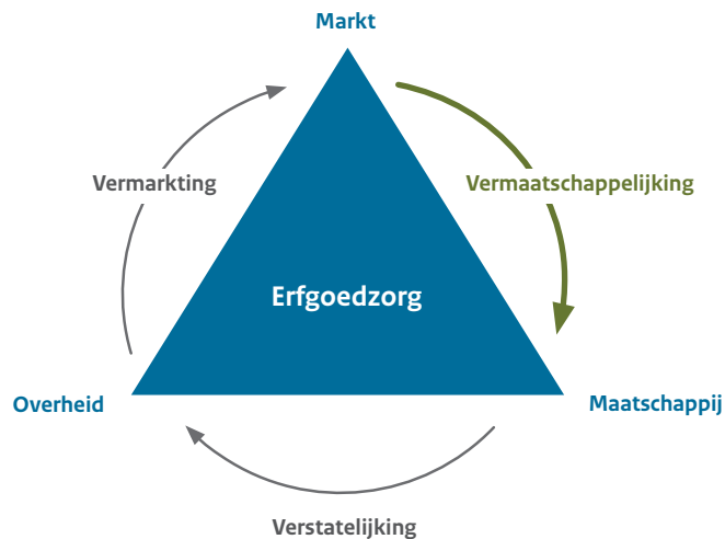
Figuur 3 Erfgoedzorg in het spanningsveld tussen overheid, markt en maatschappij (Ontwerp: Joks Janssen)

ming gekomen in publiek-private samenwerkingsverbanden en andere, vaak projectgebonden netwerken.