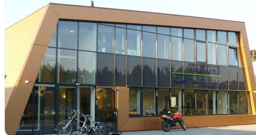
Filmtheater Fanfare, Oudembosch