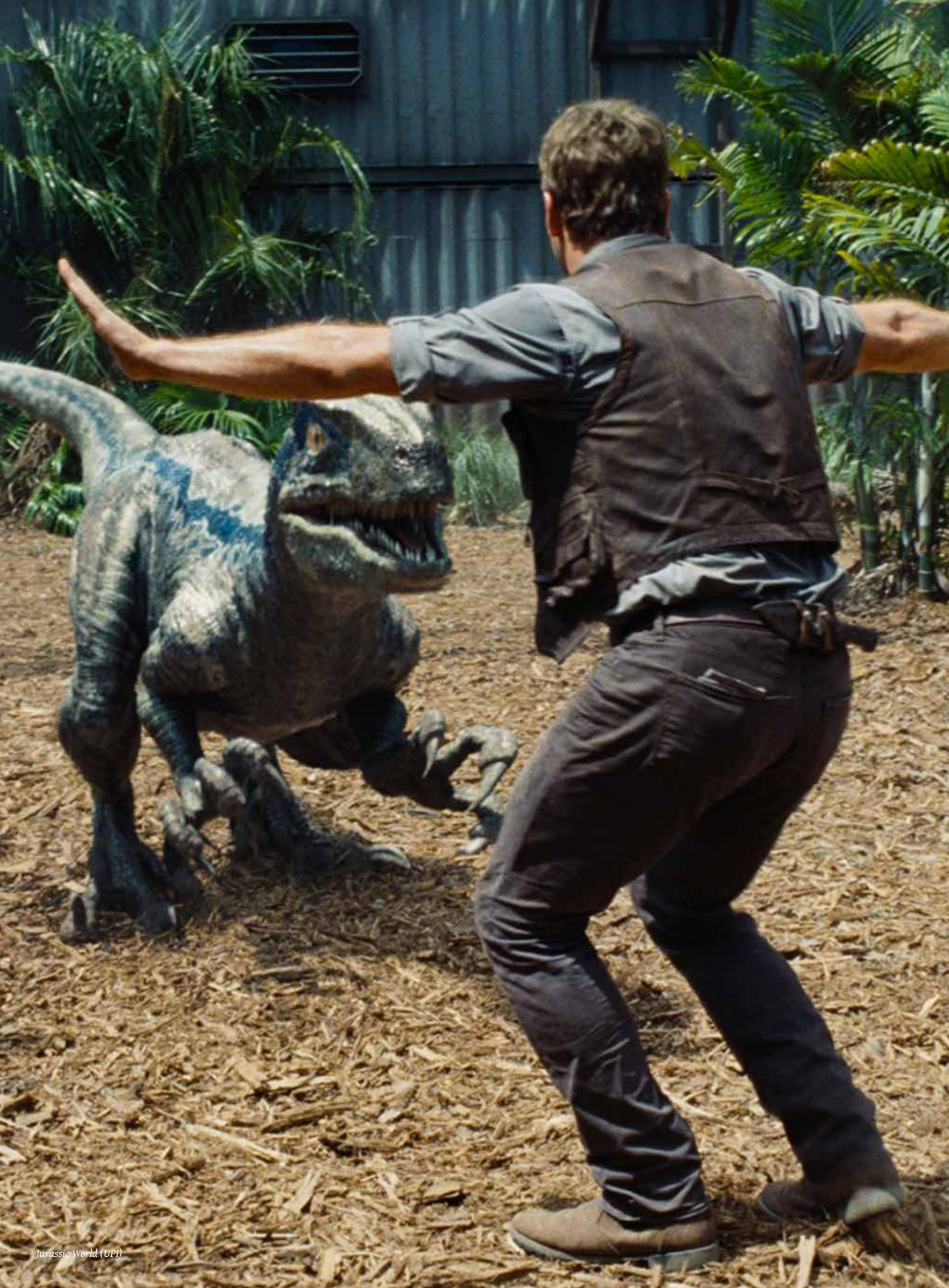
Jurassic World