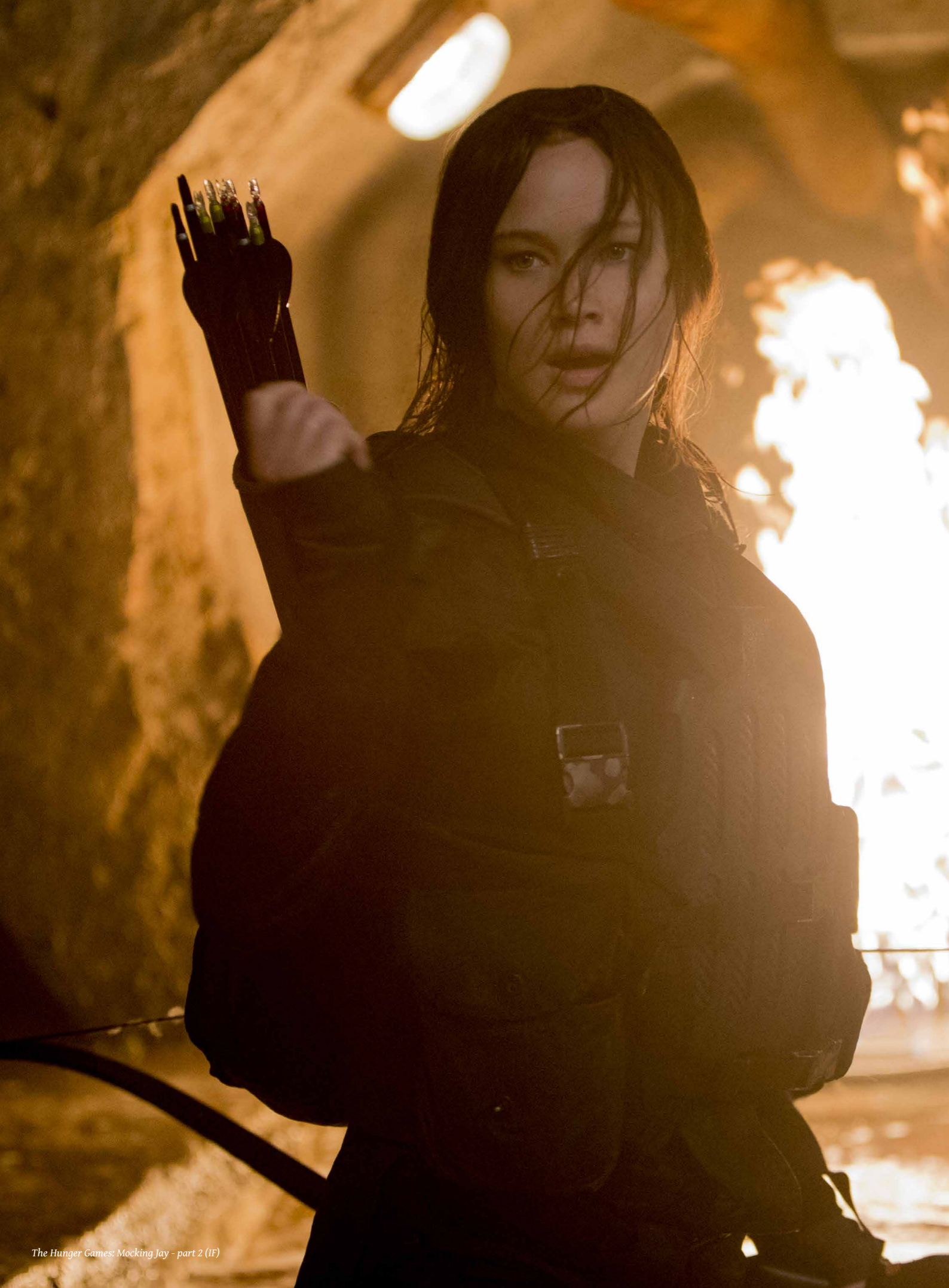
The Hunger Games: Mocking Jay - part 2 (IF)