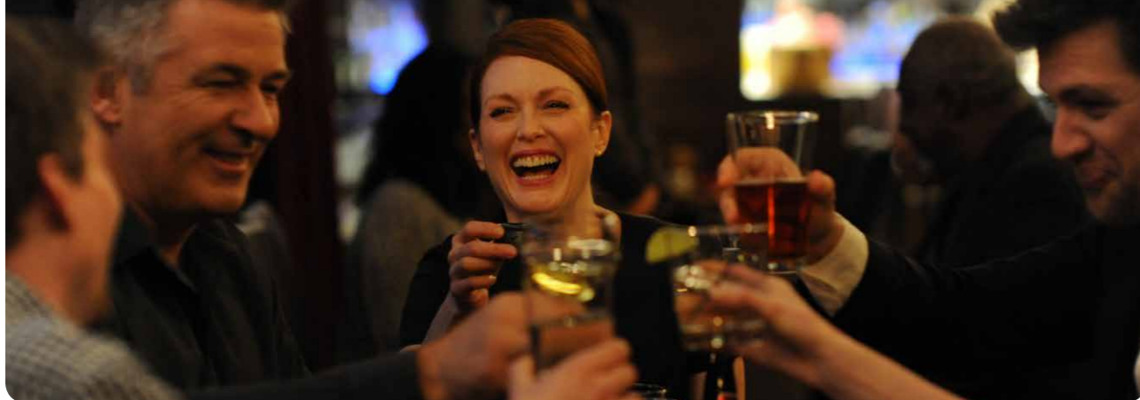
Still Alice (SFD)