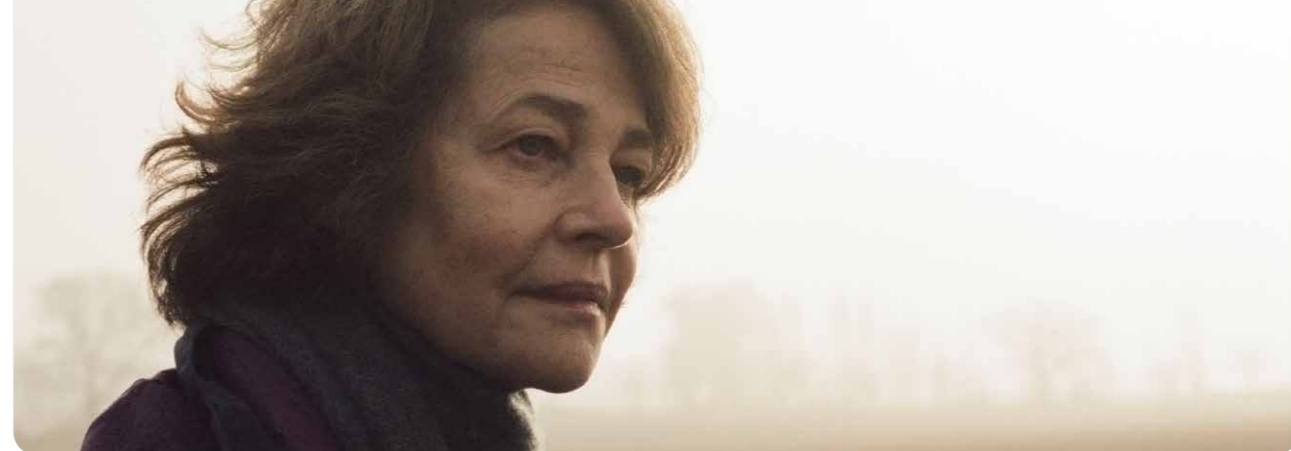
45 Years (CW)

De NVF is zich in 2015 blijven inzetten om de overheid te bewegen meer aandacht te schenken aan de problematiek als gevolg van piraterij. De vereniging was blij met de activatie van een industriewerkgroep, bestaande uit vertegenwoordigers van gerelateerde marktpartijen, die piraterij branchebreed en vanuit diverse invalshoeken wil bestrijden.