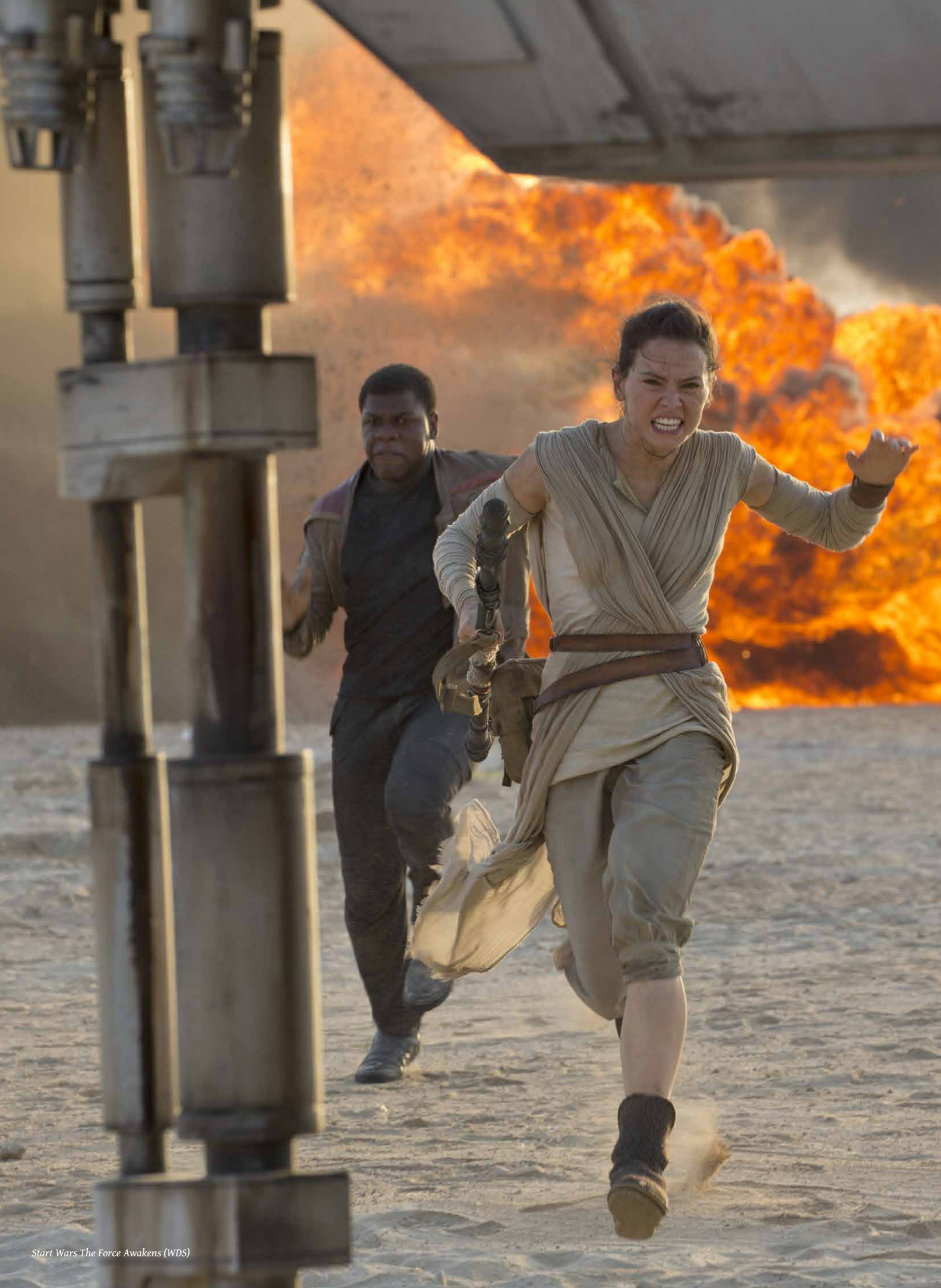
Star Wars The Force Awakens (WDS)