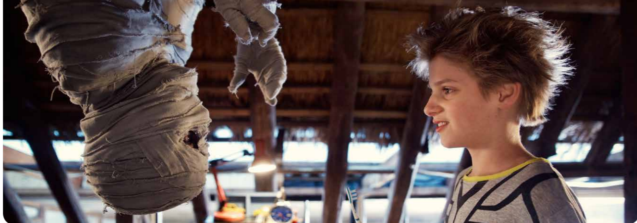
Dummitie de mummie (DFW)

Tijdens de extra ALV van 10 maart in bioscoop de FilmHallen te Amsterdam hebben de leden, formeel, hun instemming gegeven aan bovengenoemde uitgangspunten, resulterend in de volgende taken voor de NVBF-vereniging cq. het NVBF-bureau: