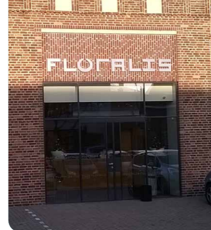
Cinema Floralis en Filmhuis Lisse