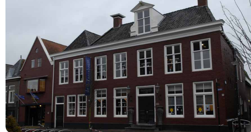
Theater De Koorbeurs, Franeker