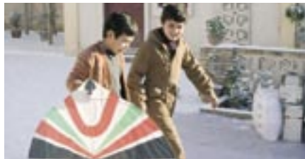
The Kite Runner (UPI)

Op 17 juni vond de eerste ALV plaats van 2008. Tijdens deze ALV werd de jaarrekening 2007 vastgesteld en kregen de bestuursleden decharge voor het gevoerde beleid over 2007. Tijdens deze ALV werd ook uitleg gegeven over de cao-onderhandelingen, de resultaten en de reden waarom het cao-traject zolang duurde. In december 2007 leek het concept cao-akkoord gereed. Uiteindelijk kon het akkoord in april worden ondertekend. Het filmstimuleringsbeleid was een onderwerp dat ook ter sprake kwam tijdens de ALV. De overheid en andere partijen maakten al eerder kenbaar dat zij graag zagen dat de filmbranche meer gelden beschikbaar zou stellen ter stimulering van de Nederlandse film naast het huidige (btw-)convenant. De NVB gaf aan graag in gesprek te willen zijn en blijven met politiek Den Haag, maar dan wel in samenhang met onderwerpen die de NVB en filmbranche na aan het hart liggen en tot op zekere hoogte ook de ondersteuning van de wetgever behoeven.