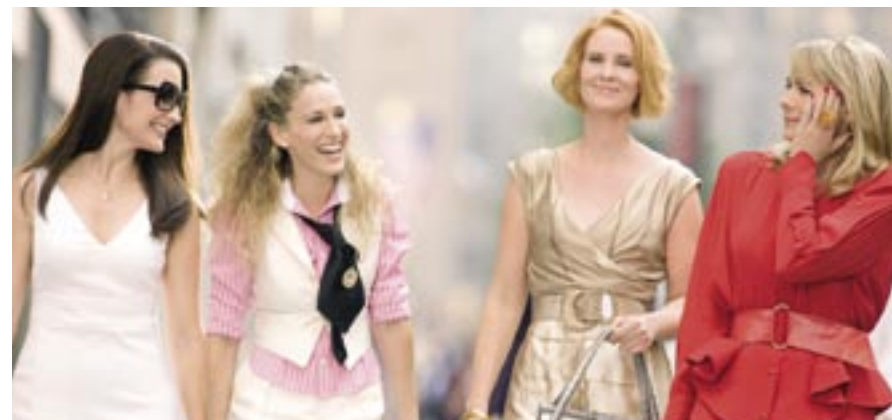
Sex and the City: The Movie (PAR)

Het ledenaantal van de NVF is in het verslagjaar per saldo met twee toegenomen. MultitoneFilm heeft wegens beëindiging van de activiteiten het lidmaatschap opgezegd. 20th Century Fox Netherlands BV heeft haar