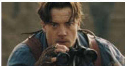
The Mummy: Tomb of the Dragon Emperor

adres: Teleport Boulevard 110 1043 EJ Amsterdam postadres: Postbus 59329 1040 KH Amsterdam tel.: 020 - 386 86 30 fax: 020 - 386 86 31 e-mail: secretariaat@filmdistributeurs.nl website: www.filmdistributeurs.nl website: www.nfcstatistiek.nl website: www.filmdepot.nl