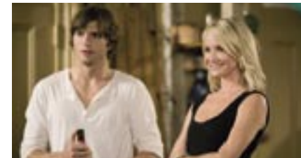
What Happens in Vegas (FOX (WB))

gebied'. De NVB-directeur opereert binnen het mandaat van de verenigingsstatuten en het huishoudelijk reglement en passend binnen de NVB-beleidskaders. Het algemene beleidskader voor de directeur en zijn medewerkers is het NVB-jaarplan en de daarbij behorende begroting, al of niet met aanvulling vanuit andere, aanvullende 'kadernotities'. De kaders moeten vooral eenduidig en helder zijn. Voor zaken die niet passen binnen de vastgestelde kaders kan de directeur de hulp inroepen van één van de bestuursleden die het bewuste beleidsterrein 'in portefeuille' heeft. Daarnaast kan de directeur zich laten bijstaan door een (eigen) directiecommissie of een werkgroep met een specifieke opdracht. Het bestuur kan ook een adviescommissie of een werkgroep in het leven roepen. Zo'n commissie of werkgroep wordt samengesteld op basis van vaardigheid en deskundigheid. Ook niet-leden kunnen deelnemen aan de commissie of de werkgroep. Het bestuur stelt de taken en bevoegdheden van de commissie of de werkgroep vast. Naast deze verheldering en aanscherping werd er ook nadrukkelijk gesproken over de geledingen binnen de NVB-vereniging. Daarbij werd de conclusie getrokken dat zowel de concerns, de onafhankelijke bioscopen als de filmtheaters zogezegd 'een plek hebben' binnen de vereniging en het bestuur.