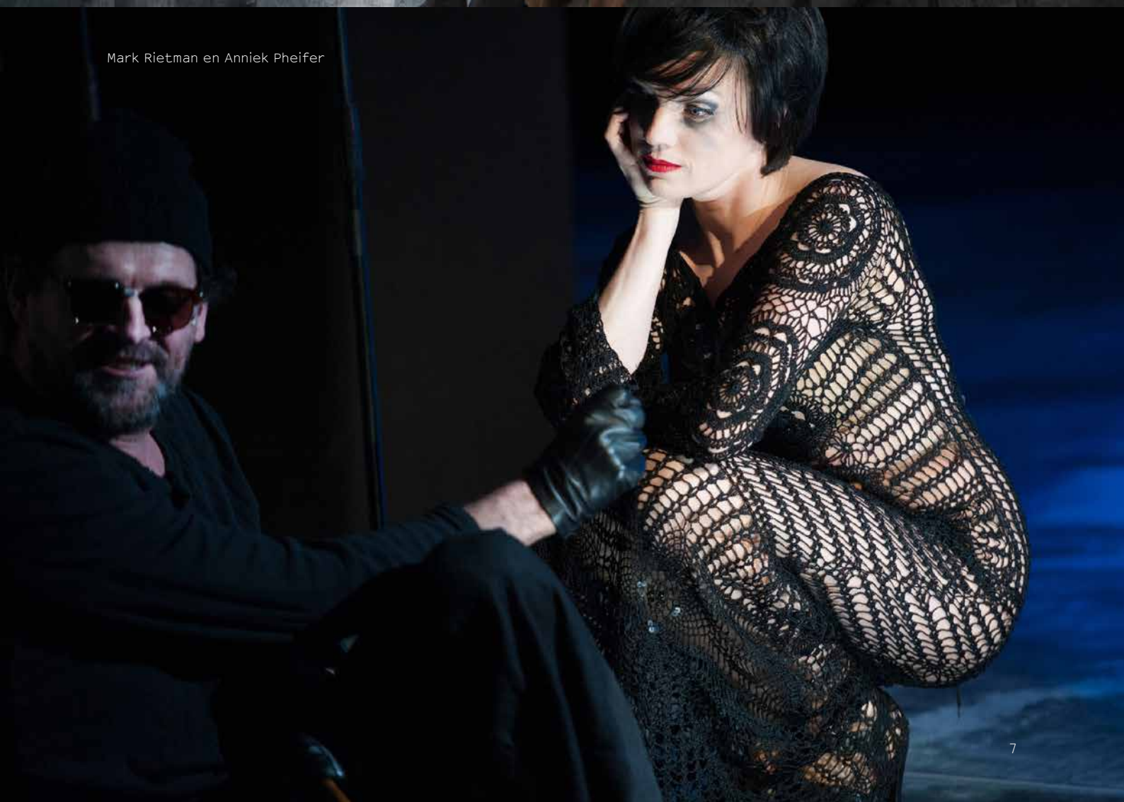
Mark Rietman en Anniek Pheifer