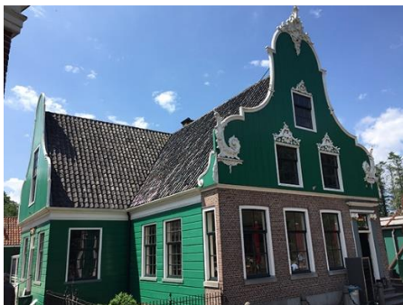
Afbeelding 2: pand Krommenie

De woning uit Krommenie, pal aan het Zaanse Plein, is omgetoverd tot een nieuw onderkomen. Voorheen was de winkel van 'Zus en Jet' hier gevestigd. Na contractbeëindiging stond het pand leeg. Besloten werd hierin een tijdelijk fairtrade café te realiseren. Na een grondige verbouwing kunnen bezoekers hier nu koffie nuttigen, maar ook informatie vinden over koffie, de herkomst en geschiedenis van koffie én de gruwelijkheden rond de slavenhandel.