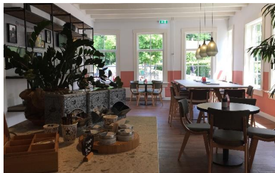
Afbeelding 3: interieur na verbouwing