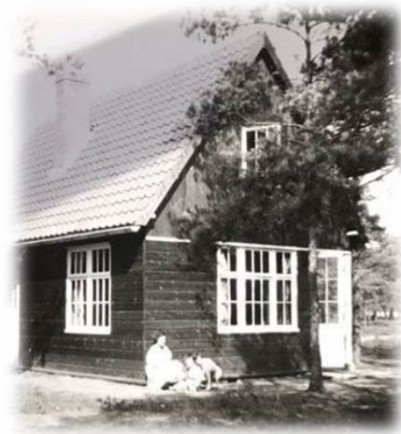
Afbeelding 1: vakantiewoning Warnsveld

Het museum wil de woning in deelgebied Veld plaatsen. Dat betekent dat wij nu de kans hebben om elders in het museumpark geplaatste vakantieverblijven - het vakantiehuisje van architect Rietveld en de stacaravan uit Nunspeet - ook naar deelgebied Veld te verhuizen. Daarmee ontstaat in de noordrand van het Openluchtmuseum een klein vakantie terrein.