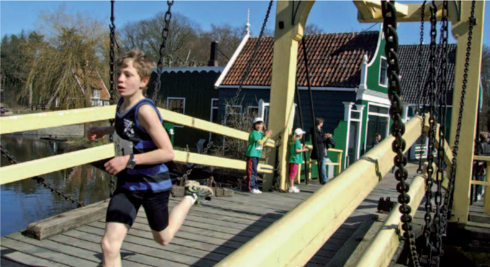
Op 16 juli 2011 legden de burgemeesters van Amsterdam en Arnhem, Eberhard van der Laan en Pauline Krikke, in het Openluchtmuseum de eerste steen voor de herbouw van de panden uit de Amsterdamse Westerstraat. Familieloop Rondje Nederland in het Openluchtmuseum, 27 maart 2011; in samenwerking met atletiekvereniging Ciko '66.