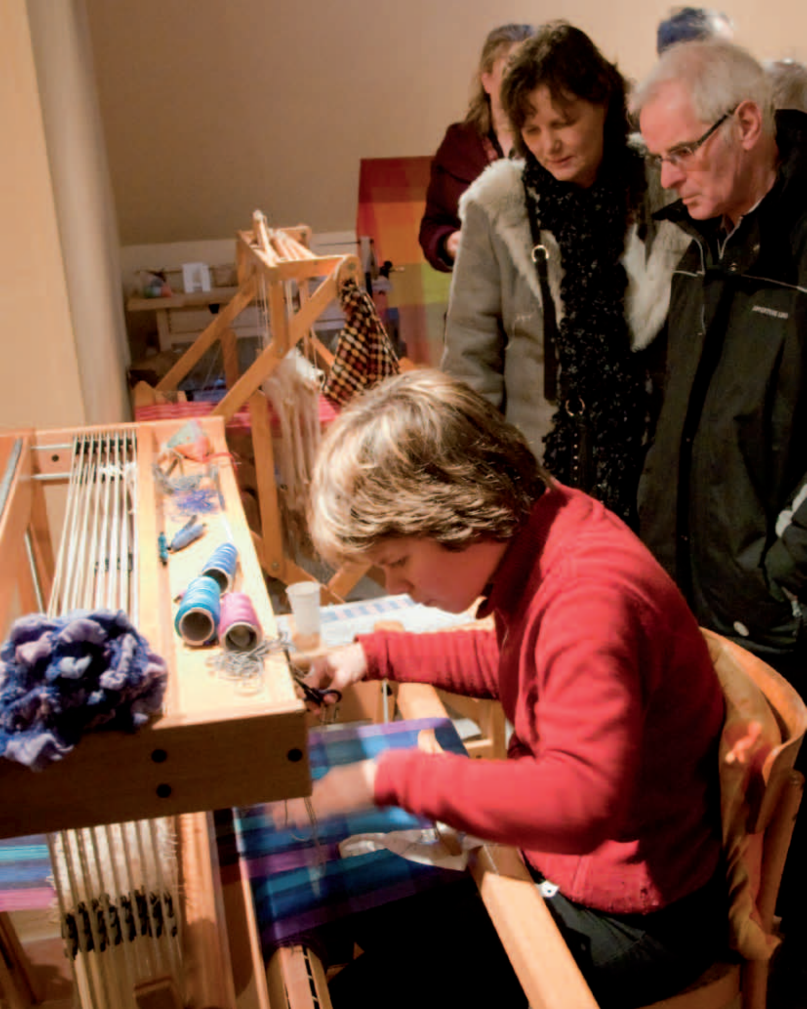
Het Openluchtmuseum biedt plaats aan mensen met uiteenlopende talenten. Vanuit werkplaats Magenta (Driebergen) werken jongeren in de weverij van het museum.