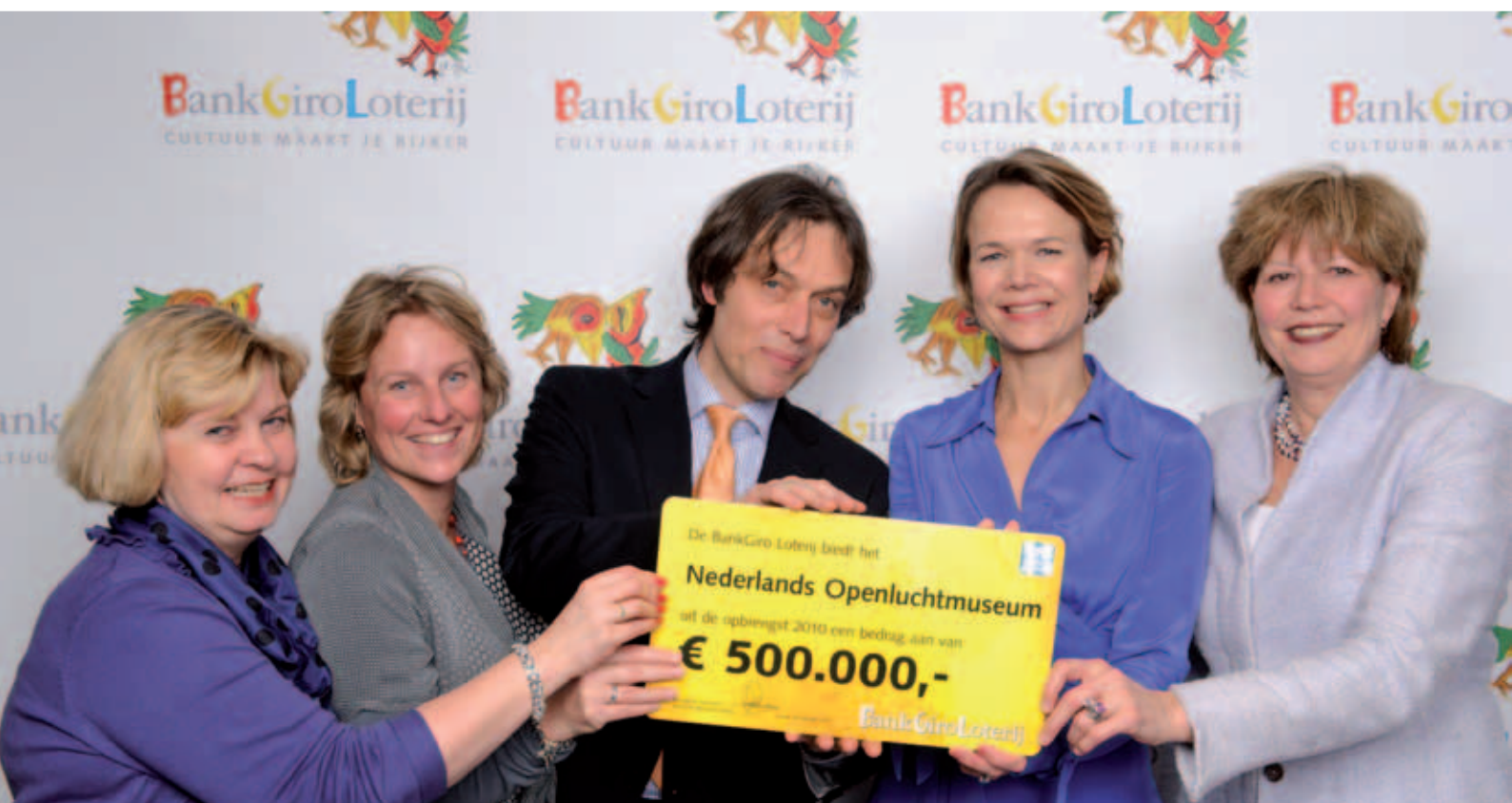
Het Nederlands Openluchtmuseum is beneficiënt van de BankGiro Loterij. Dankzij jaarlijkse bijdragen van de BGL kan het museum zijn bezoekers een hoge kwaliteit aan verlevendiging bieden.

Bezoekers konden terecht in een groot aantal veelal bemensde locaties, op de ijsbaan bij de ingang, op de sleebaan bij de Delftse molen, lopend langs de winterroute, bij de wintermarkt op het Zaanse plein, op het Kindererf met een eigen programmering of luisteren naar een van de concerten in het Zeeuwse kerkje. Naast de normale rondleidingen werden rondleidingen gehouden met slechts enkele lantaarns mee om te ervaren hoe men moest omgaan met het nachtelijke duister.