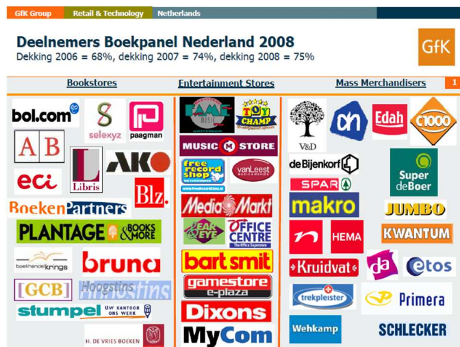
Figuur 1 Deelnemers boekpanel GfK

Sinds begin 2007 worden de daadwerkelijk via kassa en internet verkochte (algemene) boeken in kaart gebracht door onderzoeksbureau GfK in opdracht van Stichting Marktonderzoek Boekenvak (SMB). GfK volgt wekelijks de absolute verkopen in drie kanalen: boekhandel, muziekwinkels en overig (supermarkt, benzinestations, warenhuizen, drogisterij).