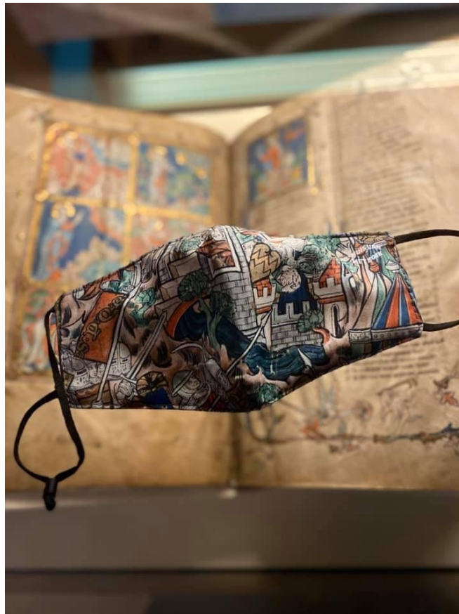
Maerlants 'Rijmbijbel' mondkapje, oktober 2020