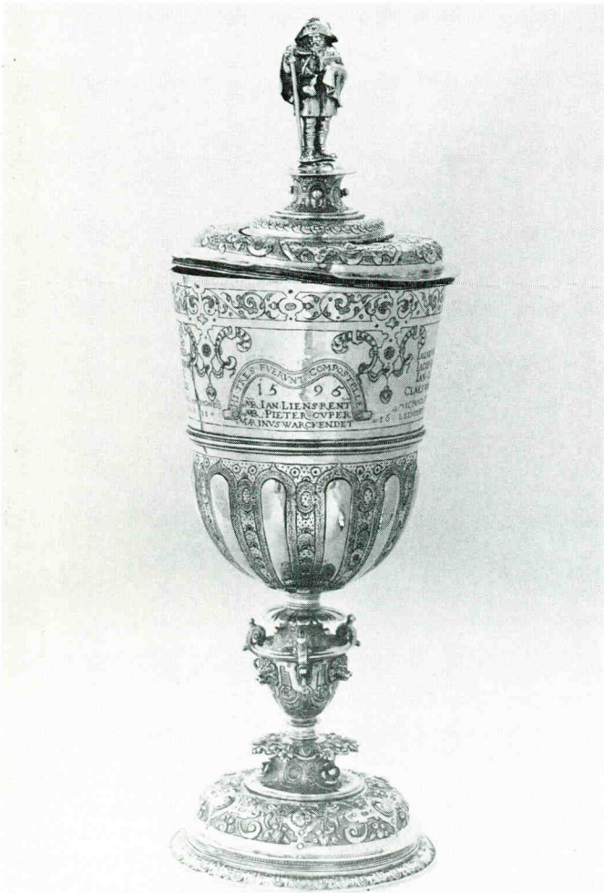
Beker St. Jacobsgilde St. Maartensdijk. Gemeente Tholen.

ken of een maaltijd bekostigen. Uit dien hoofde werden in 1538 bij Klaas van der Burcht, zilversmid in Antwerpen, vijftien zilveren kroezen besteld, die door vijftien nieuwe leden van het stadsbestuur werden geschonken.