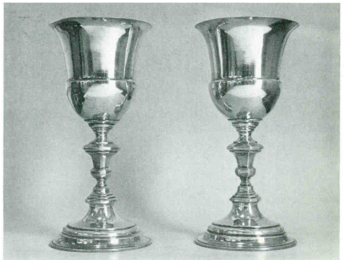
Avondmaalsbekers Waalse gemeente, Gemeente Goes.

Een volledig beeld van hetgeen de overheid aan zilveren voorwerpen voor eigen gebruik bezat valt niet uit de stadsrekeningen af te lezen. De vraag rijst waar het betreffende zilver is gebleven. Het antwoord daarop is niet moeilijk te geven. Een der voornaamste oorzaken van het niet meer aanwezig zijn van deze voorwerpen, zijn de vele oorlogen en troebelen die in Zeeland in alle hevigheid hebben gewoed. Daardoor kwam de overheid vaak in geldnood te verkeren en in dergelijke situaties werd meer dan eens naar het middel van opvraging van gouden en zilveren voorwerpen gegrepen. Ook het zilver van de overheid kwam bij die gelegenheden in de smeltkroes terecht. Voor de laatste maal gebeurde dit in 1795 en dit moet een van de zwaarste vorderingen geweest zijn die hier ooit heeft plaatsgevonden. Deze volgde immers op een tijdvak waarin zilveren voorwerpen op grote schaal in gebruik waren genomen. Bij de opvraging bestond de gelegenheid het zilver te 'lossen', door de waarde ervan in baar geld af te dragen, als gevolg waarvan niet al het zilver in 1795 in de smeltkroes terecht is gekomen.