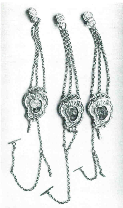
Bodebussen Goes. Gemeente Goes.

In het museum te Zierikzee bevindt zich een keur van zilveren voorwerpen die in gebruik zijn geweest bij over-