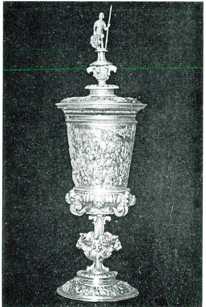
Beker Maximiliaan van Bourgondië. Gemeente Veere.

heid, gilden en particulieren en bij de meekrapcultuur. 1) Afzonderlijke vermelding verdient de zilveren thesaurierschaal die in 1580 door een Zierikzeese zilversmid werd gemaakt.