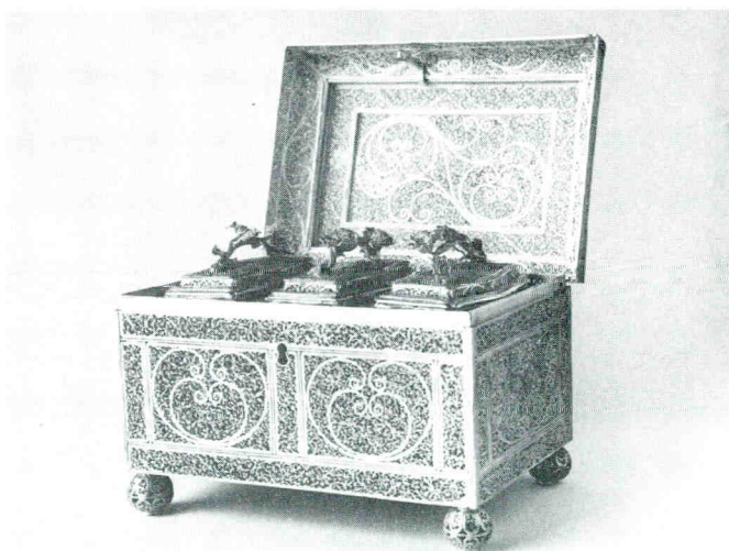
Theekistje. Gemeente Middelburg.

In 1413 bezat Middelburg reeds kroezen en schalen, waarvan de rekeningen vermelden dat zij in dat jaar opnieuw werden gepolijst. In 1431 werden vier kroezen voor dagelijks gebruik aangeschaft en in 1511 werden in Antwerpen zestien nieuwe kroezen en zes dito schalen gekocht. Lange tijd gold de bepaling dat nieuwe schepenen bij het aanvaarden van hun ambt een zilveren kroes moesten schen-