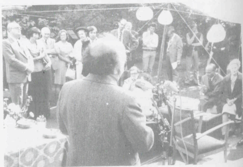
Dankwoord van de heer Maas