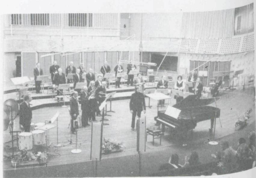
Radio Kamer Orkest tijdens het concert in de Gaudeamus Muziekweek