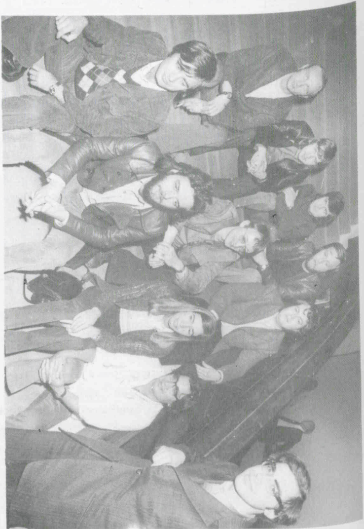
Prijswinnaars van het Internationaal Gaudemannus Vertolkers Concours 1974