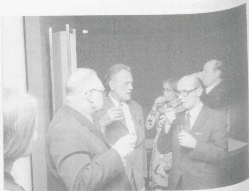
receptie in de VARA Studio