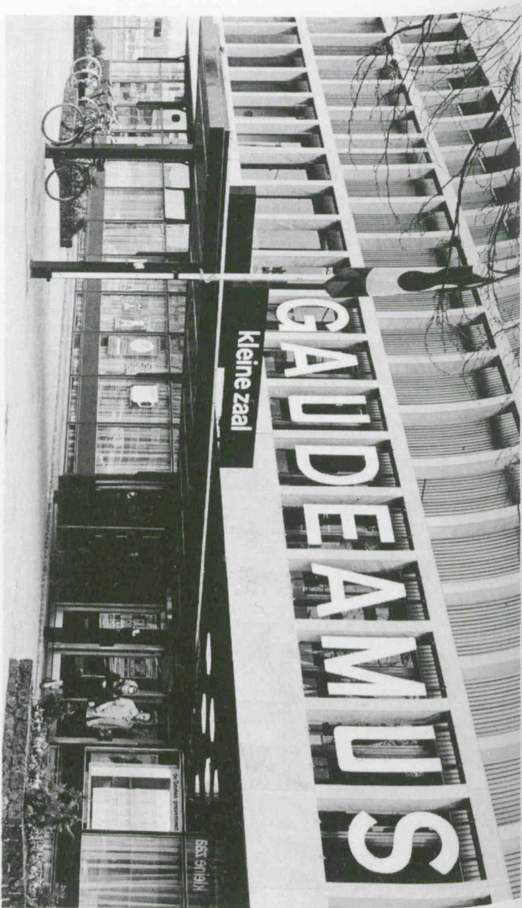
De Doelen Rotterdam