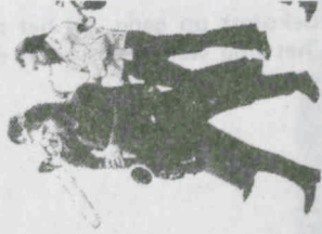
Instant Composers Pool

Het Nederlands Saxofoon Kwartet, daarentegen, was nog nooit in Londen geweest en dat was te merken aan de opkomst. Er waren zestien mensen, en als je daar de 'officiële' personen uittoekent, blijven er acht over. Niet