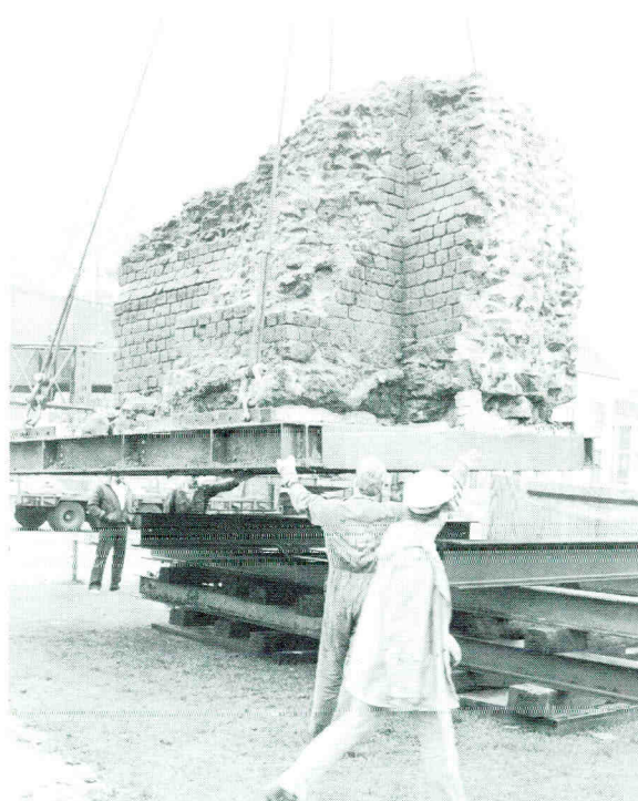
Een gedeelte van een Romeinse muur wordt tijdelijk verplaatst ten behoeve van woningbouw.

Steeds vaker komt het voor dat gemeenten cultuurhistorische overblijfselen gaan beschermen. Het voortdurend laten prevaleren van tijdelijke economische belangen ten opzichte van eeuwenlang opgebouwd erfgoed, dat ook toekomstige generaties enige vreugde zou moeten schenken, kan niet eindeloos doorgaan. Toch zijn andere belangen vaak dermate zwaarwegend dat een volledige bescherming buiten proporties dreigt te raken. Ondanks alle bezwaren is de keuze die in Nijmegen is