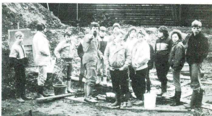
Na een uitleg van de werkzaamheden konden de kinderen aan het werk.

Naar aanleiding van het succes van dit project en de reacties van de kinderen waaruit bleek dat de enige kritiek was dat men zelf niet mocht opgraven, is het jaar daarop een nieuw project opgezet waarin het opgraven zelf centraal stond. Begeleid door lesbrieven, kranten, diaseries, en een film over kinderen en ziekenhuizen hebben ca. 1.000 kinderen van de Delftse basisscholen en het voortgezet onderwijs zelf een dag meegeholpen op de opgraving van het uit de 13e eeuw stammende Oude Gasthuis te Delft.