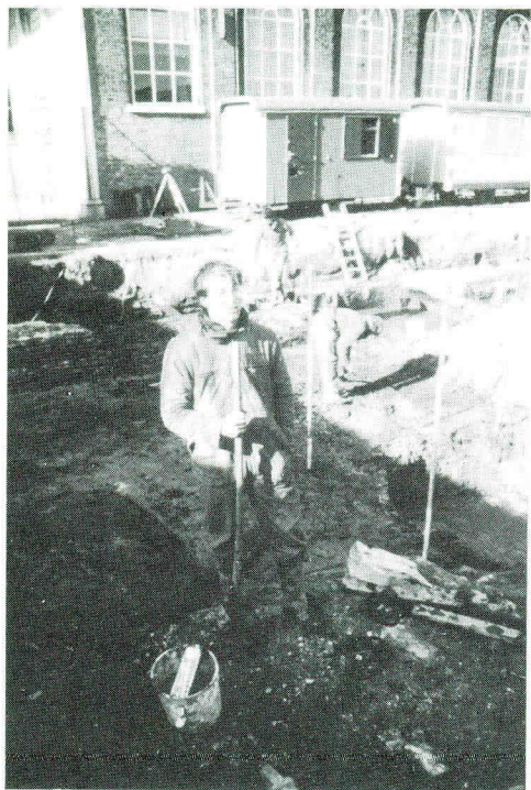
Opgraving van het Oude Gasthuis aan de Koornmarkt te Delft, 1986. Een deel van het omvangrijke opgravingswerk werd uitgevoerd door vrijwilligers en studenten.

26 getoond hoe archeologie onder meer kan worden aangewend.