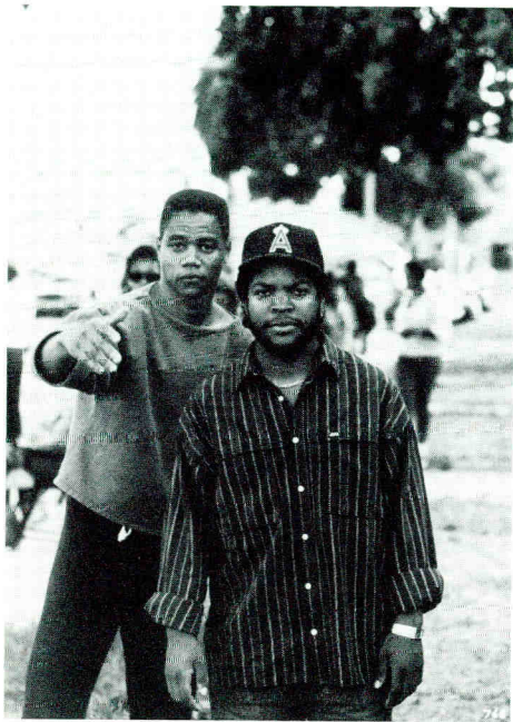
BOYZ 'N THE HOOD

De leden komen uit verschillende levensbeschouwelijke en maatschappelijke stromingen. Zij zijn opgeleid en/of werkzaam op verschillende terreinen van deskundigheid betreffende jeugd of film, waaronder ook ouderschap kan worden begrepen.