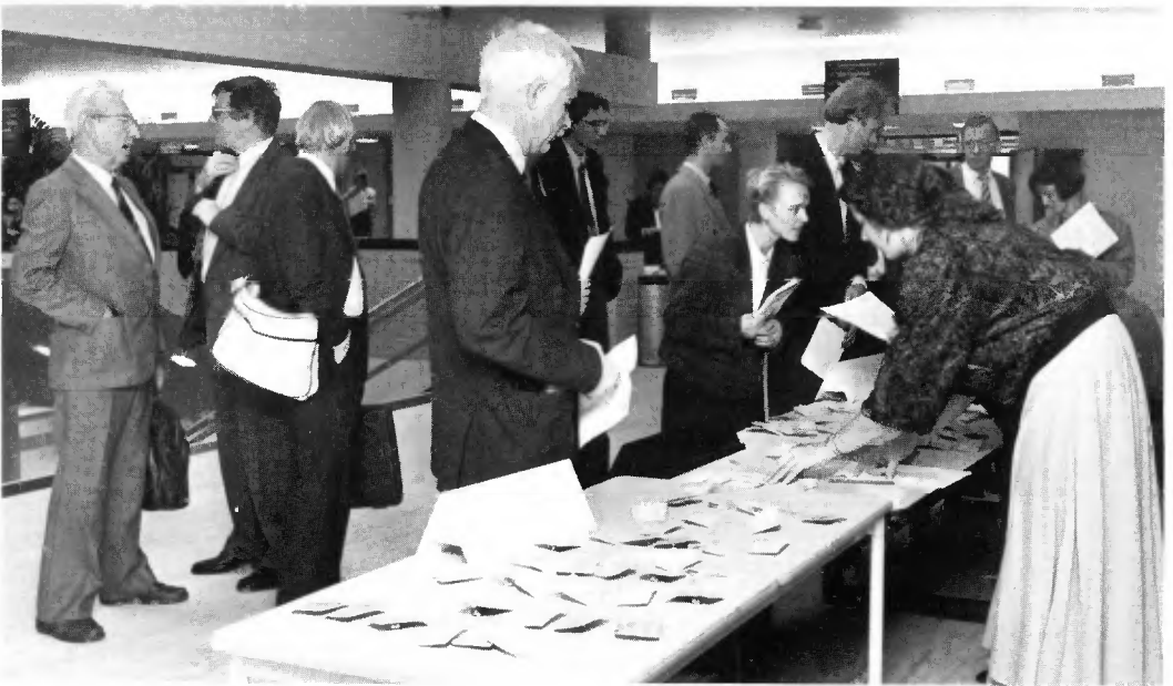
Op 22 november werd het congres "De markt van informatie voor het midden- en kleinbedrijf" gehouden.