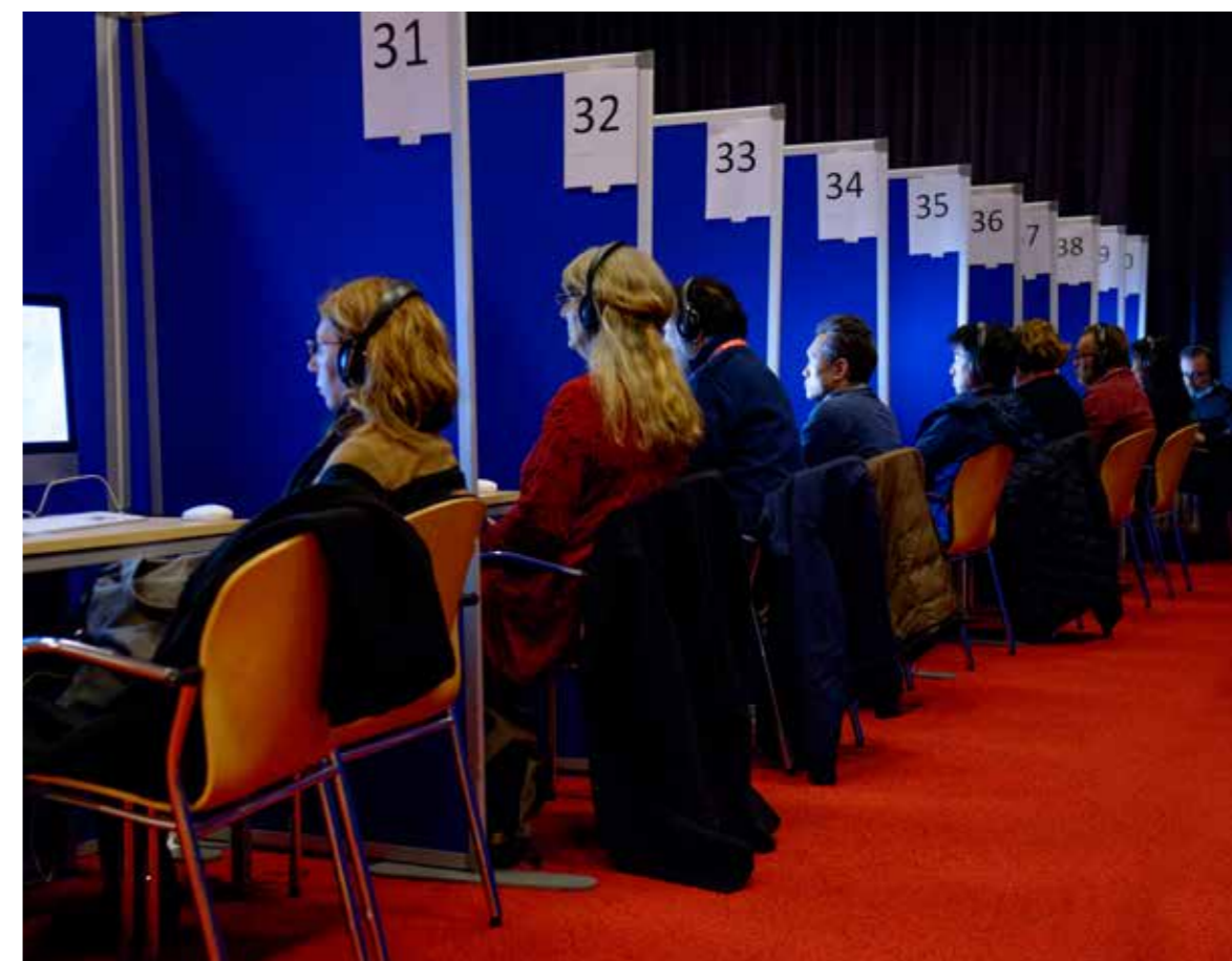
In plaats van Uitzending gemist heeft IFFR Voorstelling gemist: de VideoLibrary waar filmprofessionals de schade kunnen inhalen.

Zilveren Beer Alfred Bauer Prijs, Berlinale 2016