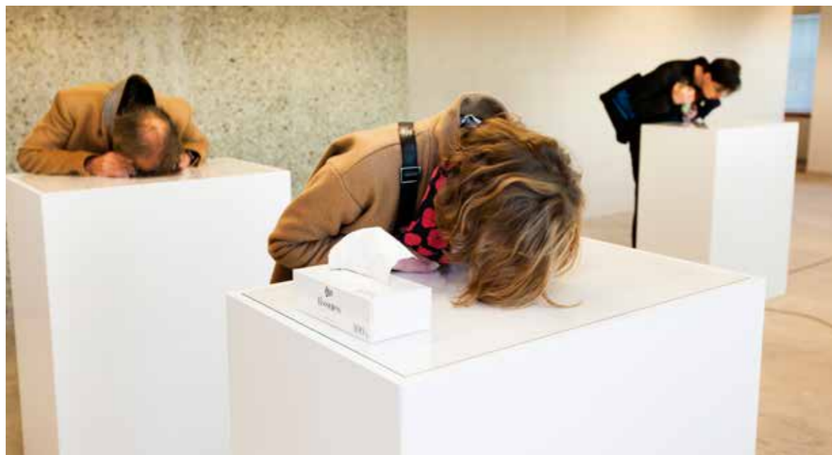
Op de expositie Spaces Within keken bezoekers hun ogen uit. Bijvoorbeeld met deze futuristische kijkdozen met van bovenaf gefilmde 3D-situaties.