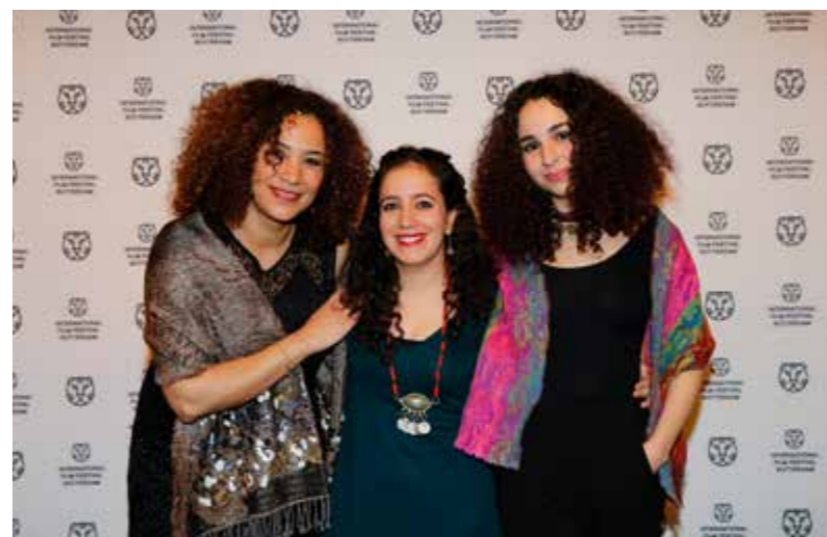
Filmmaker Leyla Bouzid tussen de hoofdrolspelers uit haar speelfilmdebuut As I Open My Eyes .