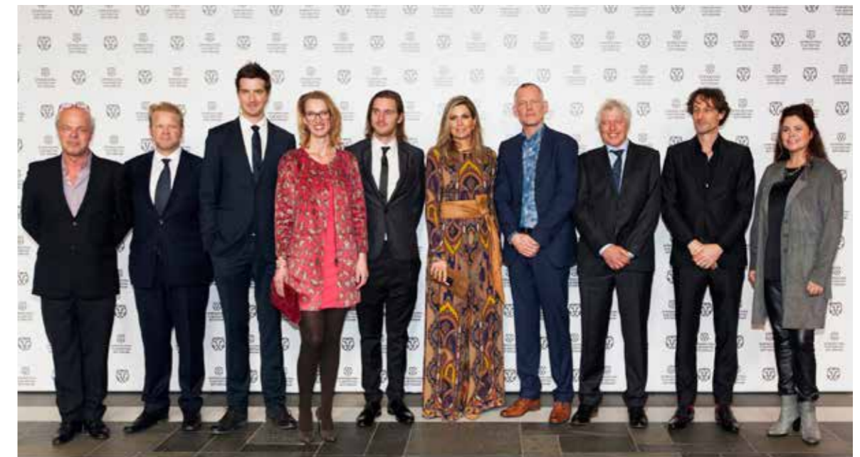
Cast en crew van Beyond Sleep vieren hun wereldpremière met Hare Majesteit Koningin Máxima. De komst van koningin Máxima naar de openingsfilm van IFFR én haar pak waren die dag het onderwerp van gesprek in de media.