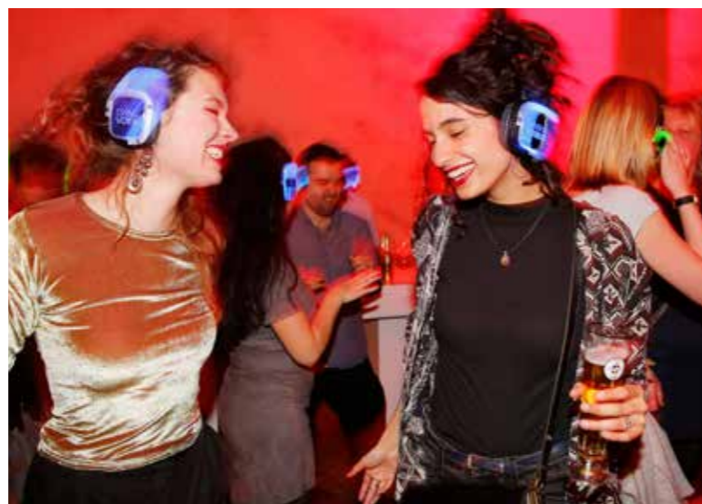
Een Silent Disco op Closing Night maakt iedereen blij, ook de burens.

De films zijn te bekijken op iTunes.com/IFFR .