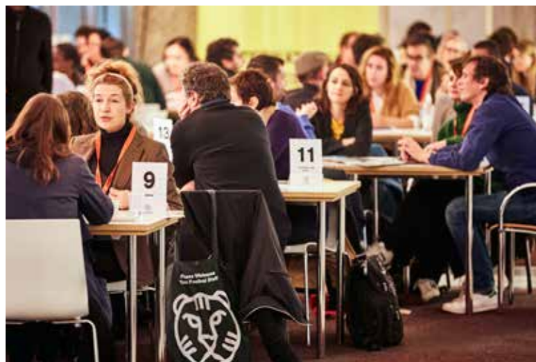
Een informele sfeer en de aanwezigheid van talenten uit de internationale filmindustrie zijn deel van de succesformule van CineMart.