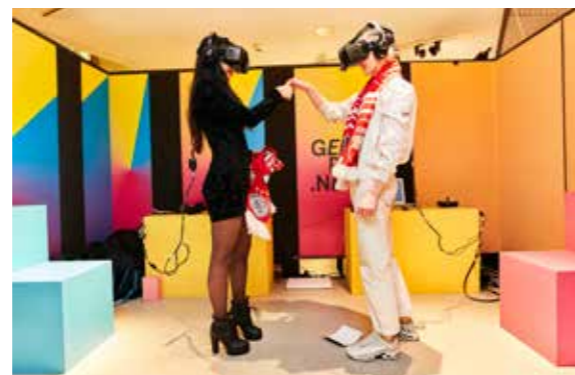
Met de Gender Swap Machine wisselde je tijdelijk van geslacht.

Vanzelfsprekend maakt de Hivos Tiger Awards Competitie, het vlaggenschip van het festival, onderdeel uit van Bright Future. De competitie kreeg een robuuste upgrade. Zo werd het aantal kanshebbers gereduceerd tot acht genomineerden, die elk hun eigen festivaldag toebedeeld kregen om zo optimaal mogelijk 'hun moment' te krijgen. Ging het voorheen om drie gelijkwaardige prijzen, vanaf editie 2016 is er maar één Hivos Tiger Award te winnen. Het daaraan verbonden geldbedrag werd aanzienlijk opgehoogd naar €40.000. De grotere hoofdprijs moet IFFR als premièreplatform aantrekkelijker maken voor internationaal regie- en productietalent.