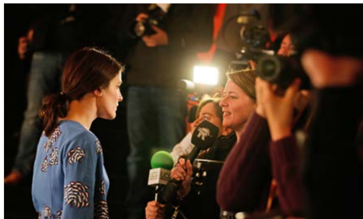
Actrice Phoebe Fox van de officiële openingsfilm 'War Book' kreeg veel aandacht van de aanwezige pers.