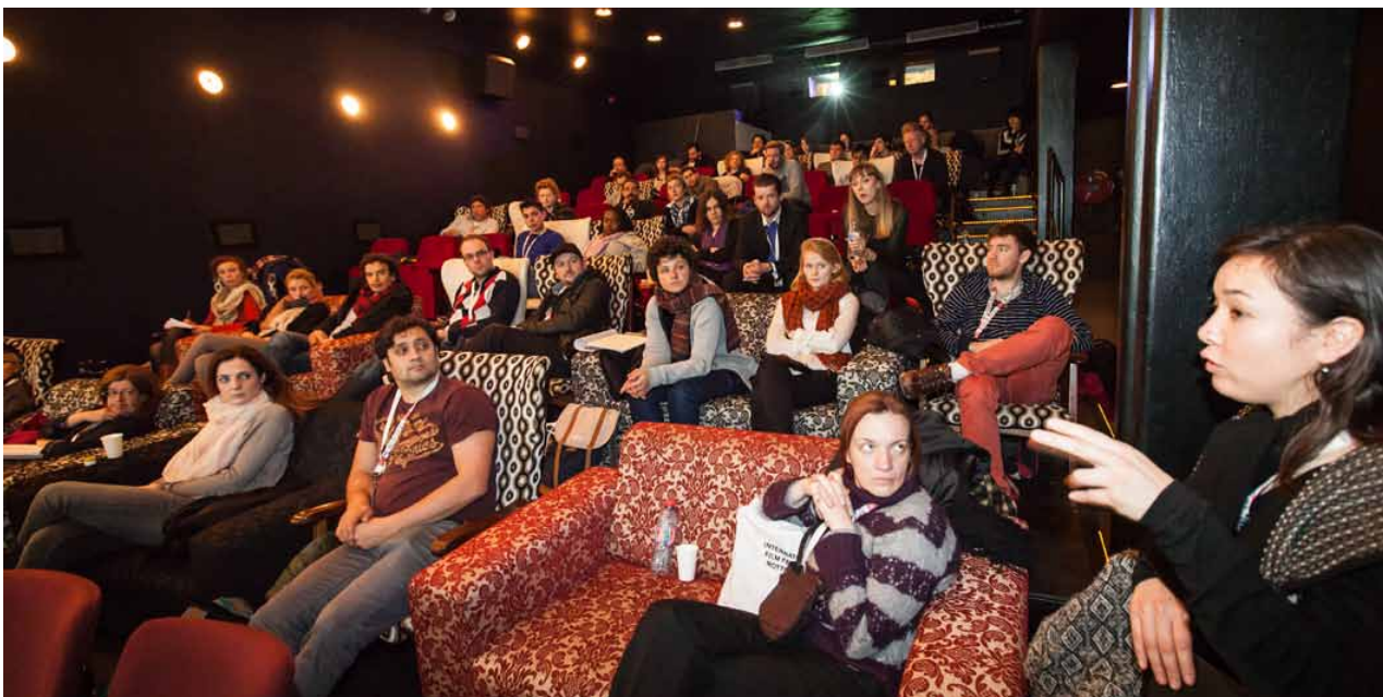
Beginnende producenten komen bij elkaar in het Rotterdam Lab

IFFR is de bakermat van bijzondere filmproducties. Terwijl het festivalpubliek in de zalen van films geniet, komen filmprofessionals van over de hele wereld naar Rotterdam om op CineMart zaken te doen. Met zijn internationale coproductiemarkt staat IFFR al 31 jaar aan de basis van kunstzinnige, vernieuwende cinema.