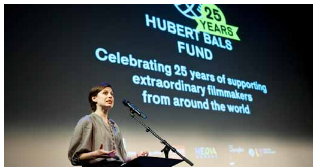
Het Hubert Bals Fonds verricht al 25 jaar goed werk