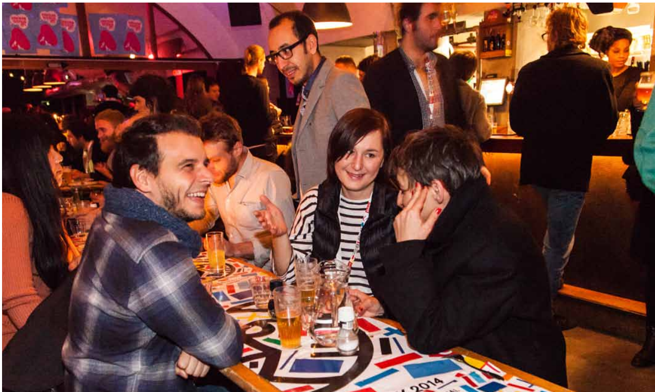
Regisseurs aan het aperitief tijdens een Director's Dinner in Bird

De Film Office stond ook deze editie weer garant voor een uitgebreid servicepakket aan bezoekende professionals en fungeerde als intermediair tussen makers van geprogrammeerde films, aanwezige sales agents, distributeurs, televisie-inkopers en pers. Zij waren allemaal welkom in de digitale videotheek (waarvan de content ook beschikbaar was op eigen laptops en tablets). Dit jaar waren er in de videotheek 392 titels beschikbaar, die in totaal 7.614 keer bekeken werden. Bij de vertoningen op het witte doek tijdens de Press & Industry Screenings werden 3.551 bezoeken geteld. Filmmakers kregen strategisch advies van vier internationale consultants. Daarnaast presenteerde de Film Office een aantal drukbezochte panels, zoals Strange Bedfellows and Creative Collaborations (over alternatieve geldstromen) en Get Your Film Noticed and Reach an Audience .