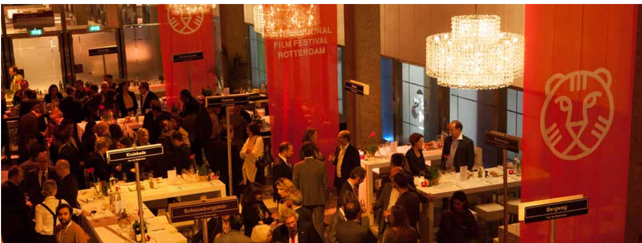
De Tiger Business Lounge-avond op donderdag 22 januari stond geheel in het teken van Rotterdam

Tot slot dankt IFFR alle partijen en individuen die het festival ondersteunen. Zij staan vermeld in het sponsoroverzicht op pagina 32.