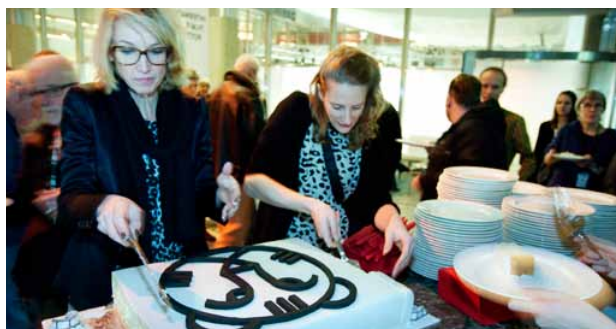
De IFFR-staf trakteert Tiger Friends op taart: de vriendenclub bestaat vijf jaar