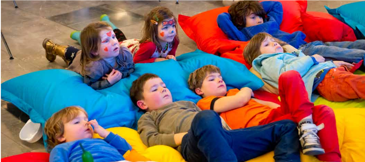
Kids on the Floor: een cinematografische speeltuin voor de allerkleinsten

voor de echte auteurscinema, dus nieuw werk van grote namen als Spike Jonze, Amat Escalante, Alexei German, Jim Jarmusch (wiens Only Lovers Left Alive voorafgaand aan het festival in de Preview Tour als smaakmaker door het hele land trok) en Lukas Moodysson (zijn punky We Are the Best! was de officiële slotfilm).