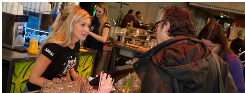
Zadkine-studenten bedienen bezoekers aan de bar van het festivalcafé in de Doelen

In de Rotterdamse Schouwburg kon, zoals inmiddels traditie begint te worden, 's avonds (en 's nachts) gedanst worden. Ook de Mind the Gap -nachten, een geslaagde samenwerking van het festival met magazine Gonzo (circus) in festivallocatie WORM, maakten een comeback. Dat leverde vijf nachten een andere filmische, sensorische en muzikale kruisbestuiving op. Het in de Doelen gevestigde Scopitone Café schotelde 's avonds een vrijwel altijd volle zaal een gratis muziekfilm of -documentaire voor, telkens met (muzikale) toegift.