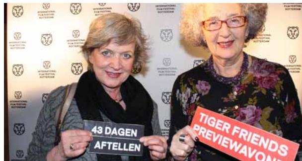
Tiger Friends werden op 10 december 2013 getraakteerd op een sneak preview in LantarenVenster