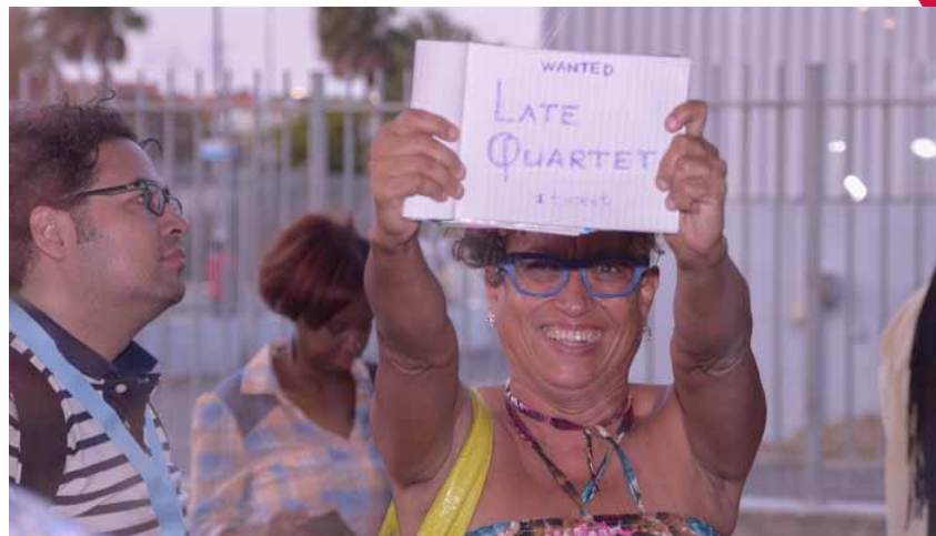
Een bezoeker van Curaçao IFFR, van 21/m 6 april 2014 in Willemstad, op zoek naar een kaartje