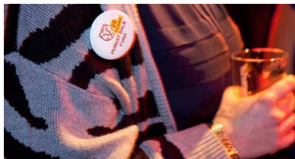
Geen ballonnen maar buttons voor de jubilaris