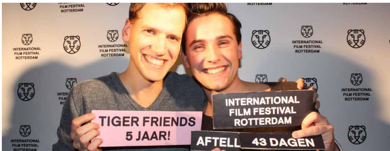
De Tiger Friends zijn echte sterren, met een shoot voor IFFR's fotowall

Vijf jaar Tiger Friends, tien jaar Tiger Business Lounge, 25 jaar Hubert Bals Fonds: IFFR had veel te vieren dit jaar.