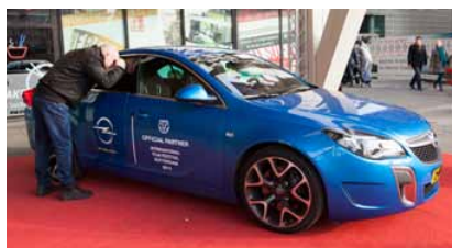
Net als in 2013 stelde Opel auto's beschikbaar voor het vervoer van gasten

Een nieuwe categorie in de samenwerkingsverbanden vormen de mediapartners . VPRO, FunX en De Groene Amsterdammer mengden hun eigen geluid met dat van IFFR in reportages, thema-uitzendingen en verslagen. De VPRO verzorgde VPRO Tiger Reports, onder andere op cinema.nl (zie ook pagina 17), twee IFFR Filmnachten met oude festivalhits op Nederland 2 en, op de eerste festivaldag, het traditionele voorproefje voor