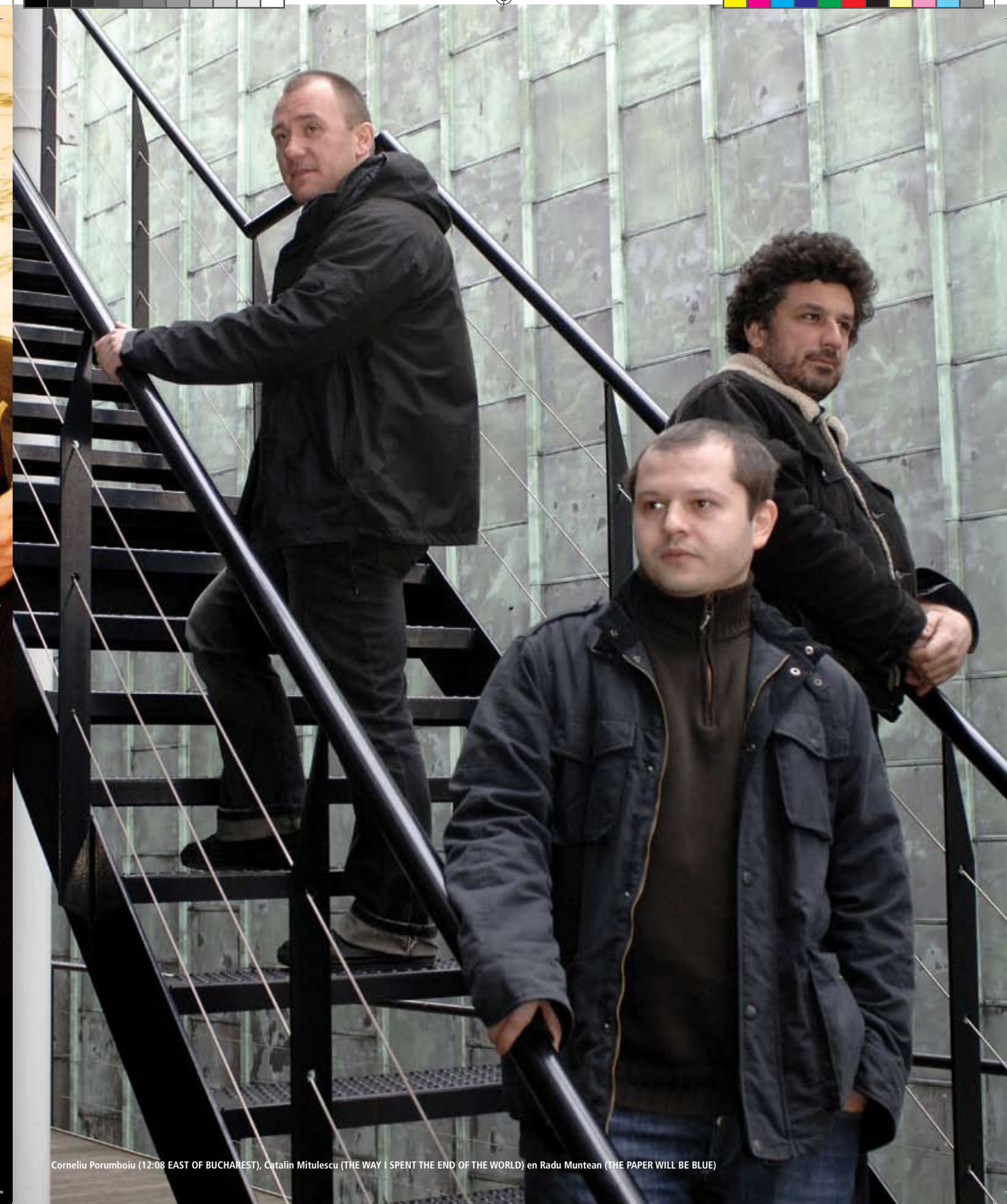
Corneliu Porumboiu (12:08 EAST OF BUCHAREST), Catalin Mitulescu (THE WAY I SPENT THE END OF THE WORLD) en Radu Muntean (THE PAPER WILL BE BLUE)