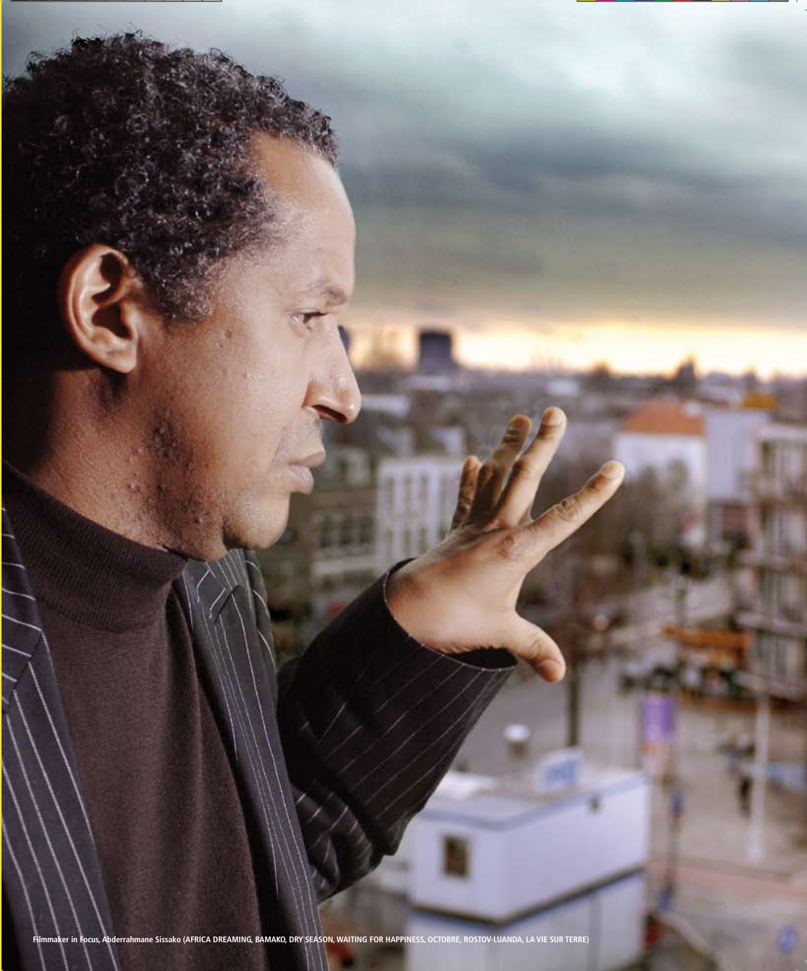
Filmmaker in Focus, Abderrahmane Sissako (AFRICA DREAMING, BAMAKO, DRY SEASON, WAITING FOR HAPPINESS, OCTOBRE, ROSTOV-LUANDA, LA VIE SUR TERRE)