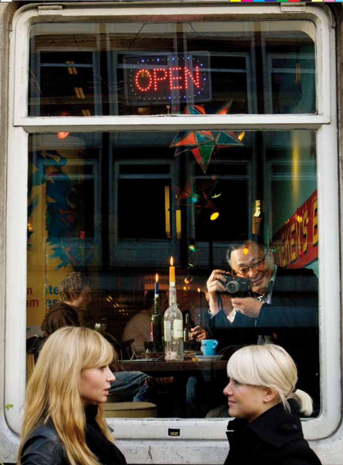
Johnnie To (Filmmaker in Focus (THE BARE-FOOTED KID, ELECTION, ELECTION 2, THE ENIGMATIC CASE, EXILED, A HERO NEVER DIES, JUSTICE, MY FOOT!), LIFELINE, LOVE ON A DIET, LOVING YOU, THE MISSION, NEEDING YOU, PTU, RUNNING ON KARMA, RUNNING OUT OF TIME, RUNNING OUT OF TIME 2, THE STORY OF MY SON, THROW DOWN)