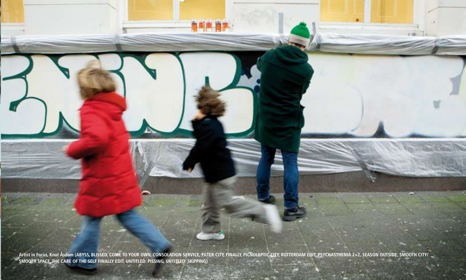
Artist in Focus, Knut Åsdam (ABYSS, BLISSED, COME TO YOUR OWN, CONSOLATION SERVICE, FILTER CITY, FINALLY, PICNOLEPTIC CITY, ROTTERDAM EDIT, PSYCHASTHENIA 2+2, SEASON OUTSIDE, SMOOTH CITY/ SMOOTH SPACE, THE CARE OF THE SELF FINALLY EDIT, UNTITLED: PISSING, UNTITLED: SKIPPING)