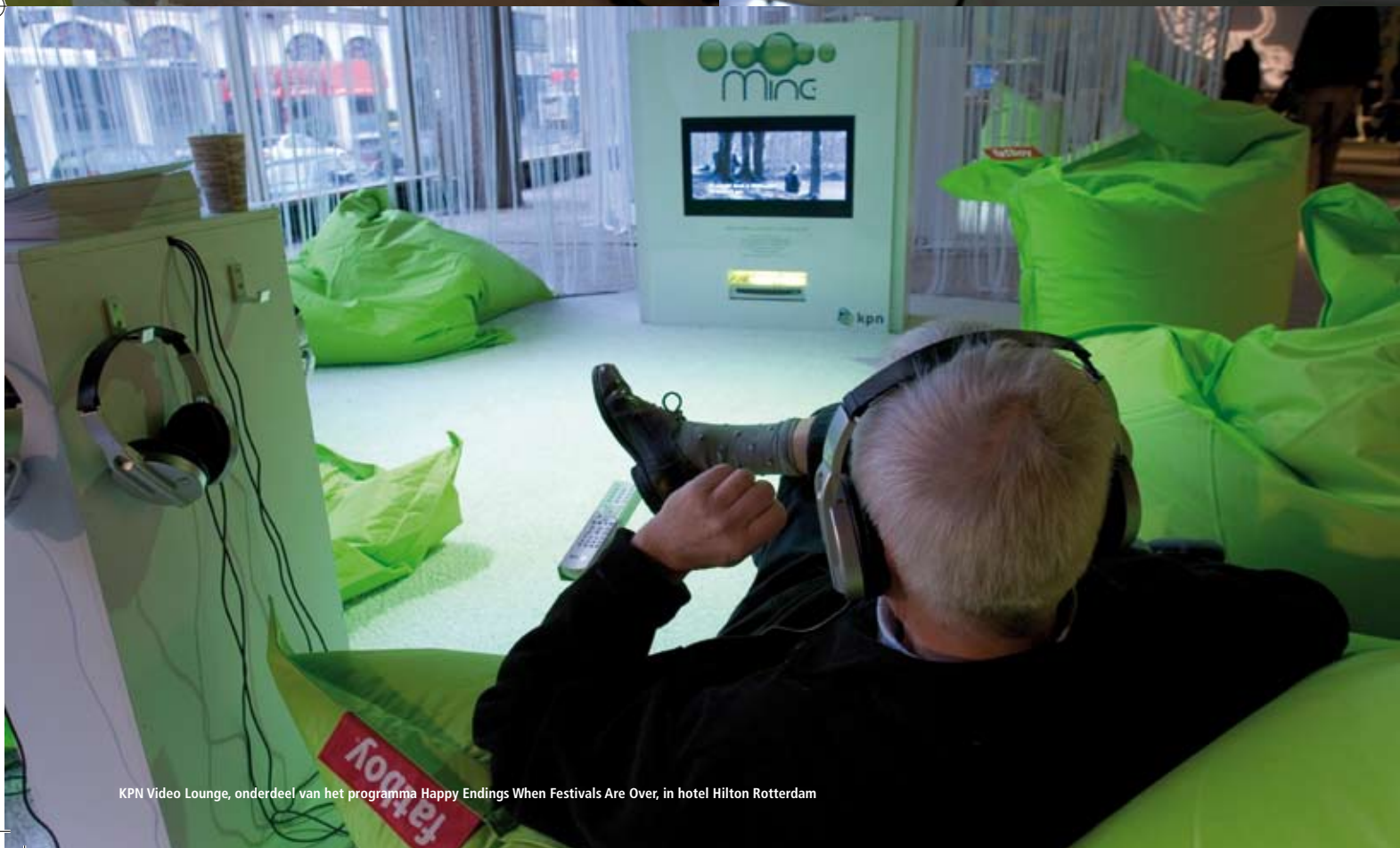
KPN Video Lounge, onderdeel van het programma Happy Endings When Festivals Are Over, in hotel Hilton Rotterdam