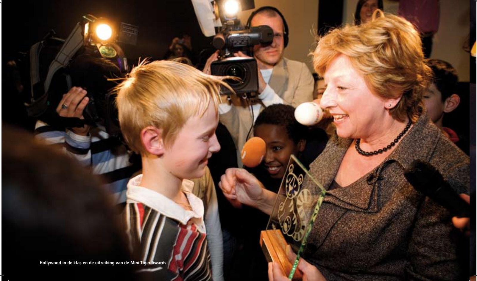
Hollywood in de klas en de uitreiking van de Mini Tiger Awards