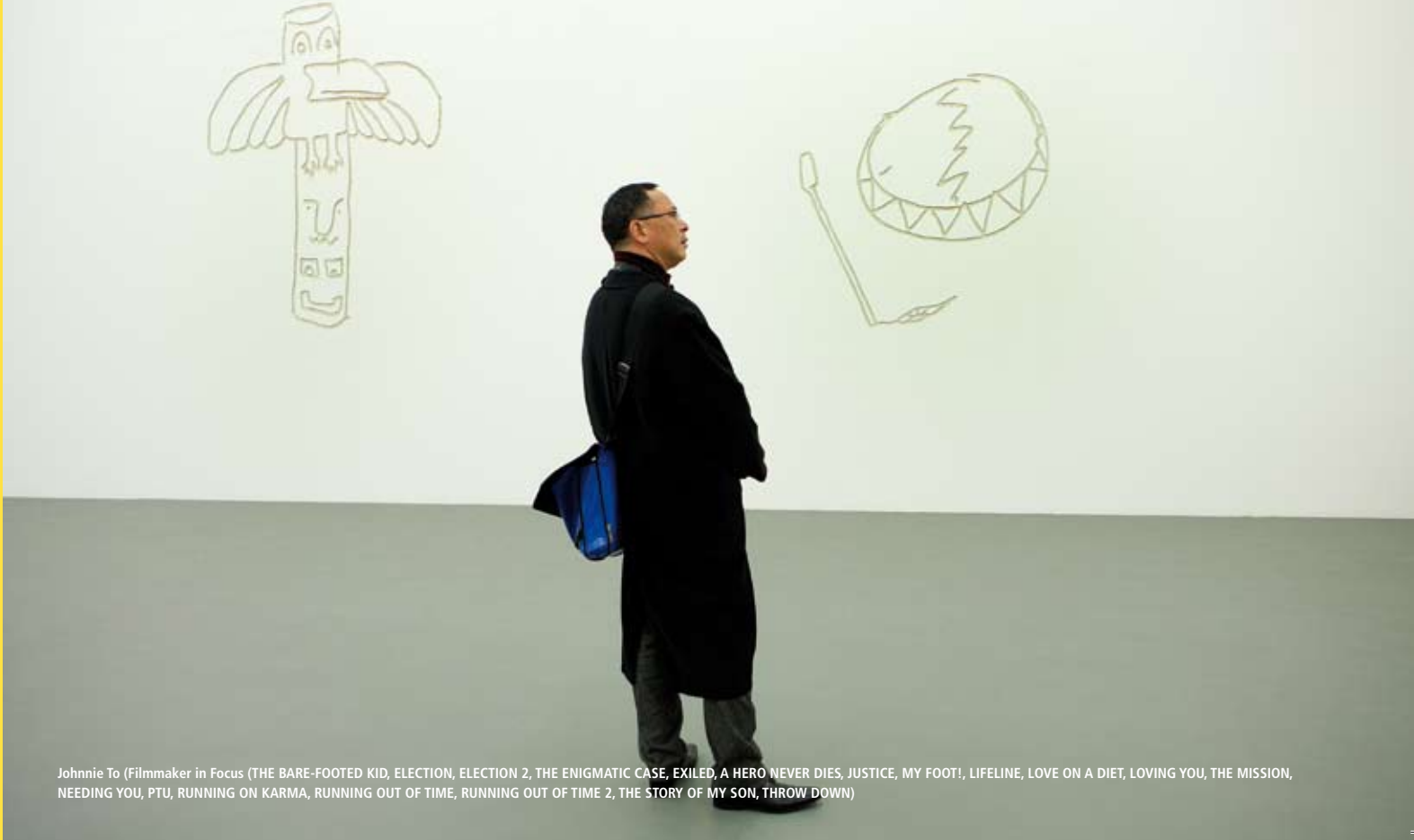
Johnnie To (Filmmaker in Focus (THE BARE-FOOTED KID, ELECTION, ELECTION 2, THE ENIGMATIC CASE, EXILED, A HERO NEVER DIES, JUSTICE, MY FOOT!, LIFELINE, LOVE ON A DIET, LOVING YOU, THE MISSION, NEEDING YOU, PTU, RUNNING ON KARMA, RUNNING OUT OF TIME, RUNNING OUT OF TIME 2, THE STORY OF MY SON, THROW DOWN))