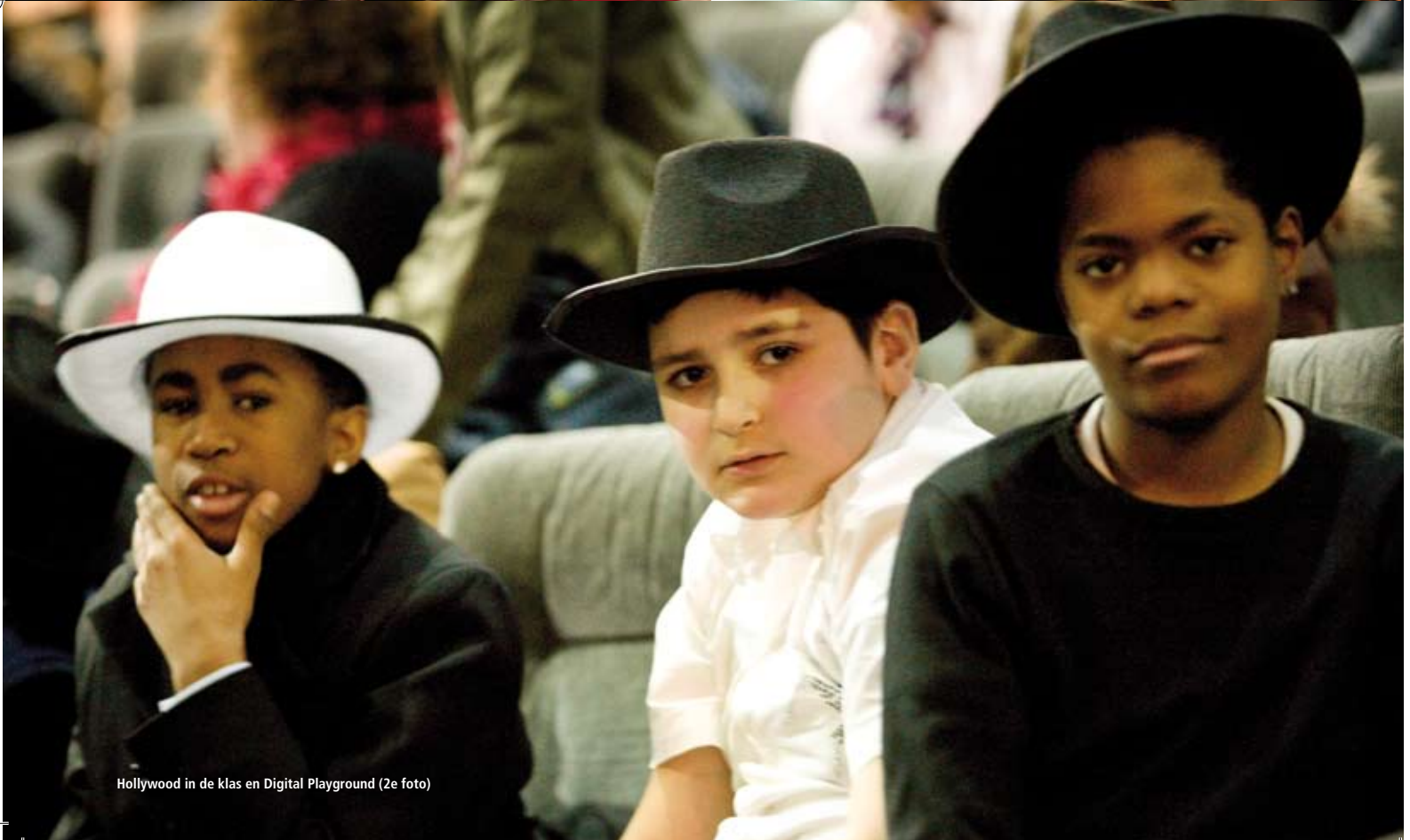
Hollywood in de klas en Digital Playground (2e foto)