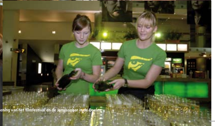
Robeco Film Café in de foyer van de Rotterdamse Schouwburg, Tiger Business Lounge (TBL) tijdens de opening van het filmfestival en de Jamesbar in de Doelen