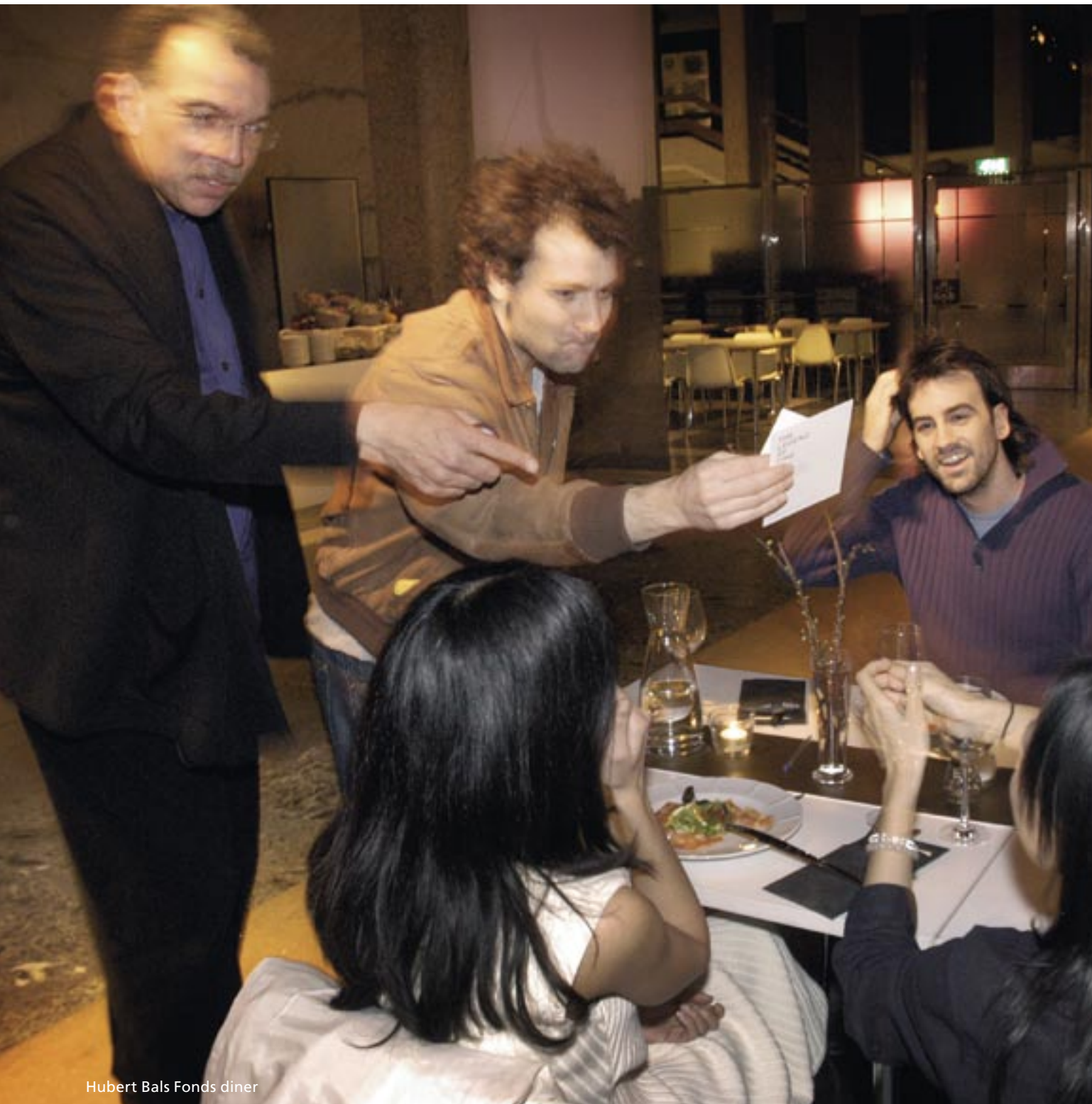
Hubert Bals Fonds diner