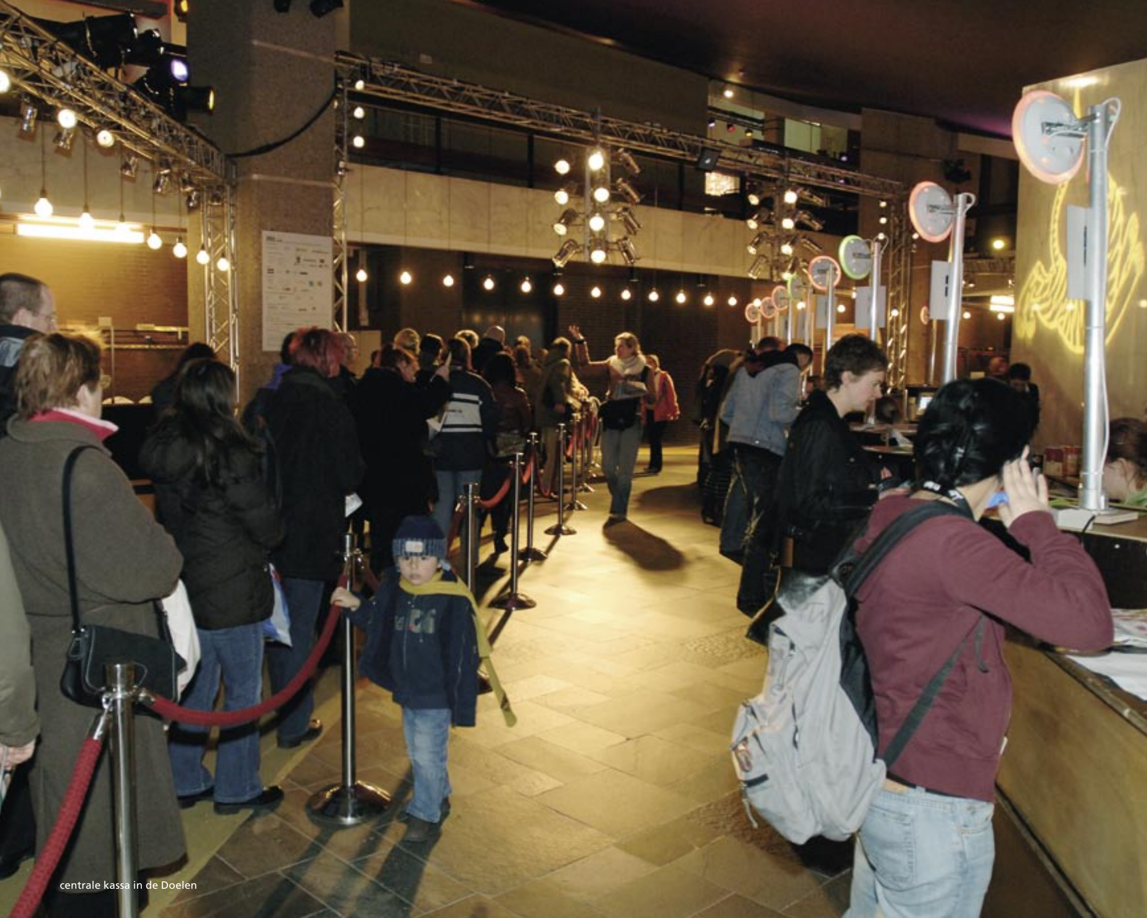
centrale kassa in de Doelen