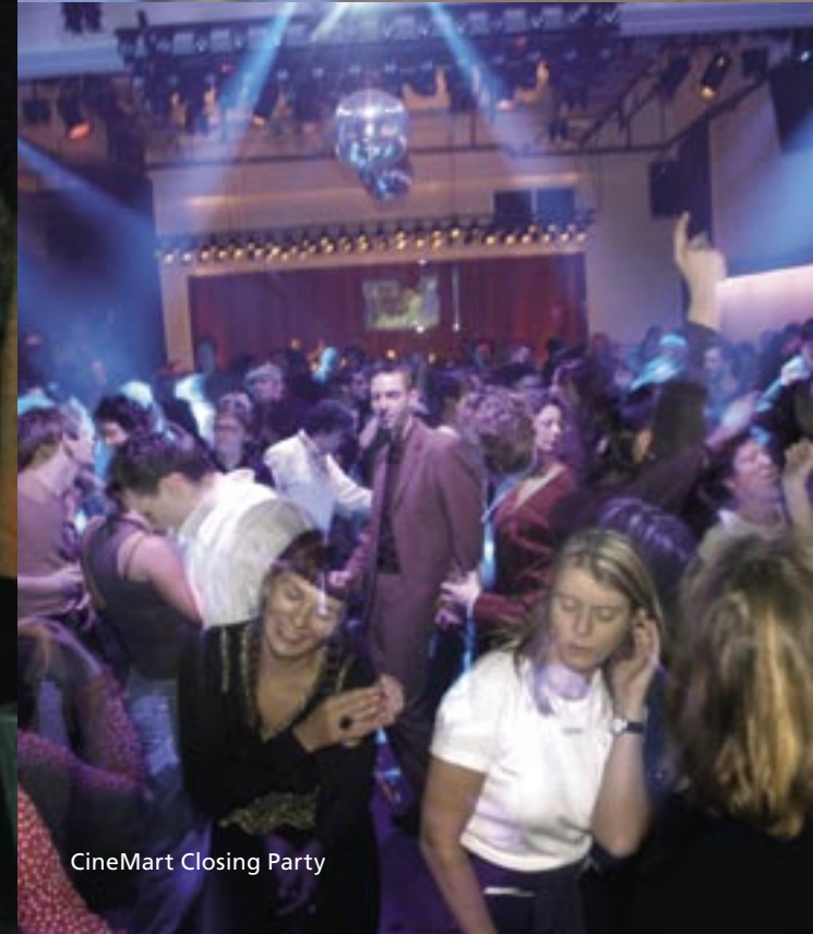
CineMart Closing Party