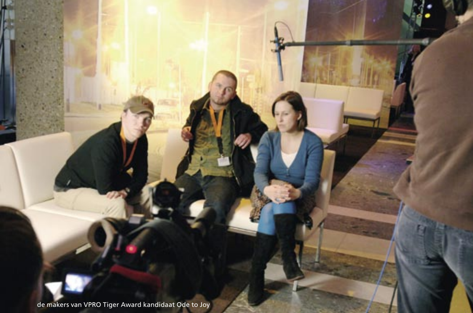
de makers van VPRO Tiger Award kandidaat Ode to Joy