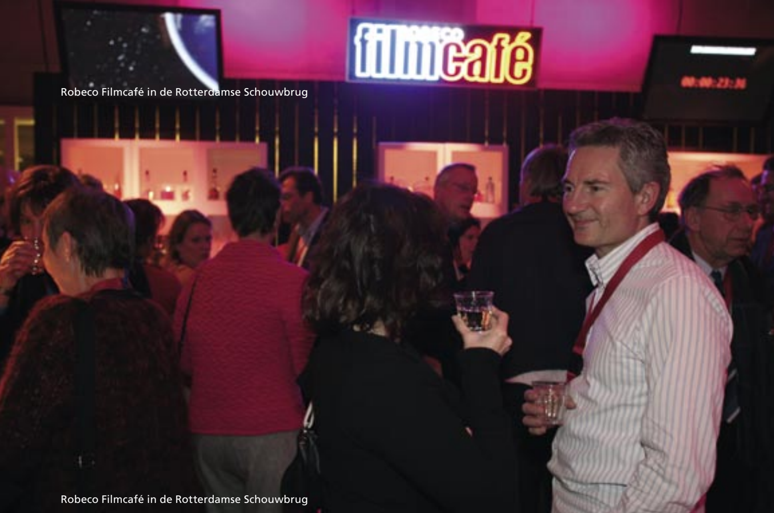
Robeco Filmcafé in de Rotterdamse Schouwbrug