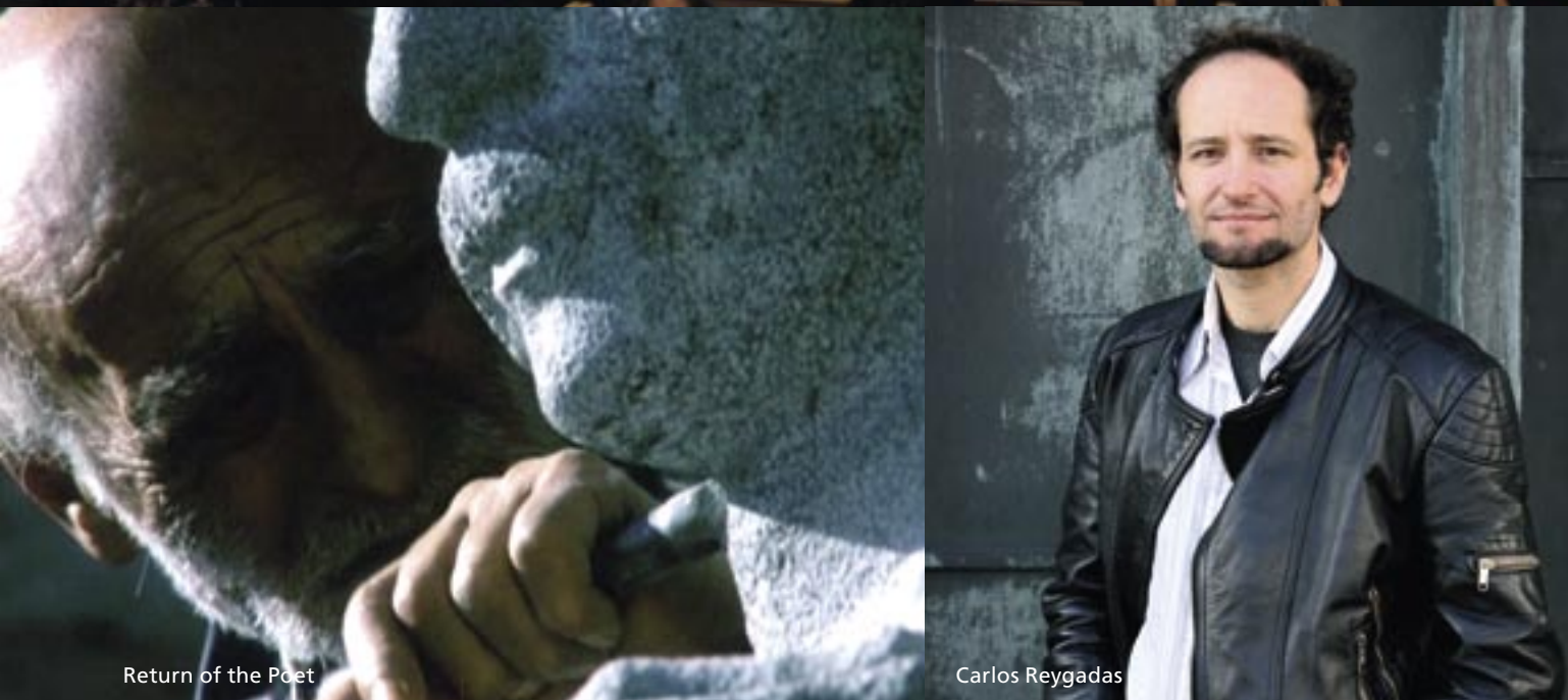
Return of the Poet