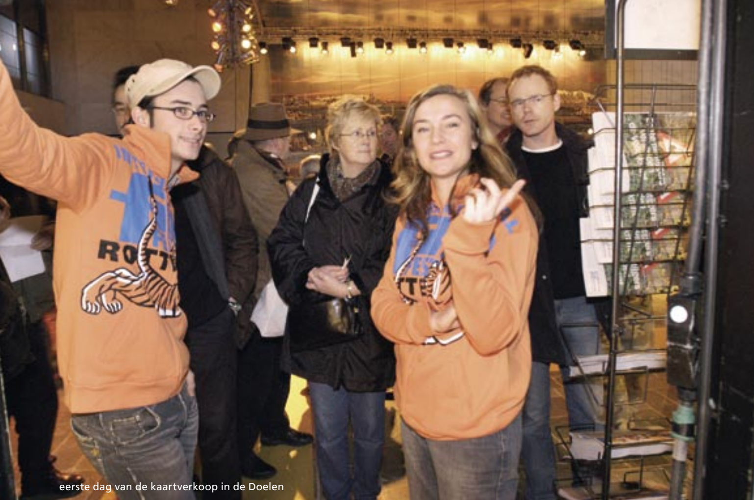
eerste dag van de kaartverkoop in de Doelen