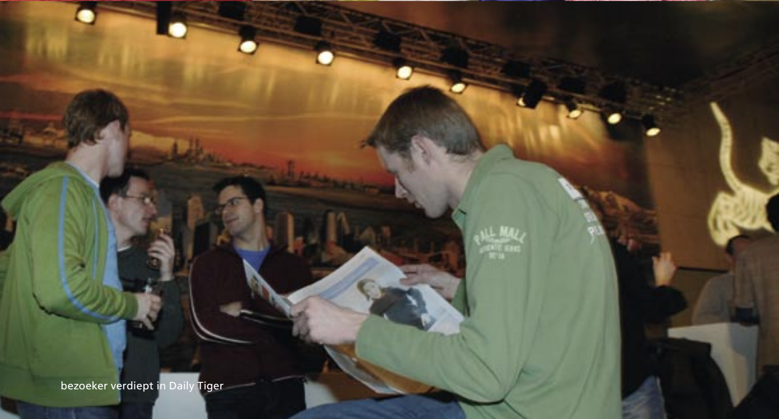
bezoeker verdiept in Daily Tiger