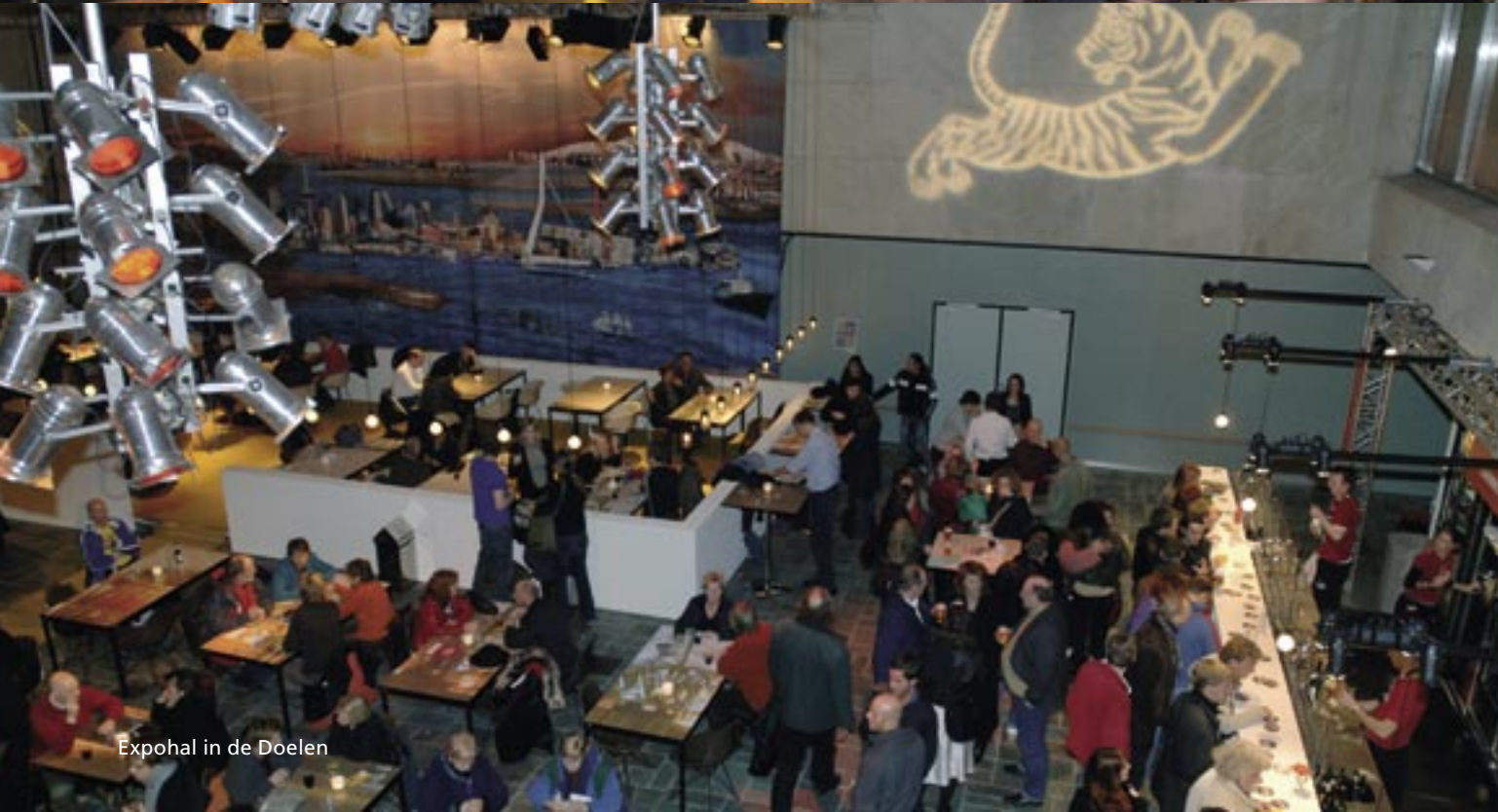
Expohal in de Doelen