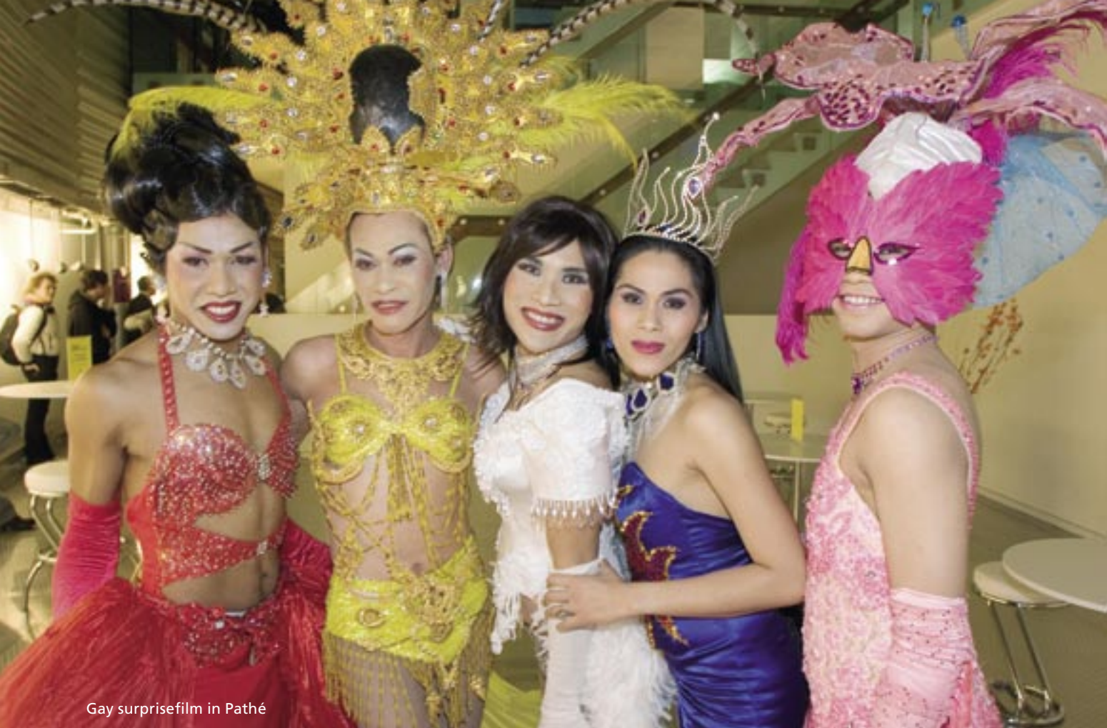
Gay surprisefilm in Pathé