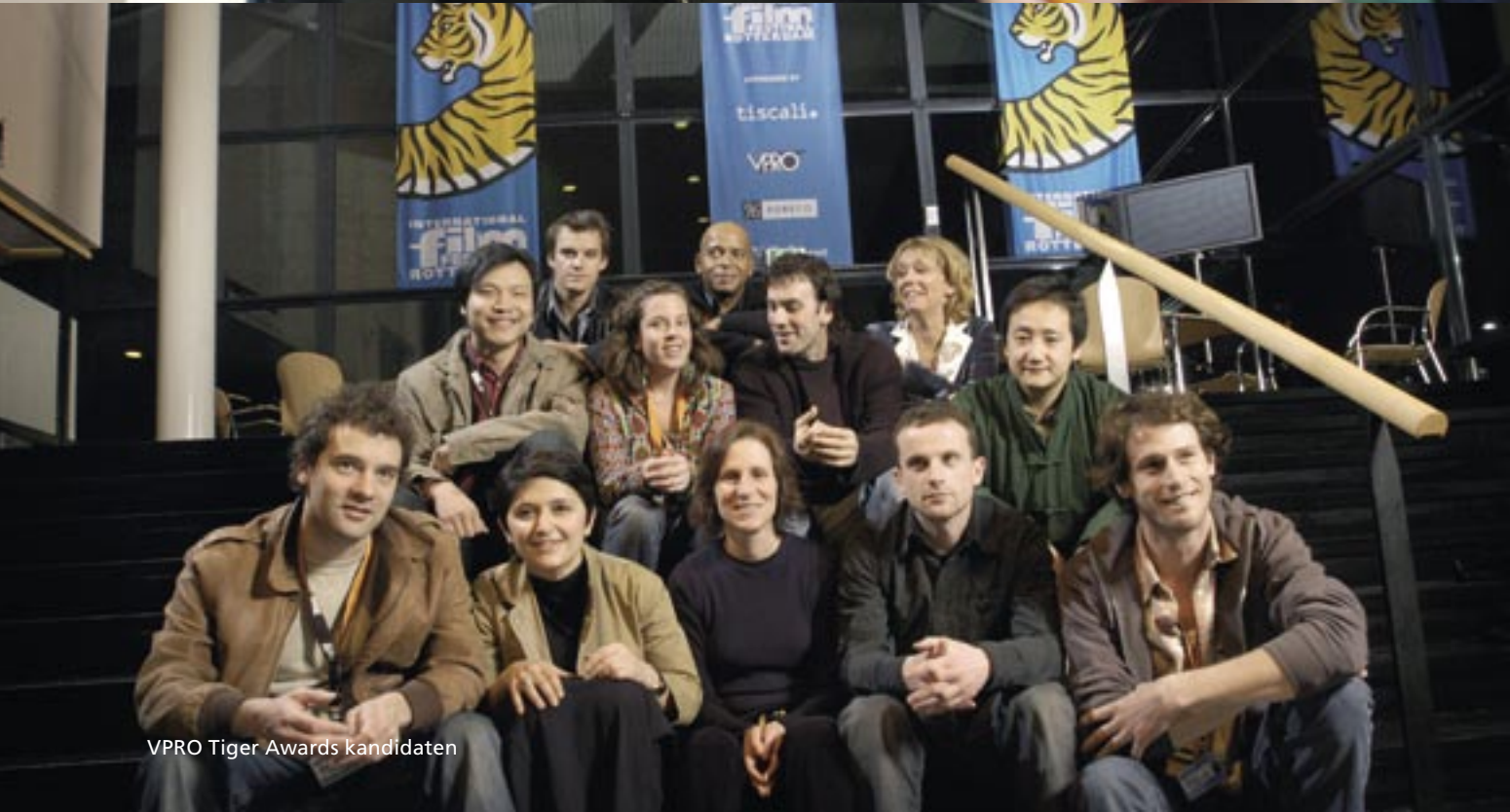
VPRO Tiger Awards kandidaten