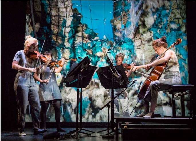
Black Angels Ragazze Quartet, 33 1/3