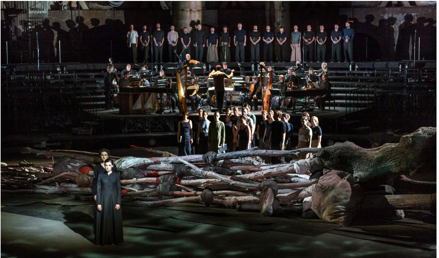
Mariavespers Claudio Monteverdi, De Nationale Opera

Rabobank Amsterdam droeg in 2017 als grootste bedrijfssponsor wederom bij aan de internationale programmering van het Holland Festival. De meerjarige samenwerking met Kempen kreeg opnieuw vorm in diverse ontvangsten. Clifford Chance maakte het als partner van HF Young ook dit festival mede mogelijk om deze community van bezoekers tussen 25 en 40 jaar verder te verdiepen en uit te breiden. Het Holland Festival verbond in 2017 met trots een aantal nieuwe corporate partners aan zich: Bruil, Garuda Indonesia, Ngage Media, Movares en Roseboom. Ook de doorlopende samenwerkingen met Westergasfabriek/Meyer Bergman, hotelpartner Casa, Automobielfabriek Van Vloten, Lloyd Hotel, Volkshotel en de bijdragen van de HF Businesspartners zijn voor het Holland Festival zeer belangrijk.