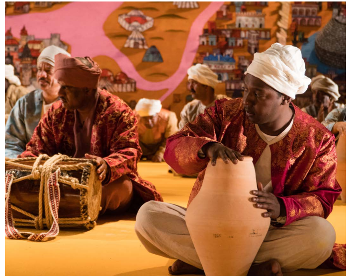
La Chanson de Roland Wael Shawky

Vanwege het intensieve contact met de zakelijk directeur gedurende dit jaar is geen apart gesprek gevoerd over haar functioneren. Ook heeft de raad dit jaar niet apart zijn eigen functioneren geëvalueerd. Beide zaken staan voor 2018 gepland.