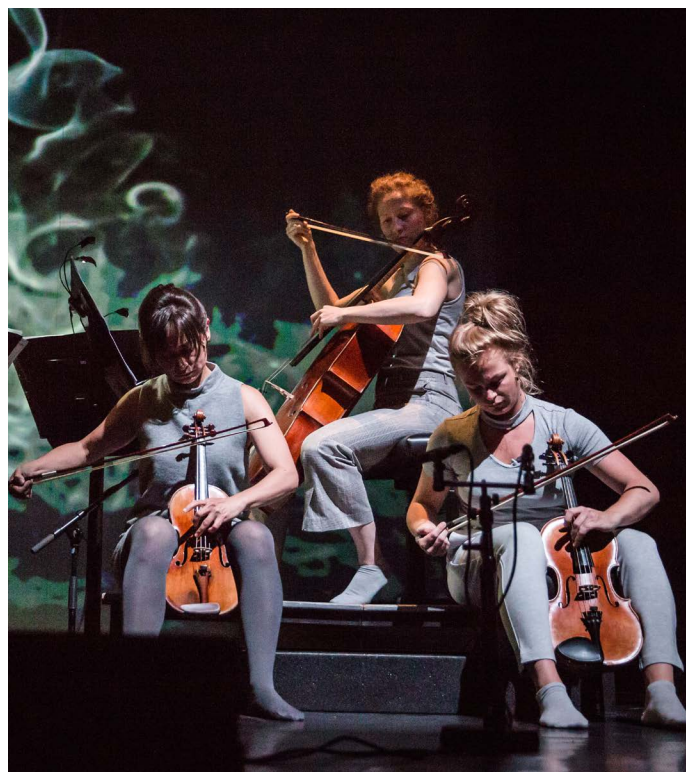
Black Angels Ragazze Quartet