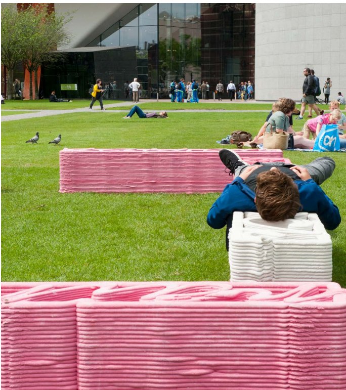
I'd Rather Be Outside àyr

Bij aanvang van dit boekjaar is het in 2016 resterende bedrag bestemmingsfonds OCW omgezet in een bestemmingsreserve restant subsidie OCW 2013-2016 van € 274.251. De raad van toezicht heeft op 27 september 2017 het besluit genomen om het geheel van deze reserve te onttrekken ter dekking voor gemaakte kosten Holland Festival Proms in 2017. Als gevolg van deze onttrekking resteert na verrekening met het tekort van € 359.400 een te verdelen negatief resultaat € 85.239 dat overeenkomstig de verhouding tussen subsidie OCW en alle overige inkomsten wordt verdeeld over bestemmingsfonds OCW 2017-2020 voor een bedrag van € 40.900 en de algemene reserve voor een bedrag van € 44.339. Omdat het Handboek Verantwoording Cultuursubsidies Instellingen 2017-2020 niet voorziet in de mogelijkheid tot het vormen van een negatief bestemmingsfonds OCW, wordt ter correctie op de resultaatverdeling een bedrag van € 40.900 toegevoegd aan het bestemmingsfonds OCW ten laste van de algemene reserve. Deze verdeling van het resultaat is nader verklaard in hoofdstuk 8.3 Toelichting op de balans per 31 december 2017.