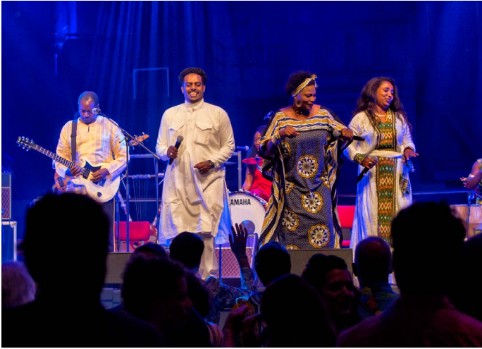
Holland Festival Proms: The Nile Project

Tijdens alle vergaderingen van de raad van toezicht zijn de financiën van het festival besproken. Bij deze vergaderingen werden de actuele financiële ontwikkelingen besproken en afgezet tegen de vastgestelde begroting, waarbij de verschillen werden toegelicht en hun effect op de toekomstige vermogensontwikkeling werd uiteengezet.