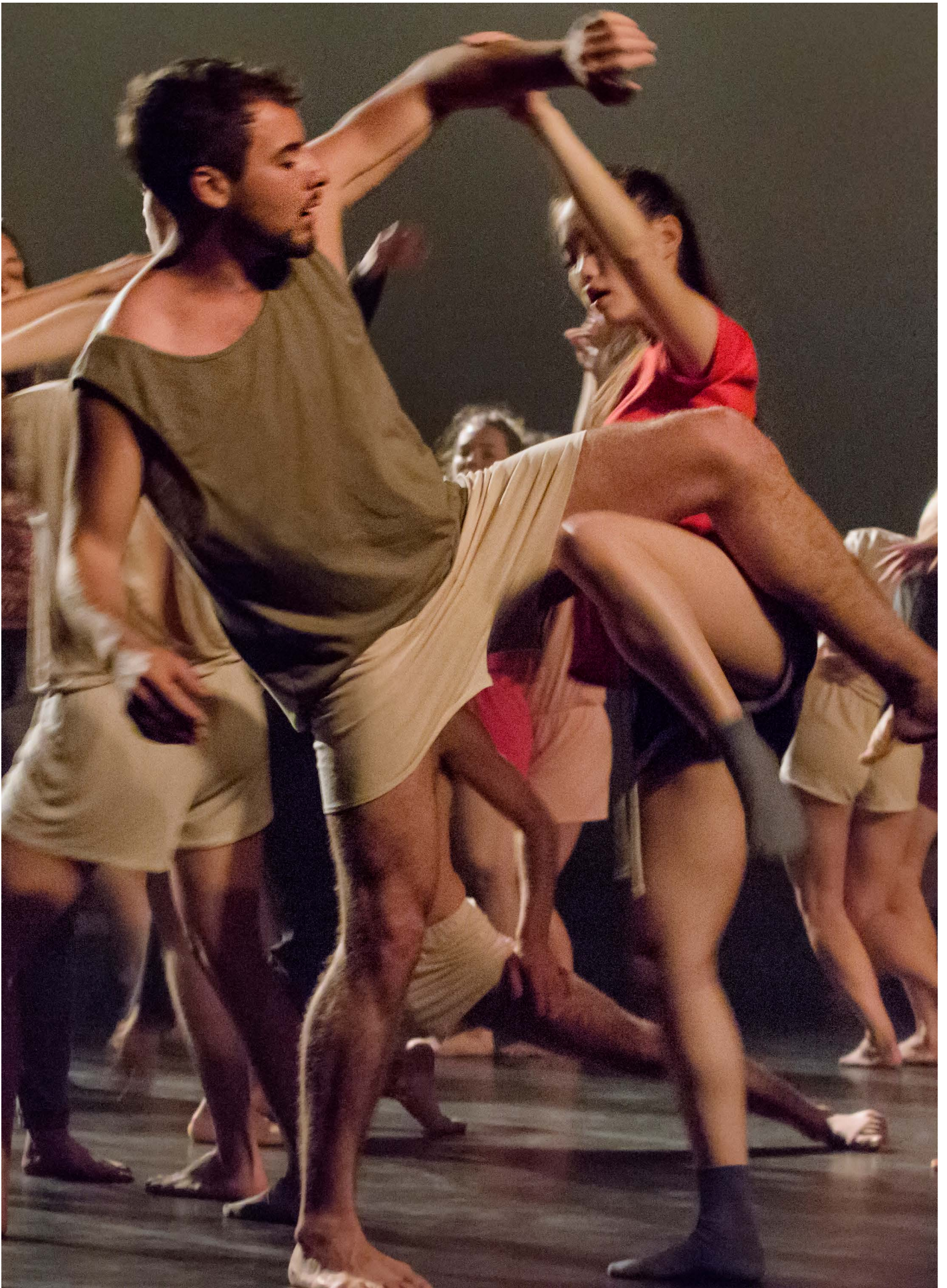
Rito de Primavera José Vidal