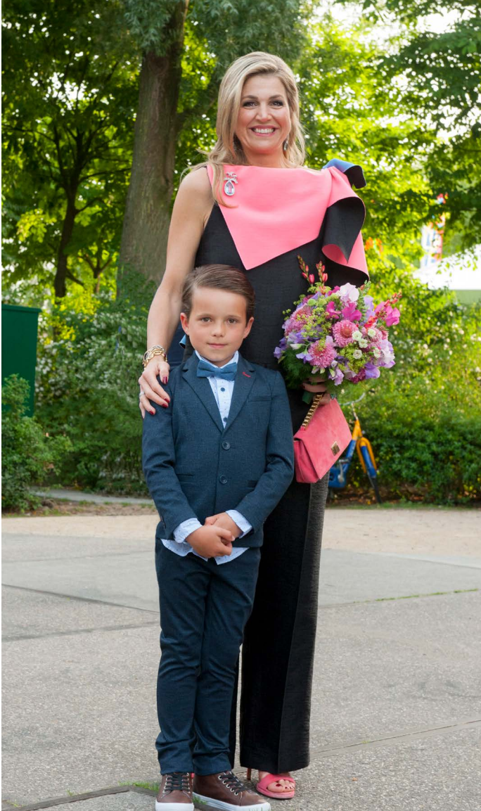
Koningin Máxima bij de opening van het Holland Festival

Op zaterdag 3 juni 2017 opende de zeventigste editie van het Holland Festival in aanwezigheid van Hare Majesteit Koningin Máxima met de voorstelling Mariavespers in de Gashouder. Het Holland Festival vierde zijn verjaardag met een stevige basis en een blik gericht op de toekomst, mede dankzij de betrokkenheid en steun van zijn partners.