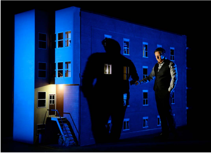
887 Robert Lepage