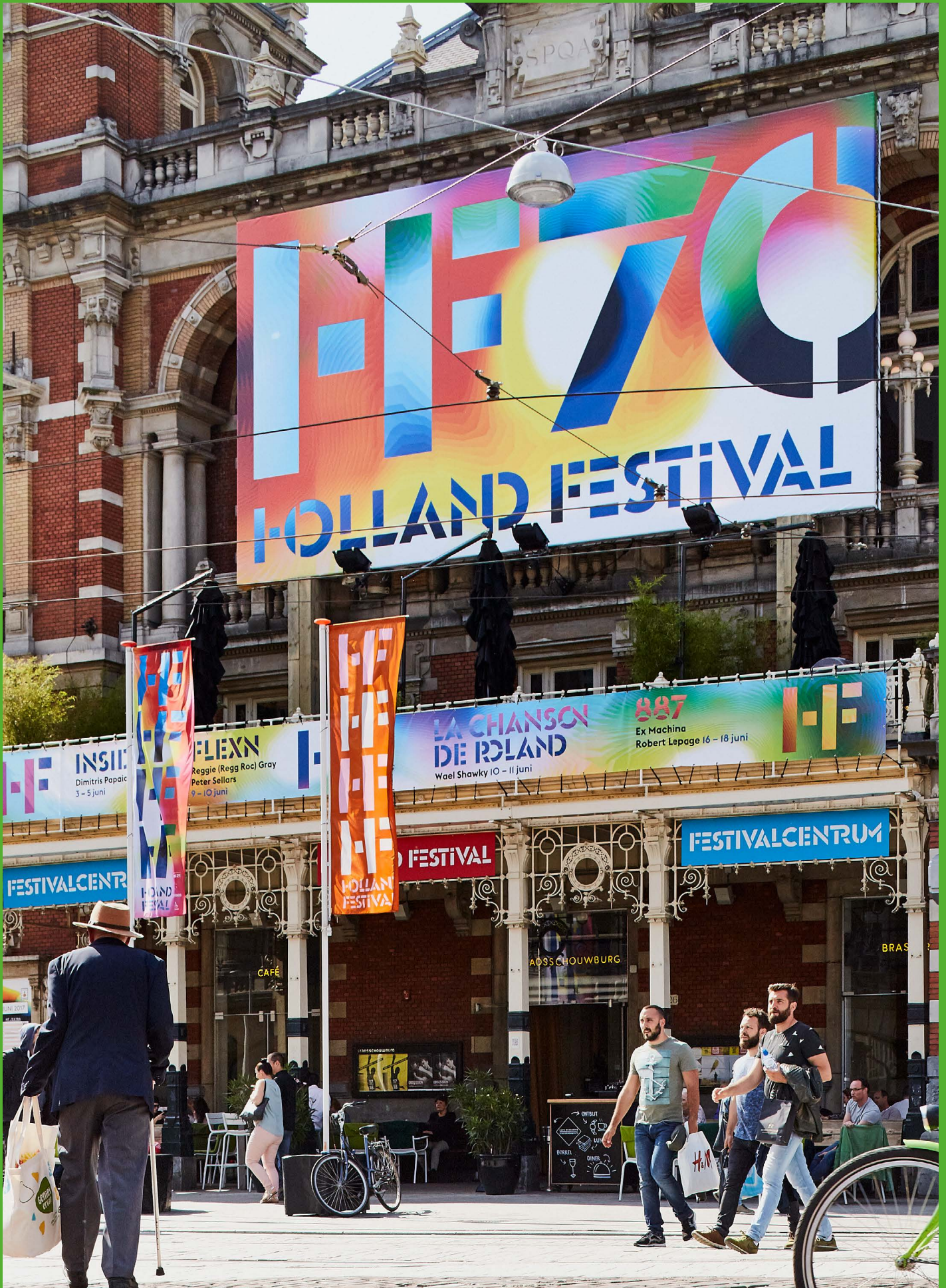
Stadsankleding - Stadschouwburg Amsterdam