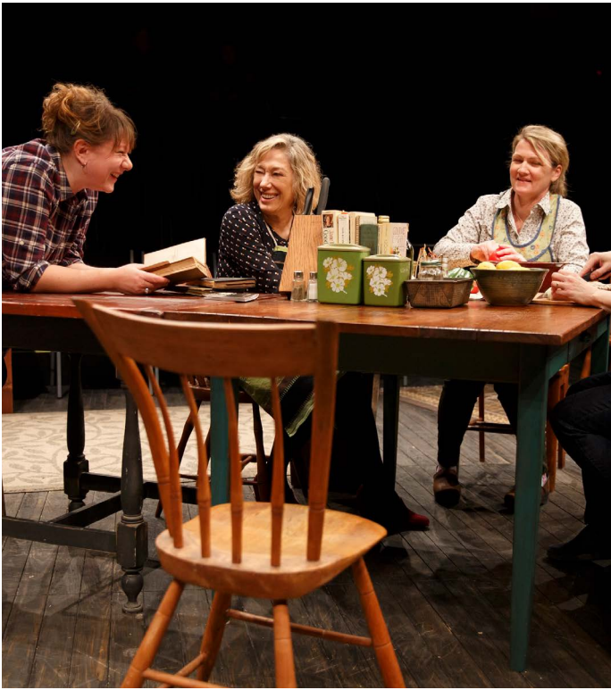
The Gabriels: Election Year in the Life of One Family The Public Theater