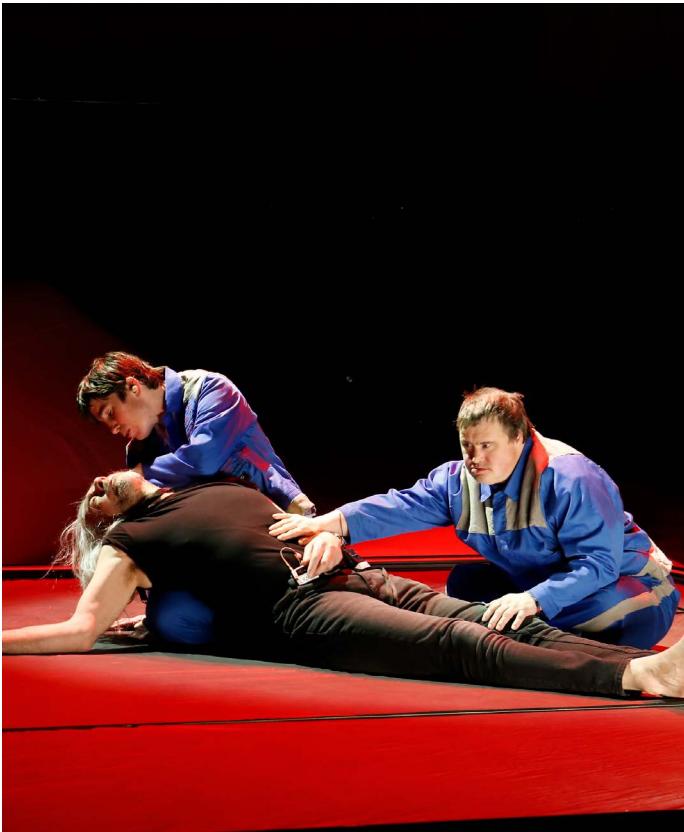
Lady Eats Apple Back to Back Theatre

professionele dansers van Studio West. Ook bezocht een delegatie van Shanghai Theatre Academy het festival. De gasten doorliepen hun eigen programma dat bestond uit voorstellingsbezoek in het festival, uitgebreide ontmoetingen met festivalkunstenaars en een bezoek aan de theaterafdeling van de Amsterdamse Hogeschool voor de Kunsten.