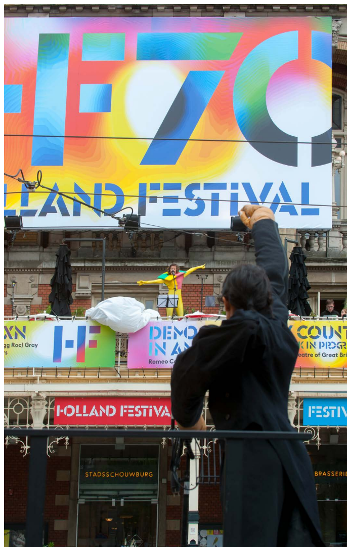
Lunchconcert studenten Koninklijk Conservatorium