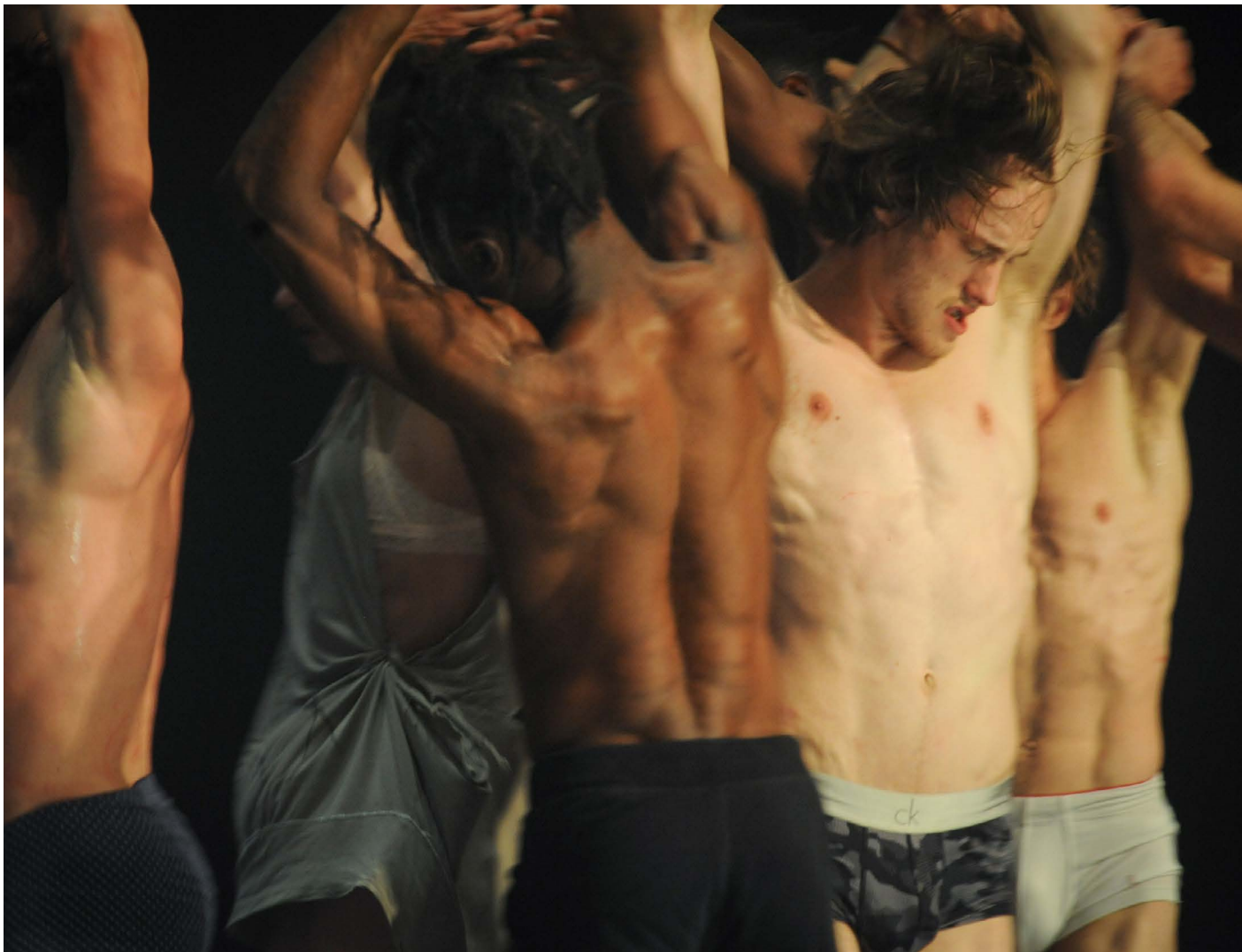
nicht schlafen Alain Platel, les Ballets C de la B

Hamburg City Council Culture Department, Irish Arts Council, Irish Ministry of Culture en Freelands Foundation. In Groot-Brittannië bekleedt zij de volgende nevenfuncties: voorzitter Improbable Board, bestuurslid Cass Foundation en National Campaign for the Arts en lid van de Tate Modern Advisory Council.