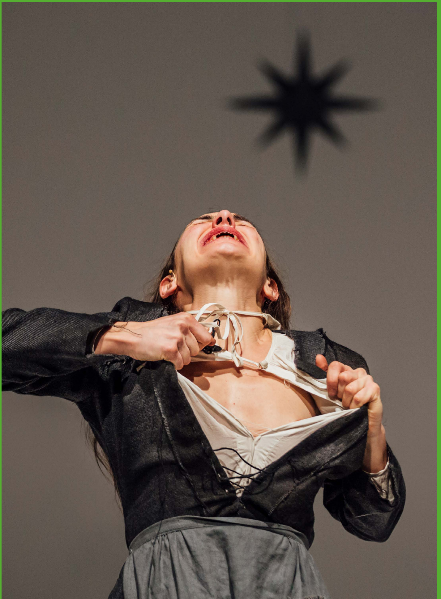
Democracy in America Romeo Castellucci