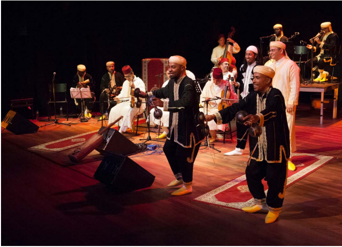
Safar Nord-Sud Gnawa Oulad Sidi Ensemble & Amsterdams Andalusisch Orkest