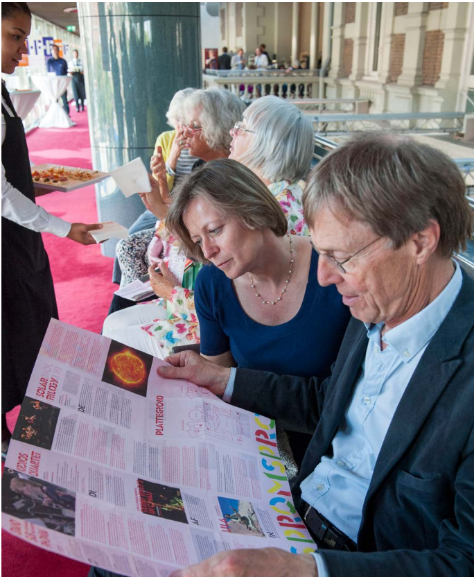
Vriendenontvangst tijdens Holland Festival Proms