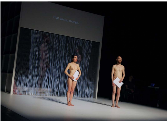
Privacy De Warme Winkel

Voor het tijdvak 2013-2016 is door het ministerie van OCW aan het Holland Festival oorspronkelijk een subsidiebedrag van € 12.641.436 toegekend. Door loon- en prijscorrecties is dat bedrag gedurende dit tijdvak opgelopen tot € 12.757.940. Het subsidietijdvak begon op 1 januari 2013 met een post bestemmingsfonds OCW 2009-2012 ten bedrage van € 292.343, die in datzelfde jaar is omgezet in een post bestemmingsreserve restant subsidie OCW 2009-2012. De bestemmingsreserve is overeenkomstig de voorwaarden ten dele aangewend in 2014 voor een bedrag van € 179.919 en vervolgens is het restantbedrag van € 112.494 aangewend voor het jaar 2016, zoals uiteengezet in: 9.3 Toelichting op de balans per 31 december 2016. Ook dit tijdvak eindigt met een post bestemmingsfonds OCW 2013-2016. Dit is € 18.092 lager uitgekomen dan in het vorige subsidietijdvak en geëindigd op een stand van € 275.377.