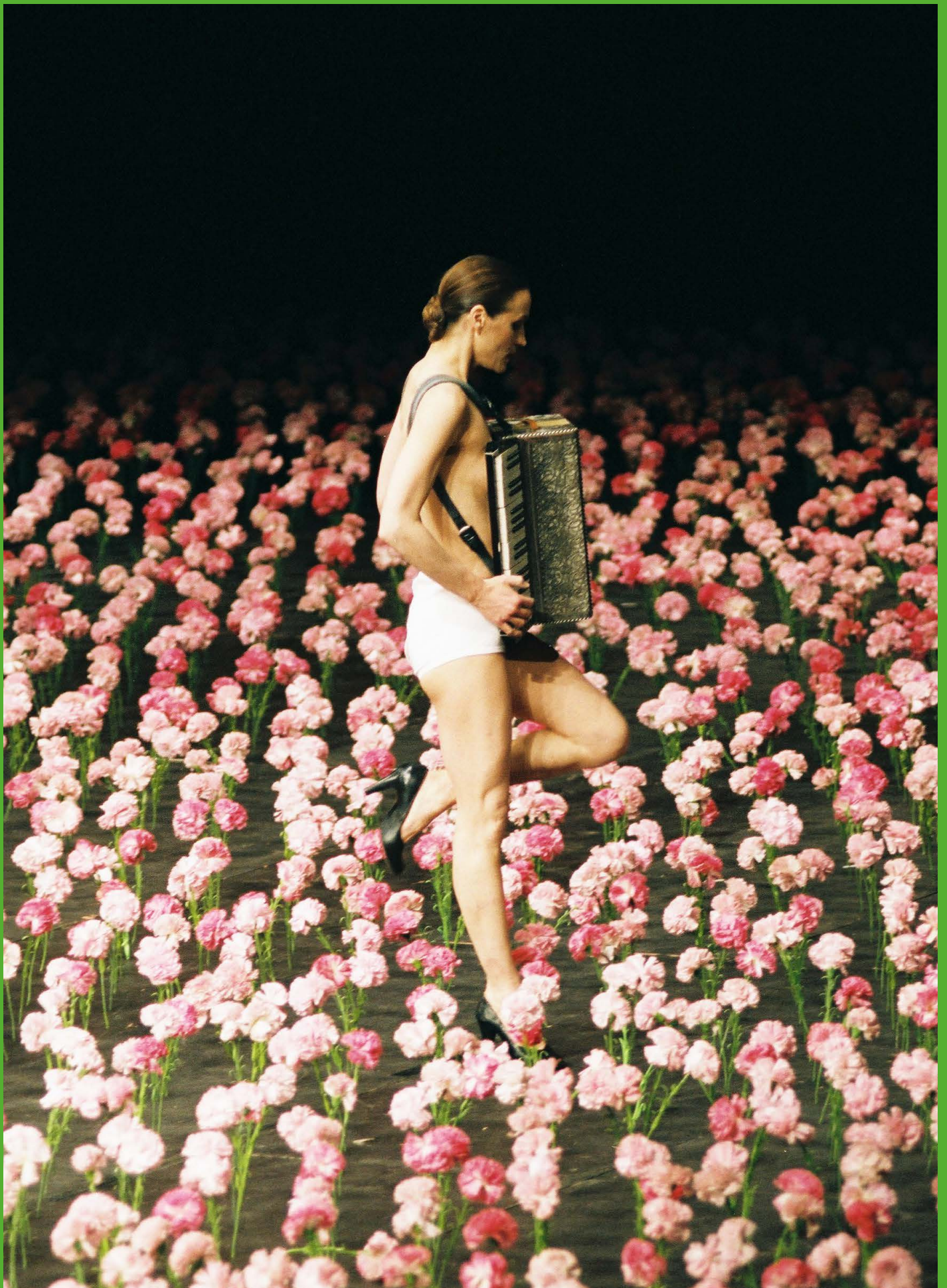
Nelken Tanztheater Wuppertal, Pina Bausch