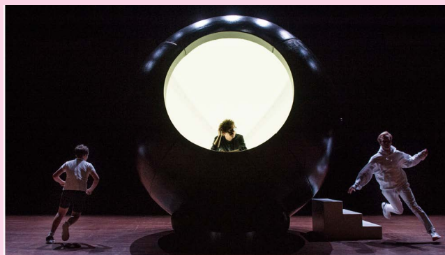
The Future of Sex Wunderbaum

In de afgelopen vier jaar kon het Holland Festival met betrekking tot educatie en participatie deels bouwen op eerdere ervaringen en deels nieuwe richtingen uitproberen. De activiteiten die jaarlijks georganiseerd worden voor een breed publiek én de activiteiten specifiek voor en in samenspraak met de kunstvakopleidingen, hebben inmiddels een stevige inbedding en worden zeer gewaardeerd. De contacten met festivalkunstenaars en de kennisoverdracht vanuit de bron, staan garant voor unieke momenten in de beleving van het publiek en de ontwikkeling van jonge kunstenaars. Met universiteiten die een opleiding Kunst en Beleid, Theaterwetenschap, Muziekwetenschap of vergelijkbaar aanbieden (Rijksuniversiteit Groningen, Universiteit Utrecht, Universiteit van Amsterdam), werkt het festival samen op het gebied van seminars, colleges en werkgroepen gerelateerd aan werk in het festival. Zo vond in 2013 een muziektheater-driedaagse plaats (samenwerking met Theatre and Performance Studies van de Universiteit van Amsterdam), waar twintig Britse en Duitse studenten voor naar Amsterdam kwamen. In 2014 was er een symposium in het kader van het grote Luigi Nono-project en in 2015 De kunst van het luisteren met Olga Neuwirth.