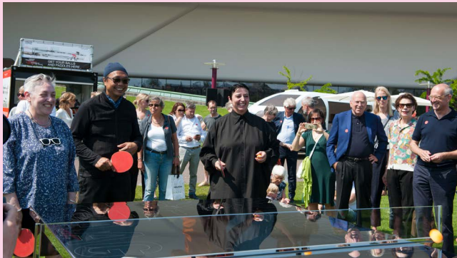
Tomorrow is the Question Rirkrit Tiravanija

Het Holland Festival sloot in 2016 een kunstenplanperiode af. De doelen die op het gebied van development voor de periode 2013-2016 waren geformuleerd, zijn soms boven verwachting gerealiseerd en soms te ambitieus gebleken. Het Holland Festival was in de afgelopen jaren opnieuw succesvol in het werven van nieuwe inkomsten, het vasthouden van bestaande steun en het cultiveren van vele nieuwe contacten. Tegelijkertijd bleef het moeilijk om te voorspellen hoe private inkomstenbronnen zich bewegen. Diverse factoren beïnvloeden de geldgever. Het festival heeft niet op al die factoren (evenveel) invloed.