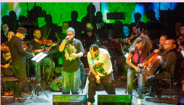
The Orchestra of Syrian Musicians with Damon Albarn and guests

Tijdens het nu afgesloten subsidietijdvak werden bij het ministerie van OCW en de gemeente Amsterdam bezuinigingen op het kunst- en cultuurbudget ingevoerd. De jaarlijkse structurele subsidie van Holland Festival nam af met € 288.000. Holland Festival heeft deze bezuinigingen opgevangen door intensivering van de fondsenwerving, waardoor de 'output' van het Holland Festival qua omvang, aantallen producties en voorstellingen, op nagenoeg vergelijkbare voet