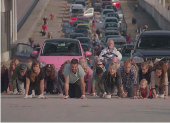
Stop Acting Now – extended edition Wunderbaum