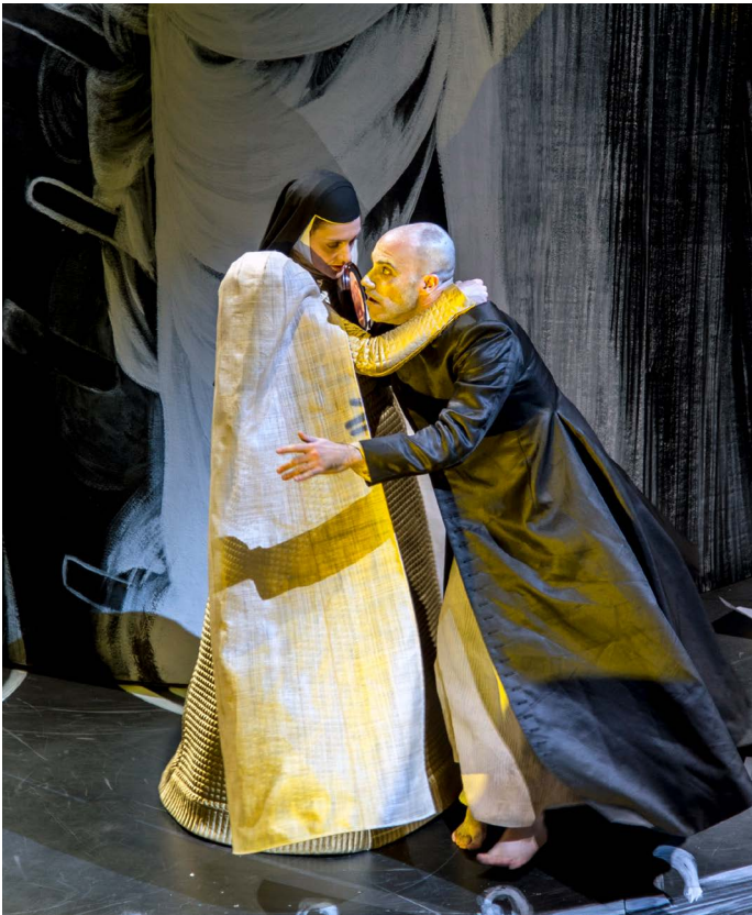
Theatre of the world De Nationale Opera

het bestemmingsfonds OCW, staat niet vrij ter beschikking van Holland Festival en bedraagt na de verdeling van het resultaat € 274.251. Of en hoe deze post in de nabije toekomst kan worden aangewend is afhankelijk van besluitvorming van het ministerie van OCW. Deze besluitvorming zal gebaseerd zijn op interne beleidsvoornemens van het ministerie van OCW omtrent het bestemmingsfonds OCW en de beoordeling van de prestaties van het Holland Festival over de nu afgelopen subsidieperiode 2013-2016 in relatie tot het goedgekeurde beleidsplan 2013-2016 van Holland Festival. Het vrij beschikbaar deel van het eigen vermogen is verdeeld in een doelvermogen, de continuïteitsreserve, met een ongewijzigde omvang van € 300.000 en een vrij beschikbaar vermogen, de algemene reserve, dat na de verdeling van het resultaat van 2016 is uitgekomen op € 388.942. De continuïteitsreserve is gevormd in 2008 en is toen vastgesteld op € 100.000. In 2014 is besloten om deze reserve te vergoten tot € 300.000. Met dit doelvermogen wordt dekking gegeven aan vorderingen op gerealiseerde maar nog niet ontvangen subsidies en bijdragen van fondsen en op vooruitbetaalde kosten ten behoeve van toekomstige producties.