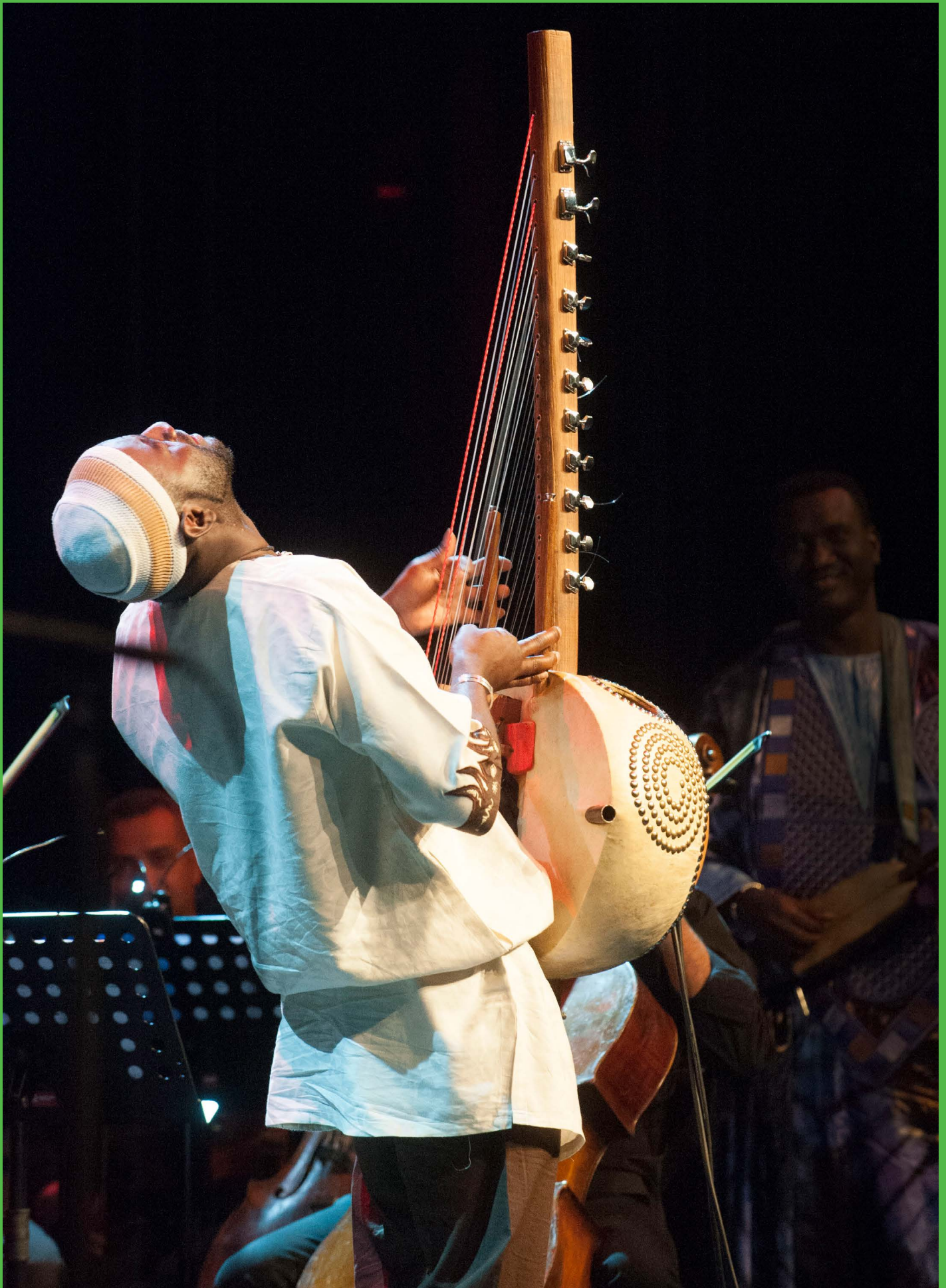
The Orchestra of Syrian Musicians with Damon Albarn and guests