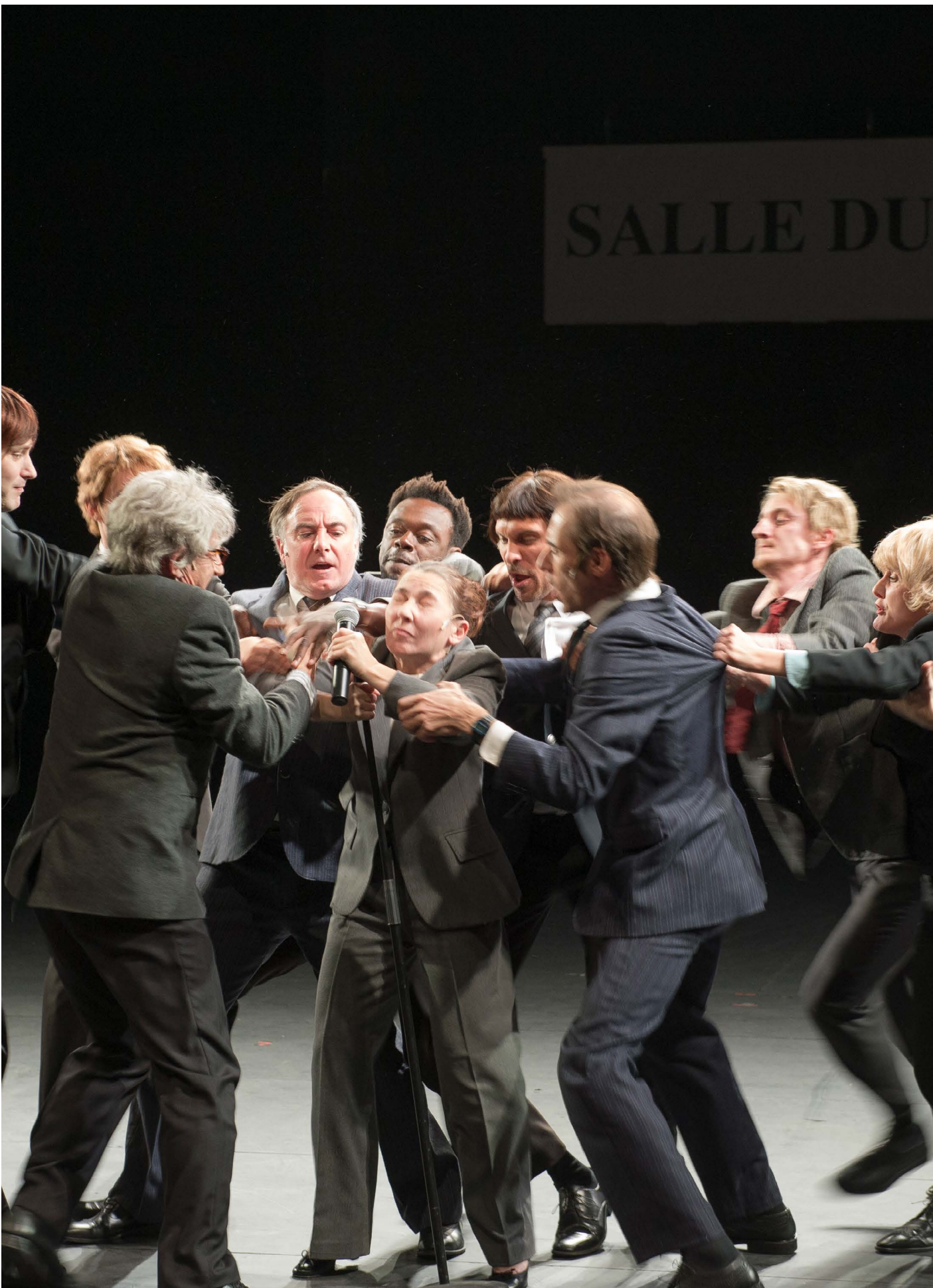
Ça ira (I) Fin de Louis Joël Pommerat, Compagnie Louis Brouillard