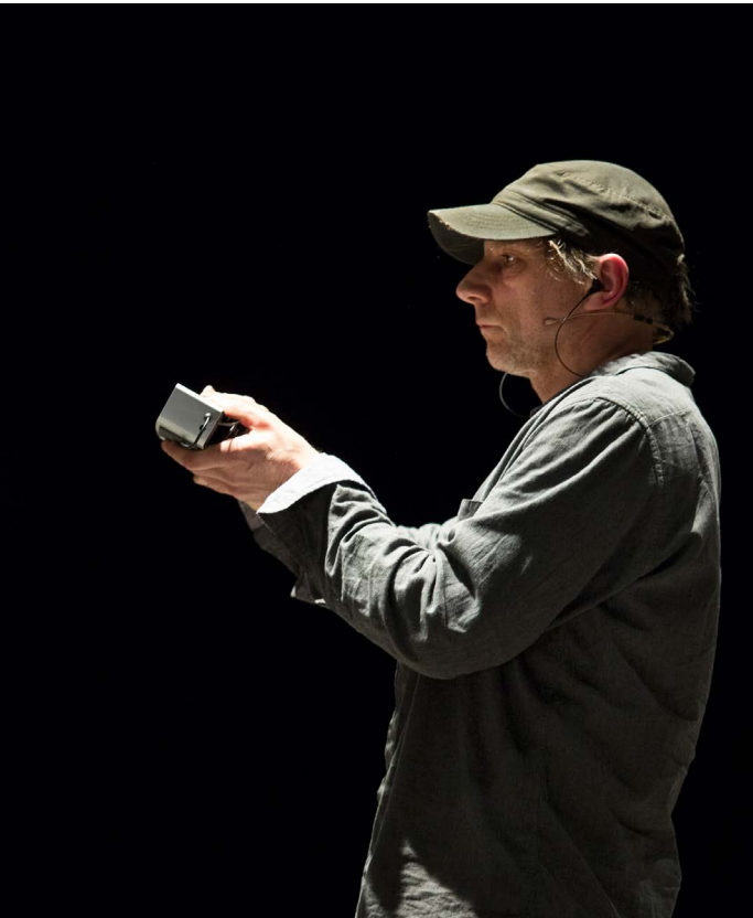
The Encounter Complicite / Simon McBurney

tra of Syrian Musicians. Ze traden op in Carré met een keur aan internationale gastartiesten: Paul Weller, Noura Mint Seymali, Bassekou Kouyaté, Bu Kolthoum, Eslam Jawaad, Faia Younan, Malikah, Mounir Troudi, Rachid Taha en natuurlijk Albarn zelf. In het publiek zaten ook circa vierhonderd uitgenodigde asielzoekers uit verschillende COA-locaties.