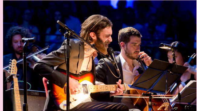
Keaton Henson & Amsterdam Sinfonietta

In de periode 2013-2016 maakte de communicatie en marketingafdeling een grote ontwikkeling door. Door de wisseling van artistiek directeur werd er een nieuwe huisstijl gelanceerd, conform de traditie van het Holland Festival. In het beleidsplan voor deze periode werd de ambitie geformuleerd om meer digitaal te gaan werken en langzaam print te vervangen door digitale uitingen. Dit resulteerde in een totale aanpassing van de website, de introductie van de Holland Festival-app en het opzetten van Adwordcampagnes, waarvoor het Google Grantsprogramma werd gebruikt. De uitklapfolder verdween en de decembaanbieding werd steeds meer gedigitaliseerd.