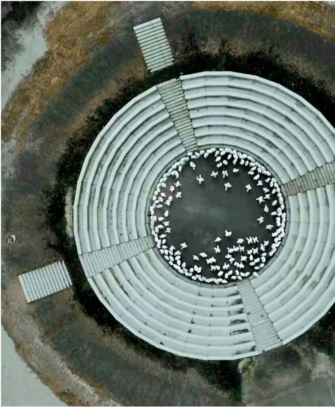
Die Schöpfung Joseph Haydn, René Jacobs, Collegium Vocale Gent, B'rock Orchestra, Julian Rosefeldt

voorstellingen, concerten of thema's uit het festivalprogramma. Er werd een samenwerking aangegaan met Het Kersjes Fonds.