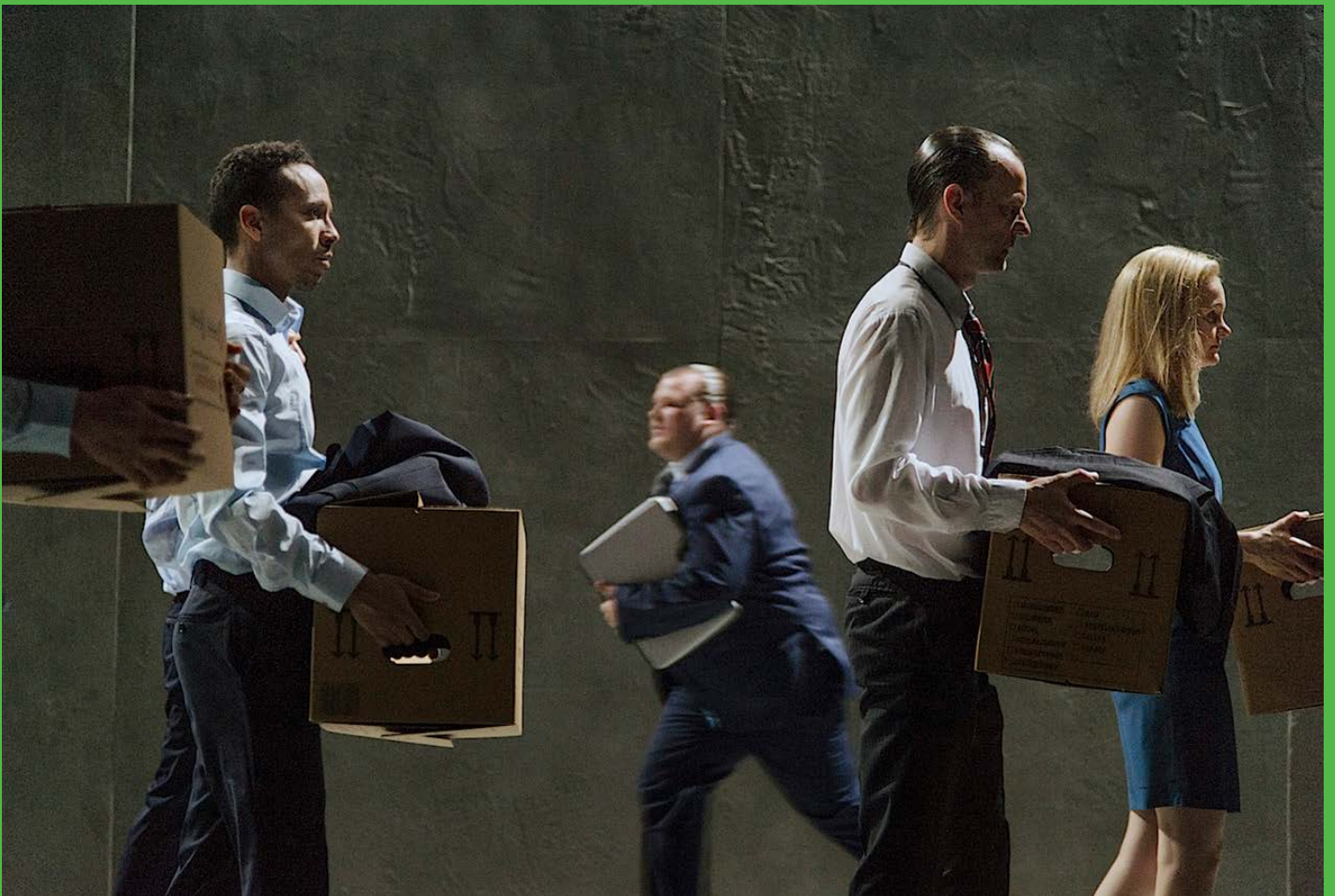
Die Stunde da wir nichts voneinander wußten Peter Handke, Thalia Theater