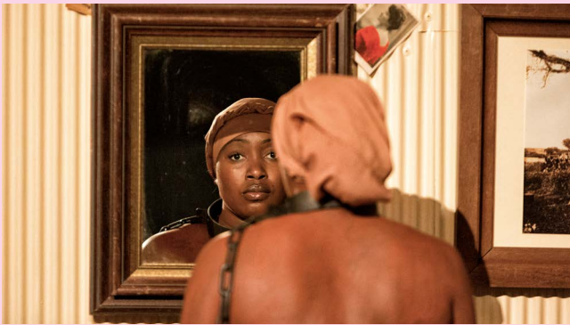
Exhibit B Brett Bailey, Third World Bunfight

Het festival vindt het belangrijk om jonge kunstenaars, kunstvakstudenten en midcareer kunstenaars te ondersteunen op hun weg naar excellentie. Zoals beschreven functioneert het festival als internationaal platform voor de midcareer makers. Kunstvakstudenten krijgen activiteiten aangeboden die de aankomende professionals ondersteunen en stimuleren in hun ontwikkeling. Door de verbindingen die daarvoor worden aangegaan, wortelt het festival in Amsterdam, neemt het zijn verantwoordelijkheid voor het lokale (kunst)klimaat en verlaagt het de drempel die de internationale uitstraling van het festival soms met zich meebrengt. De mogelijkheid om als performer deel te nemen in projecten zoals in de Holland Festival Proms of de lunchconcerten, of aan een project als Exhibit B (2013) verruimt de blik van de studenten en jonge makers en zorgt voor internationale kennisoverdracht en nieuwe verbindingen.