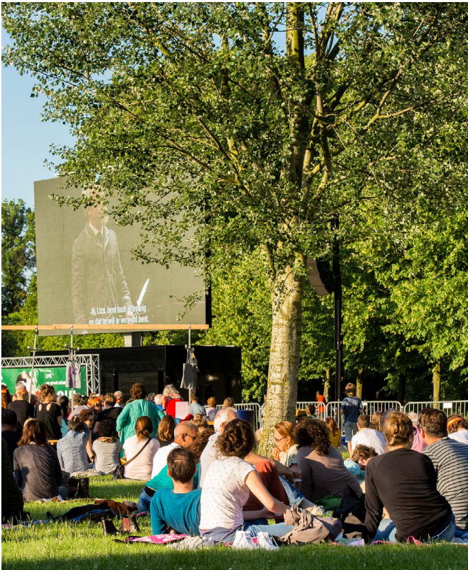
Opera in het park: Pique dame

ten. De Stadsschouwburg werd dé plek om af te spreken, na de voorstellingen door te praten en meer over het festival te weten te komen. De hele begane grond inclusief café Stanislavski kreeg een Holland Festivalaankleding, inclusief een festivalmenu in het restaurant. Op zondagmiddagen speelde de huisband (Zapp 4, Guus Janssen) en na de voorstellingen draaiden dj's.