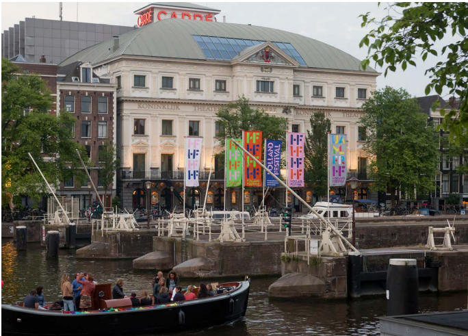
Koninklijk Theater Carré

Tijdens alle vergaderingen van de raad van toezicht zijn de financiën van het festival besproken. Bij deze vergaderingen werden de actuele financiële ontwikkelingen afgezet tegen de vastgestelde begroting, waarbij de verschillen werden toegelicht en het effect op de toekomstige vermogensontwikkeling uiteen werd gezet.