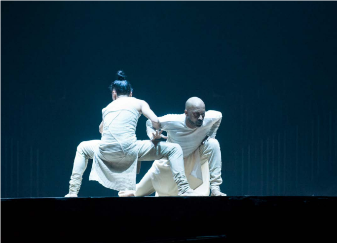
Until the Lions Akram Khan Company