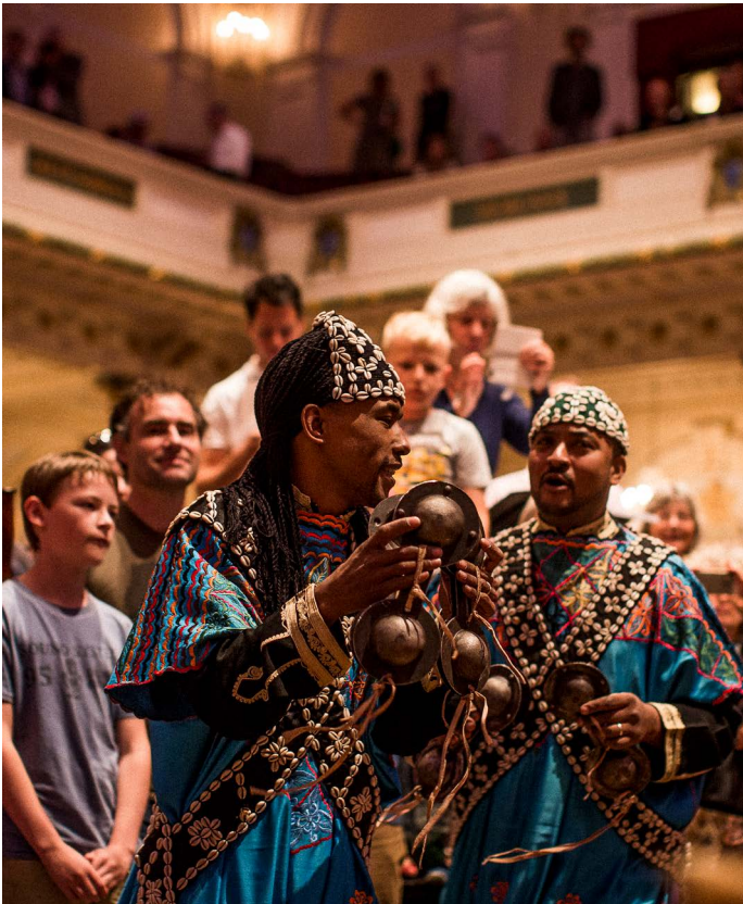
Holland Festival Proms: Lila Gnawa Oulad Sidi Ensemble